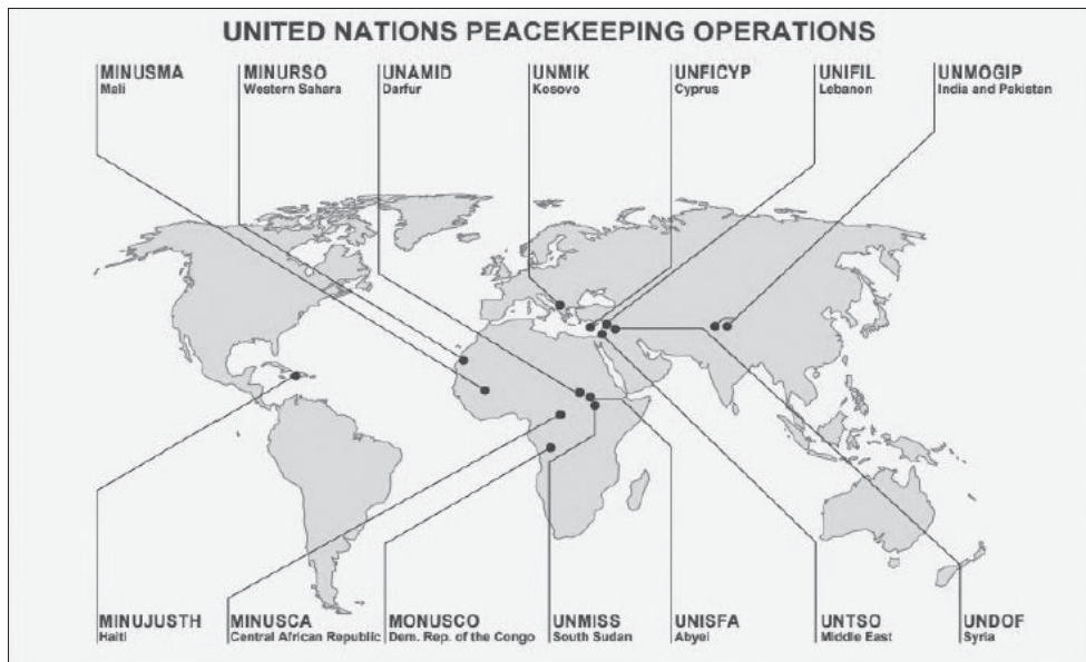
3. ábra Az ENSZ békeműveletei 2018 novemberében 41

szerint az ENSZ-békefenntartás nyolcszor hatékonyabb, mintha ezekre a feladatokra az Amerikai Egyesült Államok saját katonai erőit alkalmazná. 42