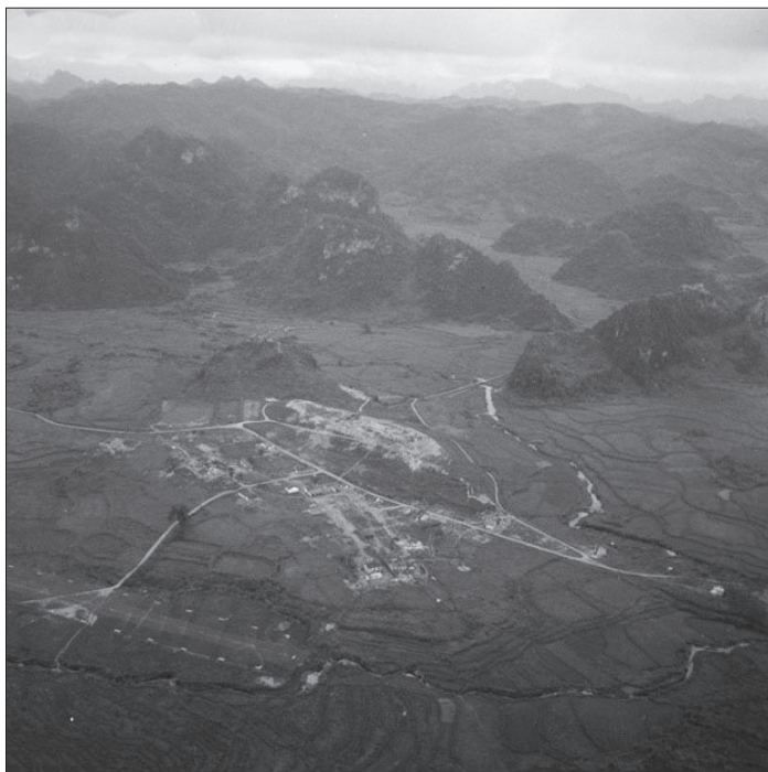
1. kép Dong Khé a levegőből, középen a citadella 21

át a 30 kilométerre lévő Cao Bangig – a völgy birtoklása tehát egyet jelentett a hágó feletti uralom megszerzésével is, amely a kínai határ lezárásának kulcsát jelentő erődhöz vezető egyetlen szárazföldi út volt.