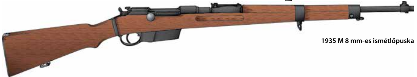
1935 M 8 mm-es ismétlőpuska