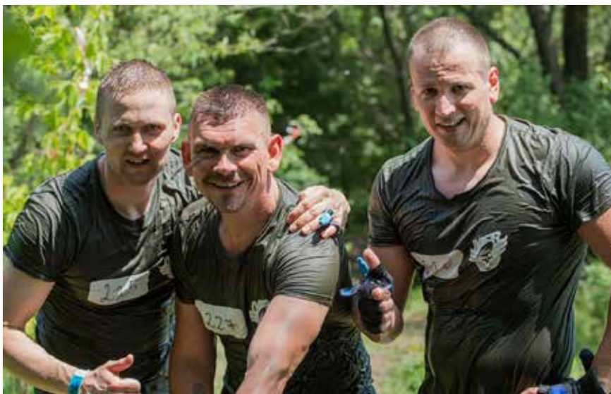
A pápai katonák az idén csapatban vágta neki a távnak

– A mostani csapatársaimmal közösen indulunk a következő Vulcan Runon, amely szeptember 14-én lesz a Celldömölk melletti Ság-hegyen.