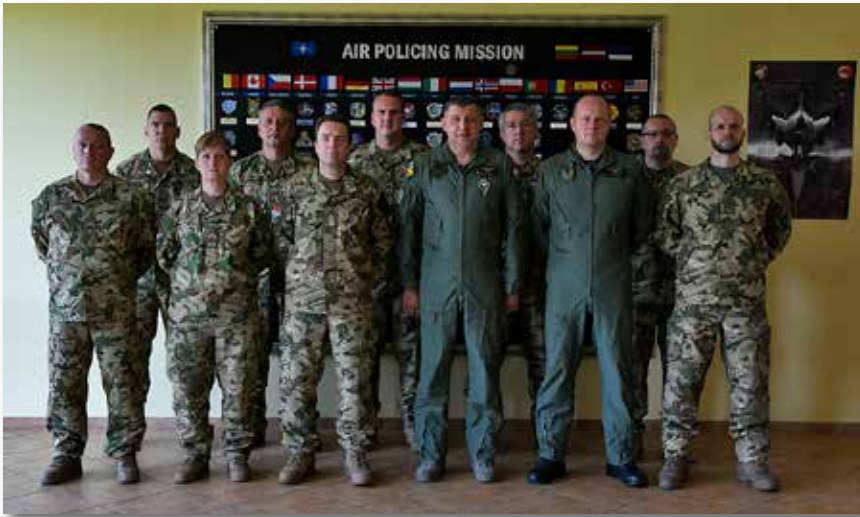
A BAP-ban való közreműködés minden katona számára nagy felelősség és megtiszteltetés

7 hónapot töltöttem Mazar-e Sharifban, Afganisztánban mint törzsfőnökségítő. Ezekben a missziókban nagyon sok tapasztalatot szerzett az ember a más nemzet katonáival történő együttműködés terén, amit az itthoni munka során hasznosíthatott is.