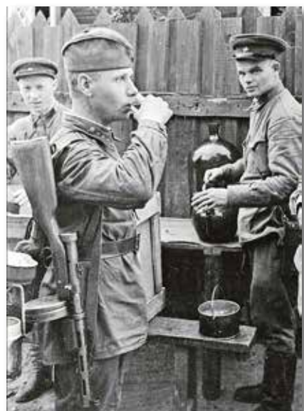
A vodkát a Vörös Hadsereg valamennyi fronton harcoló katonája számára elérhetővé tették

A vodkát a támadás előtt adták, aki akart, bögreszám ihatott belőle. Elsősorban a fiatal és tapasztalatlan katonák ittak, és ők voltak azok, akik nagy veszteségeket szenvedve az elsők között haltak meg. Az idősebb