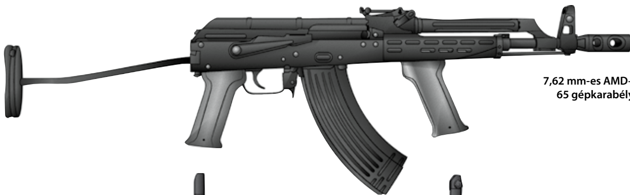
7,62 mm-es AMD-65 gépkarabély

A Magyar Honvédség legújabb lövész-fegyvere gázelveles rendszerű, hosszú löketű gázdugattyúval működő, kétkezes elrendezésű, 7,62×39 mm-es, vagy 5,56×45 mm-es töltényt tüzelő gépkarabély. Felső része alumíniumból, alsó részei pedig polimer anyagból készültek. A felhúzó és a tűzváltó karokat mindkét oldalra át lehet szerelni. Háromféle hosszúságú csővel szerelhető. Műanyagból készült válltámaszt oldalra be lehet hajtani. A tokfedélen, valamint az előágypalánál és alján lévő Picatinny-sínrendszere széles körű kiegészítők felszerelését teszi lehetővé.