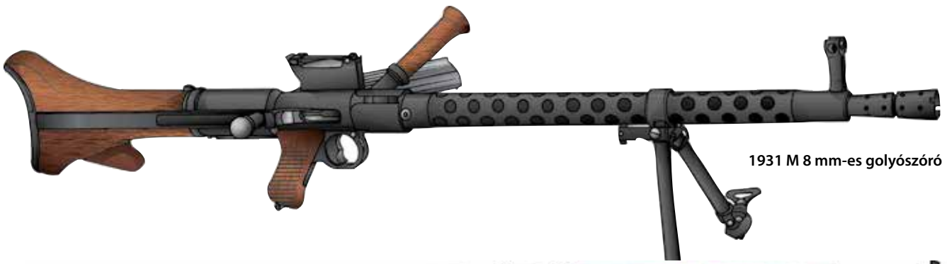
1931 M 8 mm-es golyószóró