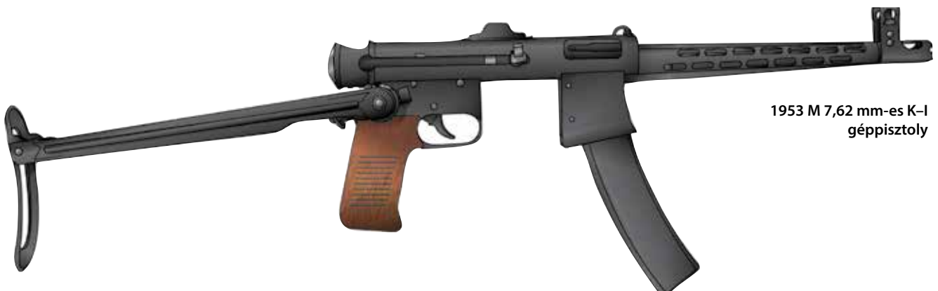
1953 M 7,62 mm-es K-I géppisztoly