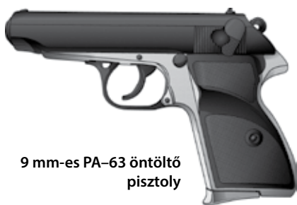
9 mm-es PA-63 öntöltő pisztoly