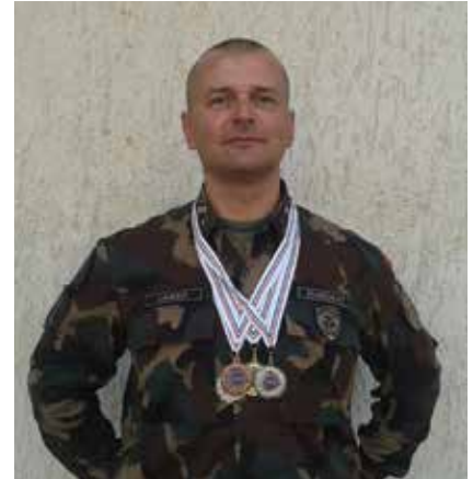
A törzsszászlós sikerrel szerepel a különböző lövészversenyeken

nyeit. 2015-ben egyéniben megszerezte az MH BHD Lőbajnokságán a „Dandár férfi pisztoly-lőbajnoka” címet.