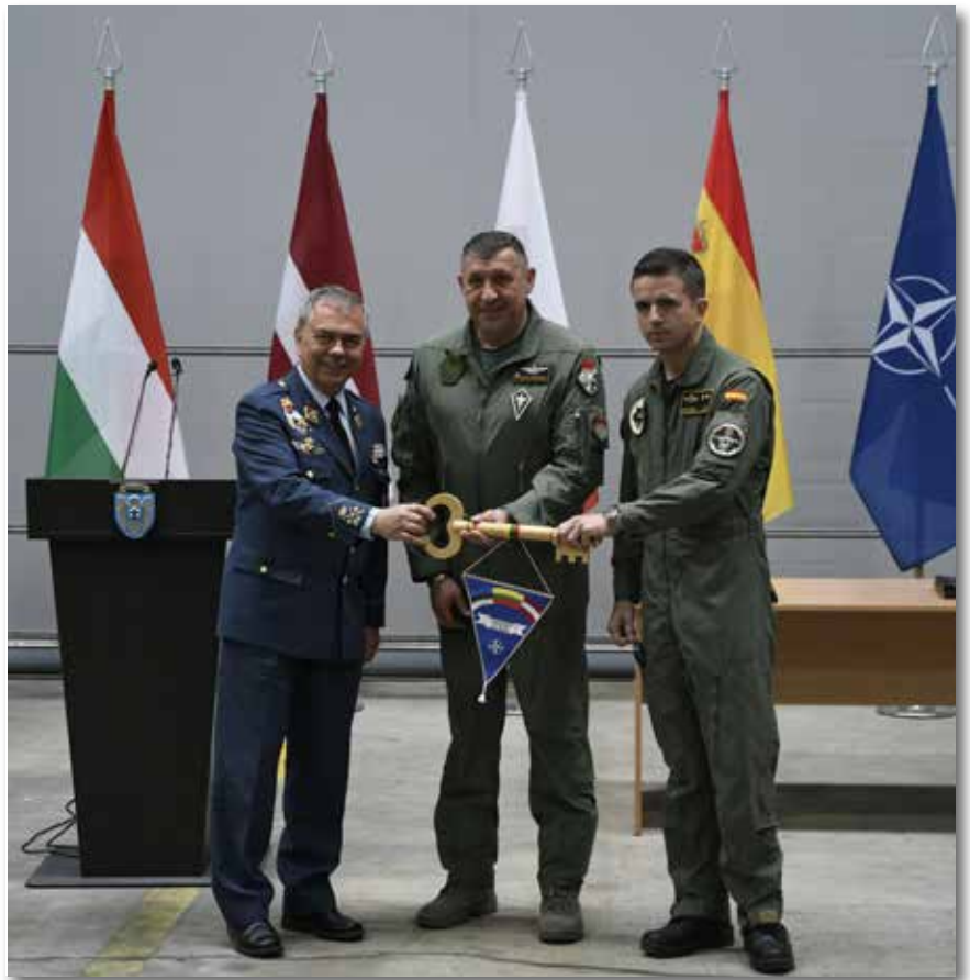
Magyarország 2015 után immár második alkalommal vesz részt a balti küldetésben

A szolgálat átvétele óta többször is sor került már alfa (azaz éles) riasztásra civil vagy katonai gépek miatt. A légi járművek nem teremtettek kapcsolatot a légiforgalmi irányítással, nem rendelkeztek előre leadott repülési terv-