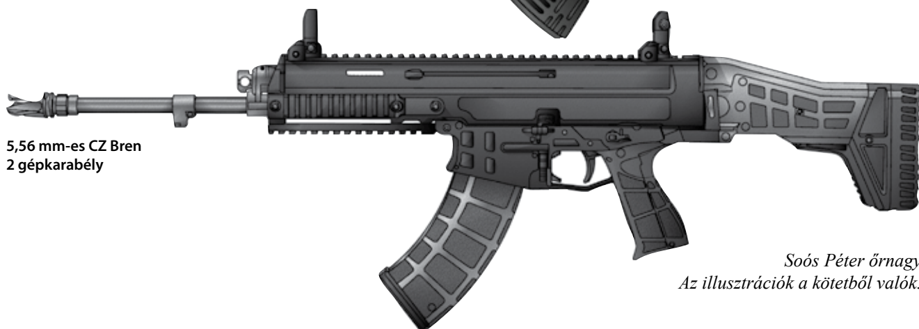
5,56 mm-es CZ Bren 2 gépkarabély

Soós Péter őrnagy Az illusztrációk a kötetből valók.