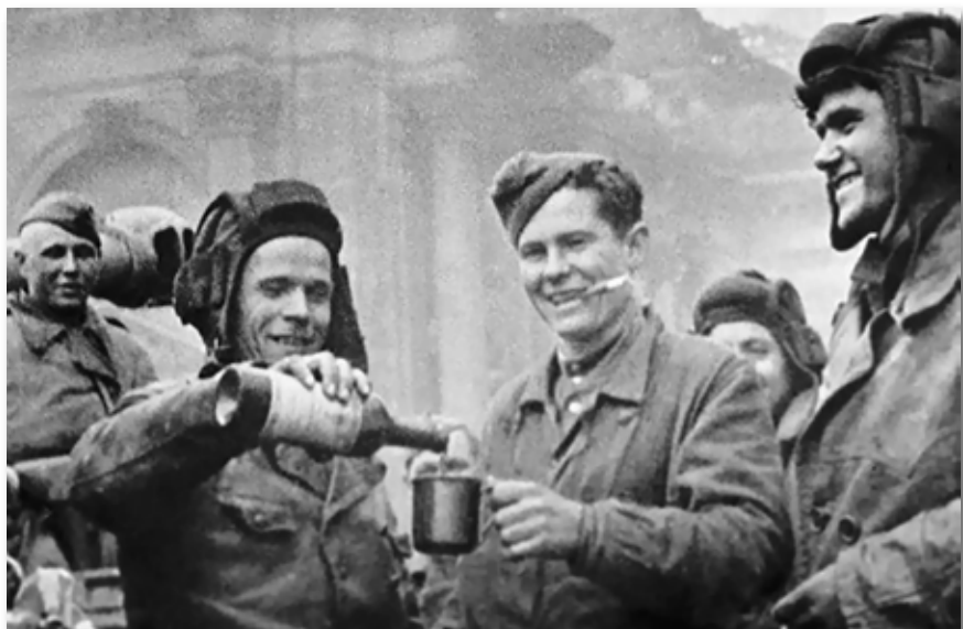
A „kenyérbortól” a testhőmérséklet és a harci szellem emelkedését remélték

A 18. század elején még nem tulajdonítottak különösebb jelentőséget az alkoholfogyasztásnak mint veszélyes szenvedélynek, hanem úgy vélték, hogy a „kenyérbor” a felmelegedéshez és a harci szellem emeléséhez szükséges. Százötven éven keresztül az orosz hadsereg alacsonyabb rendfokozatú harcoló katonái háborús időkben hetente 3 csésze „kenyérbort” kaptak (a nem harcoló állomány 2 csészével). Egy csésze térfogata 160 gramm volt. Így a harci szolgálatot ellátók hetente 480 gramm „kenyérborhoz” jutottak.