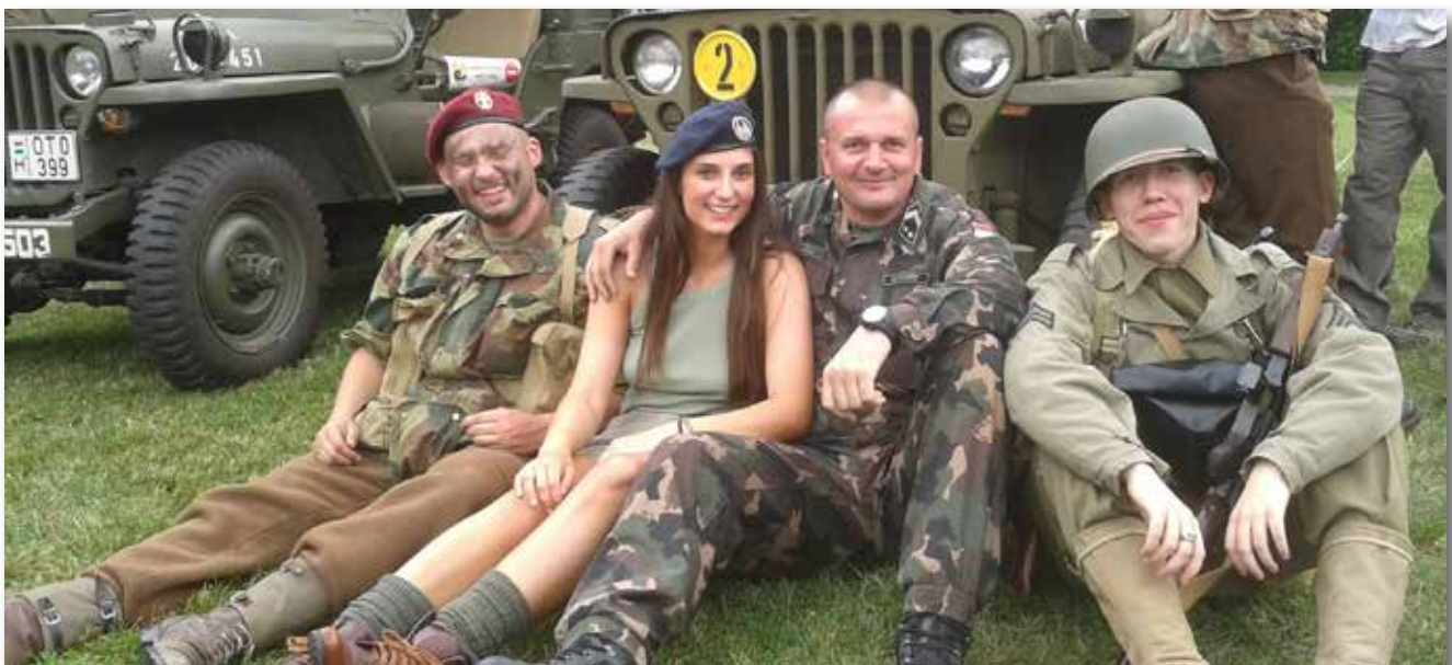
Zoltán rendszeresen szervez csapatépítő rendezvényeket