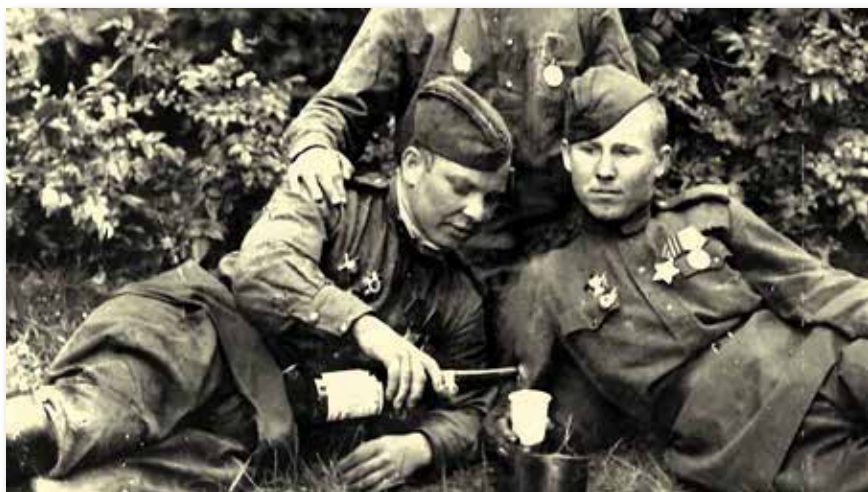
1941. augusztus 22-én kezdődött meg a harcoló alakulatok vodkával való ellátása

Bár az alkoholfogyasztás munkaidőben minden katonára számára tiltott a Magyar Honvédségben, és a civil életünkben is a mértékletesség a fő szempont, nem volt ez mindig így. Főként egészségügyi megfontolásból kaptak a katonák alkoholt, hiszen a víz ihatatlanul fertőző volt, ahogyan az egri várvédők napi boradagja megközelítőleg 5 iccára (kb. 3 liter) rúgott, a hajós népeknél is elterjedt volt a rumfogyasztás megelőző egészségügyi megfontolásból, de még a 19. században is bort vagy sört ittak víz helyett az emberek – sőt, a beteg csecsemőkkel is bort itattak gyógyulásuk elősegítése érdekében. Más célzattal is kaphattak alkoholt a (leendő) katonák, elsődlegesen a toborzáskor – igaz akkor alapvetően a döntést segítő célzattal –, vagy ahogyan a következő cikkből is láthatjuk, a harci morál és az egészség fenntartására. Így vagy úgy, minden nemzet megtanulta – alapvetően a saját kárán –, hogy a harci morál fenntartása mellett az alkoholfogyasztás igen tetemes veszteségeket okoz – nem csak a harctéren.