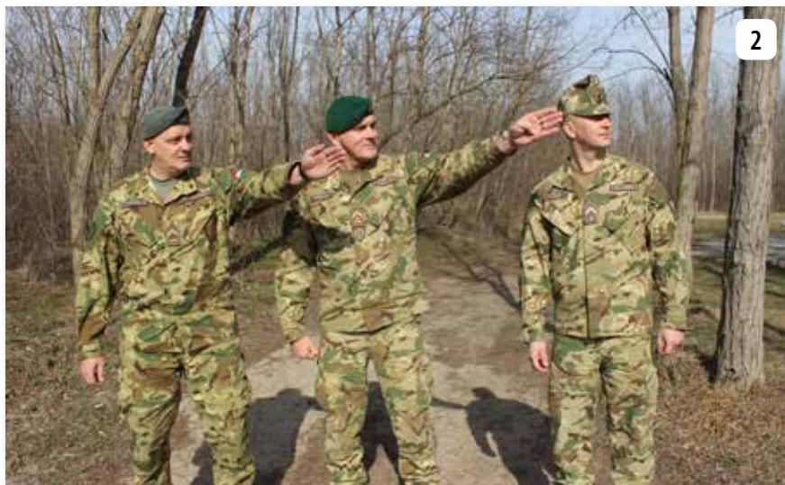
A vezénylőzászlós útmutatása

A Magyar Honvédség 2019. január 1-vel történt átszervezése kapcsán – a Katonai Filmstúdióval együttműködve – készítettünk felvételeket a Lendület útján című kisfilmhez az MH Ludovika Zászlóalj ócsai bázisán. A zászlóalj harcokszívó fegyvernemhez kötődő, heti kiképzésében lévő harmadéves tisztjelöltjei megneszelve a Honvéd Altiszti Folyóirat (HAF) „térsgében való tartózkodását”, az értékes, többünknek szimbolikus jelentőséggel bíró példány „trófeakénti” megszerzésére mozgósították magukat.