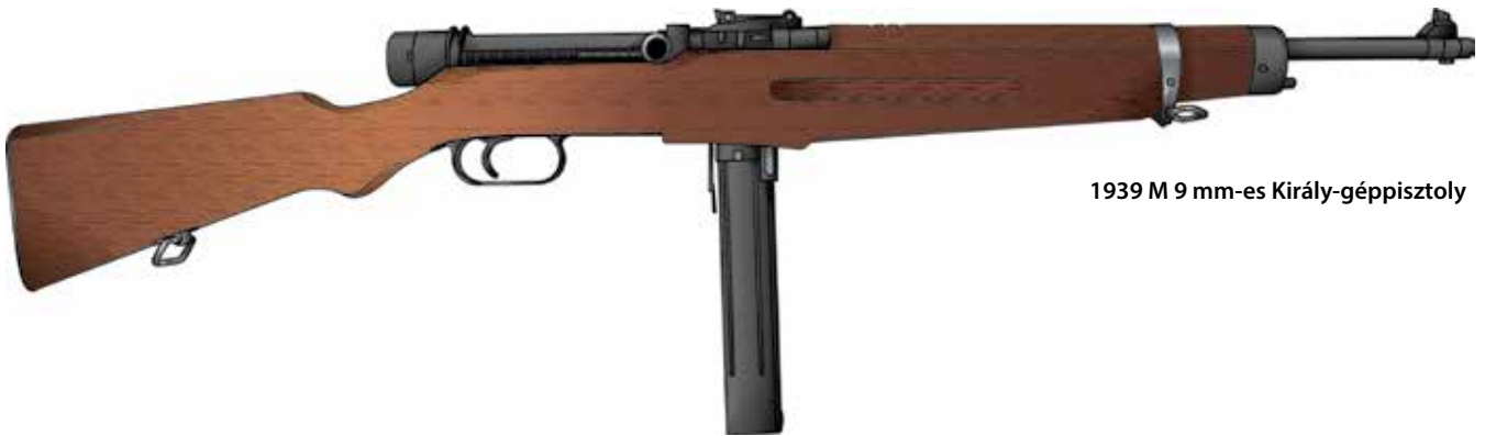
1939 M 9 mm-es Király-géppisztoly

rendszeresített fegyver Mannlicher-Schönauer-rendszerű forgó-tolózárral rendelkezett, és az 1931 M puskatöltényt tüzelte. Jellegzetessége a két részből álló ágyazat és a szintén újonnan bevezetett, merevítéssel ellátott, kétélű szurony.