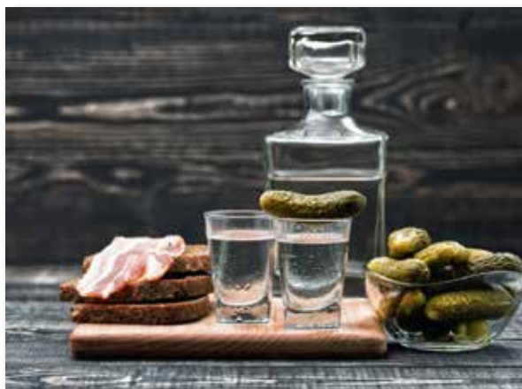
Vodka, barna kenyér, uborka – az összeállítás a háború befejezése után is népszerű maradt