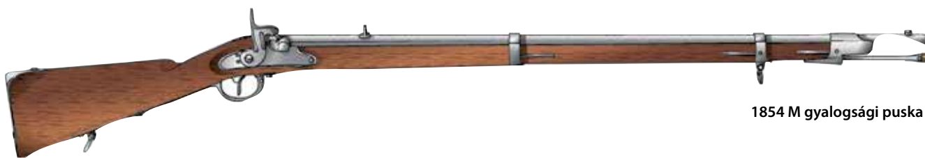
1854 M gyalogsági puskája