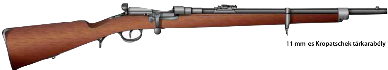
11 mm-es Kropatschek tárkarabély