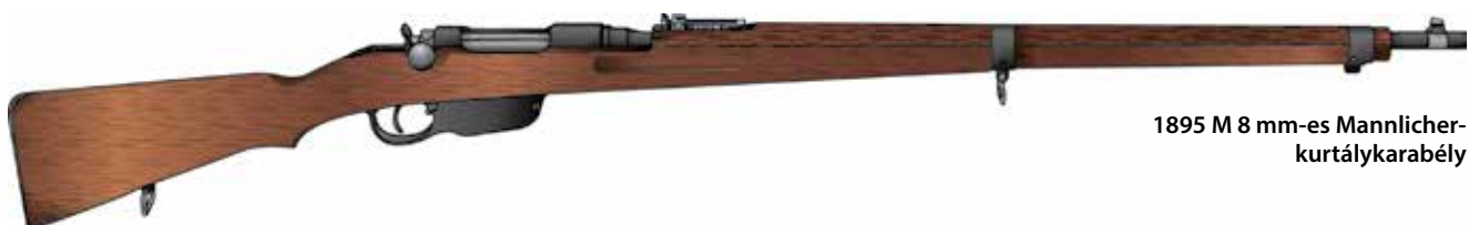
1895 M 8 mm-es Mannlicher-kurtálykarabély