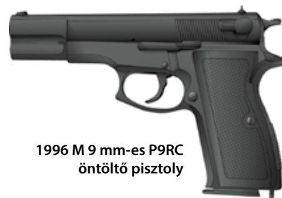
1996 M 9 mm-es P9RC öntöltő pisztoly

9×19 mm-es Parabellum-pisztolytöltényt tüzel. A Magyar Honvédségben és a rendőrségnél is rendszeresített szolgálati maroklófegyver.