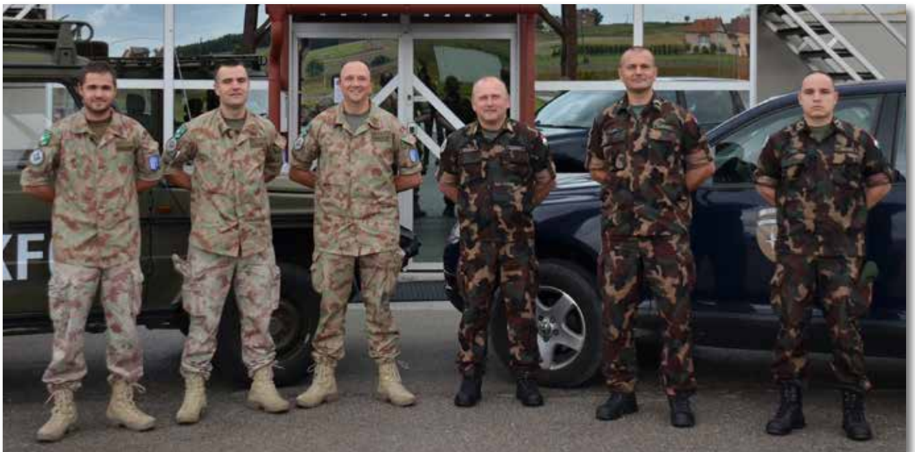
A KFOR katonájaként 2010-ben...

„Akkor még missziós tapasztalat nélkül vágtunk neki Ciprusnak, de az ott szerzett élmények, nemzetközi szakismeretek rávilágítottak arra, hogy milyen igazi katonának lenni” – emlékezett vissza a törzsszászlós a kezdetekre. Hazatérve többen megjegyezték, hogy mennyire megváltozott, és milyen jó hatással volt rá a külföldi szolgálat. Azóta szolgált az SFOR-ban, a KFOR-ban és Afganisztánban is. Parancsnokai mindig támogatták missziós terveit, mert amikor újra szolgálatba állt itthon, látták a lelkesedést, és hogy új erővel lát neki a feladatainak. Amikor lehetősége van, ő is támogatja beosztottjai, kollégái külszolgálatos terveit, mert vallja, hogy minden katonának legalább egyszer, de inkább többször részt kell vennie ilyen szolgálatokban. Az anyagi biztonság megteremtése mellett nagyon fontos és hasznos tapasztalatokra tudnak szert tenni katonáink egy missziós szolgálat ellátása során.