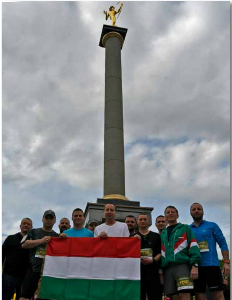
A magyar alegység aktívan részt vesz a helyi közösség társadalmi és sportéletében

Büszke vagyok, hogy képviselhetem Magyarországot ebben a misszióban is, köszönöm, hogy egy ilyen kiváló csapat tagja lehetek – nemcsak itt a Baltikumban, hanem otthon is.”