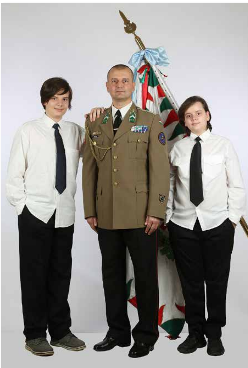
Fiaival a csapatzászló előtt

Az MH Támogató Ezredben belül a Támogató Zászlóalj vezénylőzászlósa lett; ezt a beosztást tölti be ma is. Az elmúlt 13 évben sok változás történt,