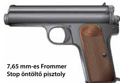
7,65 mm-es Frommer Stop öntöltő pisztoly

A korszerűtlen Mannlicher leváltására a Fegyver- és Gépgyár Rt. egy teljesen új működésű és kivitelű ismétlőpuskát tervezett. Az 1935 M néven