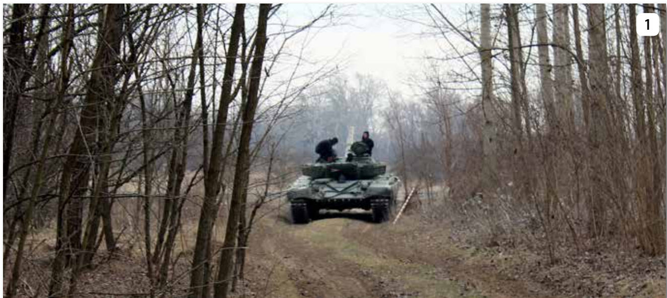
A portyázó tankosok