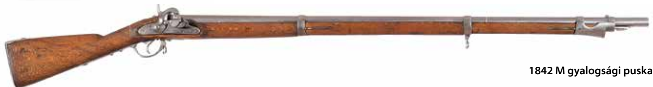
1842 M gyalogsági puská