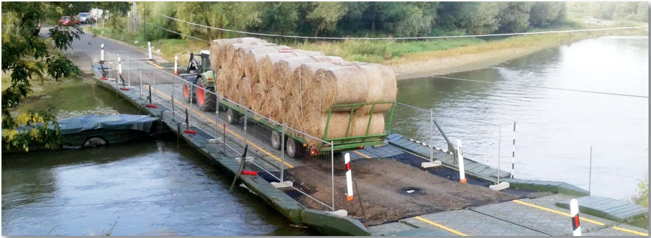
A környékbeli gazdálkodóknak is nagy segítség az ideiglenes átkelő

keskeny, csekély vízhozamú folyó, így mindössze 2 parti és 5 folyami híd-komp felhasználására volt szükség. A rögzítést a szabályoknak megfelelően horgonyzással, illetve a parton álló fákhoz történő kikötéssel oldották meg. Az esetleges további munkák biztosítására a hídhoz kötve készenlétben állt egy BMK 130M vontató motorcsónak is.