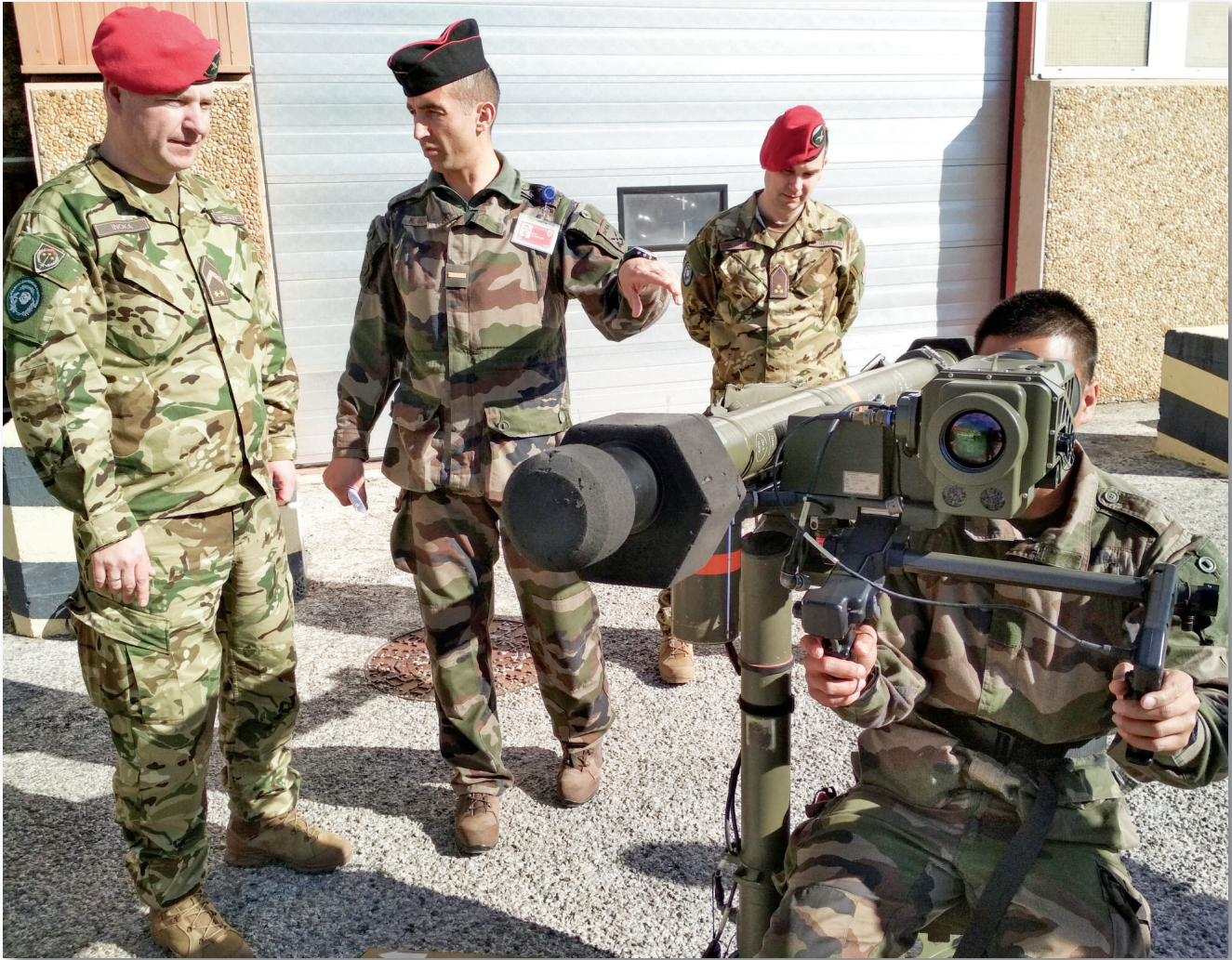
Állványos képzés az oktatási központban

teljes jogú partnert – köszönhetően az új egyenruhának, a nyelvi felkészültségnek és a szakmai hozzáértésnek.