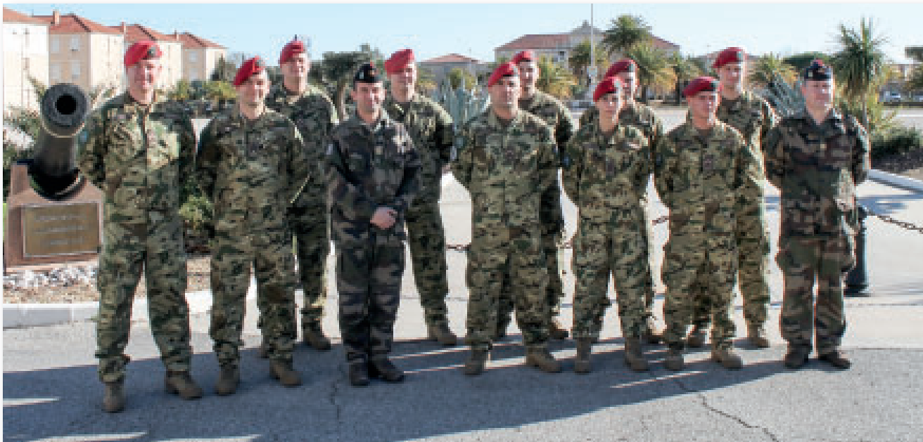
Küldöttségünk az 54. tüzérezrednél

Látogatás egy francia katonai alakulatnál