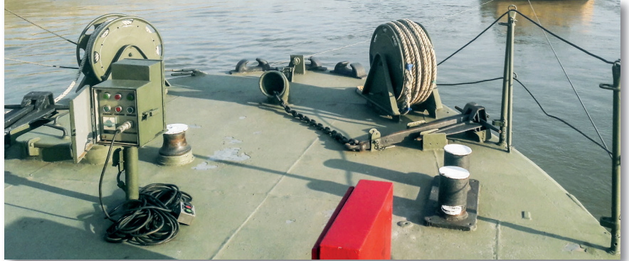
Felkészülés a feladatra a kiemelés helyszínén

Az előzmények 2018 októberében kezdődtek, amikor is a Duna eddig mért legalacsonyabb vízállása mellett előkeült a 2 darab robbanótest. Az alacsony vízállásnál gyakorlatilag a partról látni lehetett a bombákat; az egyik a parti kövezésbe fúródott, a másik körülbelül 100 méterrel lejjebb, a vízben feküdt, de szabad szemmel is jól látható volt a robbanóeszköz jellegzetes körvonala. A Magyar Honvédség 1. Honvéd Tűzszerész és Hadihajós Ezred tűzszerész bűvárai és hadihajós katonái felmérték a helyszínt. Megállapították, hogy nagy valószínűséggel a második világháborúból hátramaradt amerikai repülőbombákat rejtegetett évekig a Duna. Az eszközök felderítésekor megjelölték a pusztítóeszközök pontos helyét, hogy a későbbi mentesítés alkalmával azok könnyen újra megtalálhatóak legyenek, azt feltételezve, hogy a vízállás akkor már nagyobb lesz. Az októberi vízhozam akkor nem tette lehetővé, hogy a