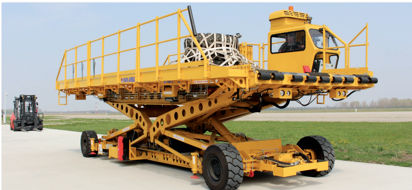
A bázis csapatának munkáját speciális repülőtéri kiszolgáló eszközök könnyítik meg

A technikai és infrastrukturális feltételek megteremtése a NATO Biztonsági Beruházási Program (NATO Security Investment Programme – NSIP) keretében zajlott le. A nemrég átadott utasforgalmi (PAX) terminál óránként 200 személy átbocsájtását teszi lehetővé, a poggyászok és utasok átvizsgálását, valamint a csomagok légi palettára történő összekészíztetését is beleértve. Az itt szolgálatot teljesítő személyi állománynak fel kellett készülnie a csomagtováb-