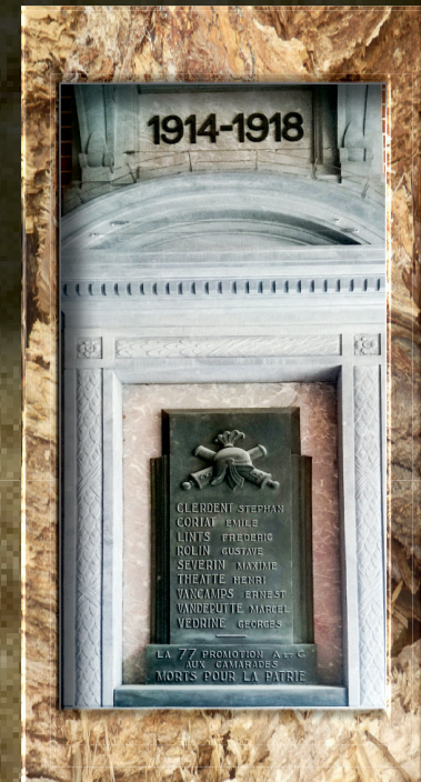
▼ Az égi sereg néhány katonájának nevét őrzi a fehér márványtábla.