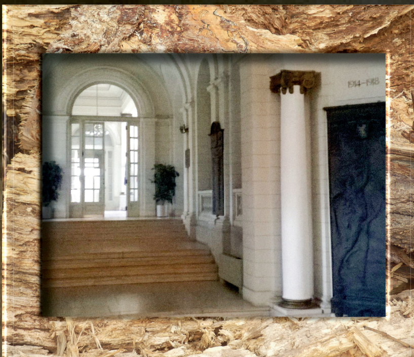
▼ A főépület aulájában és lépcsőfordulóiban szintén több hős neve van kőbe vésve.