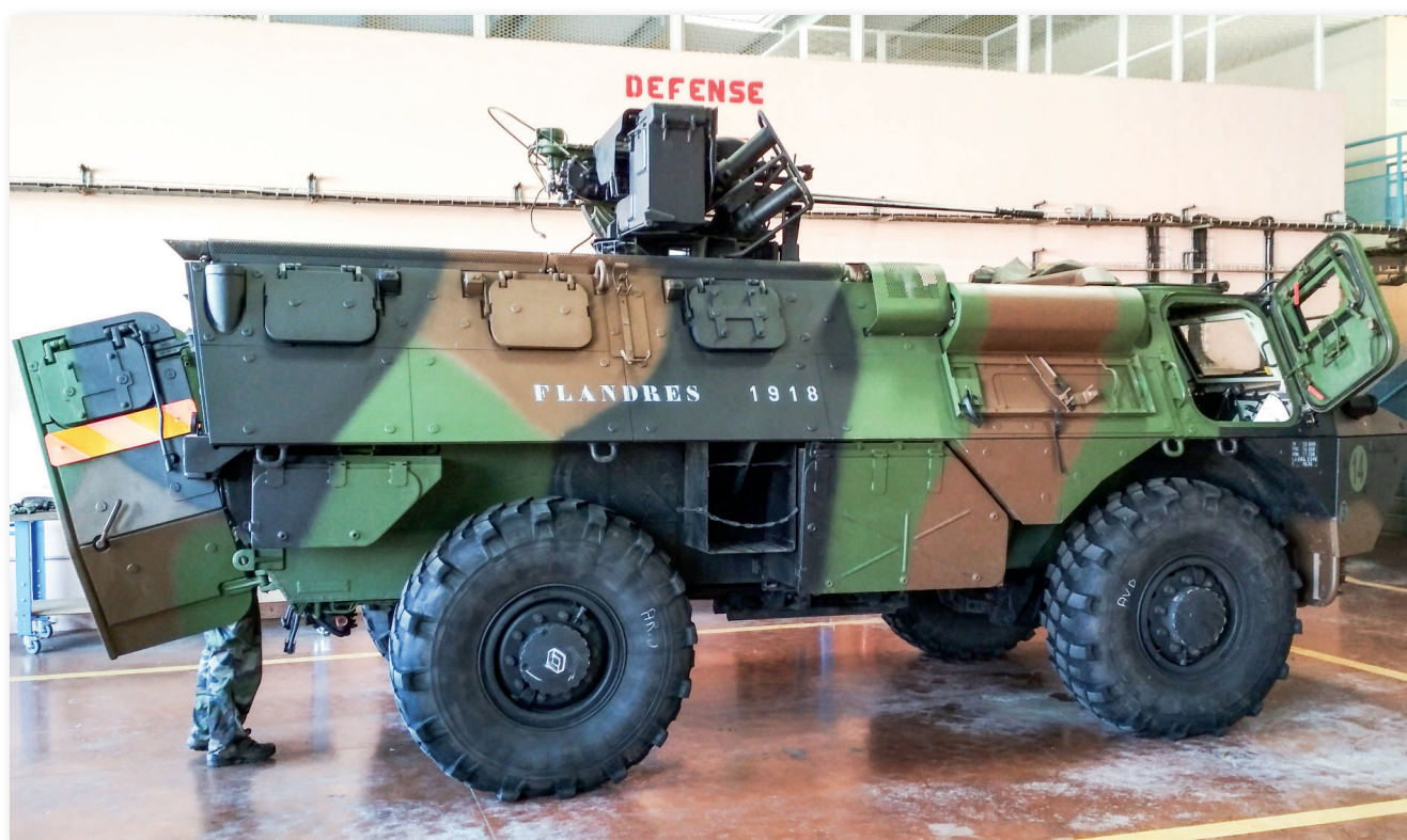
VAB páncélozott személyszállító 20 mm-es géppágyúval a földi védelem támogatására. Hátról, az utastérben kap helyet a mobil MISTRAL-indítóállvány