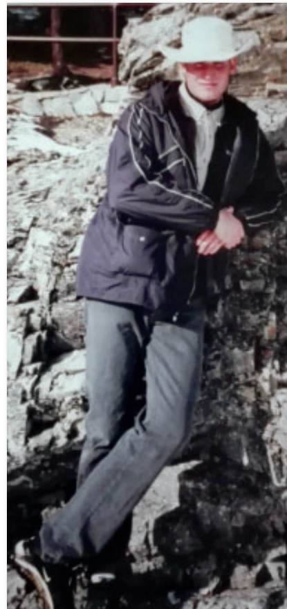
Egy fotó az ifjúkorból

Már ekkor magabiztosan gondolt a jövőjére hivatásos katonaként, igaz akkor még érvényben volt a kötelező sorkatonai szolgálat a honvédségnél.