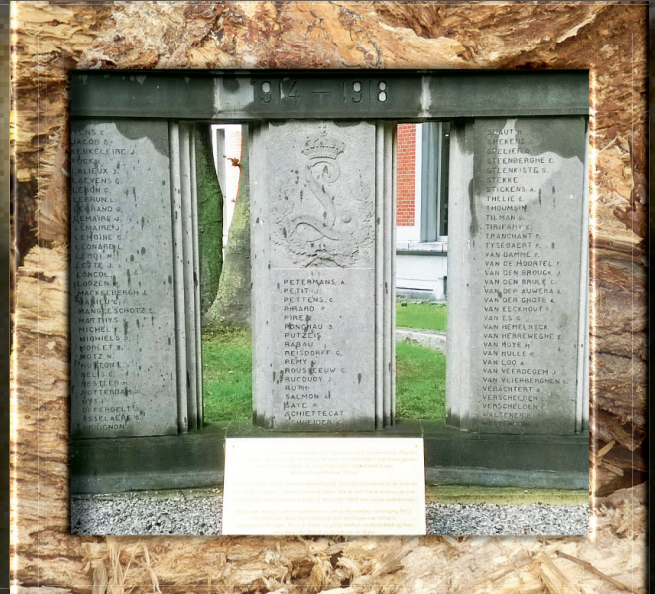
▲ Az 1914–1918 közötti áldozatok nevei a három gránittömről néznek ránk.