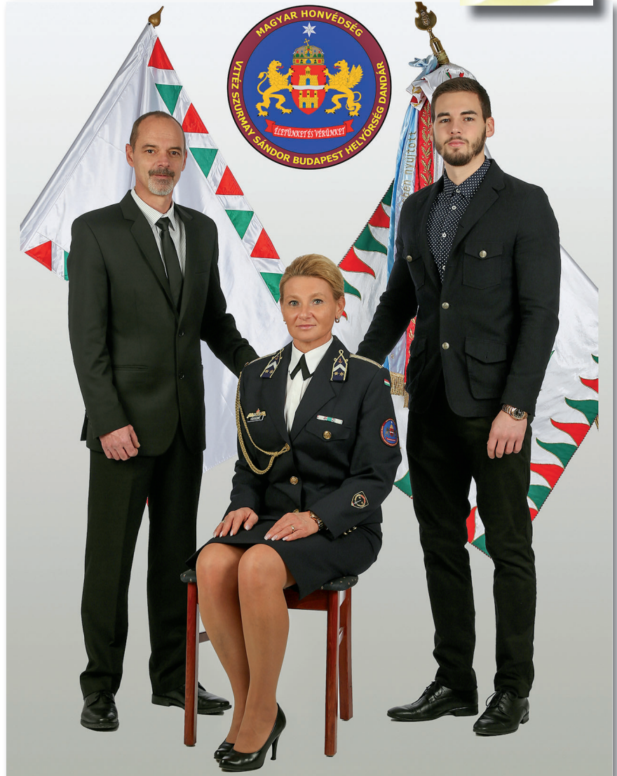
Családi fotó 2016-ban, az év zászlósa cím elnyerésekor

Az OHFK parancsnoka az időközben megüresedett rangidős altiszti beosztás feladataival is megbízta. Ezután, 2014-ben beiskolázták a Magyar Honvédség Altiszti Akadémia által indított vezénylőzászlósi tanfolyamra, majd a végzést követően 2015. január 15-ei hatállyal kinevezték az MH BHD MH Híradó és Informatikai Rendszerfőközpont (HIRFK) OHFK vezénylőzászlósa. 2017-ben elvégezte az Összhaderőnemi Vezető Altiszti Tanfolyamot (ÖVAT) is; vizsgadolgozatát a „Katonanők helye és szerepe a vezetői beosztások tükrében” címmel írta meg. 2016 szeptemberétől az MH BHD