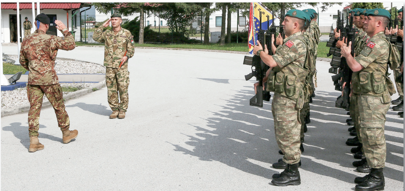
Boszniában szolgálni megtiszteltetés volt valamennyi nemzet katonája számára

Az EUFOR-20 műveleti százada több alakulat különböző szaktudással és képességekkel rendelkező katonáiból szerveződött és kezdte meg a fel-