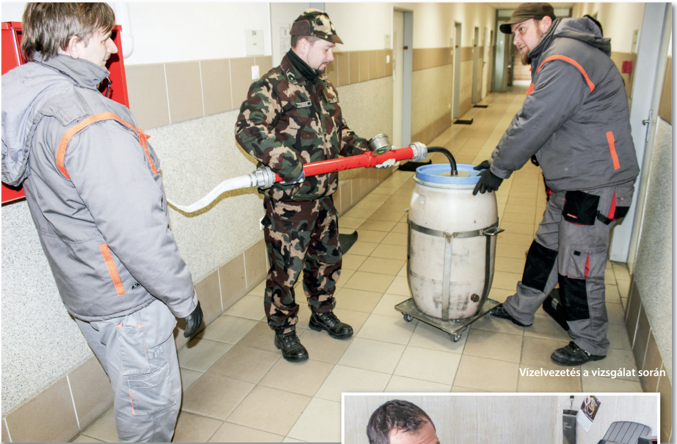
Vízvezetés a vizsgálat során

2013 óta a Magyar Honvédség tűzoltó-vízforrásainak felülvizsgálatát a Magyar Honvédség Légijármű Javítóüzem (a továbbiakban: MH Lé. Jü.) kijelölt szakállománya hajtja végre. A tartozékok tűzvédelmi szakvizsgát nem igénylő ellenőrzése a létesítményt üzemeltető katonai szervezetek feladata, míg a szakvizsgát igénylő eszközök felülvizsgálata, valamint a szerelvények nyomáspróbája az MH Lé. Jü. hatáskörébe tartozik.