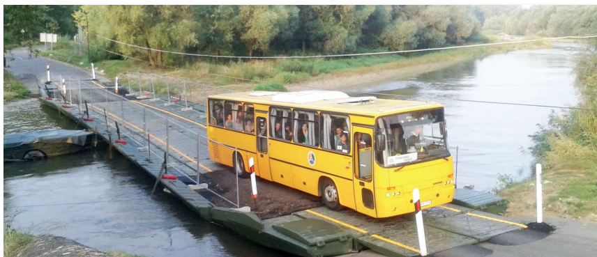
...asztán megérkezett a távolsági autóbusz is