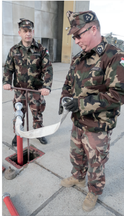
A honvédség objektumaiban mintegy 2500 tűzcsapot kell ellenőrizni évente

„Megtörtént, hogy egy laktanyában a felülvizsgálat során egy anyaghibás tűzcsap meghibásodása miatt nem lehetett lokálisan megszüntetni a vízfolyást, ezért – a rendszer sajátossága miatt – a hiba kijavításáig az egész laktanyában el kellett zárni a vizet. A problémát tetézte az is, hogy mindez jóval munkaidő után történt, így az illetékesek (laktanyaparancsnok, üzemeltető ügyeletes) elérése és az általuk tett intézkedések is több időt igényeltek. Egy másik alkalommal azonban az egyik rekreációs létesítményben, az elvégzett munka utáni jól megérdemelt kikapcsolódást követően sétáltunk vissza a szállásra, ahol legnagyobb meglepetésünkre tűzijáték fogadott minket. Tudtuk, hogy jó munkát végeztünk, de a köszönet ilyen jellegű kifejezése mindenkit meglepett. Kihú-