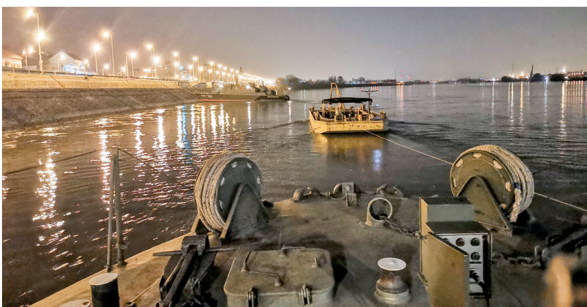
„Hazatérés” a sikeres feladat-végrehajtás után