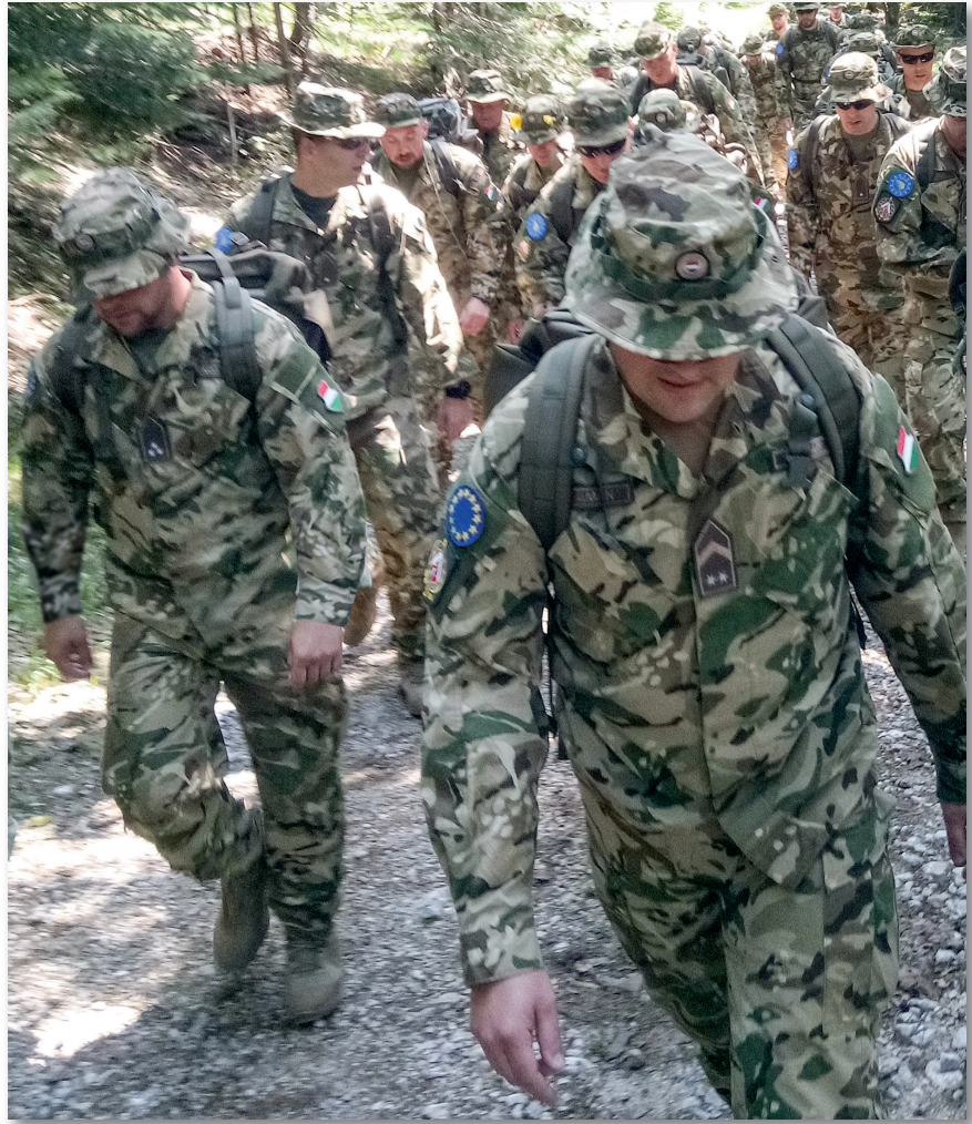
Menetgyakorlaton a század

A beugró gyakorlatunkat követően a többnemzeti zászlóalj parancsnoka elismerően beszélt a század feladatvégrehajtásáról. Camp Butmirban olyan nemzetek katonáival szolgáltunk, melyekkel a közös történelmünk évszázadokra nyúlik vissza. A török, az osztrák, valamint a lengyel katonákkal az egymás iránti kölcsönös tisztelet gyakran az adott nemzet nyelvén való köszönésben is megnyilvánult. Apró dolognak tűnhet ez a gesztus, de éppen ezeknek az apró, udvarias megnyilvánulásoknak köszönhettem az első nemzetközi elismerést. A havi rendszerességgel megtartott rangidős altiszti értekezleten, szolgálatba lépésünket követően pár