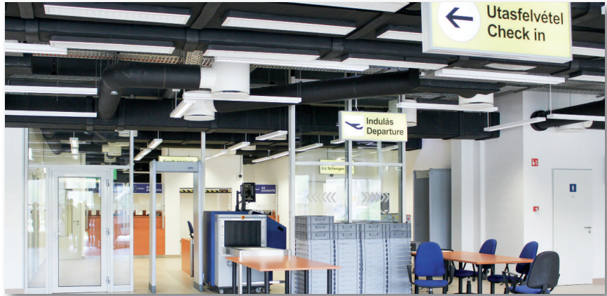
A terminál óránként 200 személy átbocsájtását, valamint a csomagok légi palettára történő összekészletezését teszi lehetővé

A K-loader egy speciálisan kialakított rakodóeszköz, mellyel a legtöbb NATO-ban rendszeresített légi szállítójármű ki- és berakodása történik. Az angol gyártmányú AMSS Atlas típusú gép segítségével kiszolgált repülőgépek között C-17, C-130 és A-400 fordult elő a legnagyobb számban. A berakodást megelőzően a nemzetközi szabványú légi paletták targoncák segítségével kerülnek fel a K-loaderre, illetve kirakodáskor erre az eszközre helyezik őket. Sajátosságai közé tartozik a változtatható kormányzás, ami könnyebbé teszi a repülőeszköz megközelítését, továbbá a platformon lévő anyagok görgőkön való továbbítása, mely a beépített továbbító rendszer segítségével vagy kézi erővel történik. Az eszköz hosszanti, illetve oldalirányban 35 fokban dönthető, így bármilyen terepviszonyok között lehetséges a repülőgépekbe történő be- és kirakodás. A K-loader egyidejűleg 4 db légi paletta kezelésére alkalmas, vagy 1 db 20 láb hosszúságú konténert képes szállítani, illetve ki- és berakodni. Maximálisan 18 tonna rakományt, akár 90 és 750 cm között megemelve képes kezelni, az adott repülőeszköz méretéhez igazodva. A két meglévő K-loaderrel egyszerre legfeljebb csak 8 légi paletta mozgatása lehetséges, ami a nagyobb repülőgépek esetében nem mindig elégséges. A megoldást ilyenkor az AMSS cég palettaszállító utánfutói jelentik: segítségével a paletták a repülőgép