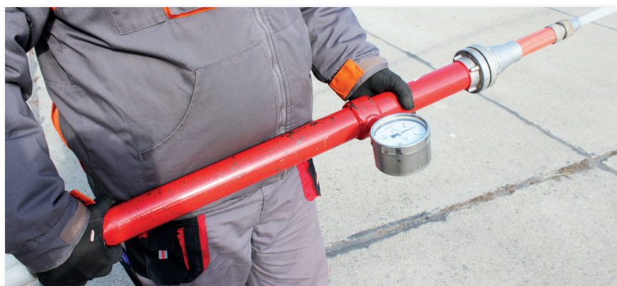
Az előírt nyomásérték ellenőrzése