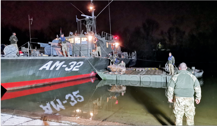
A robbanószerkezet előkészítése az elszállításra

emelésére. A tüzserészekon kívül számos társ- és kormányzati szervezet vett részt a feladat előkészítésében és végrehajtásában. Reggel 7 órától mintegy 600 rendőr indult el a korábban kijelölt budafoki városrész kiürítésének megkezdésére és a lezárandó útszakaszok biztosítására. Munkájukat katasztrófavédelmi szakemberek, polgárőrök, egészségügyi dolgozók és még sokan mások is segítették. Az otthonukat vagy éppen munkahelyüket elhagyni kényszerült embereket, amennyiben szükség volt rá, a közeli iskolákban és szociális intézményekben helyezték el; ez főleg az idős, beteg embereket és kisgyermekes családokat érintette. Ezek a pontokon minden szükséges ellátást megkaptak a rászorulóok. A késő délelőtti órákra megtörtént a terület evakuálása, majd ezek után a 6-os főút és a környező utcák lezárására is sor került.