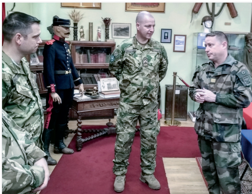
Az ezred emlékszobája

Talán először éreztem azt, hogy a külföldi katonák nem úgy méregetnek minket, mint egy idegent, hanem, mint