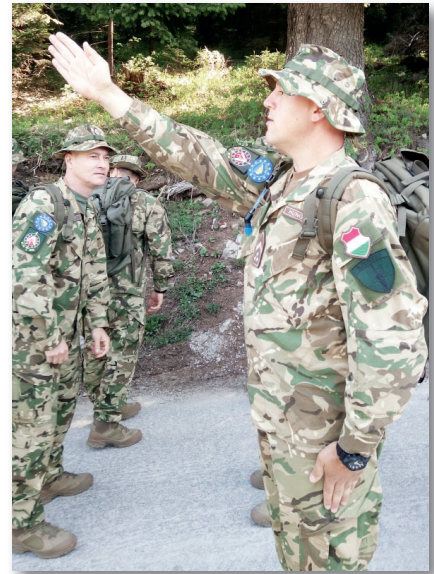
A táborvédelmi feladatokon túl rendszeresez voltak a kiképzések

Az egyre drasztikusabb és mindinkább szélesedő, civilek elleni erőszak és a harcmezőkön megjelenő fanatikus harcosok tevékenysége a nemzetközi közösséget cselekvésre készítette. A NATO 1995 szeptemberében az ENSZ felhatalmazásával megkezdte a szerb erők bombázását, és az egy hónapig tartó művelet eredményeként 1995. november 12-én megkezdődtek a tárgyalások az amerikai Daytonban. A háborút a párizsi békeszerződés 1995. december 14-i aláírása zárta le. A békeegyezmény katonai feladatainak végrehajtására a NATO-vezette többnemzeti haderő, ENSZ-felhatalmazással, egy éves mandátummal, egy 60 ezer főt számláló erővel kezdte meg tevékenységét. Ez az erő az IFOR volt. Az IFOR