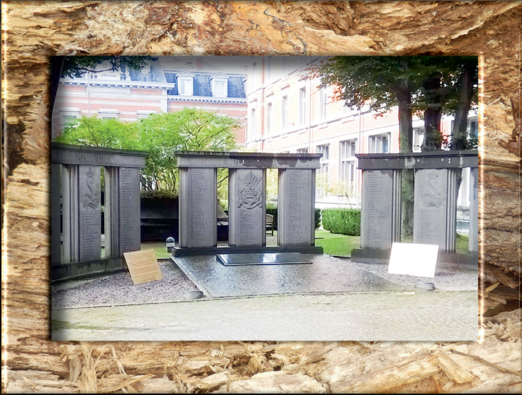
▲ Az iskola tanári karának és hallgatóinak világháborús veszteségeire emlékezik a park egyik szeglete.

Az 1834-ben alapított belga Királyi Katonai Akadémia (L'École Royale Militaire) 1909-től folytat oktatást a jelenlegi helyén. A Reneszánsz sugárúton (Avenue de la Renaissance) található intézmény patinás falai között, valamint kellemes hangulatot árasztó dekoratív parkjában több emlékmű fogadja a látogatót és készíti rövidebb megállásra. Ezek közül láthatunk néhányat a következő képeken.