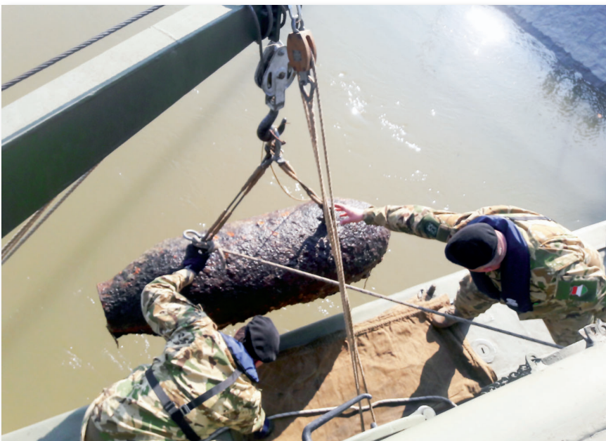
Az egyik bomba kiemelése

Március 23-án reggel 6 órakor megkezdődtek a műveletek a bombák ki-