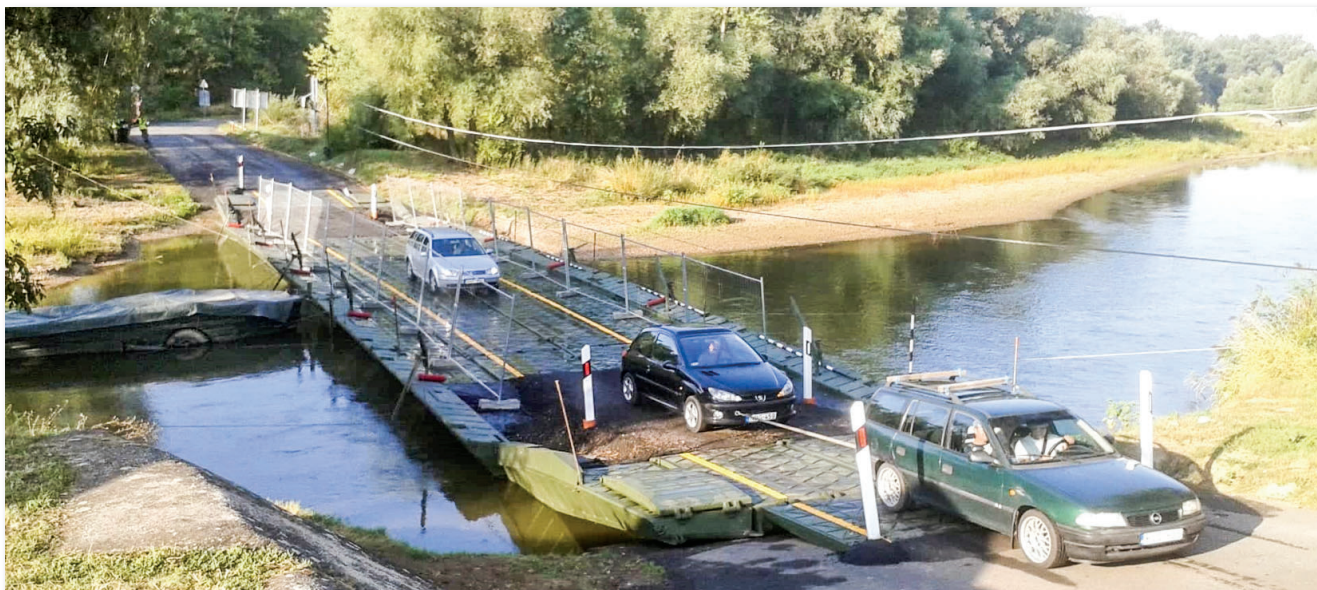
A három óra alatt felépített hidat elsőként a személygépkocsik vették igénybe...

Régi hagyomány, hogy a honvédség szükség esetén segítséget nyújt a társadalomnak. Így volt ez már a Varsói Szerződés idejében is, de akkoriban a sorozott haderő miatt a kapcsolatunk közel sem volt ennyire jó a civilekkel. Bevett gyakorlat volt, hogy a sorállományt ősszel kivezényelték a termelőszövetkezetekhez, és részt vettek a betakarítási munkákban. Sőt, magam is emlékszem arra, hogy az 1980-as évek végén az általános iskolában az új tanterem építésénél is megjelentek a „zöld ruhás kiskatonák”.