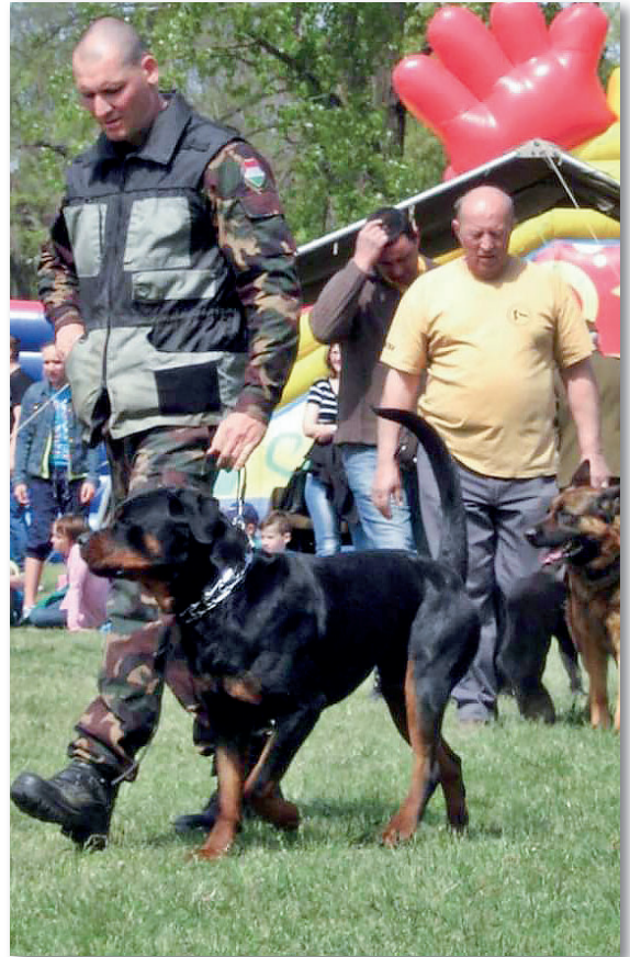
A vízi sportok, a lovak és a kutyák szeretete meghatározó az életében

2018 májusában ismét változás állt be katonai karrierjében. Sajnos, a szeretett víz alá merülést hivatásos szinten be kellett fejeznie, és az alakulatunknál maradván a Vezető Szervek Személyügyi Főnökségére került beosztásba mint toborzásért felelős altiszt. A toborzási feladatok végrehajtása, tájékoztatók megtartása, toborzóirodákkal, továbbá megyei és környéki foglalkoztatási osztályokkal való kapcsolattartás lett a feladata. A kádét-programba bevont Hódmezővásárhelyi Szakképzési Centrum Zsoldos Ferenc Szakgimnáziuma és Szakközépiskolája és alakulata összekötője is lett egy időben. Mint mondta, szereti a kihívásokat, és a sajátos „tenni akarok!” temperamentumával látja el a feladatait. Már a kezdetekkor sikerült nagyon jó munkakapcsolatot kiépítenie a partnerekkel. Új beosztása a katonai képesi-