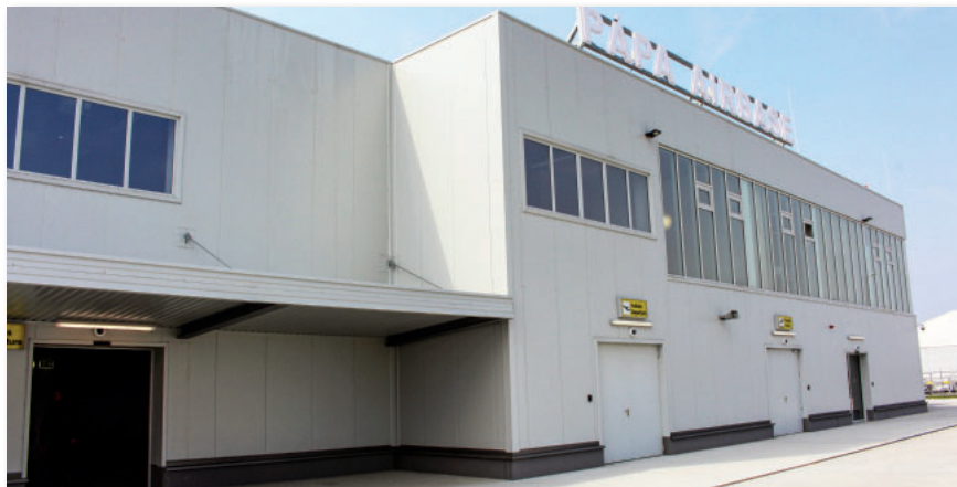
A nemrég átadott utasforgalmi (PAX) terminál

A három SAC C-17-es feladátvégrehajtásával kapcsolatban a bázisrepülőtér feladatává vált a repülőgépek földi kiszolgálása, az utasok schengeni határokon át történő ki- és beléptetése, tranzitutasok kezelése, adott esetben élelmezése és szállás biztosítása, repülő-üzemanyag és folyékony oxigén utántöltése, szennyvízürítő (lavatory) szolgáltatás biztosítása. E feladatok elvégzése érdekében megfelelő infrastruktúra kiépítése, modern technikai