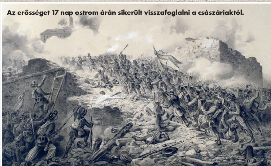
Az erősséget 17 nap ostrom árán sikerült visszafoglalni a császáriaktól.

nem egy létező állapotot, hanem egy követelményt fogalmazott meg, melynek megvalósítása a hadseregre várt. Ennek során fel kellett szabadítania az ország egészét, beleértve az önállóságot szimbolizáló fővárost.