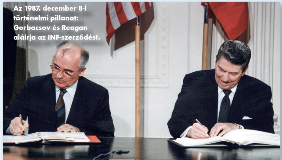
Az 1987. december 8-i történelmi pillanat: Gorbacsov és Reagan aláírja az INF-szerződést.

Az INF-szerződés kimondta, hogy az Egyesült Államoknak és a Szovjetunióknak le kell szerelniük az összes 500 és 5500 kilométer közötti hatótávolságú, szárazföldi indítású ballisztikus rakétájukat, illetve robotrepülőgépét (ez egyaránt vonatkozott a nukleáris és a hagyományos töltettel