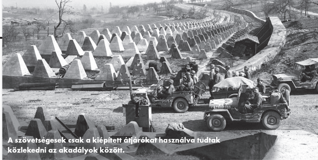
A szövetségesek csak a kiépített átjárókat használva tudtak közlekedni az akadályok között.

A Siegfried-vonal szisztematikus elpusztítása már 1945-ben elkezdődött: a szövetségesek nem szerették volna, hogy egy esetleges német ellentámadás során ismét harcolni kelljen a térségben. A bunkereket felrobbantották, az acélajtókat behegesztették, a bulldózerek megpróbálták eltű-