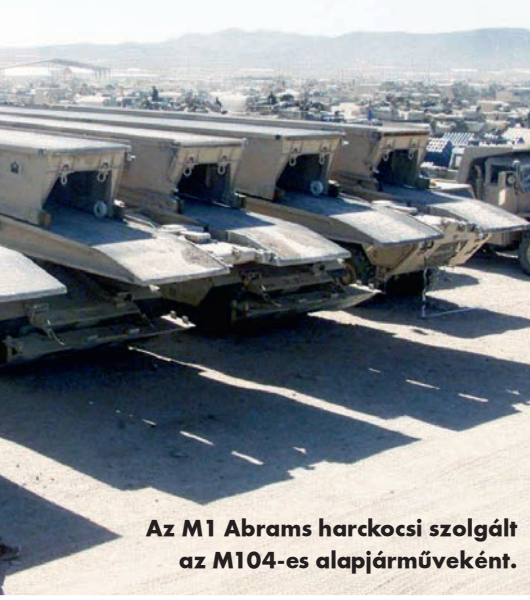
Az M1 Abrams harckocsi szolgált az M104-es alapjárműveként.

leges szempont volt a kezelőszervek egyszerűsítése: ha az operátor tudja, hogy pontosan hova kell telepíteni a hidat, s a művelet végrehajtásához a talaj is megfelelő, akkor csak a „lerakás” gombot kell megnyomnia, a többit már a számítógép intézi magától.