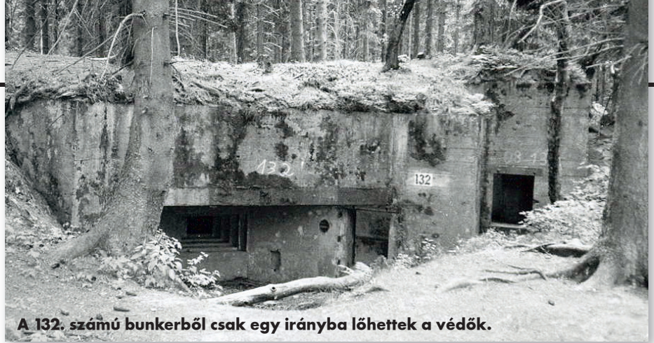
A 132. számú bunkerből csak egy irányba lőhettek a védők.

Négy évig raktárként használták a védműveket, 1944. augusztus 24-én azonban Adolf Hitler kétségbeesésében ismét a régi ütőkártyájához nyúlt: fel kellett éleszteni tetszha-