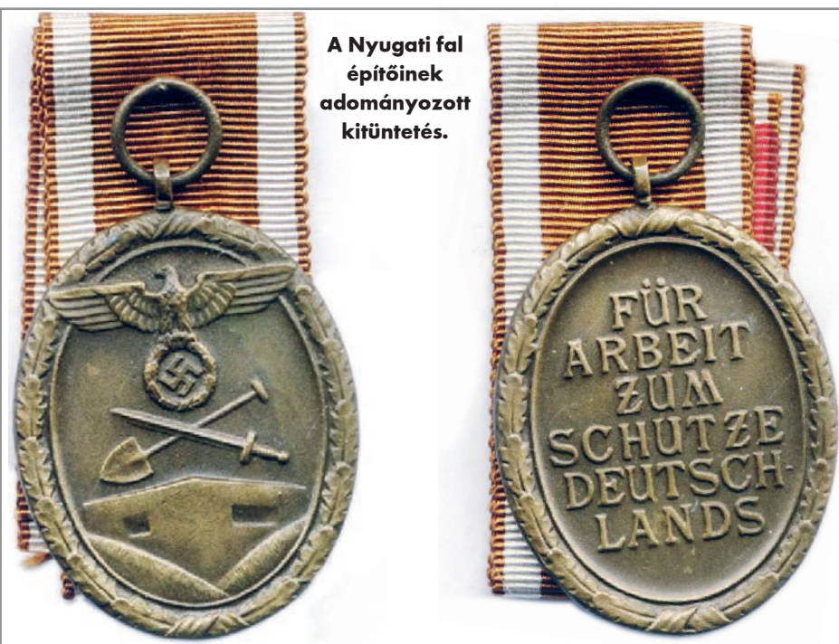
A Nyugati fal építőinek adományozott kitüntetés.

Nem csak a katonanóta ígerte a gatyatergetést: már 1939-ben társasjáték készült, a németeket neveltségévé téve.