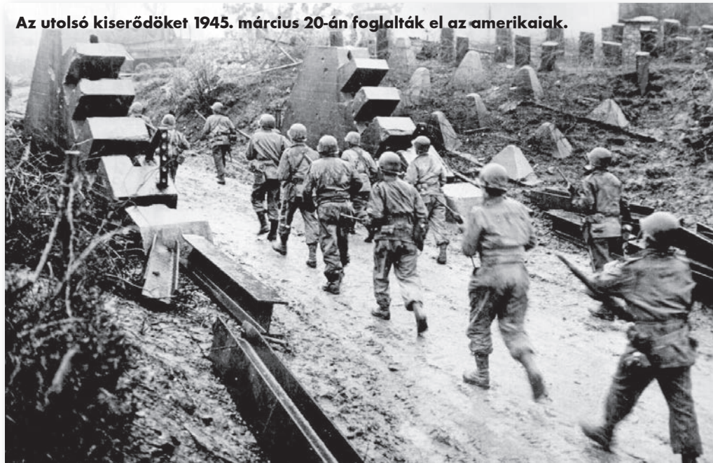
Az utolsó kiserődöket 1945. március 20-án foglalták el az amerikaiak.

tetni az egykori védművek nyomait. A francia és a brit megszállási zónákban épült kiserődök környékén a lerakott aknákat hadifoglyokkal szedették fel és megkezdődött a szisztematikus pusztítás. 1946 végéig több mint 4000, különböző méretű erődöt semmisítettek meg, félszáz