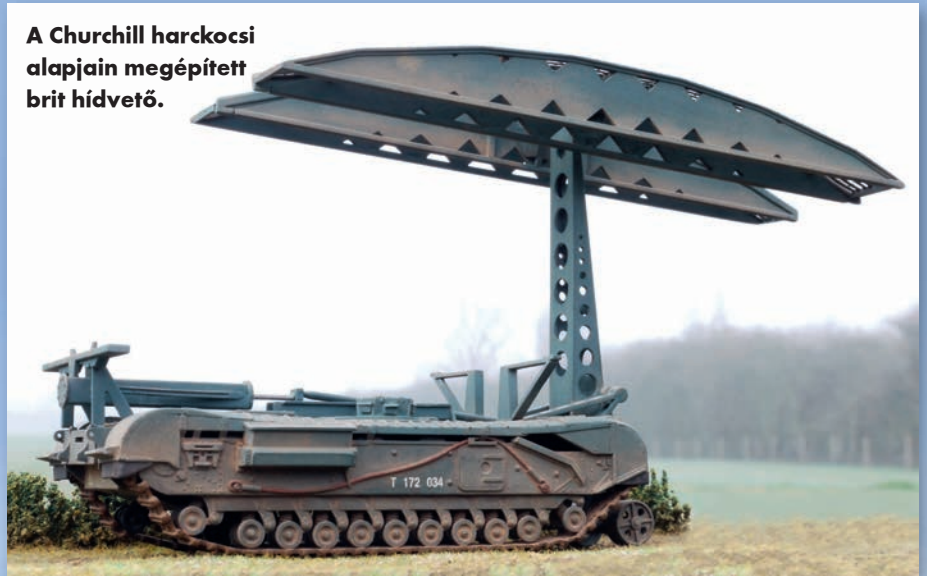
A Churchill harckocsi alapjain megépített brit hídvető.

is (hiszen az M60A3-asok már régen nyugdíjba mentek) és a logisztikai-karbantartási folyamatok szintén egyszerűsödtek. Mindezekon túl, az erősebb páncélzat nagyobb védelmet jelent az M104-es vezetőjének és a hídrendszer kezelőrendszerét működtető specialistának egyaránt. A hídelem lerakásához és felszedéséhez természetesen nem kell kiszállni a járműből, s a művelet sem vesz igénybe sok időt: az elhelyezéshez öt, annak visszavételéhez csupán tíz perc szükséges.