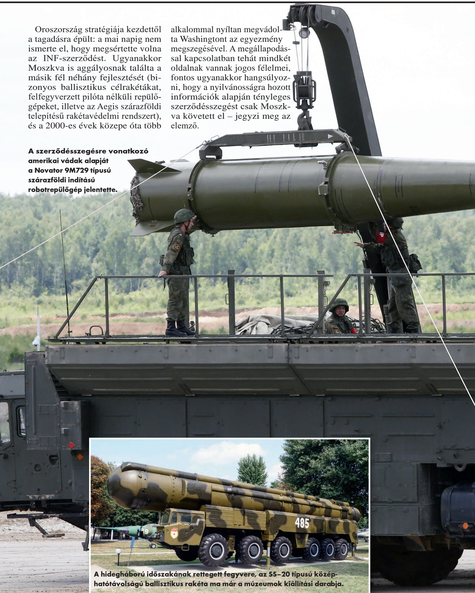
A hidegháború időszakának rettegett fegyvere, az SS-20 típusú közep-hatótávolságú ballisztikus rakéta ma már a múzeumok kiállítási darabja.

A szerződésszegésre vonatkozó amerikai vádak alapját a Novator 9M729 típusú szárazföldi indítású robotrepülőgép jelentette.