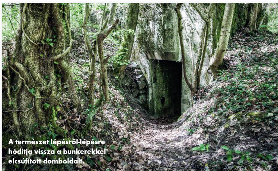
A természet lépésről-lépésre hódítja vissza a bunkerekkel elcsúfított domboldalt.

Véleményük szerint nem kell bolygatni a természet által visszahódított betonépítmények rendszerét, hiszen növényritkaságok honosodtak meg az elhagyott bunkerekben és védett állatfajok a harckocsiárkokban. Az idő majd eldönti, kinek sikerül érvényesíteni az elképzelését, de egy biztos, a sárkányfogak erdeje még évtizedek múltán is idegenforgalmi látványosság lesz.