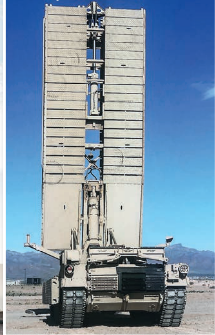
Ma már mindenhol az ollórendszerű hídemeleket használják.

műveleteket is alkalmazó tesztléceket folytatnak. Ha minden simán alakul, 2020-tól a hadsereg és a tengerészgyalogság műszaki zászlóaljai átvehetik az első M1074-eseket, melyek a tervek szerint egy évtizeden belül teljesen felváltják a két régebbi hídrendszert.