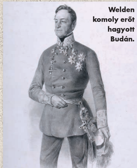
Welden komoly erőt hagyott Budán.

sürgette, erre végül több hónapot kellett várni. A Tisza vonalánál összpontosuló magyar seregek ellentámadási kísérletei ugyanis két kudarc után – Kápolna, Nagykőrös – csak 1849 áprilisának elején hoztak sikert: ekkor három győztes összecsapás eredményeként a főváros közvetlen közelébe szorították vissza a császári erőket. Április 7-én (az isaszegi győzelmet követő napon) Gödöllőn ült össze a haditanács, ahol Kossuth – Pest-Buda visszahódítása érdekében – az osztrákok elleni frontális támadásra tett javaslatot. A főhadiszíntéren harcoló honvédsereg főparancsnoka, Görgei Artúr és környezete ugyanak-