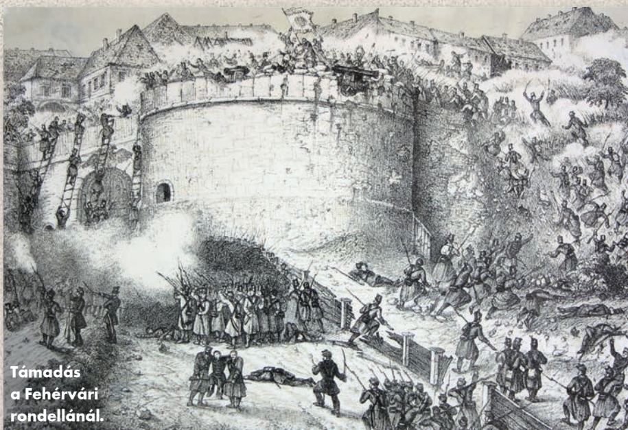
Támadás a Fehérvári rondellánál.

A döntő támadás 1849. május 21-én hajnali három órakor vette kezdetét. A rés ellen Nagysándor József tábor-