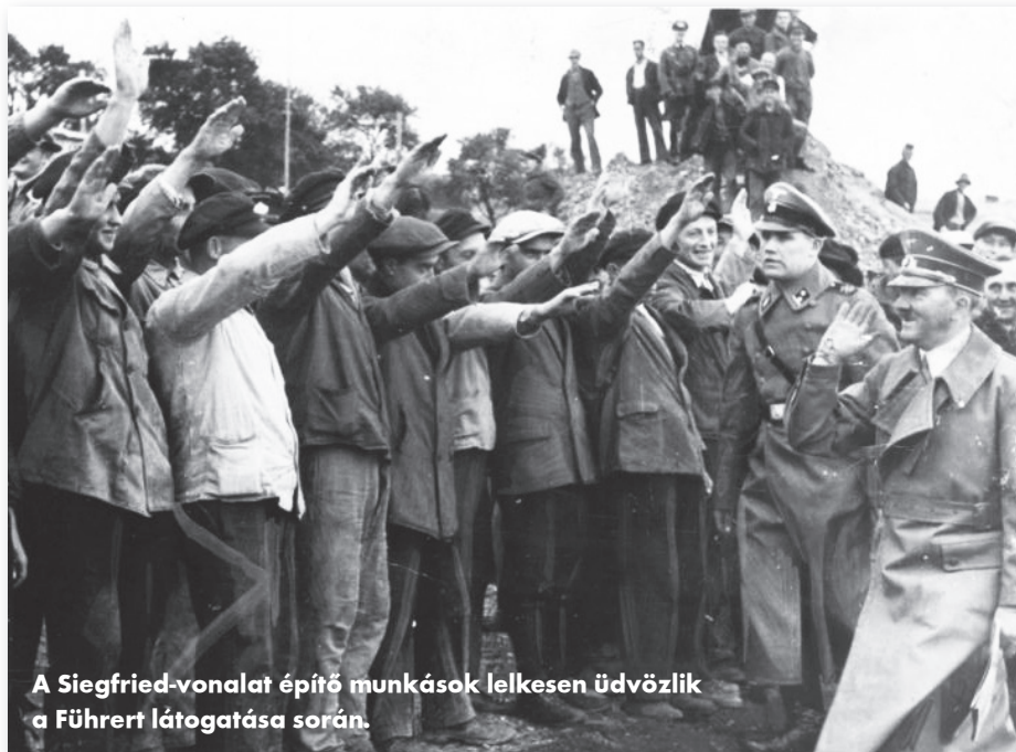
A Siegfried-vonalat építő munkások lelkesen üdvözlik a Führert látogatása során.

Az amerikai gyalogoshadosztály közlegénye törölközőket szárít a betontüskék között futó drótakadályokon.