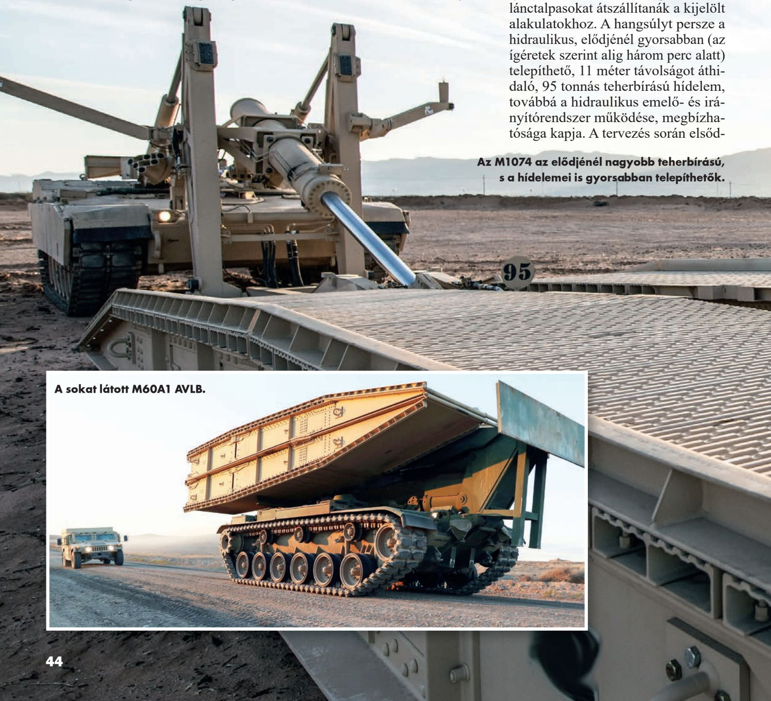
A sokat látott M60A1 AVLB.

Az M1074 az elődjénél nagyobb teherbírású, s a hídelemei is gyorsabban telepíthetők.