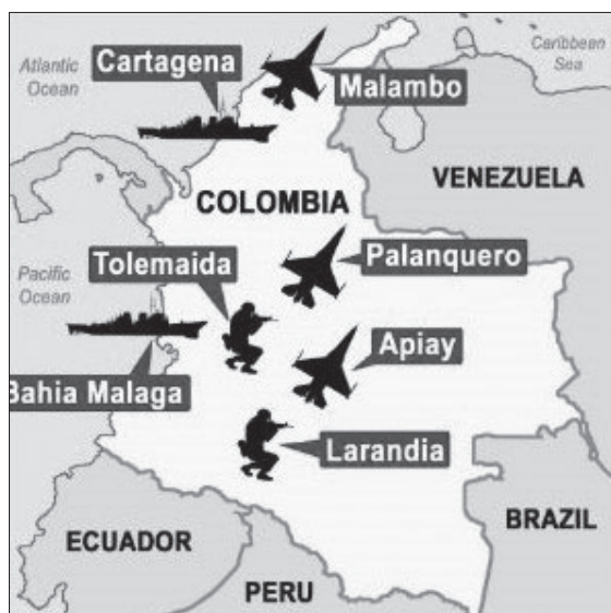
2. ábra Az amerikai erők által használt hét kolumbiai katonai bázis 18

A pénzügyi támogatásnak köszönhetően a két ország közötti katonai kapcsolatok is erősek. Az együttműködési megállapodások többek között katonai képzést, kábítószer-elkobzást, a kommunikációhoz, a hírszerzéshez és megfigyeléshez kapcsolódó műveleteket tartalmaznak. A legnagyobb volumenű együttműködésre 2009-ben került volna sor, amely megállapodás keretében az amerikai erők összesen hét – haditengerészeti, légi- és szárazföldi – bázist használtak volna Kolumbiában. A kolumbiai kongresszus végül nem hagyta jóvá az egyezményt, de ez nem befolyásolta jelentősen a két ország közötti kapcsolatokat, mivel a korábbi egyezmények valójában hasonló jogosultságokat nyújtanak az amerikai erőknek a kolumbiai bázisok használatára. 17