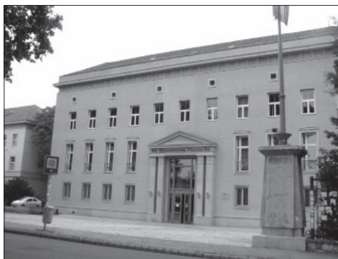
3. kép A katonai középiskola főépülete