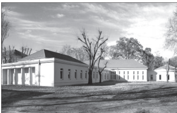
5. kép A hajdanvolt Tiszti Kaszinó