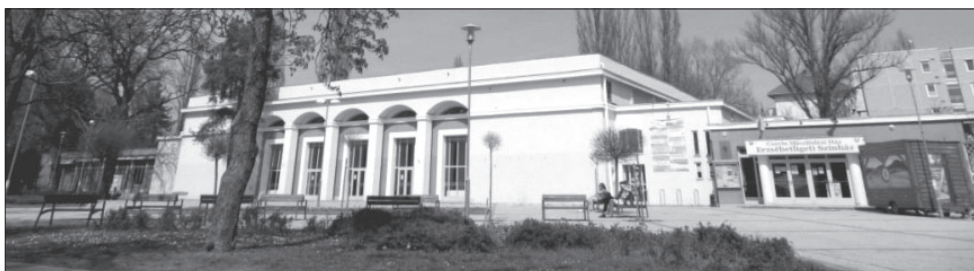
6. kép Az egykori sportcsarnok