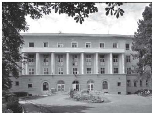
2. kép A kecskeméti Repülőkórház napjainkban

azonban a középrizalit nem éri el a tető vonalát: egy ablaksorral alacsonyabbra tervezték, helyet hagyva a timpanonnak. Hangsúlyos, kiugró zárópárkányzat tagolja a homlokzatot, de ezzel is élénkíti az épület optikai hatását. A párkányzat teljes hosszában nyolc vastkos oszlopra támaszkodik, nem nagy, nehogy nagy árnyékot vessen. A mélység dinamikája a felületből csak kismértékben lép ki: az oszlopsor a reneszánsz egyik legfontosabb eleme volt, a modern építészet kezdetéig használták. A klasszicista homlokzat összhatásánál nem maradhat el a földszinti övpárkány, a kváder hatású lábazati rész, amely az épületen végig körbefut, magában foglalva az öt, boltíves bejárati ajtót. A téglalap formájú ablakok szintenként eltérő méretben, de egyenletes ritmusban követik egymást, kereteik mérsékelten plasztikusak. Az épület monumentális tömbje T alaprajzú madártávlatból. A bejárat hangsúlyozására több lépcsősor vezet felfelé, amely a teret tágítja az íves, kiszélesedő út által.