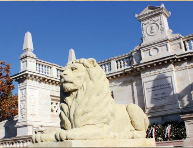
A Batthyány-mauzóleum éber őre

A Fiumei úti sírkertben (Kerepesi temető) áll a Batthyány család mauzóleuma. Az első független magyar miniszterelnök, az 1849. október 6-án kivégzett Batthyány Lajos nyugszik itt családja körében. Özvegye kezdeményezésére 1870-ben áthozták a Józsefvárosi temetőből a 48-as honvédek hamvait, valamint a Váci úti temető halottainak jelentős részét. Ugyanebben az évben került ide a néhai Batthyány Lajos is, aki addig a Belvárosi ferences templom kriptájában nyugodott.