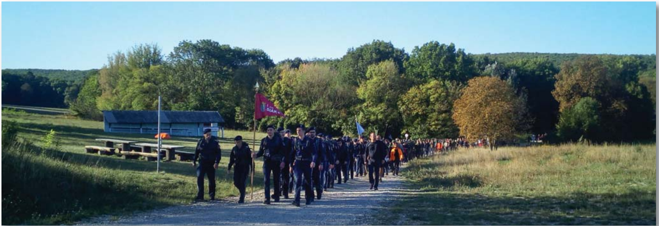
Elstartolt a mezőny

nyitottak meg, és egy átfogó túraismertetőt adtak ki. A sikeres Marcus Aurelius Túra 1994-ig 60 és 100 km-es távjait 1995-ben 40 km-re csökkentették. 2002 óta lehetőség van arra, hogy a résztvevők válasszanak az egynapos és a kétnapos túra között. (Nemzetközi Marcus Aurelius Túranapok 40 és 2×40 km-en).