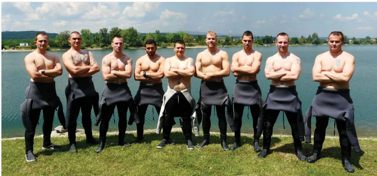
Napfűrdő a parton

Ezáltal tudtam elérni, hogy a szakmai fejlődés és a kihívások terén is a legjobbat hozzam ki a csapatból. Az együtt töltött évek alatt együtt fejlődünk, lépegettünk előre a fokozatokban, végeztük a szaktanfolyamokat, eljártunk merülési szabadjáratokban, így a katonai képzettség mellé civil búvár fokozatokat is szereztünk. Kialakult egy olyan közösség, ami képes volt bármilyen búvárszakfeladat elvégzésére, ahol meg tudtam valósítani azt a kohéziót és szakmai tudást, amit én is láttam abban a csapatban, ahol majd húsz évvel ezelőtt elkezdtem búvárkodni. Úgy vélem, így tudtam méltóvá válni a régi mesterem tanításához és úgy mondhatnám, a ma már nem létező katonabúvár-csoport előtt, amelyről olyan sok jót kaptam kezdeti búváréveimben.