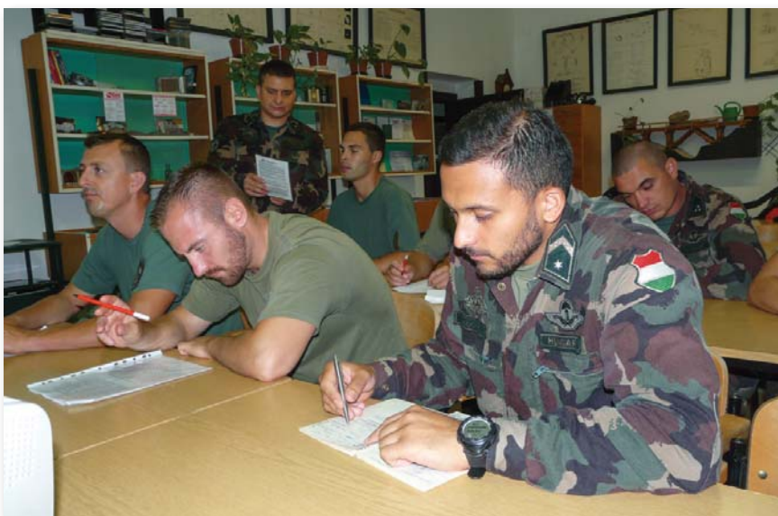
Tantermi oktatás a búvárbázison

A hosszú évek alatt számos alkalommal megfordultam a sajátos családi légkört árasztó búvárbázison, különféle tanfolyamokon, továbbképzéseken, vizsgáztatásokon vettem