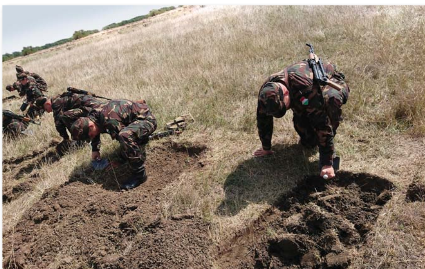
A második kiképzési ciklusban már a gyakorlati és terepfoglalkozásoké volt a fő szerep