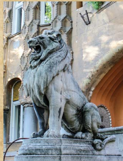
Gépkocsizók hősi emlékműve

A Przemysl erőd védelmének sok magyar katonája elesett. A 2-es tüzérezred állományának emlékére állították a Margit híd budai hídfőjénél a Szódy Szilárd szobrász és éremművész által készített emlékművet, amely egy erődítést eltaposó üvöltő oroszlán bronzszobra, alatta egyszerű „Przemysl” felirattal. Gyóni Géza költő is az erőd védői között szolgált. A keleti frontról küldte haza lelkesítő harci költeményeit. Lírája először a háborút dicsőítette, később azonban eljutott annak teljes tagadásáig. Megrázó verseinek témája a katonák mérhetetlen szenvedése és a háború értelmetlensége. A Fővárosi Közgyűlés 2011. szeptember 28-i határozata alapján a II. kerületi szobor körüli park a Gyóni Géza tér nevet viseli.