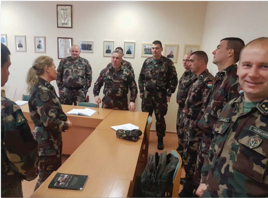
A kurzuson oktató és oktatott együtt tanul

vizsga. E képzettség készesszintű ismerete adja azt a biztonságot, amely lehetővé teszi, hogy a hallgatók már csak az anyag elsajátítására tudjanak koncentrálni, ami nem egyszerű feladat. Az ÖVAT egyik sajátossága, hogy a hallgatók nem egyedül tanulnak. Ezen a tanfolyamon oktató és oktatott együtt tanul, sokszor egymástól sajátítják el a legfrissebb elméleti és gyakorlati ismereteket. Ez biztosítja azt a naprakészséget, amely – többek között – a képzés különlegességét jelenti.