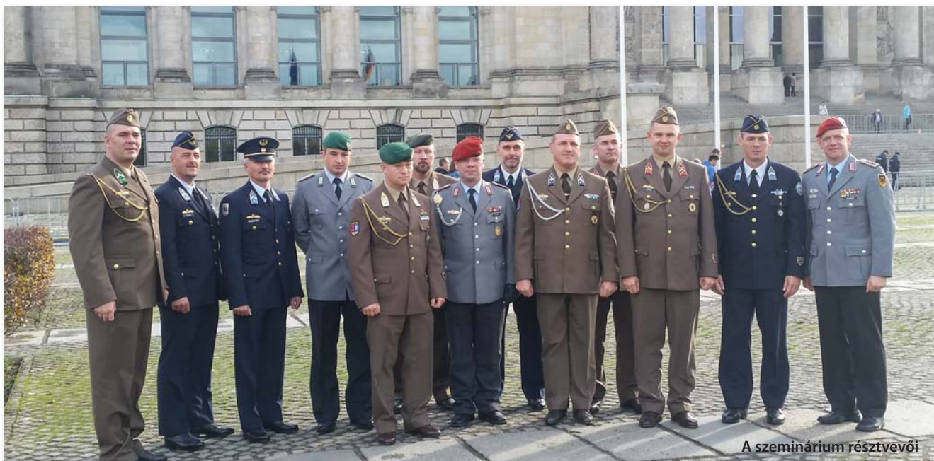
A szeminárium résztvevői