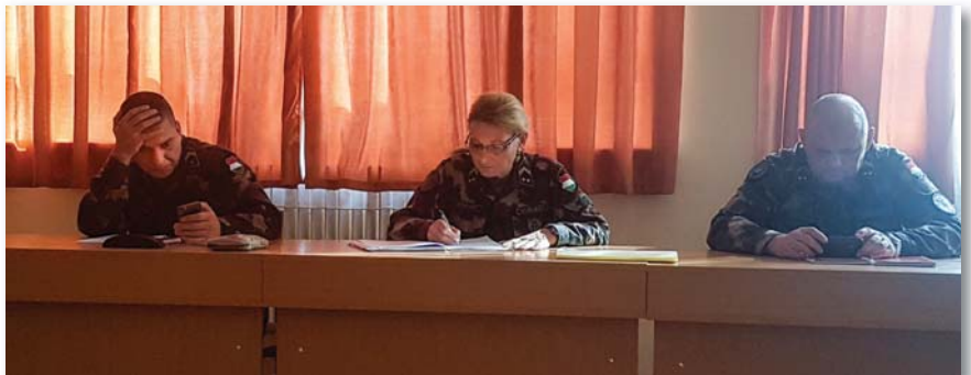
A kurzuson első alkalommal vett részt hölgy