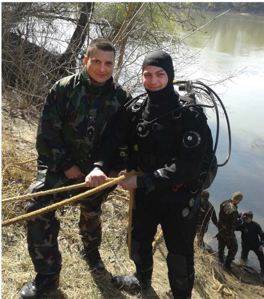
Búváriképzés a Tiszán

fegyelmességük messze meghaladta azt a szintet, amit civil búvároknál tapasztaltam. Összekovácsolt csapatként mozogtak a víz alatt, egyként gondolkodtak a víz alatti mentések gyakorlásánál, és bármilyen vész helyzet esetén nyugodt higgadsággal reagáltak. Katonaként és búvárként is követendő példaképként álltak előttem.