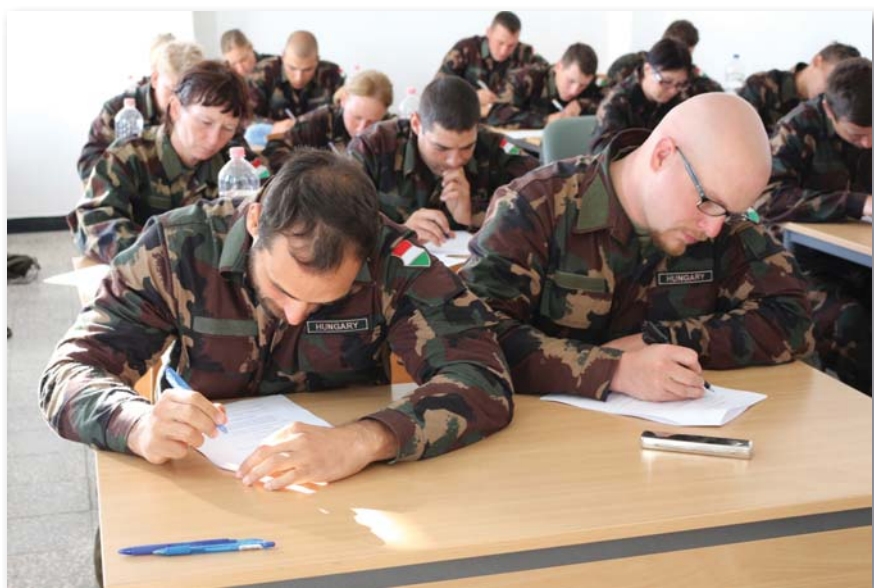
Az első kiképzési ciklusban főleg tantermi foglalkozásokra került sor

A műszaki ezrednél az alapkiképzés 2016. július 4-én kezdődött meg, leendő szentesi és hódmezővásárhelyi újoncok szakasznyi állományával. Az alapkiképzés bizony nem kevés feladatot adott az újoncoknak és kiképzőiknek. Az első kiképzési ciklusban főleg tantermi foglalkozások voltak a ciklusra kiírt alaki foglalkozásokkal, valamint alapfoglalkozatok pisztollyal és gépkarabéllyal.