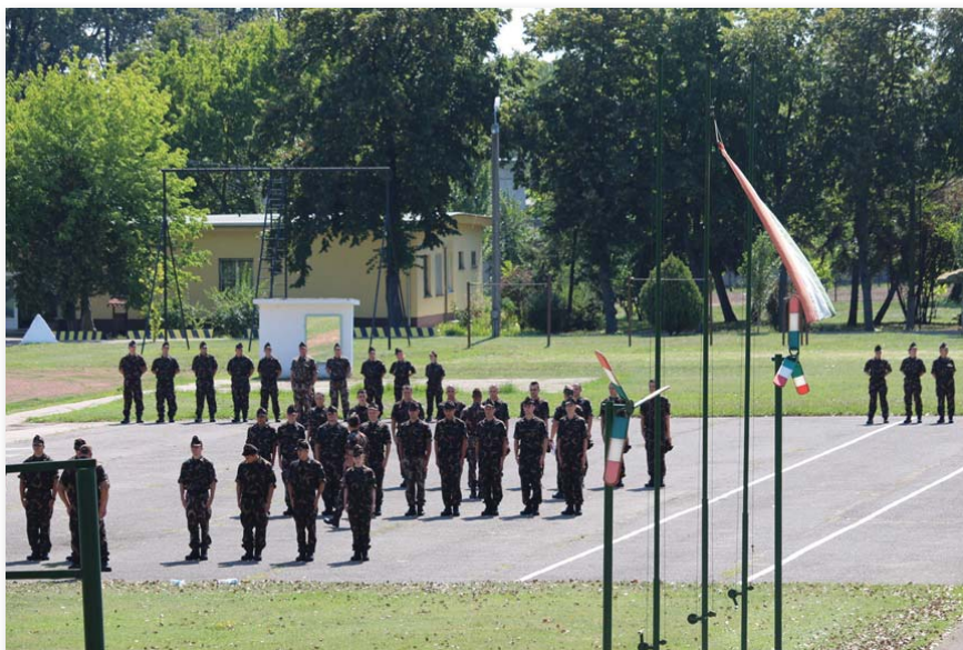
Az alaki fogások és mozdulatok pontos és szabályos végrehajtása is fontos része volt a kiképzésnek

végrehajtását mind egyénileg, mind kötelékben, illetve el kellett sajátítani az alapvető túlélési fogásokat. Az első alapkiképzésünket balesetmentesen és minimális lemorzsolódás mellett sikerült végrehajtanunk. A bevonult állományból egy fő szerződését szüntette meg az alakulata az általunk jelzett súlyos fegyelmi vétség elkövetése miatt, míg egy személy egészségügyi problémája miatt kényszerült megválni az egyenruhától.