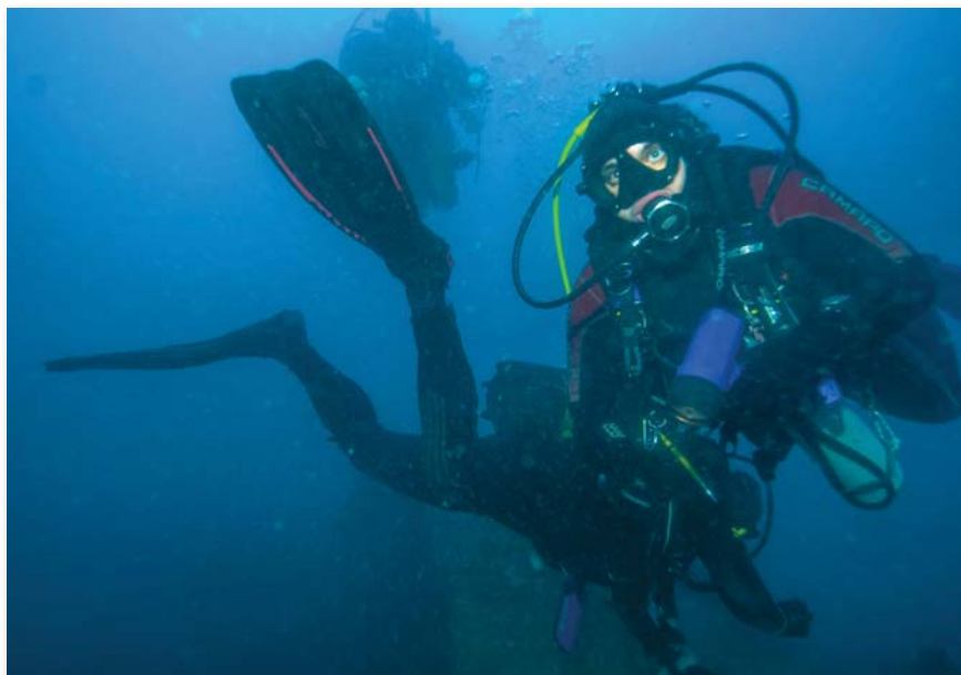
A „csapat” a víz alatt

részt. Itt végeztek azok a búvárok is, akik az esztendőök során az irányításom alatt formálódtak egységes csapatokká, és akikre mindig büszkén emlékszem vissza. A „24-es felderítőbúvárai” 5 : velük számos közös szinten tartó kiképzésen, a dunai és tiszai árvízvédelemben, a Ferenc József-csacirkáló 5 , illetve a Bukura-tavi 6 tudományos kutatóexpedíciók folyamán kovácsolódtunk egységbe. A merülések alatt megtapasztalt kihívások, átélt élmények motiválóak, valamint meghatározóak voltak életünkben. Általuk kitartást, elszántságot, bajtársiasságot tanultunk egymástól.