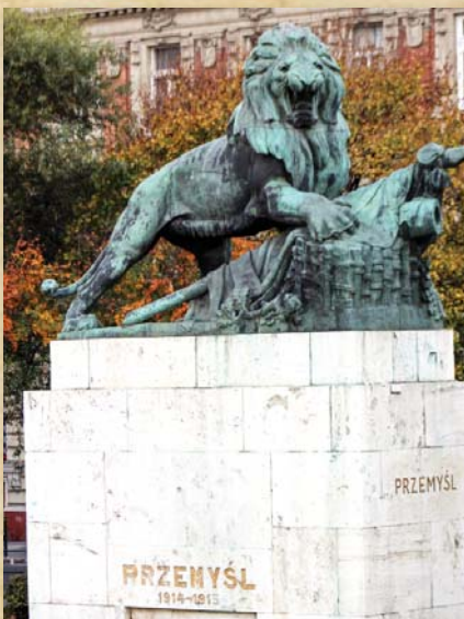
A távoli Przemysl emléke

1848. október 20-án nevezte ki az Országos Honvédelmi Bizottmány történelmünk első vezérkari főnökét, Vetter Antalt, és bízta meg a magyar honvéd vezérkar megszervezésével. A tábornok nevéhez fűződik még a szabadságharc egyik utolsó nagy győzelme, az 1849. július 14-én vívott kishegyi ütközet. A szabadságharc leverését követően külföldre menekült. Részt vett az olaszországi és a poroszországi magyar légiók szervezésében. A kiegyezés után hazatért, majd Pozsonyban telepedett le. Gróf Andrássy Gyula miniszterelnök katonai tanácsadójaként jelentős szerepet játszott az önálló magyar hadsereg megszervezésében. A képen látható síremléke Stróbl Alajos alkotása, Budapesten, a Fiumei úti sírkertben található.