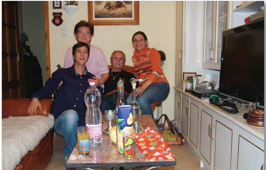
Közös fotó az önkéntes segítőkkel