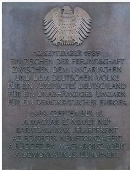
Köszönet a magyar népnek a határ megnyitásáért

– Érdekes volt megtapasztalni, hogy mennyire hasonló problémákkal küzd a Bundeswehr és a Magyar Honvédség. Náluk is kihívás a létszámhiány, illetve a fiatalok megszólítása. Tanulságos volt megismerni azt a filmet, mely néhány újonc életét mutatta be a bevonulástól kezdve. A fiatalokat külső és ún. „GoPro” kamerákkal (mini kamera, ami könnyen rögzíthető ruhára, sisakra stb.) követték, miközben érzéseikről, élményeikről beszéltek. Az erről szóló sorozat a tv-csatornákon volt látható, de a közösségi média felületein is megnézhetők az érdeklődők. A sorozat toborzást segítő eredményességéről konkrét adatokat nem tudtak mondani, de már forgatták a következő „évadot”, amikor is a már megismert katonák mindennapjait követik nyomon az alapképzés utáni időszakban. Több évadon át futó életpálya-filmsorozatot szeretnének elkészíteni, ami hitelesen és őszintén bemutatja a civil fiataloknak, hogy milyen kihívásokkal kell szembenéz-