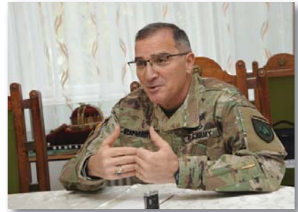
Curtis Scaparrotti vezérezredes, a szövetséges erők európai főparancsnoka

munikációs Szolgáltató Közhasznú Nonprofit Kft. meglátogatása, ahol a tanfolyam résztvevőivel kommunikációs szakemberek készítettek video- és rádióinterjút. A hallgatók kicsit belülről is megismerhették a média világát, betekintheztek a színpalak mögé, és megtudhatták azt is, hogyan gondolkodnak a „mikrofon túloldalán.” A hasznos tanácsok után, az interjúk során mindjárt „élesben” kellett bizonyítani a megszerzett kommunikációs ismeretekből. A Zrínyi Kft. szakemberei különböző mentalitású riporterek szerepeibe bújva igyekeztek hol megnehezíteni, hol megkönnyíteni a