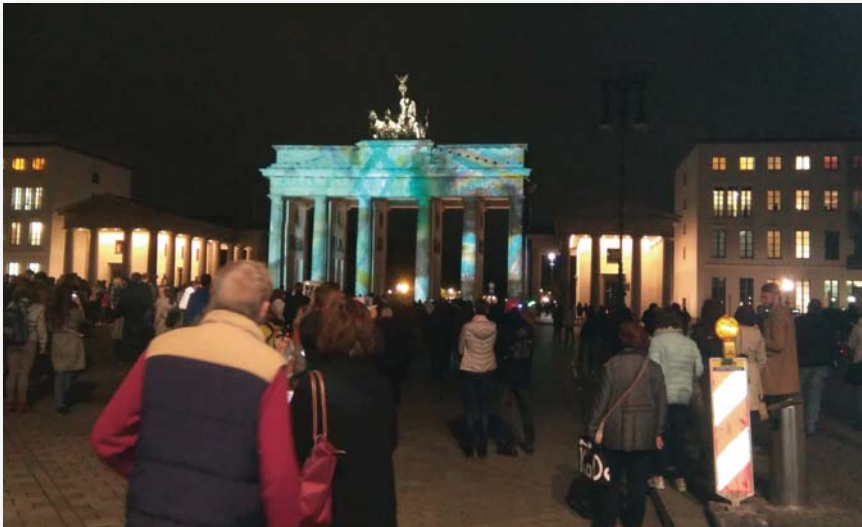
A brandenburgi kapu esti fényben

a civil életben is elismernek és használhatnak.