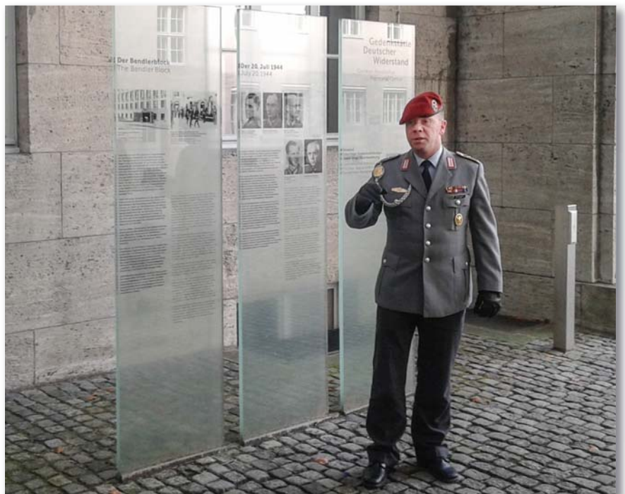
A második világháborús német ellenállás emlékhelye

niük mire igazi katonák lesznek, és hogy milyen lehetőségek várnak rájuk a hadseregen belül.