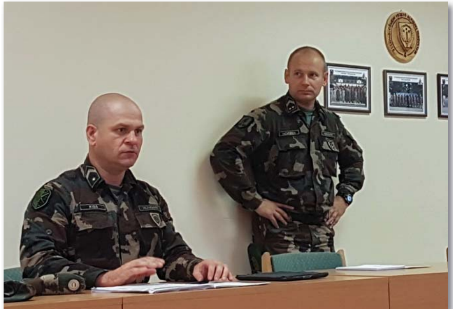
Az ideai tanfolyamon kiemelt szerepet kapott az első modul, a kommunikáció