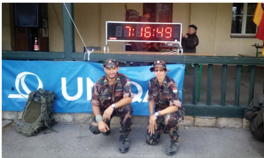
A magyar katonák az időmérő óra előtt

csak egy nevezetességet emeljek ki – Franz Joseph Haydn osztrák zeneszerző szülőháza mellett vezetett el a túra.