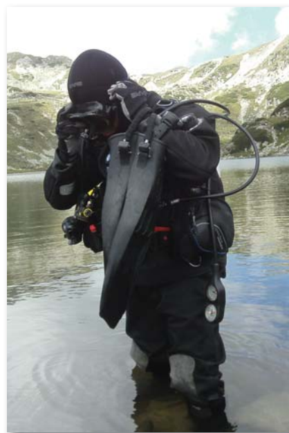
A mesterbúvár teljes harci felszerelésben

Ugyanebben az évben az a megtiszteltetés ért, hogy a Honvéd Vezérkar főnöke „Mesterbúvár” 7 fokozatot adományozott részemre. Ez meglátásom szerint nem kiváltság, hanem felelősség. Olyan lehetőség, illetve kötelesség, amivel élni és nem visszaélni kell. Számomra ez a cím azt jelenti, hogy folyamatosan példát kell mutatnom a katonabúvárok előtt. Pártfogolni kell a mentőbúvárokat, merülésvezetőket – amennyiben az szükséges. Javaslatokkal segítem a munkáját azoknak a rangidős búvároknak, merülésvezetőknak, akik kérik. Az oktatóbúvárokat pedig gyakorlati tudásommal támogatom. Mindazonáltal azt is nagyon fontos feladatnak tartom, hogy különböző publikációk által a katonai búvárkodást, a „víz alatti élet” megismertetését, népszerűsítését elérhető közelségbe hozzam azon érdeklődők – búvárjelöltek – számára, akik a jövőben szeretnék kipróbálni magukat ebben a sportban, illetve ilyen jellegű beosztásokban. Már csak azért is, mert jelenleg ketten rendelkezünk ezzel a