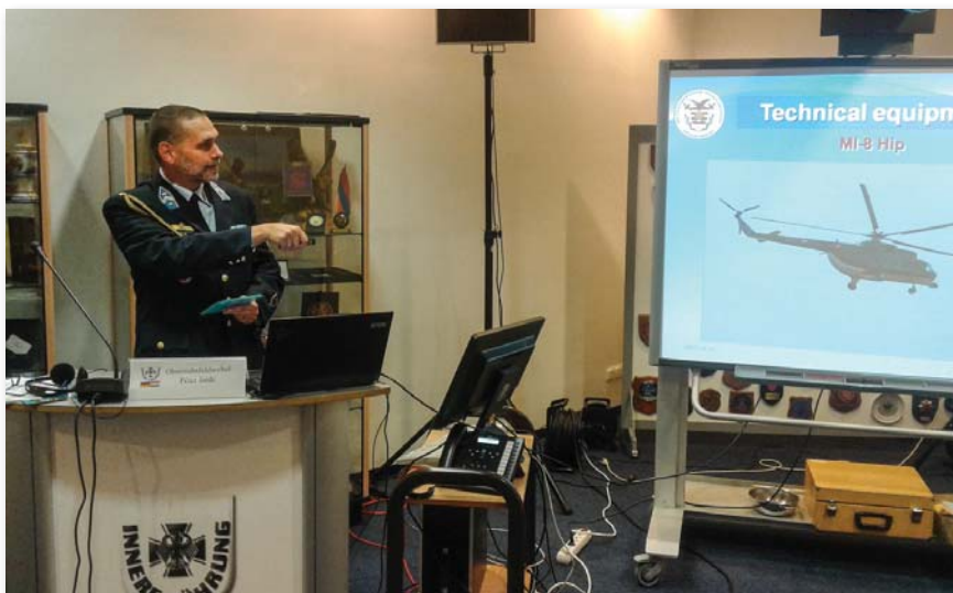
Előadás a Magyar Honvédségről

meg a válasz – és nem is lesz egyszerű megtalálni a megoldást.