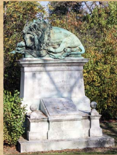
A tábornok álmának vigyázója

A Fiumei úti sírkertben (Kerepesi temető) áll a Batthyány család mauzóleuma. Az első független magyar miniszterelnök, az 1849. október 6-án kivégzett Batthyány Lajos nyugszik itt családja körében. Özvegye kezdeményezésére 1870-ben áthozták a Józsefvárosi temetőből a 48-as honvédek hamvait, valamint a Váci úti temető halottainak jelentős részét. Ugyanebben az évben került ide a néhai Batthyány Lajos is, aki addig a Belvárosi ferences templom kriptájában nyugodott.