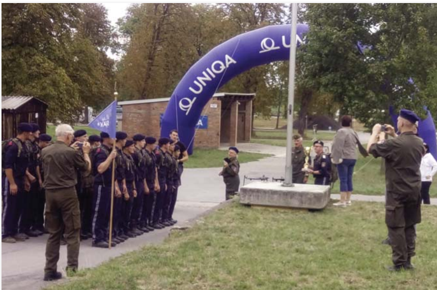
Az eredményhirdetés pillanatai

És végre eldőrdült az a bizonyos ágyú, a startjel. Erős tempóval kezdett a mezőny, mindenki próbált egy kicsit elhúzni, „levegőhöz jutni”, pár kilométer után azonban fellazult a menetoszlop, rendeződtek az erőviszonyok. Mi párban közlekedtünk, igazi versenyszellemet szítva az osztrák kadétokban, akik mindenáron – akár futva is – meg akartak minket előzni, így szinte repültek a kilométerek, elmosódott a táj... Pedig mikor megnyertük az NB II-es túrabajnokságot, megfogadtuk, hogy ezután nézelődünk is, nem csak rohanunk. Így aztán beálltunk a szokott „utazósebességre”, és bámészkodtunk, fotóztunk, hiszen a kollégák kíváncsiak, itthon mindig meg akarják nézni, merre jártunk. Többek között – hogy