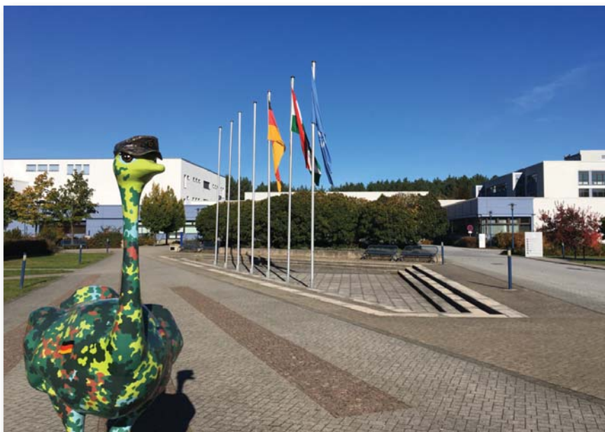
Életkép a Belső Vezetési Központ alakulóterén