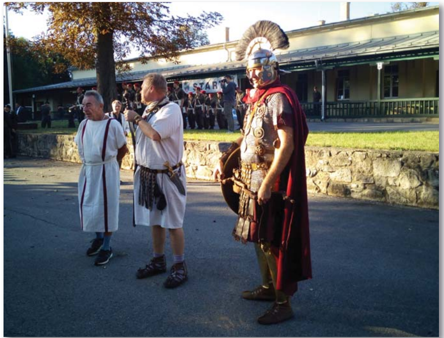
A megnyitó egyik részlete

David M. Shoup tábornok, egy amerikai tengerészgyalogos-hadtest parancsnoka 1963 elején John F. Ken-