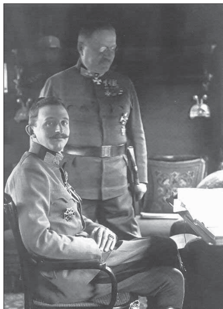
IV. Károly és Arz

Az uralkodó álláspontját a 11. isonzói csata veszteségei visszaigazolták. Az olaszok mintegy 170 ezer katonát veszítettek, és a csatában részt vevő zászlóaljaik átlagosan 50–65%-os veszteséget könyvelhettek el. 28 Megrendítő volt a Monarchia vesztesége is, amely 100 ezer katonára rúgott, ugyanakkor a hősiesség védekezést bizonyította, hogy a hírhedten szigorú eljárás után elnyerhető Mária Terézia Katonai Rend Lovagkeresztjében öten részesültek, a Parancsnoki Keresztet pedig egy tábornok kapta meg. 29