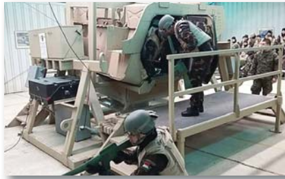
A kadétek kiképzés közben

A második héten megkezdődött az összekovácsolás a grúz zászló-