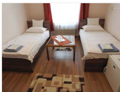
Megújult számos szoba...

Egyik jelentős fejlesztés a nyári gyerektáborok helyének kialakítása. A faház pihenőben található, lerom-