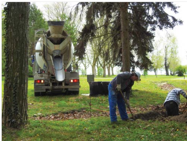
Épül a szabadtéri fitnesspálya