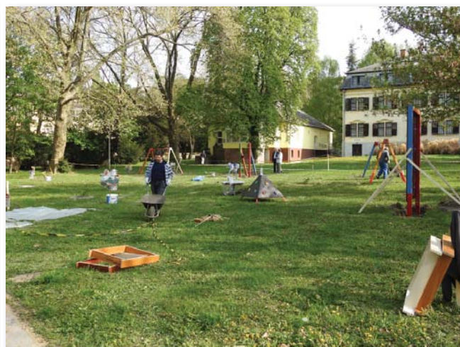
A Hotel Platán mögött egy új játszóteret alakítottak ki