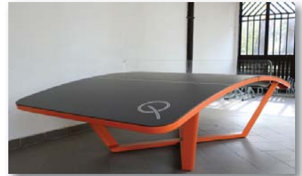
A vendégek körében várhatóan népszerűek lesznek a teqball-asztalok

wifirendszer, az egész strand területén és minden szobában elérhető wifivel várják majd a vendégeket, emellett kiépítik a parton a feltöltőkártyás fizetési lehetőséget.