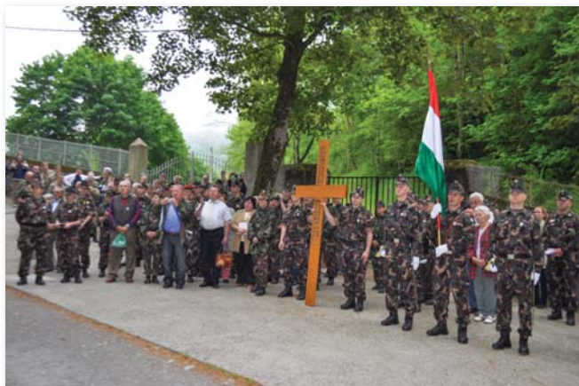
Magyar katonák a Lourdes-i Nemzetközi Katonai Zarándoklaton