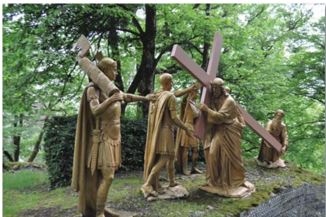
A keresztúton életnagyságú szobrok elevenítik fel az Úr szenvedésének állomásait