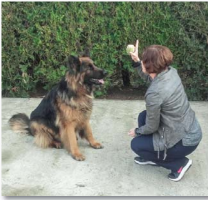
A család kedvencével, a hároméves ónémetjuhász kutyával

ez más szakterületre is igaz. Személy szerint például nem szeretem, ha valamihez nem tudok hozzászólni a saját szakterületemen. Igyekszem mindent a legszélesebb körben megismerni, és örülök, ha őszintén érdeklődő ügyintézővel találkozom, szívesen vezetem be a szakma rejtelseibe, mert azt gondolom, ha látja, hogy mi értelme van annak, amit kérünk, akkor talán szívesebben eleget is tesz neki. Én is készséggel meghallgatom, hogy a más szakterületen dolgozó kollégának mi tölti ki a napjait, mert hiszem, ha belátunk a másik munkájába, akkor jobban tudunk együtt dolgozni, jobban tudjuk segíteni egymás munkáját.