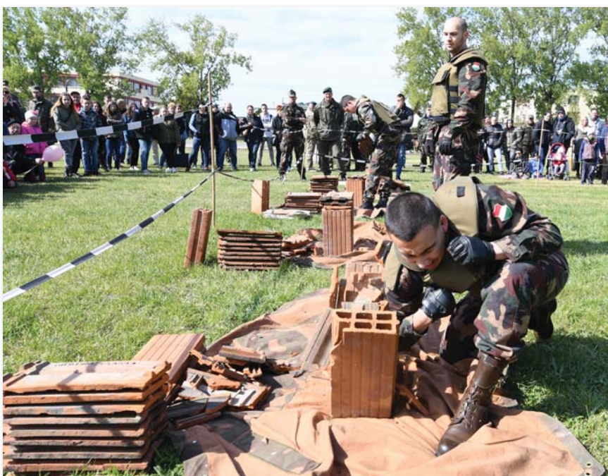
Nagy érdeklődés kísérte a különböző sportversenyeket és -bemutatókat

Kollár László törzszászlós