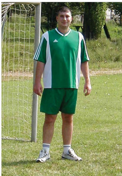
Az altiszt szabadidejét szívesen tölti sportással és kirándulással

Afganisztánban kétszer is. Az ISAF keretében eltöltött időt fordulópontnak tartja katonai pályafutásában; itt érezte először, hogy nem egyszerű beosztott, hanem odafigyelnek rá, hallgatnak a tanácsaira és tőle várják a problémák megoldását. Elsőre szokatlan volt ez a helyzet számára, ám tapasztalatainak és nyílt személyiségének köszönhetően hamar felnőtt a feladathoz.