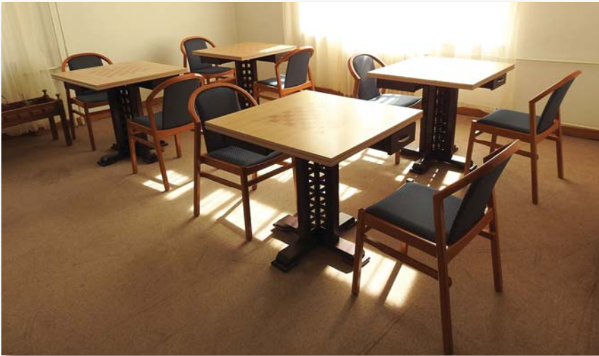
Sakkszoba a Hotel Aranyhídban