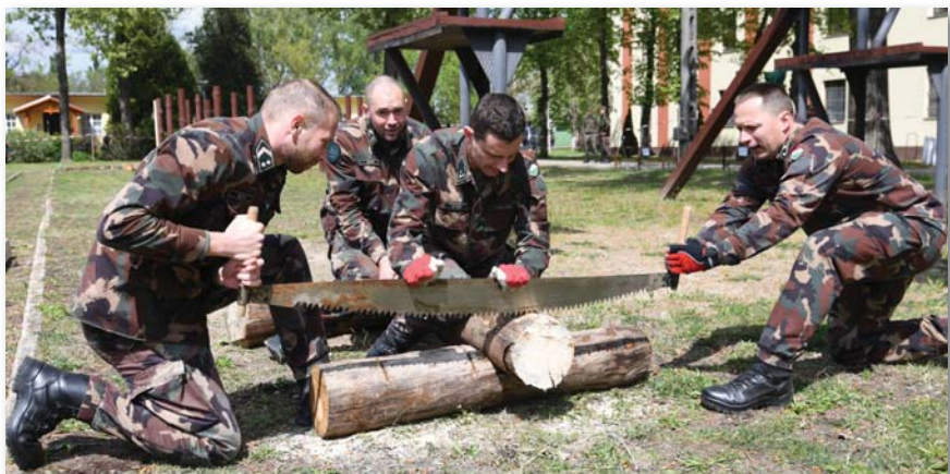
Megmérettetés a „Vörös Bika” műszaki versenyen

A dicső eleinkre való méltó emlékezésen túl a rendezvény hozzájárult a honvédség, a rendőrség és a polgári lakosság közötti kapcsolat szélesítéséhez, elősegítette az alakulat életének megismertetését, a honvédség népszerűsítését és a szolgálatvállalás lehetőségének felajánlását a fiatalok körében. Az idelátogató vendégek betekintheztek a katonák életkörülményeibe, megismerhették rendszeresített technikai eszközeinket. Az elmúlt évek hagyományaihoz híven a műszakiak napján ebben az évben is – színes katonai, sport- és kulturális programok révén –