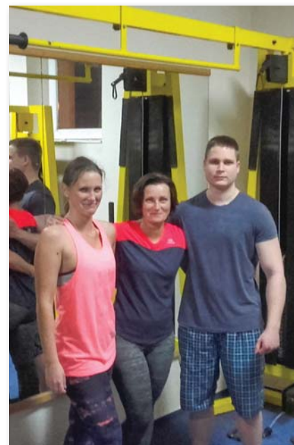
Példája nyomán a lánya és a fia is megszerette ezt az edzésformát

Ügyvitelnek sem alkalmas mindenki, mint ahogy ez más szakmák esetében is igaz. Van, aki megőrül már attól a gondolattól is, hogy egy íróasztal mellett üldögéljen és írogasson, vagy éppen „nem áll rá az agya” erre az egész rendszerre. Nos, annyi bizonyos, kell hozzá türelem jócskán, és nemcsak a papírokhoz, de néha az ügyintézőkhöz is, hiszen ahány ember, annyiféle, és nem mindennap vidám az ember. Szóval tudni kell alkalmazkodni, akarni segíteni a kollégáknak. Hogy milyen a jó ügyvitel? Azt hiszem, fontos, hogy szeresse az „írogatást”, fontos, hogy tudjon pontosan dolgozni – mert ahol számokkal dolgoznak, ez elengedhetetlen, hiszen a (vissza-)keresésnek ez adja az alapját. Legyen benne rendszeret, érezzen készletet arra, hogy a saját szakterületén a lehető legtöbbet tudja. Azt gondolom, minél többet tudunk arról, amivel foglalkozunk, annál jobban végezzük a munkánkat. Mert, ha már egyszer csinálunk valamit, ráfordítjuk az időt, akkor csináljuk jól! Bár, ha belegondolok,