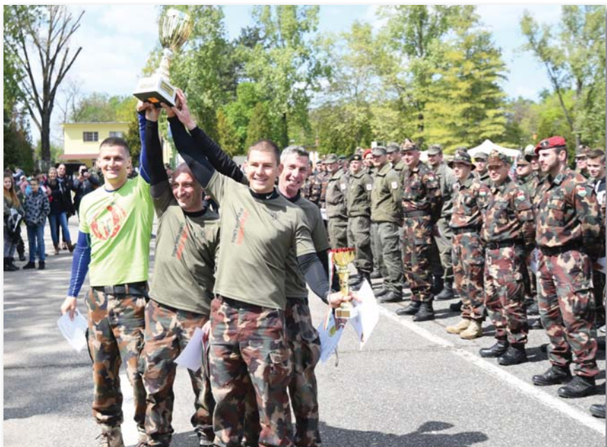
A versenyt a szentesi Honvéd Rákóczi Sportegyesület Spartan Race csapata nyerte

A számos program közül kiemelkedett a már évtizedes múlttal rendelkező „Vörös Bika” műszaki verseny, amely idén nemzetközivé nőtte ki magát. A migrációs válságkezeléshez kapcsolódóan hazánkban állomásozó, műszaki útépitési feladatokat végrehajtó osztrák műszaki kontingens három csapattal képviseltette magát. A verseny két részre tagolódott, két különböző megmérettetési feladatsorral. Az előfutamban öt, míg a döntő hét feladattal állt, ami nemcsak