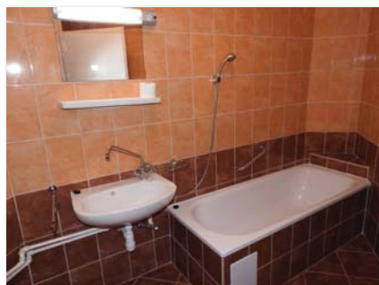
... és fürdőszoba