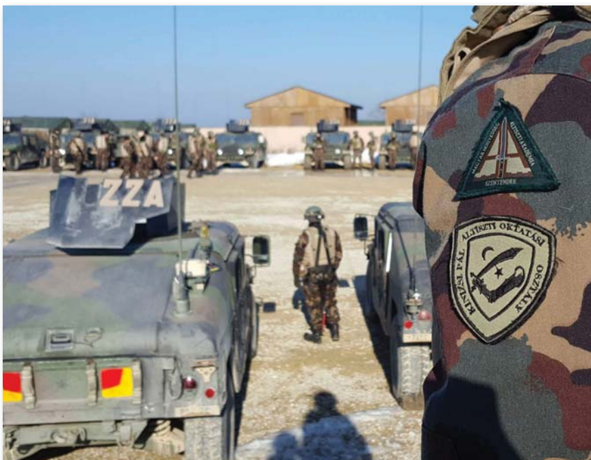
Az idén az Altiszti Akadémia altisztjelöltjei is lehetőséget kaptak a németországi gyakorlaton való részvételre

Az első felkészülési hét elején a JMRC vezetése üdvözölte az állományt, majd a magyar katonák megismerkedtek a laktanya főbb részeivel. A hivatásos állomány egy rövid, háromnapos tanfolyam után döntőki beosztásba került (O/C). Feladatuk a magyar alegység tevékenységének folyamatos megfigyelése, értékelése és tanácsadás volt. Ez idő alatt a hallgatók részére kiosztották a fegyvereket és egyéb felszereléseket (sisak, hálósák, mellény, camembak, térdvédő stb.). Az egynapos zsák összeállítás után a harcászati felszerelés hordmódjait gyakorolták