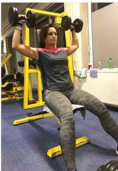
A törzszászlós heti három alkalommal edz a konditeremben

Sokan úgy vélik, hogy az itt dolgozók a postázandó, futárral küldendő és érkező anyagokat írogatják különböző nyilvántartásokba, és osztják ki az ügyintézőknek, valamint olyan elvárásokat támasztanak, amiknek a mindennapok feladatmegoldásában semmi értelme, sőt még hátráltatja is azt. Azt is hallottam már, hogy az ügyvitelen csak írogatni kell. Nos, igen, van benne igazság, csak éppen nem mindegy, hogy mit, mikor, hova és hogyan. Az ügyvitel rendszert visz a mindennapi munkavégzés rengetegébe. Vannak, akik nyűgnek, feleslegesnek tartják az