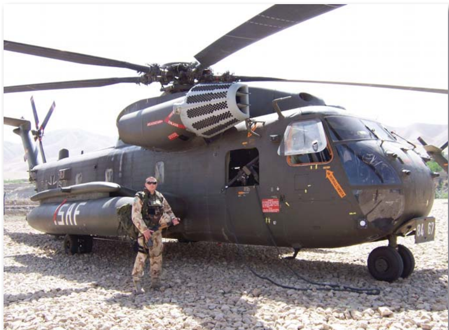
Az ISAF keretében eltöltött idő meghatározó volt az altszti életében

vett angol nyelvtanfolyamon, valamint vegyivédelmi szakmai átképzésen, és számítógép-alkalmazói tanfolyamon is fejlesztette tudását. 2009-ben szerzett labortechnikusi képzettséget, és az idén végezte el az Összhaderőnemi Vezető Altszti Tanfolyamot. Rendszeres tagja a NATO Reagáló Erő (NATO Response Force – NRF) készenléti állományának; az NRF minősítő gyakorlatai keretében szinte egész Európát bejárta már. Misszióban négy alkalommal szolgált, Ciprus és Bosznia mellett