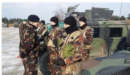
A gyakorlatot a hallgatói állomány kiválóan végrehajtotta

jelöltek számára, hogy mielőtt őrmesterek, illetve hadnagyok lesznek, komoly tapasztalatokat gyűjtsenek nemzetközi környezetben mindazon eszközök tekintetében, amelyek akár