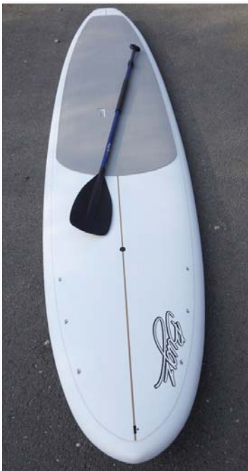
Hat „stand up paddle” (evezős szörf) beszerzése van folyamatban

lott állapotú faház május folyamán teljes körű felújításon esik át. A belső udvarban játszóház lesz, kialakítják a szállóhelyeket, vizesblokkokat, második ütemben, jövő tavasszal pedig felújítják majd az éttermi részt is. A nyár folyamán 9-10 turnusban (egy turnus 8 nap, 7 éjszaka), teljes ellátással, tanári és egészségügyi felügyelettel, izgalmas programokkal várják majd az igényjogosultak 8–12 év közötti gyermekeit, hetente 50-60 főt. A táborokat az MH RKKK szervezi. A Magyar Honvédség Szociálpolitikai Közalapítvánnyal kötött együttműködési megállapodás alapján a táborozásban részt vevő hátrányos helyzetű családok gyermekenkénti költségeit nettó