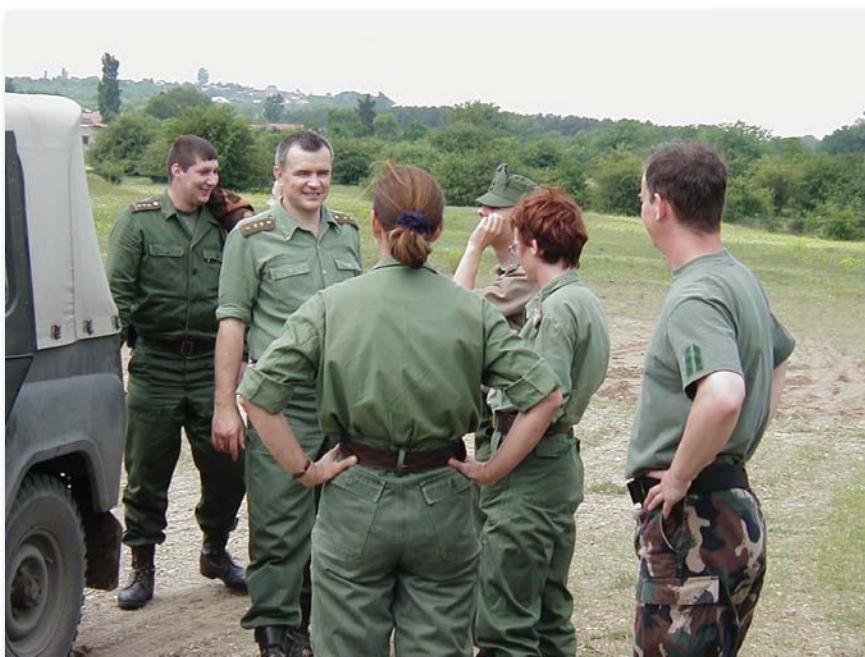
A törzszászlós meggyőződése, hogy a feladatokat rugalmasan kell kezelni és a legjobb tudás szerint végrehajtani