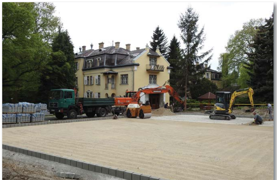
Készül az új parkoló

A szezon kezdetére a strandon is nagyon sok fejlesztés valósul meg. Elkészül a Hotel Napfény előtti területen a homokos plázs, ahol 200 napágy és 100 napernyő várja majd a vendégeket. A gyermekeknek vízfelületre telepített játékokkal kedveskednek, több helyen lesznek kitéve felfújható medencék, a homokozók környékére játszóházak kerülnek. Az elmúlt évben vásárolt elektromos hajó mellé idén egy újabb hajó érkezett, valamint folyamatban van hat „stand up paddle” (evezős szörf). A strandon kap helyet három teqball-asztal, valamint három kültéri pingpongasztal is. Kiemelt fejlesztés volt, hogy megújult az internet és a