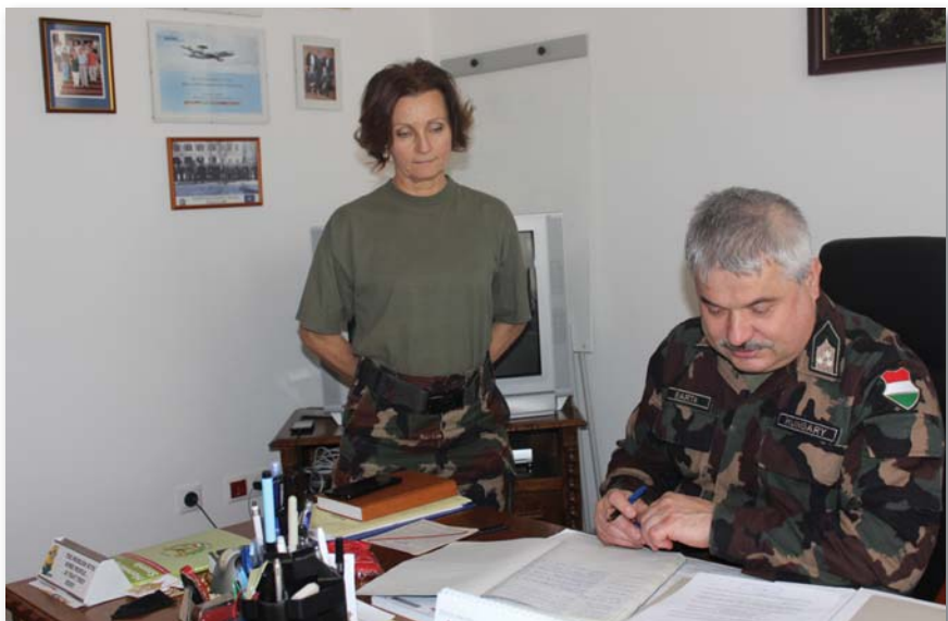
Az ügyvitelések napi kapcsolatban vannak a parancsnokokkal

kérem a felvételemet a seregbe. Nos, én az utóbbit választottam. Pénzügyes létemre lett is szép új beosztásom: híradó és informatikai tiszthelyettes. Ez a beosztás talán akkor jelent meg először az állománytáblákban, legalábbis azelőtt nem hallottam róla. Ez ma már nem jelent semmi különösét, de annak idején, amikor egy alakulatnál alig volt számítógép, talán csak a vezető beosztásúak asztalán lehetett ilyen találni, és azok is csak hajlékony lemezzel működtek, még senkinek