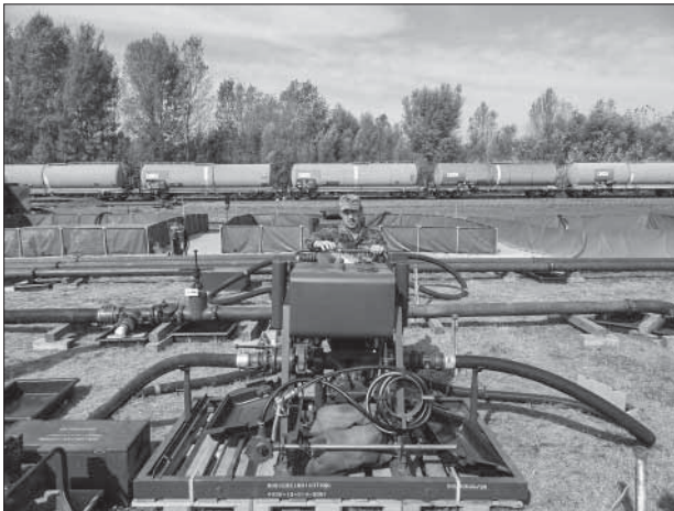
A tábori üzemanyagraktár

A TÜZAR műveletének támogatására létrehozott logisztikai egység/alegység (log. z., log. szd.) kötelékében, illetve önállóan tevékenykedő tábori üzemanyagraktár, ~500–1200 m 3 tárolókapacitással. A TÜZAR a WARDAM II/MPRE 22 típusú mobil csővezeték háborús sérüléseit javító felszerelés elemei (szivattyúállomások, csővezetékkelemek, csőszerelvények), valamint hajlékonyfalú üzemanyagtartályok bázisán kialakított tábori üzemanyagraktár.