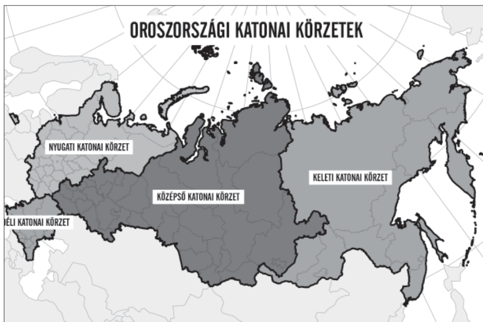
4. ábra Oroszország katonai körzetei

Forrás: Az eredeti térképet – https://www.stratfor.com/image/russias-military-districts (Letöltés időpontja: 2016. 08. 20.) – átszerkesztette Somogyi Tamás