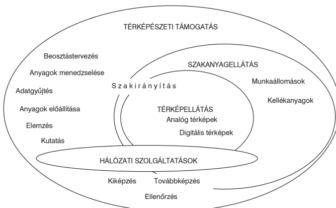
3. ábra A térképészeti támogatás rendszere (Szerkesztette: Szalay László)

A térképészeti támogatás a katonai szervezetek vezetőinek döntéshozatalát segítő, illetve a katonai szervezetek feladatainak végrehajtásához szükséges térképészeti anyagokkal és információkkal történő ellátással kapcsolatos tevékenységek összessége, amely magában foglalja a szakirányítást, a szakbeosztások tervezését, a térképészeti anyagok élethosszi menedzselését, a térképek és információk gyűjtését és előállítását, a szakanyagellátást, a hálózati szolgáltatásokat, a ki- és továbbképzést, a kapcsolódó kutatási tevékenységet, továbbá mindezen tevékenységek ellenőrzését, valamint az e feladatok végrehajtásához szükséges szervezetek kialakítását és működtetését.