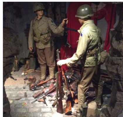
A gyűjtemény egy részlete

Az Amerikai Nyugat címet viselő gyűjtemény egyik vitrinében a bölényvadászok fegyvereit láthatjuk. Megtekinthetők a hírességek, Buffalo Bill, Annie Oakley, Jesse James fegyverei, míg egy következő tárló a korabeli Colt és Winchester típusokat mutatja be. Itt