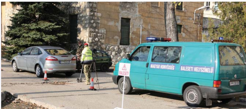
Dolgoznak a helyszínelők

A katonának a szakszerű helyszíneléshez szükséges tudást négyhetes tanfolyamon sajátítják el. A KRK és a rendőrség jó kapcsolatának köszönhetően a