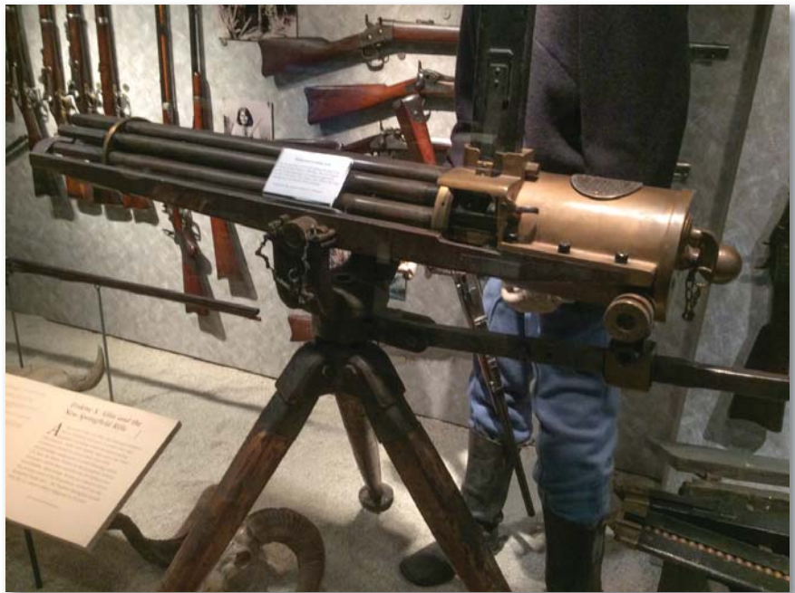
A kiállított fegyverek révén végigkövethető az Egyesült Államok története

A Mindig éber en nevű tematika a második világháború eseményeinek a fegyvereivel kezdődik, majd Koreával, Vietnammal és a Sivatagi Vihar hadműveleteivel folytatódik. Itt láthatók a nagy fegyverfejlesztők, Browning, Thompson, Garand és Ruger típusai is. A második világháborús résznél elkülönített tárlóban, a harci események tükrében helyezték el a tengelyhatalmak, valamint az Egyesült Államok fegyvereit. A német fegyverek tekintetében számos Mauser-változat található. Köztük az első világháborúban is használt híres M 98k, valamint egy 1932M Mauser pisztoly is, amelynek fatokja válltámaszul szolgált. Vannak olasz Beretta és Brescia gyártmányú fegyverek, de itt kaptak helyet a cseh típusok, a lengyel Radom által gyártott eszközök, és a magyar fegyvergyár 37M pisztolya is. Japán fegyverei közül látható a Type 14 Nambu pisztoly is. Található még itt több brit gyártmányú Enfield-pisztoly és -puska, valamint dzsungelharca szánt karabély is. Az amerikai vitrinben számos Smith & Wesson pisztolyt állítottak ki, valamint különböző Springfield-fegyvermodelleket, amelyek közül a legismertebb a .30 űrméretű öntöltő M1 Garand volt. Egy második világháborús dioráma is látható korabeli fegyverekkel. A sok ismert fegyver között látható a híres német 7,62 mm űrméretű MG42 típusú géppuska, amelyet nagy tűzsebessége miatt villám-géppuskának hívtak. Kiállították az