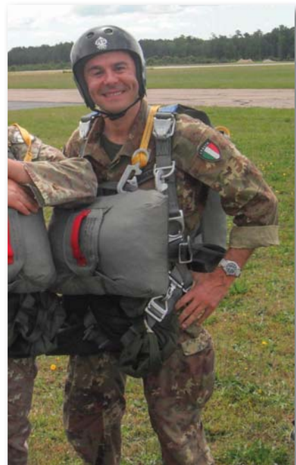
Ejtőernyős ugrásra készülve

Az adminisztratív beosztások után eljött az általa már bizony nagyon várt küldetés: a NATO iraki kiképző missziójában jeleskedik, vív ki sikereket. Az úgynevezett „kissmissziók” kora számára lejárt, így évekre tagja lesz a NATO olaszországi Gyorsreagálású Hadtest állományának, majd