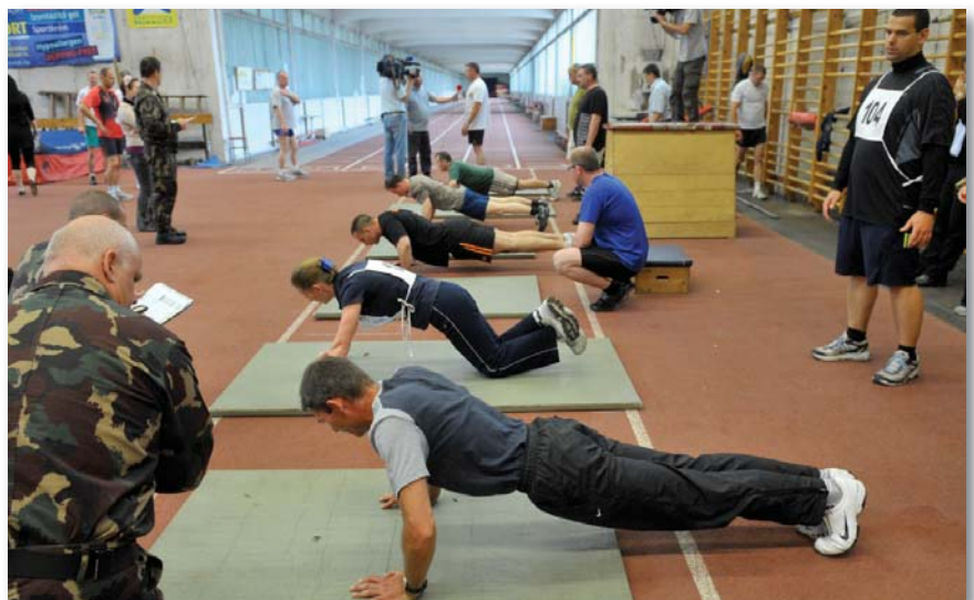
A fizikai állapotfelmérés egyik fázisa

Volt szerencsém tanulmányokat folytatni az Amerikai Egyesült Államokban a tengerészgyalogság kötelékében, raj-, illetve szakasz szinten. A minősítő vizsgák mindkét esetben járőrtípusú menetgyakorlatok voltak. Kiképző altisztjeink fő szempontja a valóság-hű helyzetek megteremtése volt. Fizikai és mentális felkészülésünk minden mozzanatát beillesztették e feladatokba. Kötelékkiképzésünk végére rendelkezünk a megfelelő fejlettségi szinttel a kondicionális képességek, koordinációs képességek, stressz-, valamint monotoniatűrőképesség területén. Nagy örömmre szolgál, hogy annál az aleggségnél, ahol szolgálatot teljesítettem és teljesítek, honosítani tudtam ezt az ellenőrzési módszert. Eddig minden kiképzési időszaknál azt jeleztem, hogy az építkezés időszakát folytatni kell, de a kötélkiképzés