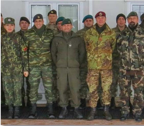
A nemzetközi törzsben végzett munka kiváló lehetőség a tapasztalatszerzésre

lem a feladatokat mind hazai, mind nemzetközi környezetben. Igyekszem egy lépéssel mindig előrébb járni. Ezt a módszert alkalmazom a privát életben is, de így igyekszem eljárni a jelenlegi beosztásomban, itt, a koszovói misszióban is.