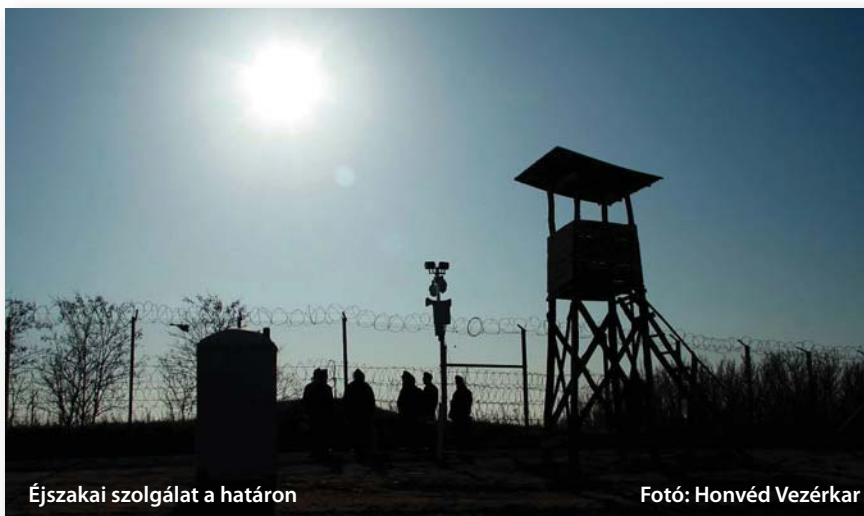
Éjszakai szolgálat a határon

Az esti szolgálatba induló állomány az eligazítást követően, a szabályzatban meghatározottak alapján teherautóra száll, a szektorparancsnok a vezető mellett foglal helyet; felbőg az Ural motorja, majd a jármű elhagyja a tábor – az esti sötétségben a kijelölt határszakaszra (szolgálati helyre) indul. A váltást követően a szolgálat a kerítés melletti kavicsos manőverúton, fokozott figyelemmel megkezdí a járőrözést a meghatározott szakaszon. A környéken csend honol, csak a távoli faluból hallatszanak hangfoszlányok.