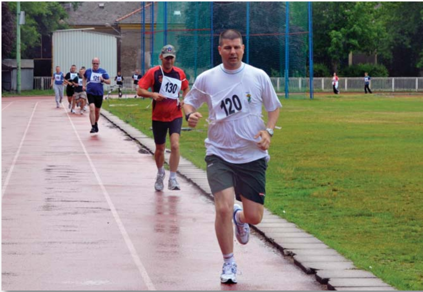
A fő ellenfél a stopper

katonáinak leterheltsége igen nagy, ezért a kiképző állománynak keresnie kell a megoldást az időhiányból adódó minőségromlás kiküszöbölésére. Erre remek módszer az elméleti tudásnak a gyakorlati feladatvégrehajtás közben történő ellenőrzése. E módszert követve rögzül az elméleti anyag, egyben megtapasztalja a katona, hogy mit is jelent az elmélet a gyakorlatban, és nem utolsósorban a fizikai felkészültsége is fejlődik. Ezt a módszert javasolom harcászati, lövészeti foglalkozásoknál súlyozottan alkalmazni. Míg az alapkiképzés folyamán a fizikai állóképességet megcélzó mozgásanyagok voltak előtérben, a szakalapozó időszak utolsó harmadában, a gyakorlati oktatások segítségével az alapbeosztást támogató foglalkozásokat kell alkalmazni. Gondolok itt a menetgyakorlatok, a katonai közelharc-, valamint az akadálypályagyakorlatok integrálására a már említett harcászat, lökiképzés kiképzési ágakba. A szakalapozó kiképzés utolsó fázisát a kiképzéssel foglalkozó szakállomány a kötélkiképzés előszobájának is tekinti. Nem kivétel ez alól a katonai testnevelés sem. Ezen időszak végére meg kell alapoznunk a kötélkiképzés feltételeit.