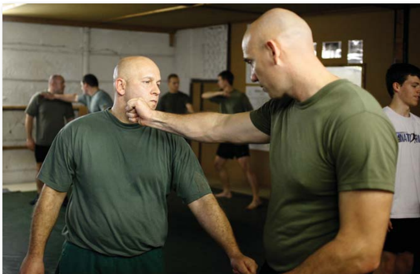
Erő, fegyelmezettség, motiváció

vetel. A kezdetektől idáig vezető út nagyon rögzös, kihívásokkal tarkított, ezért nekünk, altiszteknek maximálisan képesnek kell lennünk arra, hogy a katonai életpálya minden szakaszában biztosítani tudjuk a fizikai és mentális felkészültséget. E képesség különösen fontos pillére a katonai testnevelési kiképzés.