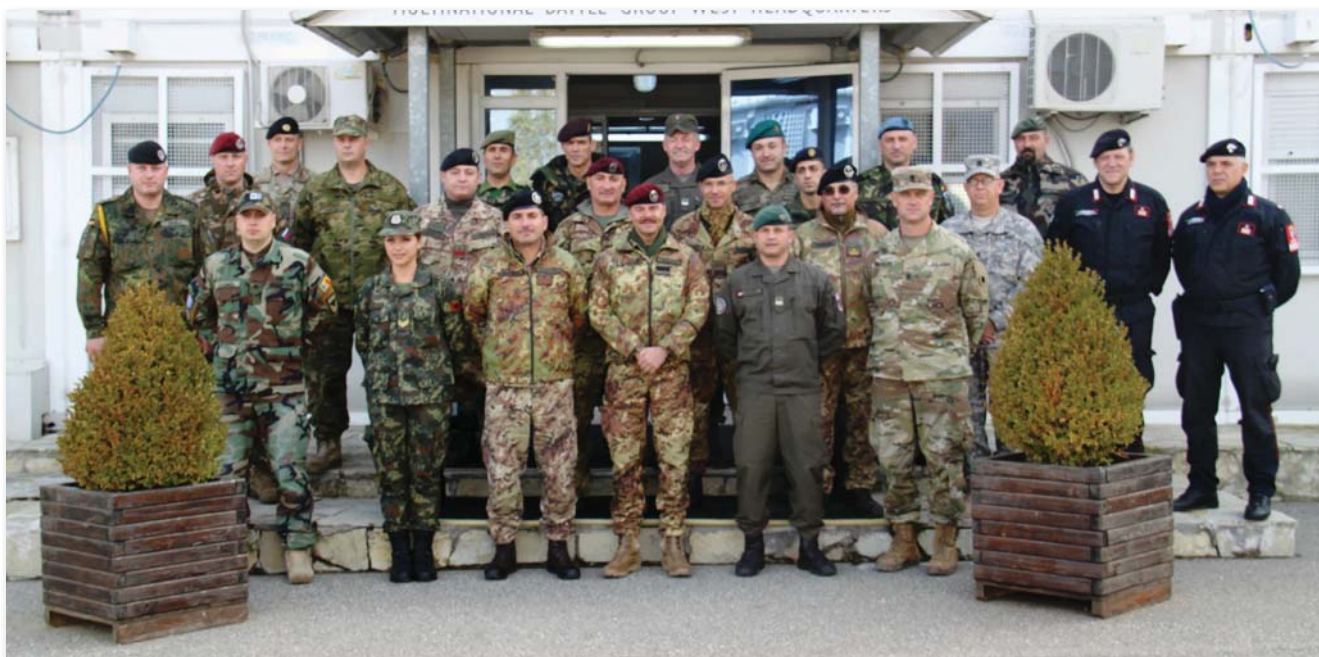
Katonársaival a KFOR-parancsnokság előtt

már vezénylőzászlóként szolgált barátokat, ismerősöket. Nyitott voltam az általuk megszerzett mindenféle tapasztalatra, megfigyelésre, és legfőképpen a számomra hasznosítható javaslataikra.