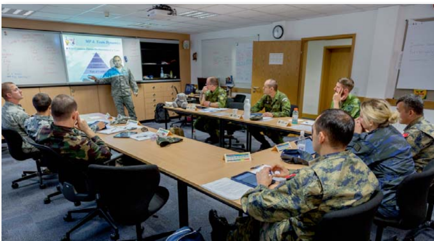
A 43 főből alakult 4 szakasz egyik csoportjának foglalkozása

A tananyag változatos volt. A több mint 150 óra elméleti képzés, ami 28 különböző leckéből állt, többnyire irányított vitán alapult, ezáltal is folyamatos gondolkodásra kényszerítve a tanulókat, olyan közegben, ahol mindenki véleménye számított. Nem voltak száraz, adatokkal teletűzdelt PowerPoint-prezentációk, és az értékelés sem tesztek tömkelegének kitöltése alapján történt. Kaptunk viszont a vita alapját képező, angol nyelven írott tananyagokat, amelyeket az órára érkezve már ismerni kellett legalább olyan mélységben, hogy a vita érdekes és fejlesztő lehessen. Mivel ezek a leckék angol anyanyelvű hallgatóknak lettek írva és csak kisebb módosításokon estek át, talán ezek megértése és elsajátítása volt a legnagyobb kihívás a tanfolyam során. Esténként, az aznapi 8 órnyi fizikai és szellemi megpróbáltatások után a szálláson nem volt egyszerű 10-15, sőt egy-két esetben 30-40 oldalnyi idegen nyelvű olvasmány feldolgozása. Szerencsére ezt a kiképzők is felismerték, és profi módon irányítva a megbe-