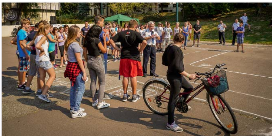
Közlekedésbiztonsági vetélkedő az Európai Mobilitási Hét keretében

sereggel!” kerékpártúra a hónap kiemelkedő eseménye volt az ezred számára. A rendezvényt a HOSOSZ (Honvédelmi Sportegyesületek Országos Szövetsége), a HRSE (Honvéd Rákóczi Sport Egyesület), Szentesi Város Polgármesteri Hivatala, a Szentesi rendőrkapitányság és az Országos Mentőszolgálat szervezte. Farkas Lászlónak, a HOSOSZ elnökének megkeresésére vállalta a szentesi alakulat a rendezvény biztosítási feladatait.