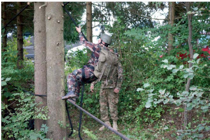
Kifeszített kótélen küzdi le az akadályt az egyik járőr

A versenyen hét csapat vett részt, négy szlovén, egy osztrák, egy horvát és egy magyar. A Magyar Honvédség Logisztikai Központ (MH LK) által kiállított 9 fős gárda szeptember 18-án érkezett meg Krajn helyőrségébe, ahol a szlovén logisztikai dandár települ. Még aznap este a dandár vezénylőzászlósa, Franjo Cesar főtörzszászlós megtartotta eligazítását a külföldi csapatoknak,