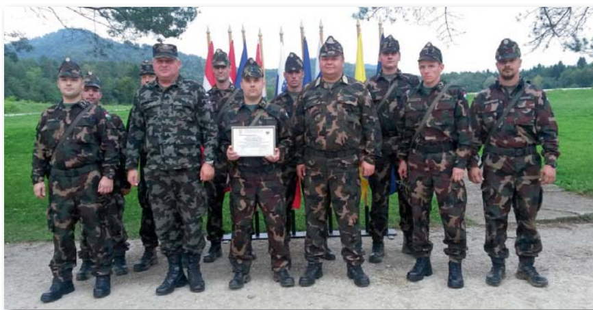
Emlékfotó a szlovéniai járőrbajnokságról

amelyen minden vendég megkapta a legfontosabb információkat (étkezések ideje, sorakozó, napirend, a verseny feladatai stb.).