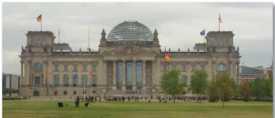
A Bundestag a Reichstag felújított épületében működik

német haderő struktúráját, hiszen a harcoló, harctámogató és harctámogató-kiszolgáló alakulatok mellett oktatóval foglalkozó szakember, valamint a tartalékos állomány képviselője is jelen volt. A magyar csoport felosztása is céltudatosan lett kialakítva, mivel 5 fő a Magyar Honvédség Honvéd Ve-