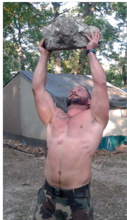
„Repül a nehéz kő...”