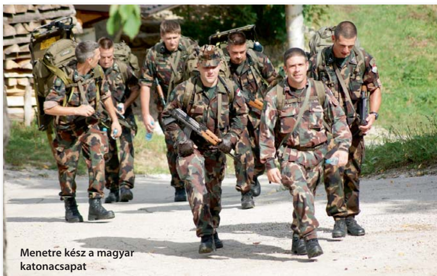
Menetre kész a magyar katonacsapat