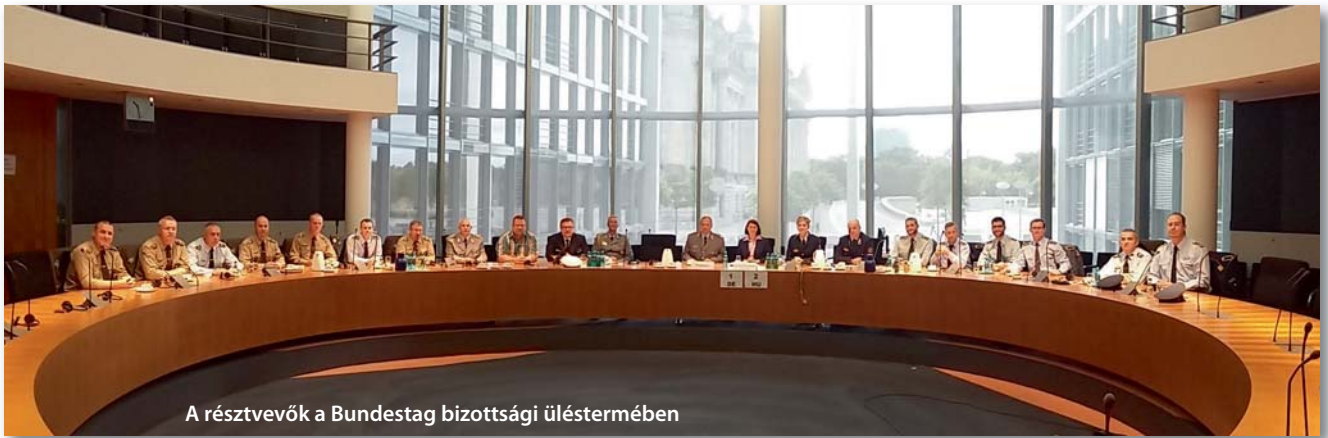
A résztvevők a Bundestag bizottsági üléstermében