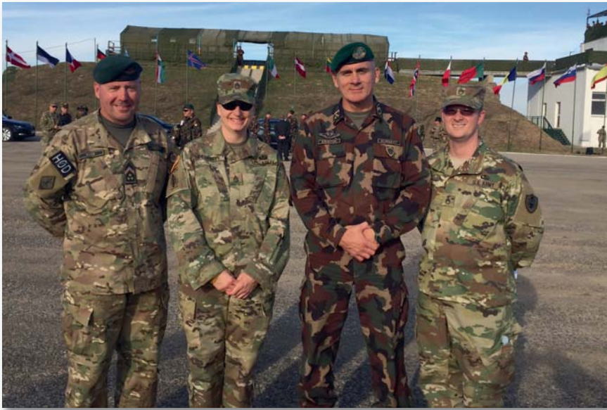
Emlékfotó az MH Bakony Harckiképző Központ gyakorlóterén

a számomra igazán megtisztelő feladatot. Jelenleg szeretnék ismét ejtőernyővel ugrani, és remélhetőleg sikerül amerikai–magyar ejtőernyős gyakorlatokon is részt venni. Nagyon hiányzik az ugrás, alig várom, hogy lássam, az ilyen feladatok hogyan működnek a Magyar Honvédségen belül.