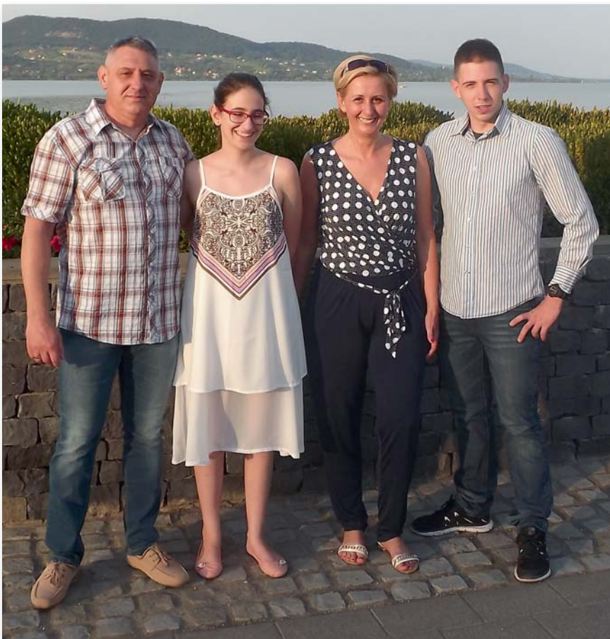
Sándor a legfontosabbnak a biztos családi hátteret tartja

tokat hajtottak végre, és parancsnokként ő volt felelős a rábízott sorkatonák vezetéséért.