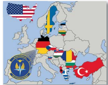
Az IEAFA tanfolyamára 14 országból érkeztek tisztek és altisztek

A gyakorlati foglalkozásokra szintén vegyesen voltunk beosztva, de ekkor már jobban variálták az eredeti csoportokat. Ennek következtében az egyének többször és különböző helyzetekben találkoztak egymással, jobban megismerhették egymás személyiségét, vezetői és követői képességeit, a