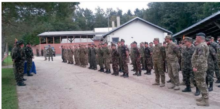
Az eredményhirdetésre felsorakozott csapatok