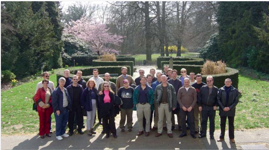
Közös fotó csoporttársaival 2014-ben, Hollandiában