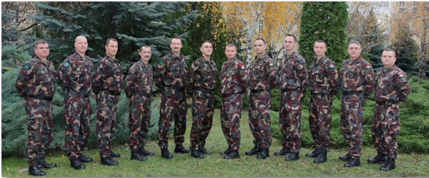
Csoportkép a 2014-es ÖVAT hallgatóiról