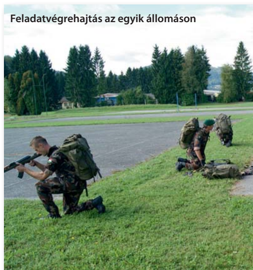
Feladatvégrehajtás az egyik állomáson