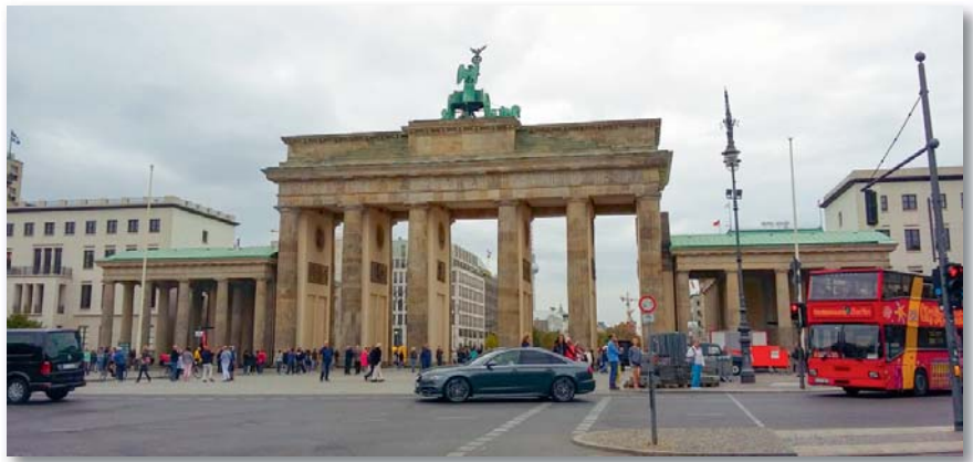
A csoport a városnézés során természetesen a Brandenburgi kaput is megnézte

A csoportnak lehetősége nyílt a Bundestag (a Német Szövetségi Köz-