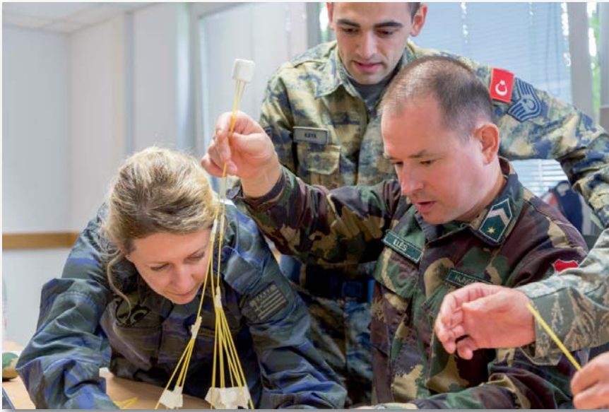
A gyakorlati foglalkozásokon a résztvevők megismerhették egymás személyiségét, vezetői és követői képességeit

széléseket, azokat gyakorlati aktivitással kiegészítve átsegítették bennünket a nyelvi nehézségeken.