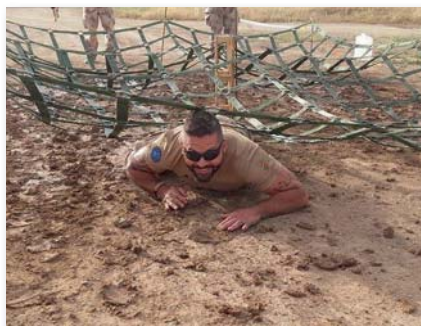
Patonai főtörzsőrmester: Egy harcosnak erőálló-képességre és állóképességre van szüksége, egy időben

Minimalizmus. Ha a lehető leghatékonyabban akarunk edzeni, a legtöbb nyereséget a legkevesebb ráfordított idő alatt elérni, akkor csak néhány, sokizületes alapgyakorlatot vegyünk fel az edzéstervbe. Guggolás, felhúzás, húzódzkodás súllyal, fekvenyomás, katonai nyomás, evezés. Ha ezekben kívánunk erősödni, semmi bonyolítás. Ha a használt súly nő, már erősödtünk is, ha erősödtünk, akkor izmosodtunk is. Heti háromszor negyven perc elég. Ha több, akkor már „fészbükoztál” és beszélgetél is, az idő pedig nem produktívan lett kihasználva. Ismétlésszámok 1 és 5 között, e fölött már minden kardió, jóga, pilátesz vagy zumba. Egy munkasorozat kell, és ha így teszel, a megfelelő technikával csak egy rúd, súlyokra és egy húzódzkodóra van szükség.