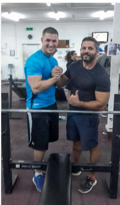
A főtörzsőrmester igyekszik megfogadni sporttársai tanácsait

Amit én használok, azok standardok, hogy a fejlődés mérhető legyen. Cél-súlyok, mert célok mindig kellenek. Például képesnek lenni a testsúly duplájával guggolni, fej fölé a saját súlyt kinyomni, fekvve nyomni a testtömeg 1,8-szorosával, felhúzni a 2,5-szörösével, húzódkodni a testsúly másfélszeresével. Ezek az edzésmaxi-