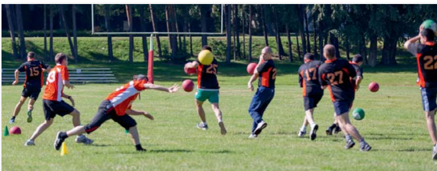
A kültéri kedvenc foglalkozások egyike, a gyakorlati vezetői képességek felmérésére szolgáló Field Leadership Exercise (FLEX)

Több kültéri foglalkozáson is részt vettünk, ezek egyike volt mindenki kedvence, a gyakorlati vezetői képességek felmérésére szolgáló Field Leadership Exercise (FLEX). Ezt egy kispályányi füves focipályán játszottuk, gyakorlatilag egy támadó-védekező légi hadműveletet szimuláltunk. Anyagi-technikai téren egyszerűen megvalósítható, kis költségvetésű játék. Lényege, hogy légi fölényt alakítsunk ki az ellenség felett. Ezt három módon lehetett elérni. Az irányító központ megsemmisítésével, a kommunikáció elpusztításával, illetve a két darab légibázis lerombolásával. A játékot nagy méretű, háromféle színű labdákkal, különböző színű útterelő bójákkal játszottuk. A bóják helye fel volt rajzolva a fűre, az ellenség feladata ezeknek a bójáknak a feldőntése a piros labdákkal, a védelem feladata pedig ennek megakadályozása volt. Az irányítóközpont három narancssárga bójából, a két légibázis