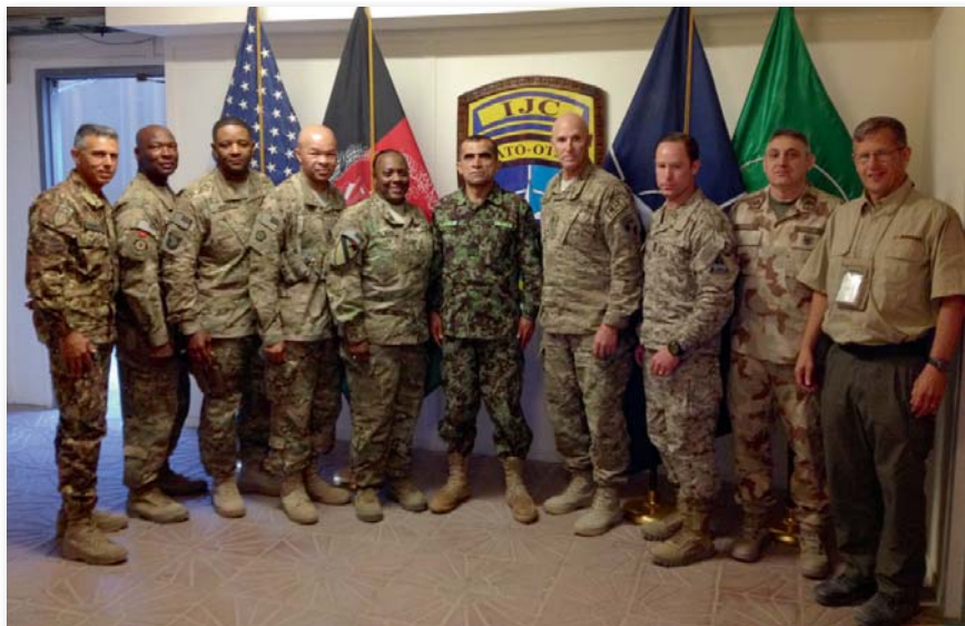
Az ISAF kötelékében 2005-ben