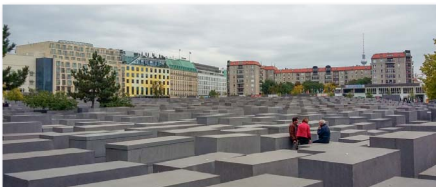
A berlini holokausztemlékmű

Zsiros Tamás törzsszázlós A szerző felvételei