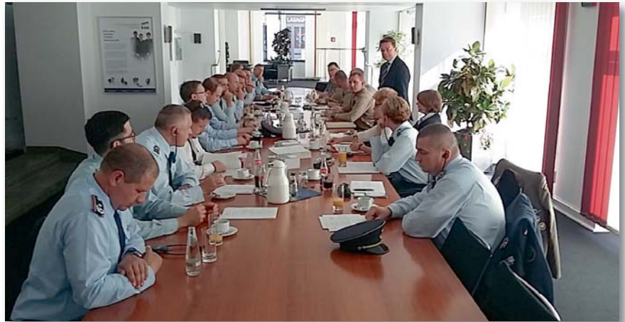
A szemináriumon 10 német és 10 magyar altiszt vett részt

A német delegációt 10 alakulat képviselői alkották, lefedve szinte a teljes