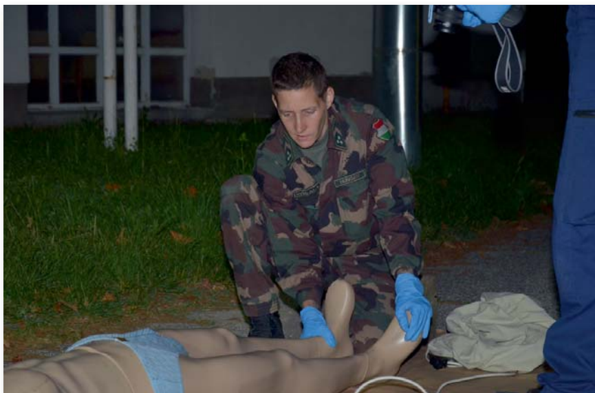
A helyszínelő részleg tagjainak fel kell tudniuk ismerni az idegenkezűség árulkodó jeleit

zők helyes telepítésére, valamint a működés közbeni ellenőrzésre vonatkozó ismeretek.