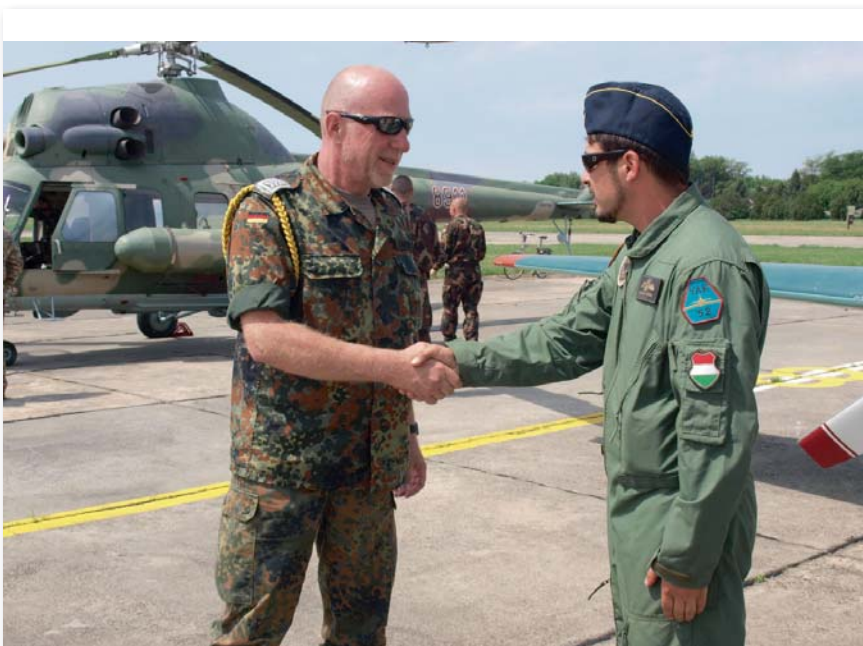
A német rangidős altiszt az állomány tagjaival is elbeszélgetett