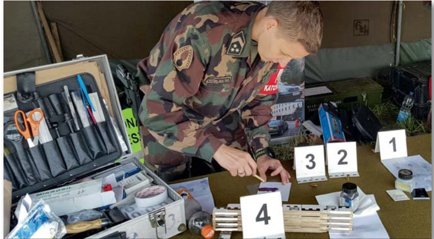
Bűnügyi technikus altiszt a munka során használt segédeszközével

Írásomban a speciális csoport műveleti helyszínelő részlegét mutatom be.