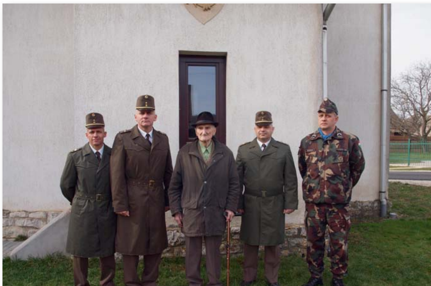
Az idős katona az utódokkal, a mai Magyar Honvédség vezető altisztjeivel Balatonszőlőn