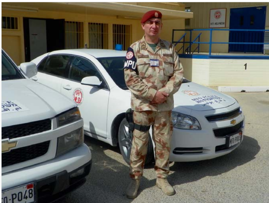
Az altiszt ez idáig három alkalommal szolgált misszióban