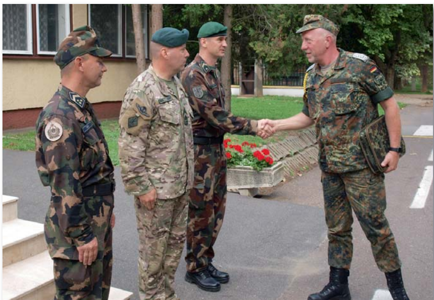
A német vendég érkezése a szolnoki helikopterbázisra

– Az altisztzi kar erősségének egyértelműen azt tartom, hogy a NATO égisze alatt nagyon sokat közeledtek az alapértékeink egymáshoz. Nagyon sokat számít, hogy nemzetközi fórumokon van lehetőség azoknak a tapasztalatoknak a megosztására, amelyekkel