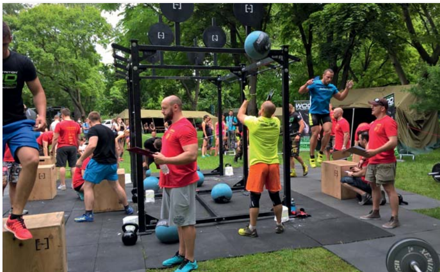
Az egyre gyakoribb versenyek, bemutatók is bizonyítják, hogy az alakulatoknál mind nagyobb az igény a kihívást jelentő edzés- és kiképzési módszerekre

További előnye ennek az edzés módszernek, hogy a világon nagyon széles körben elterjedt mind a civil társadalomban, mind pedig a katonai