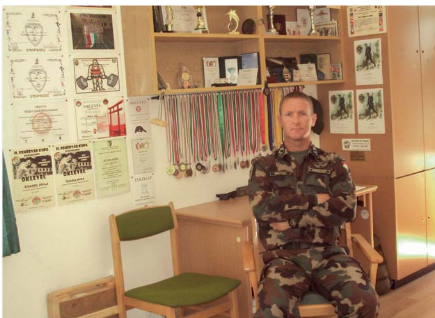
Rikkers főtörzsőrmester pályája során megszokta, hogy mindenért meg kell küzdeni