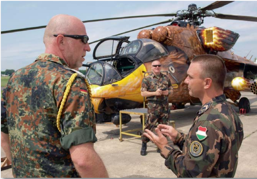
Ismerkedés a forgószárnyas technikával

a szövetség nap mint nap szembesül. Ha a leginkább erősítésre szoruló területet kellene kiemelnem, az határozottan a költségvetés, a pénzügyi megszorításokból adódó problémák, amelyek kivétel nélkül kisebb-nagyobb mértékben minden tagországot érintettek és érintenek; sokszor képességsökkenéssel, a lehetőségek beszűkülésével járnak együtt. Az a fajta kapcsolattartás, amelyet erősségként említettem, az elmúlt években így egyre nehezebbé kezdett válni, még ha vagyunk is néhányan, akik, amennyire csak lehet, megpróbáljuk ezt fenntartani. Ahogyan én látom, itt Németországban, de a NATO-n belül is a dolgok gyorsan változnak. Szinte minden