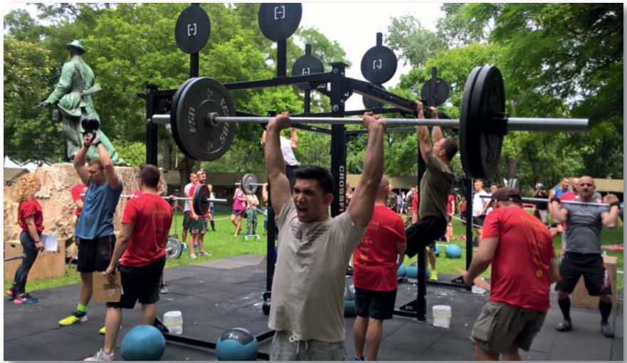
A rendszeres és következetes munka elősegíti a missziók, illetve hazai vagy nemzetközi gyakorlatok során felmerülő feladatok sikeres teljesítését

Írásom második felében a súlyzó edzésekkel kívánok foglalkozni. Már a korábbi cikkemben is jeleztem, hogy ezek a feladatok, feladatsorok már technikai ismereteket is igényelnek,