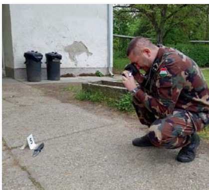
A tanfolyam résztvevői megtanulták, hogyan kell alkalmazni a kriminalisztikai fényképezés fogásait külső és belső helyszíneken

Nyíri-Bácsa Emőke főtörzsőrmester A szerző felvételei