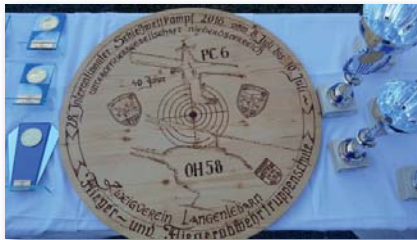
A verseny logója és a díjak