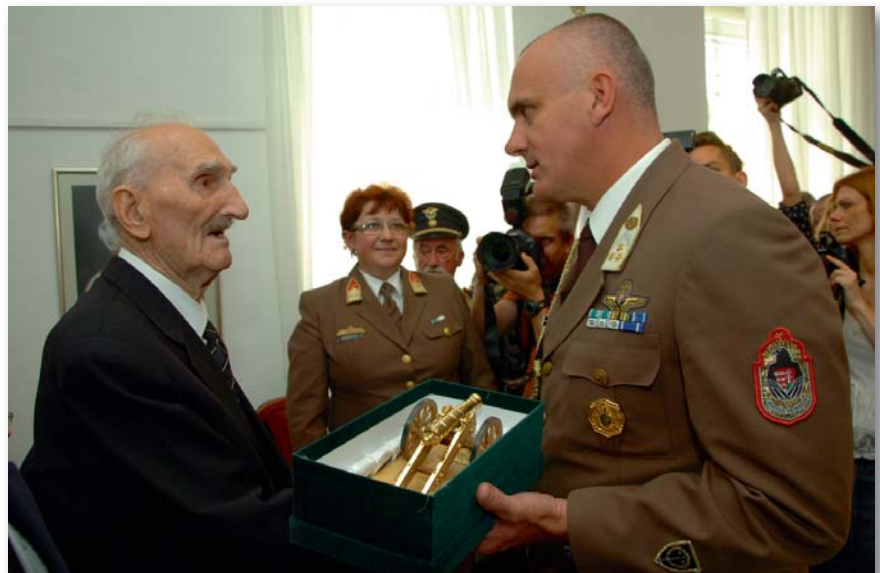
Az MH vezénylőzászlósa emléktárgyat ad át a veterán altisztnek