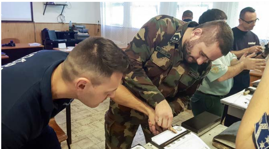
Az ujjlenyomatvétel gyakorlása

Az elméleti foglalkozásokon együtt tanulták meg, hogy mit is értünk bűnügyi technika alatt, és mely ágazatok tartoznak e speciális területhez. Ide sorolandó: kriminalisztikai fényképezés (mely magában foglalja a videódokumentációval kapcsolatos ismereteket is); traszológia (nyomtan); daktiloszkópia (ujj- és tenyérvizsgálat); anyagmaradványok vizsgálatával foglalkozó igazságügyi szakértői területek ; kriminalisztikai ballisztika (igazságügyi lőfegyvervizsgálatok); igazságügyi összehasonlító kéz- és gépirásvizsgálat ; igazságügyi okmányvizsgálat ; kriminalisztikai akusztika ; kriminalisztikai információtechnika ; személyleírás és személyazonosítás külső ismérvek alapján ; bűnügyi nyilvántartás ; odorológia (a bűnügyi szolgálati kutya alkalmazásával kapcsolatos ismeretek); a krimináltechnikai csapda és a biztonságtechnikai eszkö-