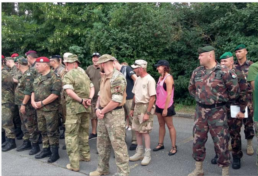
Hét nemzet 262 versenyzője mérte össze tudását