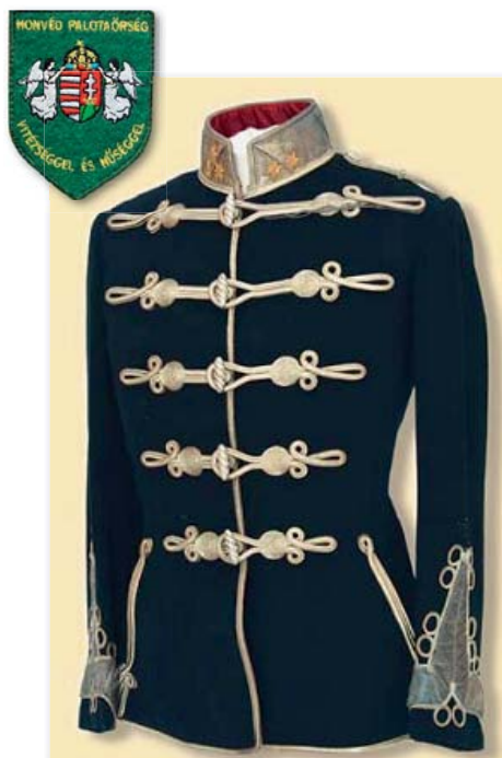
A Magyar Királyi Testőrség szolgálati atillája az 1880-as években

A 2011. május 30-i megalakítását követően, a hagyományokhoz visszatérve, az MH vitéz Szurmay Sándor Budapest Helyőrség Dandár 32. Nemzeti Honvéd Díszegység biztosítja a Szent Korona őrzését, 2012. január 7-étől pedig a köztársasági elnök rezidenciájának protokolláris védelmét és az állami ünnepek díszelő biztosítását.