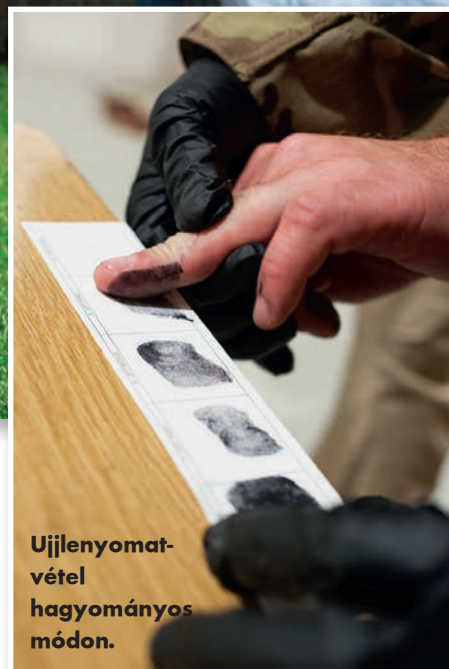
Ujjlenyomátvételt hagyományos módon.

gítségével egyes emberek „képbe kerülhetnek”, összekapcsolhatók különböző helyszínekkel, eseményekkel, köszönhetően a már máshol levett mintákat tartalmazó adatbázisnak.