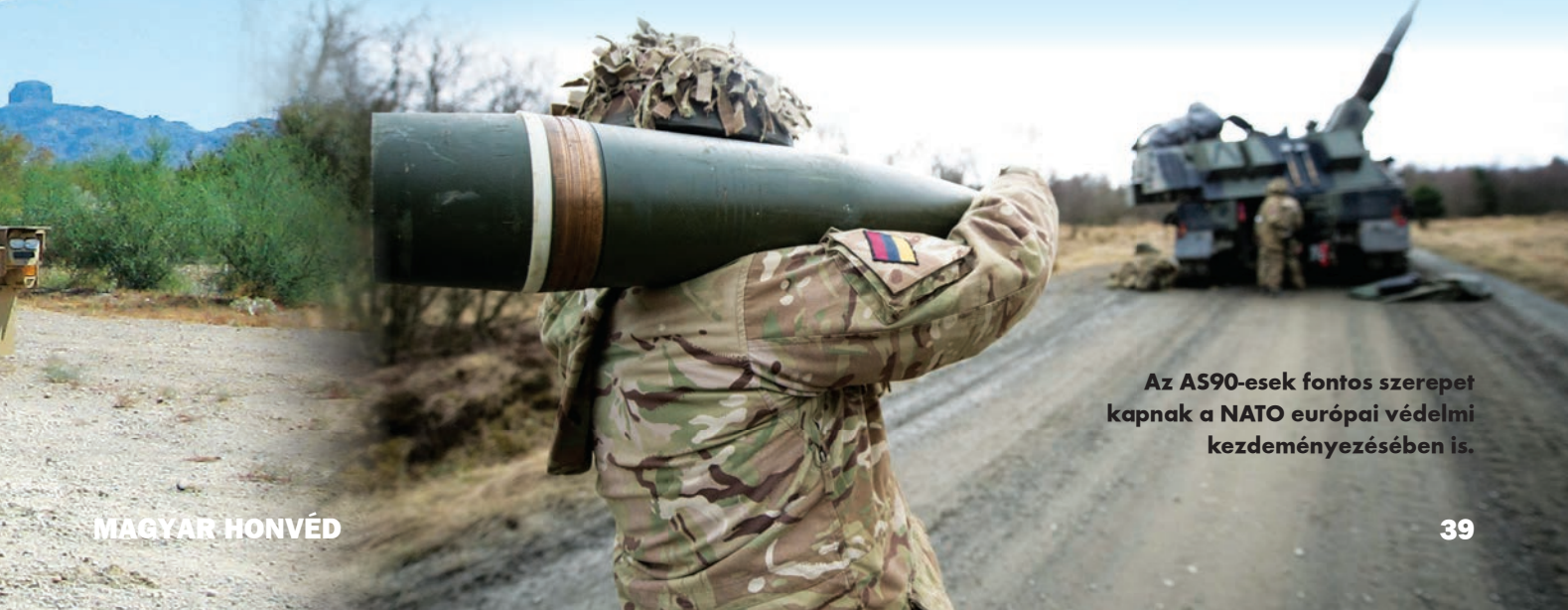
Az A590-esek fontos szerepet kapnak a NATO európai védelmi kezdeményezésében is.