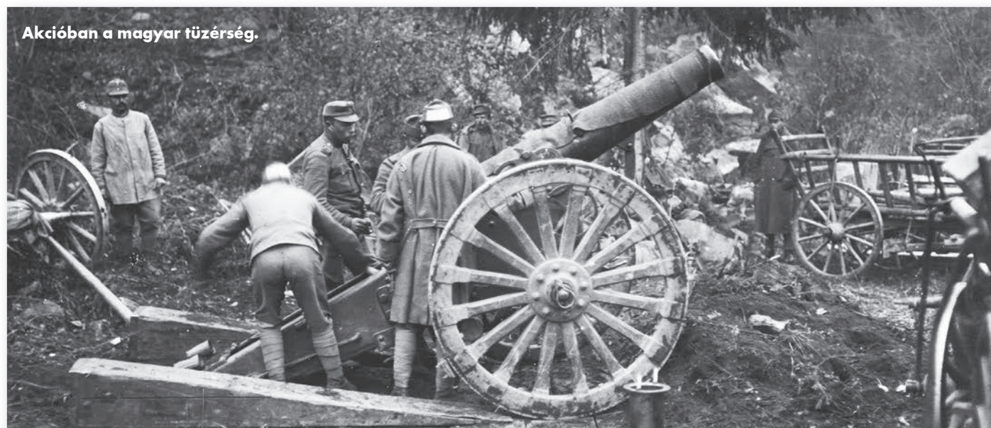
Akcióban a magyar tüzérség.

Válaszul 28-án Németország, 29-én Törökország, szeptember elsején pedig Bulgária deklarálta a háborút Románia ellen, az utóbbi állam ráadásul már másnap megtámadta Dobrudzsát. A románok haditervét leginkább területszerzési vágyaik befolyásolták, ezt bizonyítja az is, hogy négy hadseregükből hármat Erdély határainál sorakoztattak fel. Az oroszokkal a 4. hadsereg biztosította az összeköttetést, tőlük délre a 2. hadsereg, míg a szerb határig az 1. hadsereg rohamozott. A bolgár offenzívát Dobrudzsában a 3. hadseregnek kellett volna feltartóztatnia.