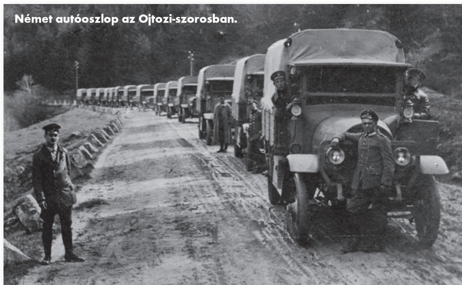
Német autóoszlop az Ojtozi-szorosban.

kínálkozik megfelelő alkalom. Érezték ezt a magyar politikai vezetők is, nem véletlenül küldött Tisza István 1916. július 7-én memorandumot Ferenc József császárnak, amelyben a román támadás valószínűségével számolva azt fejtegette: bár a Bruszilov-offenzíva súlyos válsággal fenyeget, némi erőt át kellene csoportosítani a román határra, akár Szerbia jelen-