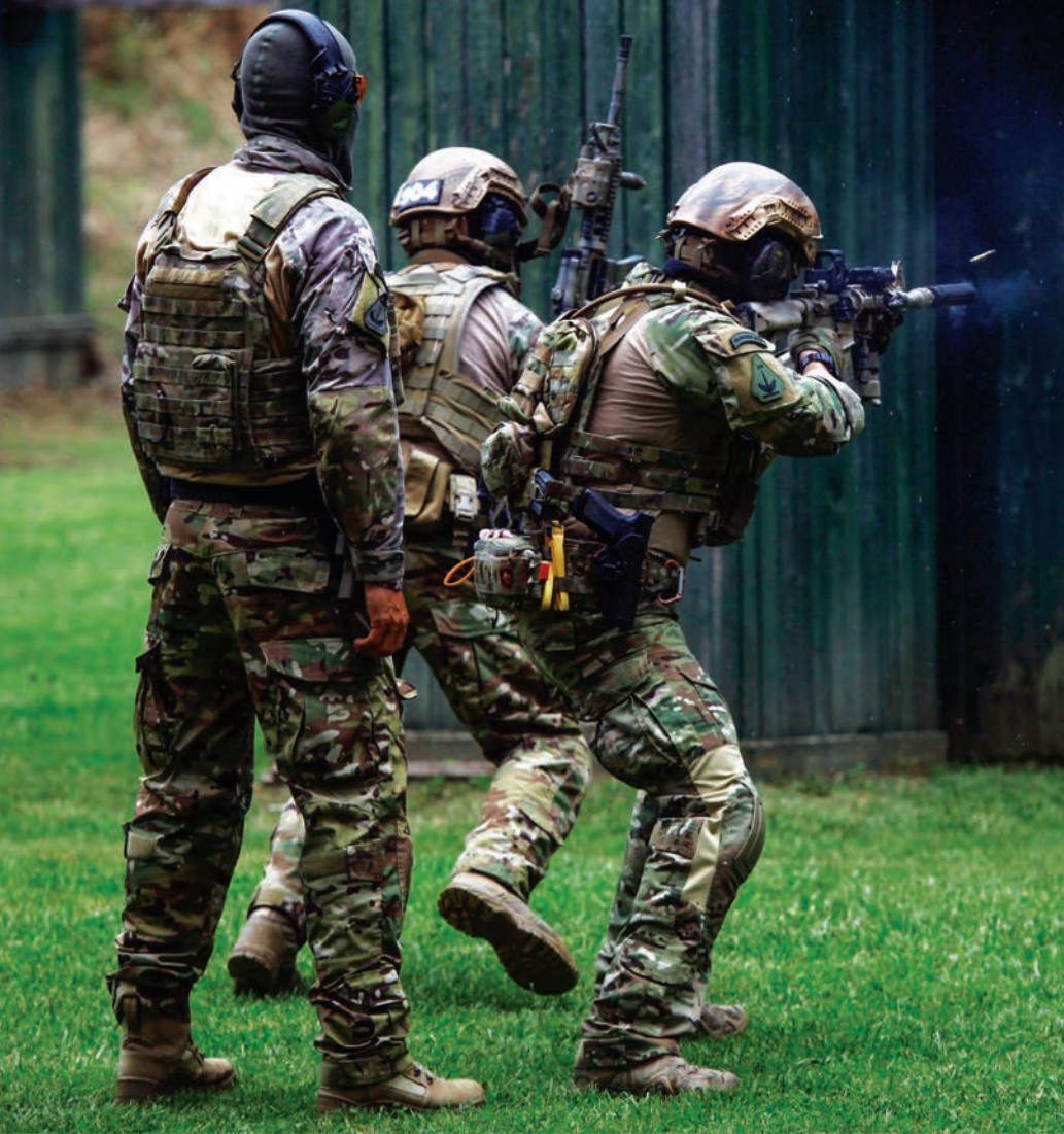
AN/PEQ-15 ATPIAL célzórendszer a gépkarabély csövének tetején.