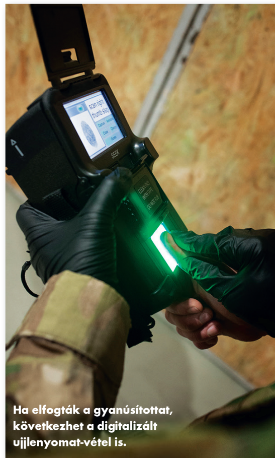
Ha elfogták a gyanúsítottat, következhet a digitalizált ujjlenyomat-vétel is.

Az ezred szempontjából fontos ez a képesség. A nyomrögzítés és -feldolgozás (s az így nyert új információk) eredménye újabb műveletek megindítása lehet, de a már zajló műveletek során ezekkel tudják alátámasztani bizonyos személyek érintettségét is. A DNS-minták, az ujjlenyomatok se-