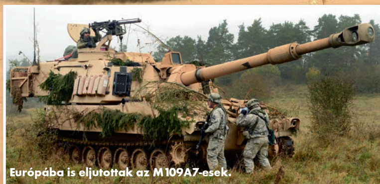
Európába is eljutottak az M109A7-esek.