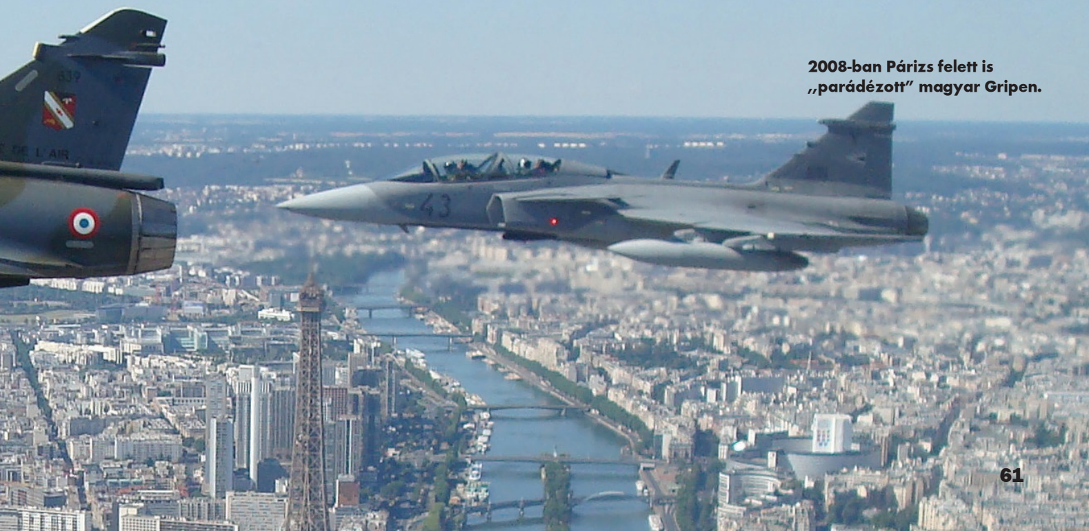
2008-ban Párizs felett is „parádézott” magyar Gripen.

Ősszel – határrendészeti feladataik ellátásával párhuzamosan – a Gripenek részt vesznek majd egy nagyszabású együttműködési gyakorlaton a szárazföldi csapatokkal, és Csehországban is lesz egy CAS-gyakorlat. Nemzetközi repülőnapokon is ott lesznek a Magyar Honvédség JAS-39-esei: Horvátország, Ausztria, Szlovákia és a megalakulásának 90. évfordulóját ünneplő Svéd Királyi Légierő (Flygvapnet) meghívásának tudnak eleget tenni.