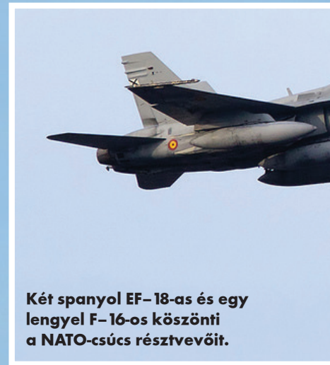
Két spanyol EF-18-as és egy lengyel F-16-os köszönti a NATO-csúcs résztvevőit.

A két magyar vadászgép a Varsó feletti áthúzás előtt három nappal