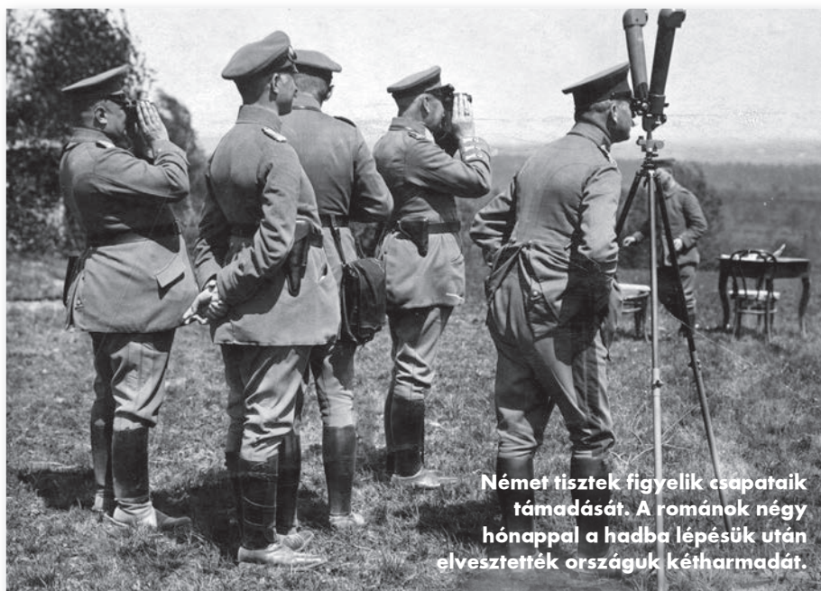
Német tisztek figyelik csapataik támadását. A románok négy hónappal a hadba lépésük után elvesztették országuk kétharmadát.