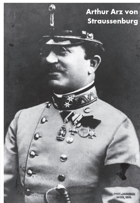
Arthur Arz von Straussenburg

A románok olyan időpontban akarták elkötelezni magukat az antant mellett, amikor a németek semmilyen veszélyt nem jelentenek rájuk a Balkánon, így a területi igényeiket gyorsan és kevés veszteséggel realizálhatják. Úgy tűnt, erre 1916 nyarán