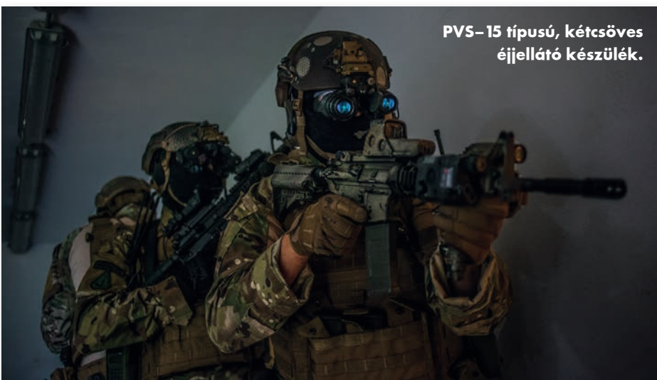
PVS-15 típusú, kétcsöves éjjellátó készülék.

Több új éjjellátó eszközzel is gazdagodott az ezred fegyvertára. Az AN/PVS-15 a legnagyobb előrelépést elődeihez képest a két különálló csöves kialakításnak köszönheti, mert