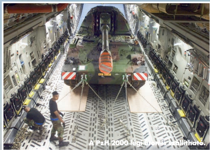
A PzH 2000 légi bázis szállító.