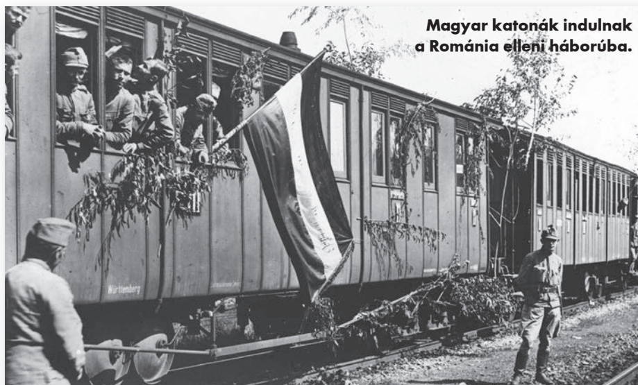
Magyar katonák indulnak a Románia elleni háborúba.

A központi hatalmakkal szimpatizáló román politikusok Bécsen és Berlinen keresztül kíséreltek meg nyomást gyakorolni a budapesti kormányra, hogy az jelentős politikai kedvezményeket adjon az erdélyi románok számára, így segítve elő Románia hadba lépését Németország és a Monarchia oldalán. Tisza István magyar miniszterelnök viszont úgy gondolta: a bukaresti kormány döntését egyedül a harctéri események befolyásolhatják. Ha a Monarchia győz, nem kell alkudoznia szomszédjával, vereség esetén pedig az engedmények amúgy sem érnének semmit. A helyzet a következő esztendőben sem változott: bár 1915 folyamán a központi hatalmak és Románia viszonya feszültebbé vált, az erdélyi kérdés továbbra is alkudozások tárgya maradt. Ráadásul német részről