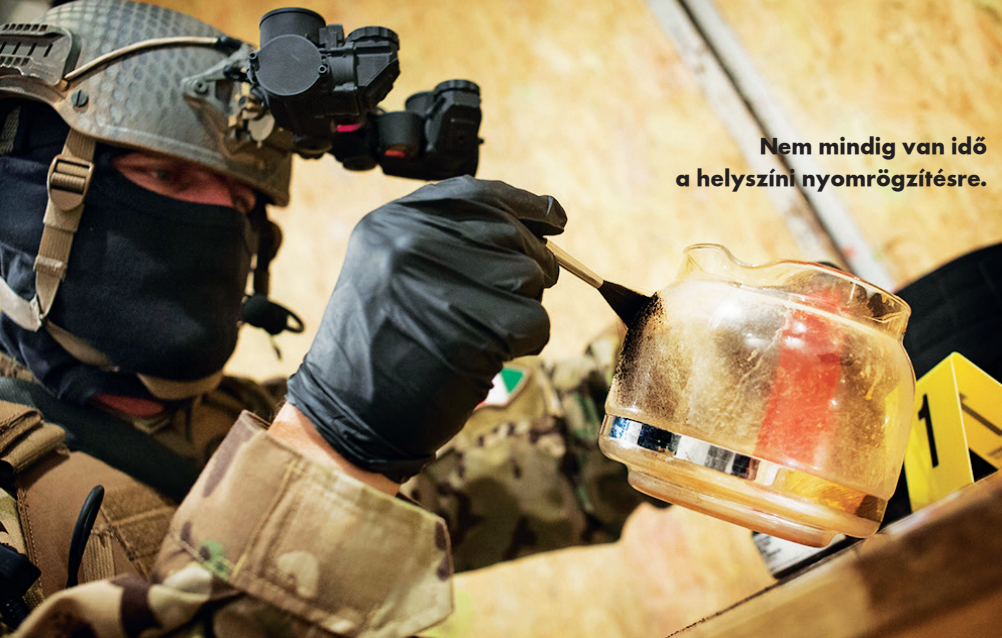
Nem mindig van idő a helyszíni nyomrögzítésre.

ges a használatukhoz. Pincében, földalatti ütegekben, más zárt helyeken azonban nincs fény; ekkor hasznos az integrált infravörös fényforrás.