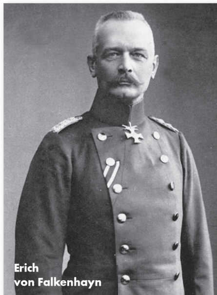
Erich von Falkenhayn

Mivel Románia belépése esetén a keleti hadműveletek összehangolása Oroszországra várt, az antant nevében ők tárgyaltak a bukaresti kormányzattal. A cári vezetés még 1914. október elsején elismerte Románia igényét Ausztria–Magyarország románok lakta területeire, ám Bukovina nagy részére maguk az oroszok is pályáztak, míg a Temesi bányságot – vagy legalább annak egy szeletét – Szerbiának kívánták juttat-