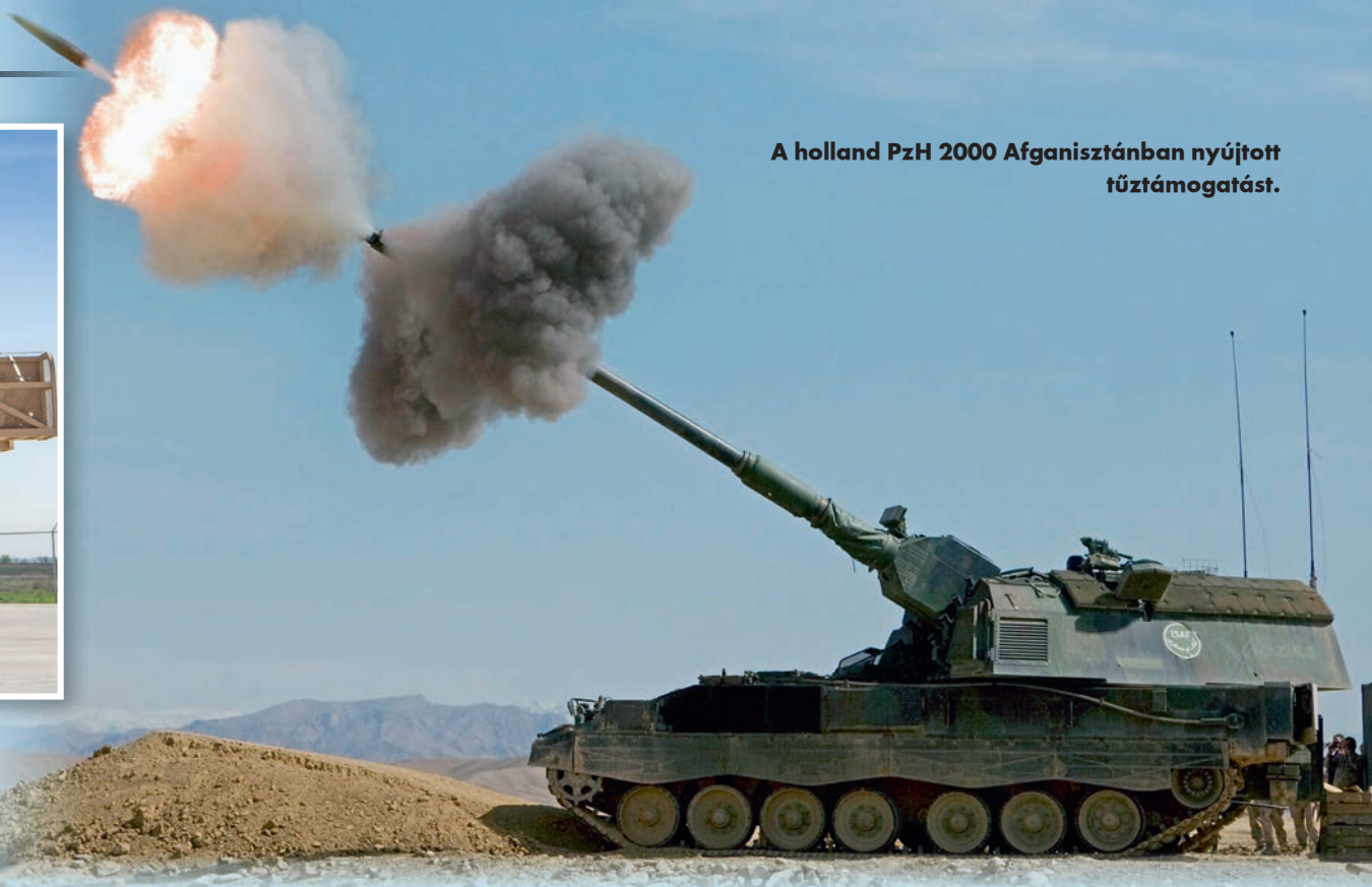
A holland PzH 2000 Afganisztánban nyújtott tűztámogatást.

létere. Az Archer 21 löszert képes hordozni a szintén automatizált tároló- és töltőrendszerben. A lövészetek során a Raytheon M982 Excalibur műholdas navigációs rendszerrel irányított löszerttel 60 kilométeres hatótávolságot sikerült elérni.