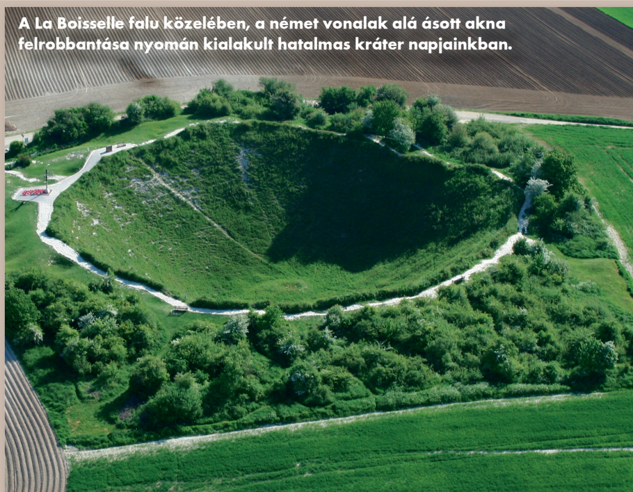
A La Boisselle falu közelében, a német vonalak alá ásott akna felrobbantása nyomán kialakult hatalmas kráter napjainkban.

A somme-i csata 1916. július elsején, reggel 7.30-kor kezdődött. Magát a támadást hétnapos ágyúzás vezette be, amelynek során a britek június 24-től 1,5 millió tüzéségi lövedéket zúdítottak a német állásokra, az offenzíva első napján pedig további közel negyedmilliót. Közvetlenül a csata előtt tizenhét, az ellenséges lövészárkok alá ásott, robbanóanyaggal töltött aknát is a levegőbe röpítettek. Az első támadás tengelye az Albert és Bapaume között húzódó régi