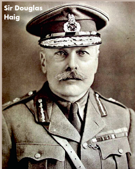
Sir Douglas Haig

lében található, ráadásul egy sikeres hadművelettel további kikötők kerülhettek volna a birtokába, olyanok is, amelyek az antant hajózási útvonalait fenyegető német tengeralattjárók bázisul szolgáltak. Ám a támadás helyét illetően a döntő szó a franciáké volt. Így történhetett, hogy bár Joseph Joffre tábornok, a francia haderő főparancsnoka 1916 januárjában még elfogadta Haig tervét, egy hónappal később viszont új helyszínt jelölt ki a tervezett offenzívához: a Somme folyó vonalától északra és délre húzódó frontszakaszt, ahol a brit és francia csapatok állásai találkoztak.