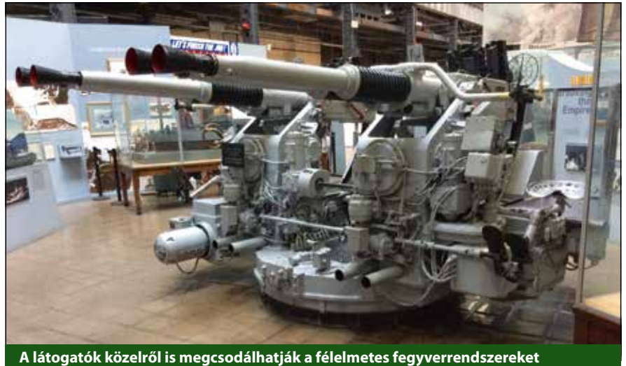
A látogatók közelről is megcsodálhatják a félelmetes fegyverrendszereket

„A 19. század elfelejtett háborúi” kiállításrészen a francia konfliktus, az