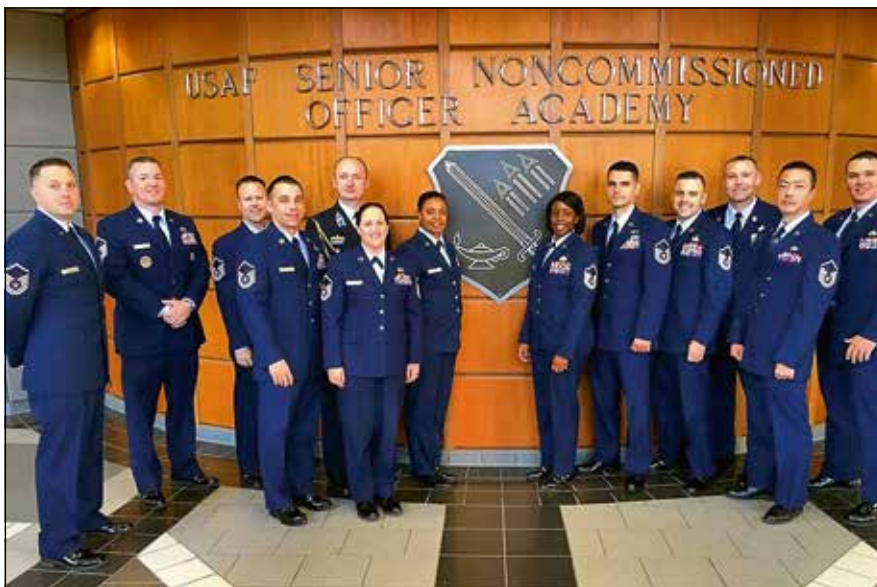
Végzős hallgatóként az Egyesült Államokban