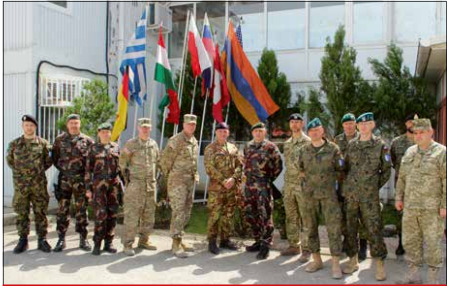
A Novo Selo-i bázison közel tíz nemzet katonái szolgálnak