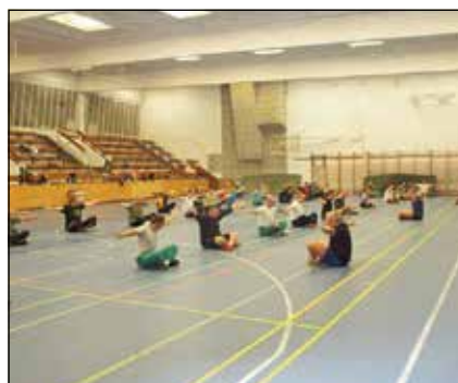
Altisztként beosztottainkat motiválni, parancsnokainkat pedig ösztönözni kell a fejlődés iránti igény kialakítására, fenntartására

A módszert nagyon sok helyen alkalmazzák. Igazából az ún. affiliált klubokban folyhat Crossfit edzés. A Crossfit alapdefiníciója: „Constantly varied high intensity functional movement”, azaz „Folyamatosan változó magas intenzitású, funkcionális mozgás”. Jellemzője, hogy nem kell órákat tölteni a kondicionálóteremben, hanem az edzések – a bemelegítés és a gyakorlatok végén történő nyújtás mellett – egy ún. WOD (Work of the Day), szabad fordításban „napi gyakorlat” végrehajtásával történnek, melynek időtartama 5–20 perc között van. Mivel a gyakorlatok összeállításának széles a