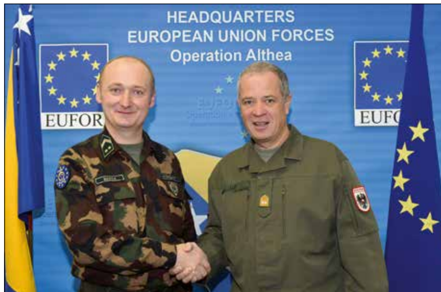
Luif tábornokkal, akinek a vezénylőzászlósa volt Boszniában

Kossuthon végzett volt katonatiszt segítségével adta be jelentkezését Szolnokra, a Magyar Néphadsereg Repülőgép-szerelő és Repülőgép-műszerész Tiszthelyettesképző Szakközépiskolába. Az itt eltöltött négy évnek köszönhetően mélyült el a repülés iránti szenvedélye, ami a mai napig is tart.