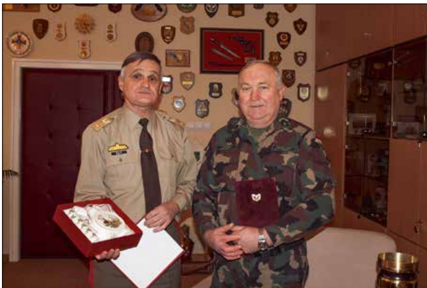
Bozó Tibor dandártábornok köszönti a hatvanéves katonát

nyítja az alárendeltségében szolgálókat és gondoskodik róluk, kollégaként kezeli a legénységi állományú katonát.