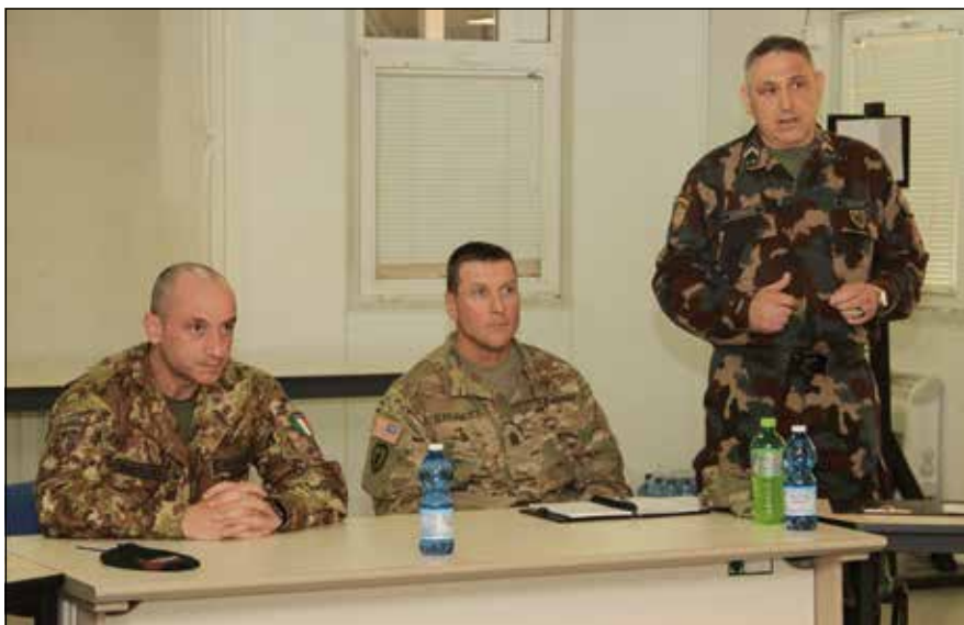
A magyar álláspont megismertetése a nemzetközi csapat tagjaival

az egyik legnagyobb létszámú kontingens, illetve náluk van legrégebbi hagyománya a vezénylőzászlói rendszernek, ezért felkértem CSM Barrettet, hogy vállalja el a gyűlések levezetését.