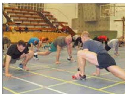
Napjainkban a katonák számára kulcsfontosságú az egészség és a fizikai állóképesség megőrzése

Mint már említettem, a nyugati hadseregek is felismerték a reformok szükségességét. Már 2010 májusában, az Egyesült Államok Szárazföldi Haderije (US Army) kidolgozott egy tanulmányt (Crossfit Study), melyben a nyugaton oly népszerű Crossfit edzésmódszer hatásait vizsgálták a katonák körében. A felmérés során Crossfit edzésmód-