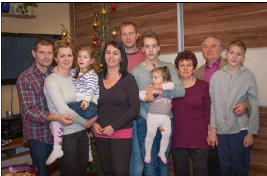
Schrám zászlós a családjára a legbüszkébb

Soós Lajos törzszászlós