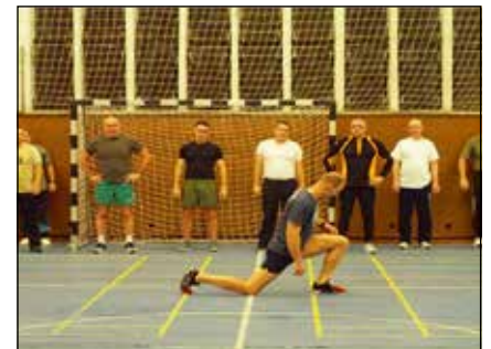
A funkcionális edzéshez nem szükséges nagy befektetés és óriási eszközigény

A másik mozgáscsoportot a különböző egyszerű, mobil eszközökkel végrehajtott tréningek jelentik, melyekkel mind bemelegítő, rávezető és erőnléti, mind pedig mozgáskoordináció-javító gyakorlatok végezhetőek. Ilyenek például a Kettlebell vagy keletesebb nevén Girja, a TRX (ezen eszközöket külön cikkben tervezem bemutatni).