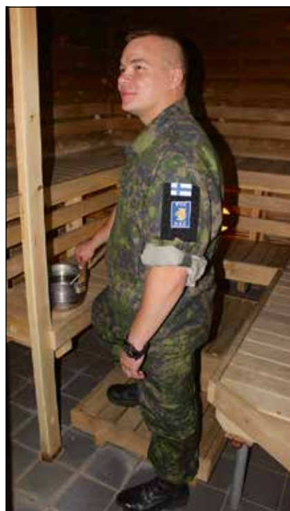
Fontos teendő a szauna beüzemelése

Amennyiben össze szeretné hasonlítani két misszióját, nehéz helyzetben találja magát. Például különbség, hogy az egyik ENSZ-, míg a jelenlegi NATO-vezetés alatt van. Ugyan itt is kell informatikával, kommunikációval foglalkoznia, de az csak egy bizonyos része a napi teendőknek. Mindig van feladat, nemcsak a folyamatban levő ügyekben és igények alapján kell eljárni, de adódnak speciális teendők is, például esténként még a finn szauna beüzemelése is rá vár. Nincs ugyanis este, illetve lefekvés egy alapos szauna nélkül. Ez nemcsak otthon igaz, hanem külföldön is. A finn katonák nemzetközi misszióban is igénylik a megszokott testi (lelki) gondoskodást. Ennek tudható be, hogy települjön akár az afrikai sivatagban a finn katonai kontingens állománya, ott is jogosan számíthat a jól befűtött és vizesdézsával biztosított szaunára.