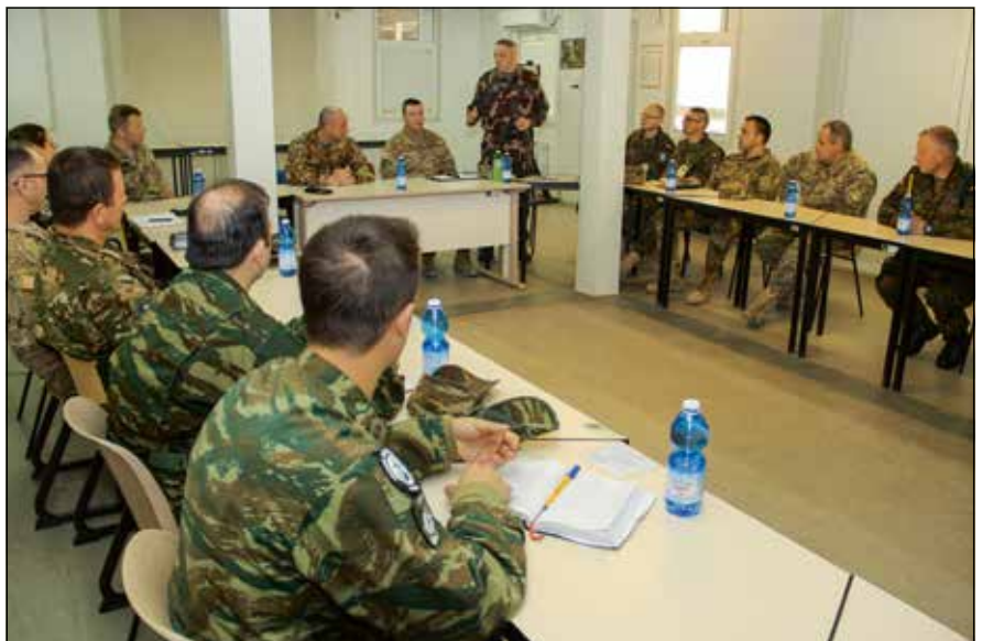
A nemzetközi rangidős altisztek munkaértekezletének résztvevői