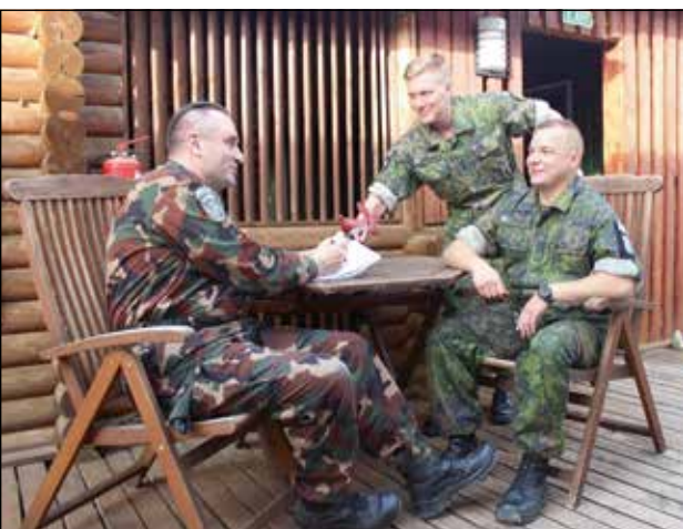
Készül a cikk a Honvéd Altiszti Folyóirat számára