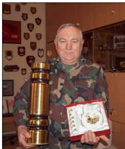
Emlékek az MH Altiszti Akadémiától és a bajtársaktól

– Mikor a néphadseregbe kerültem, akkor az még egy tipikus tömeghadsereg volt, a kötelező behívással, minden előnyével, de leginkább hátrányával. Össze sem lehet hasonlítani a mai, önkéntességre épülő honvédséggel. Mai szemmel nézve felfoghatatlan mennyiségű anyagi készleteket tároltunk, és sokszor mozgattuk feleslegesen az „anyaghegyeket”, hogy „ne unatkozzunk”. Aztán megváltozott minden, a sorkatonák eltűntek a rendszerből, a honvédség pedig professzionális, tudásalapú lett, lényegesen kisebb létszámmal. Az altiszti állomány összetétele, felkészültsége alapjaiban változott meg. A durvaság, a „pokróc” stílus eltűnt, helyét a következetes, katonás fegyelemre nevelés, a magas szintű szakmaiság vette át. A mai altiszt irá-