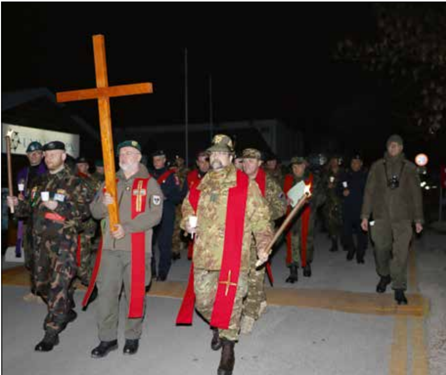
Az osztrák és a magyar tábori lelkész együtt a kereszttúton