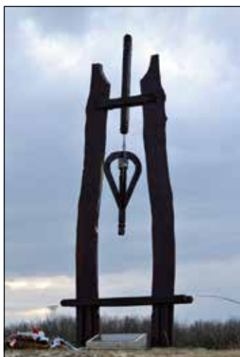
A tragédia helyszínén harangláb emlékeztet az egykori eseményekre

van! Mentsük meg! A letörött ajtót félrelöki és bemászik. Újabb detonáció következik be. Többé nem mozdul semmi.”