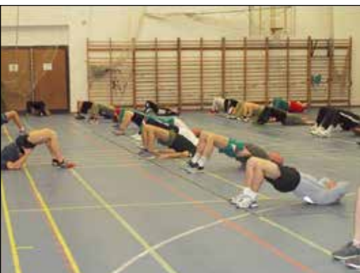
Az edzések 5–20 perc alatt is lebonyolíthatók

szerekkel 6 héten keresztül vizsgáltak egy szakasznyi katonát (30–45 év közötti életkorban lévő nőket és férfiakat), és jelentős pozitív hatást fedeztek föl. Átlagosan 20% teljesítménynövekedést értek el a tesztben részt vevő alanyonál mind a fizikai erőnlét fejlődése, mind pedig a huzamosabb teherbírási területén.