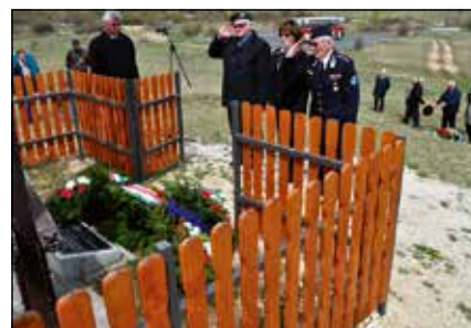
Ejtőernyős-tragédiára emlékeztek Jutaspusztán