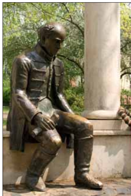
Kölcsey Ferenc szobra Mátészalkán

Engedjük kibontakozni azokat, akik alkotnak, akik hozzájárulnak e kultúrtörténeti folyamat építéséhez. Magyarságunk alapjai oly szilárdak és erősek, hogy túléltek a régmúlt idők történelmi viharait, idegen kultúrák hatásait, melyek ugyan nem múltak el nyomtalanul, de nem elnyomták, hanem erősítették mindazt, amit őseink ránk hagyományoztak. „Latiatuc feyleym zumtuchel mic vogmuc.” Ismerős sorok – az első írásos emlékünknél, a Halotti beszéd kez-