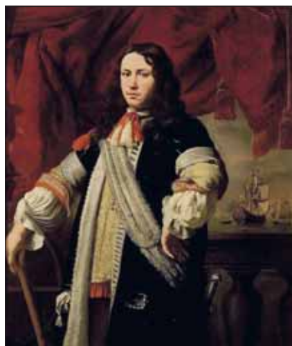
Michiel Adriaenszoon de Ruyter admirális