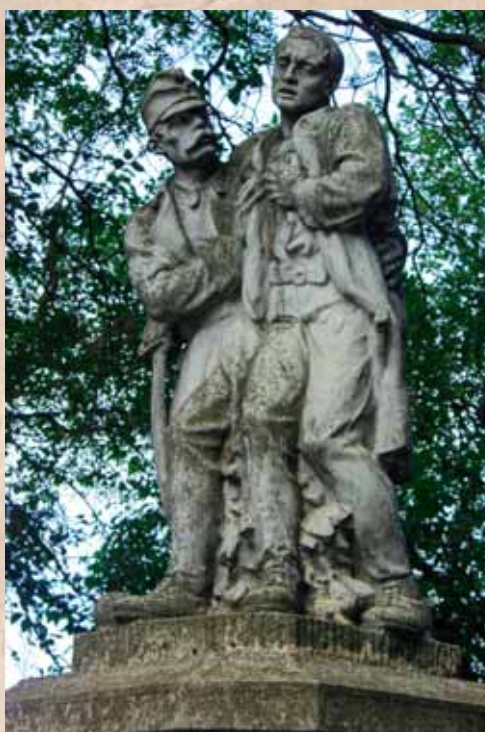
A hazáért 1914-1918 Az 1927. augusztus 14-én Balatonkenesén felavatott emlékművet a községvédő egyesület az önkormányzat és a lakosság segítségével 1992-ben méltóan felújította.