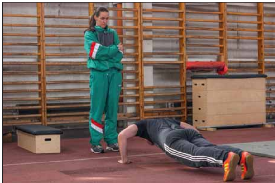
A zászlós sporttaszaltalataival segíti a testnevelési követelmények teljesítését