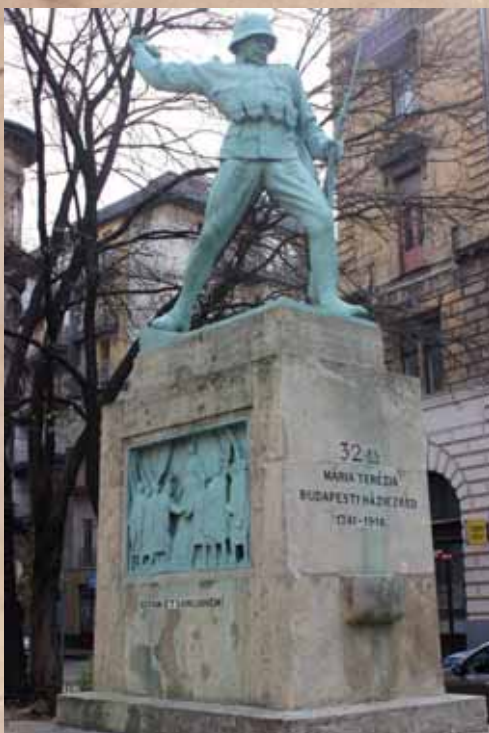
Budapest emlékezik A 32-es Mária Terézia Budapesti Háziezred emlékműve Budapest VIII. kerületében; Józssefváros, Harminckettesek tere.