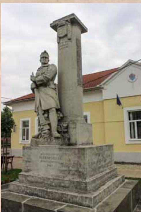
A vidék is emlékezik Az emlékművet nemes Besenyőtelek község közönsége állította 1923-ban az 1914-1918 közötti időszakban elesett hősök emlékére.