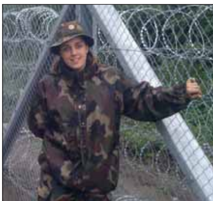
Dosztál örvezető részt vett az ideiglenes biztonsági határzár kiépítésében

Első, saját festményeiből összeállított kiállítását éppen a katonai pályáját elsőként segítő szegedi toborzóiroda kezdeményezésének köszönhetően sikerült megnyitnia 2015. december 15-én, 21 kiállított képpel. Munkái igen szürrealisak. Alkotásai elsősorban a sajátos színvilágukkal és formai változatosságukkal hívják fel magukra a figyelmet, ugyanakkor szereti az aprólékosságot, a kidolgozottságot. Kedvenc technikái közé tartozik az olaj és az akril. A két anyag sokban különbözik egymástól. Míg az olajfesték lassan száradó, nem vízbázisú anyag, erős szíkontrasztot