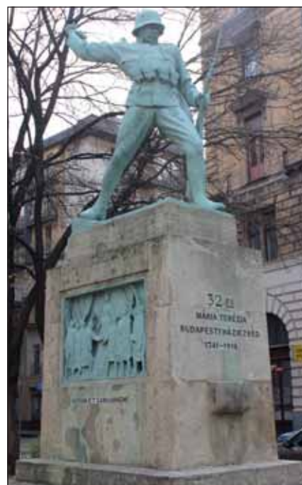
A 32-es honvéd gyalogezred első világháborús hősi halottainak emlékműve

Az ezred első, toborzás által állított legénysége főként Pozsony, Nyitra megyékből származott, míg későbbi fő toborzóhelye Kassa lett. 1848/49-ben nem egészen egy évre fő és fióktoborzó kerülete Eger, Balassagyarmat és Jászberény lett. 1781-től az ezred kiegészítését Pestről és a vele szomszédos vármegyékből nyerte. Tehát ettől az időponttól tekinthető az ezred Magyar-