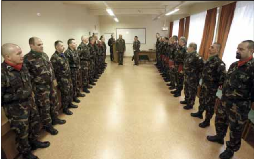
A tanfolyam hallgatói

jelentek meg a jelenkor követelményeit tartalmazó, napjainkban kiemelt figyelemmel kísért témakörök, mint a hátrámigrációs helyzet, a terrorizmus és más, a biztonságpolitikát érintő kérdések is. Ez a széleskörűen összeállított és átadott ismeretanyag is mutatja a vezető altiszti tanfolyam jelentőségét, kiemelt fontosságát.