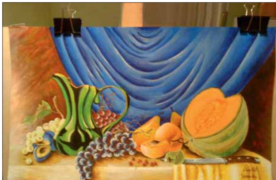
Az amatőr művésznak Csontváry Kosztká Tivadar a példaképe, különösen a színek használatában gyakorol rá nagy hatást

A magyar kultúra napja kapcsán versek, prózai művek, színdarabok és zeneművek jutnak elsőként eszünkbe, de aztán felsejlik a képi megjelenítés, a festészet és fotóművészet is. Úgy vélem, a festészet hozzátartozik egyetemes kultúránkhoz, ezt számtalan világhírnévre szert tett magyar művész bizonyítja. Sőt, ahogyan a mindenki által jól ismert bölcsesség tartja: egy kép többet mond ezer szónál.