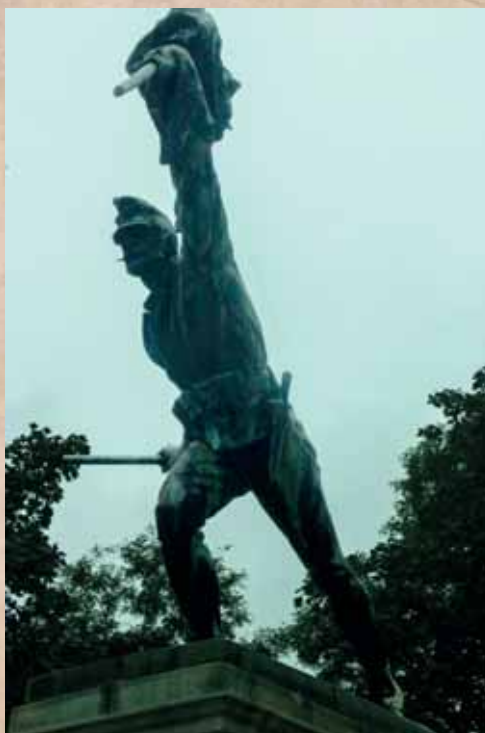
Istennel a hazáért előre! A cinkotai emlékmű 104 magyar katona-hősnek állít emléket a Gödöllő-Hatvan felé vezető út mentén.