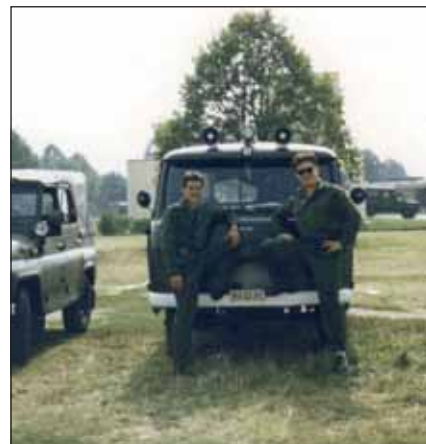
Sorkatonaként 1991-ben (balról)

A repülő-műszaki éveket követően a földi repülésirányítás területén dolgozott különböző beosztásokban. Az 1995-ben Taszárra érkező amerikai csapatokkal való közös szolgálat