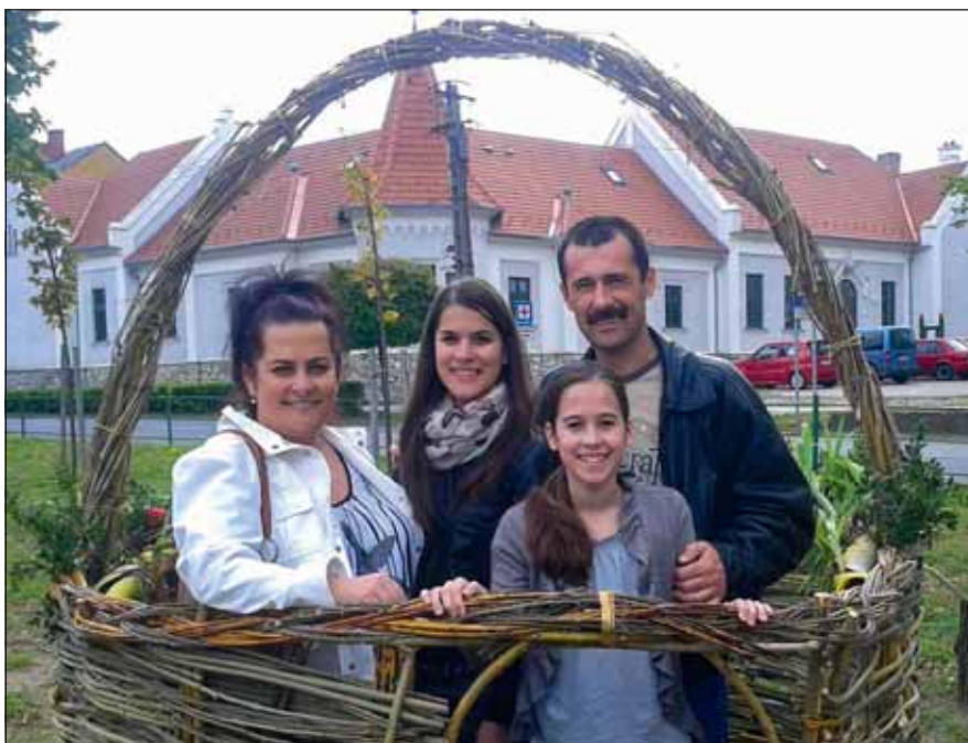
Családi fotó 2014-ből