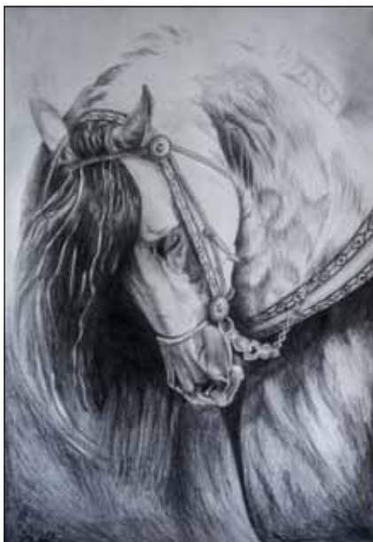
Az alkotó szereti az aprólékosságot, a kidolgozottságot

és éles fény-árnyék hatást lehet vele kifejezni, addig az akril gyorsan száradó, vízbázisú, könnyen használható, száradás után műanyag hatásúvá váló matéria. Mindkettő szintartóssága kiváló. Példaképként Csontváry Kosztka Tivadar festészetét állította maga elé, akinek a műveit varázslatos színvilág és szuverén szimbólumteremtő erő jel-