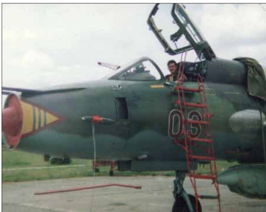
Örmesteri váll-lappal 1992-ben