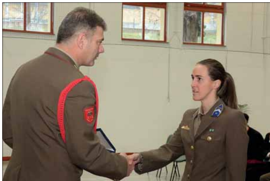
Az Év sportolója cím átvétele 2013-ban

– A futás sok mindenre tanít, például önfegyelemre, türelemre, fokozatosságra. Semmit nem adnak ingyen, mindenért meg kell dolgozni, ehhez viszont sok idő kell. Meg kell tanulni türelemmel kivárni, mire a befektetett munka megtérül. Önbizalmat is növel, ha a kitűzött célokat elérem. Katonaként számtalan párhuzamot látok ezen értékek és a hivatásom között. Számtalan élethelyzetben segítettem már, hogy ezeket az élményeket és gondolkodásmódot magaménak mondhatom, fejleszthetem.