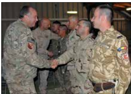
Az ACO rangidős altisztje minden helyzetben támogatja a parancsnokát

– Nem igazán van családi életem mostanában. A családom nincs velem, így a legtöbb időt a munkával töltöm. Sajnos mi, katonák saját bőrünkön tapasztaljuk, hogy milyen sokat vagyunk távol a szeretteinktől. Szerencsés vagyok, hiszen a feleségem már 12 éve mellettem van, és a támogatása, valamint a tudat nélkül, hogy otthon minden rendben van, nem tudnám végezni a munkám. Neki ugyanannyira része van a sikereimben, mint saját magának. Abban a kevés szabadidőben, amim van, a barátommal találkozom Mons-ban, vagy repülök haza Horvátországba a feleségemhez és a fiaimhoz.