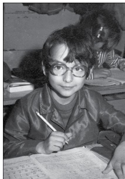
Igen korán, már az általános iskolás évek alatt kialakult a katonai hivatás iránti vonzalma

volt, majd 1999-ben a legelső külszolgálatom Albániában, amelyre maig jó szívvel emlékezem. A pályámat illetően fontos határvonalnak tartom, hogy 2000-ben a székesfehérvári logisztikai század vezénylőszáslósává neveztek ki. Ugyancsak meghatározó a 2007-es esztendő, amikor elnyertem a híradószáslóalj vezénylőszáslósi beosztását, valamint a 2015-ös év, amikor januárban kineveztek az MH 43. Nagysándor József Hí-