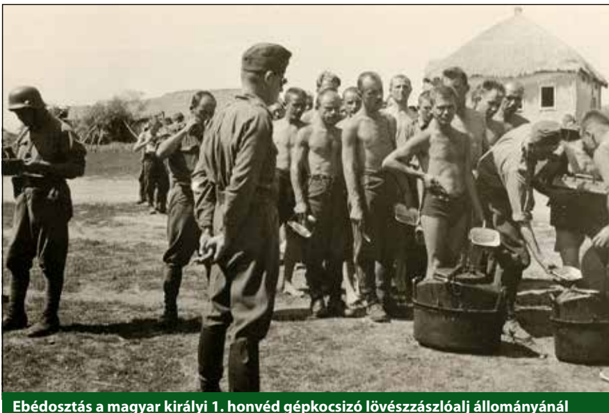
Ebédosztás a magyar királyi 1. honvéd gépkocsizó lövészszázalaj állományánál

re, esetenként a helyi lakossággal való csereüzletekre, s csak kisebb részben a hadművelleti terület gazdasági kiaknázását végző német szervek általi juttatásokra korlátozódott. A téli időszakban azonban valamennyi lehetőségnek komoly korlátai támadtak.