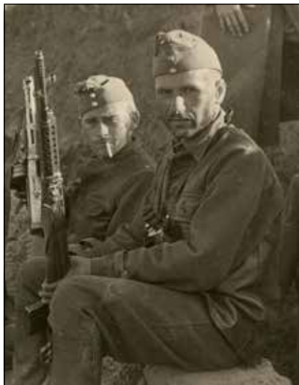
Honvédek pihenőidőben 1942 augusztusában, kezükben zsákmányolt szovjet fegyverek

domásul, hogy a magyar csapatok élelmezéséről a hadszíntéren – a megszállt ukrán területen felhalmozott saját készleteiből – a német hadsereg fog gondoskodni. Ezen megállapodásban vállalt kötelezettségüket a németek természetesen a saját normaadagolásuk szerint teljesítették. Műméz, kondenzált tej, sajt, margarin, pudringpor, cukor, csokoládé és számtalan konzerv váltotta fel az ízes és tartalmas ételeket. Az első vonalban szolgálatot teljesítő honvédek többnyire naponta egyszer kaptak meleg ételt, este rendszerint hideg ennivalóval kellett beérniük. A csapatok élelmiszer-szükségleteinek kiegészítése a gyakorlatban javarészt a helyszíni beszerzések-