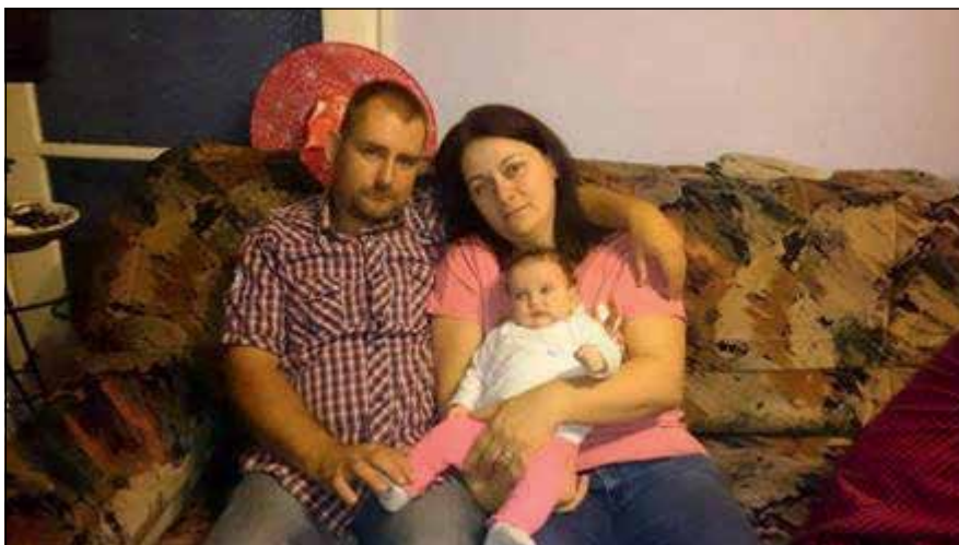
A szülők a már nagyon várt új családtaggal