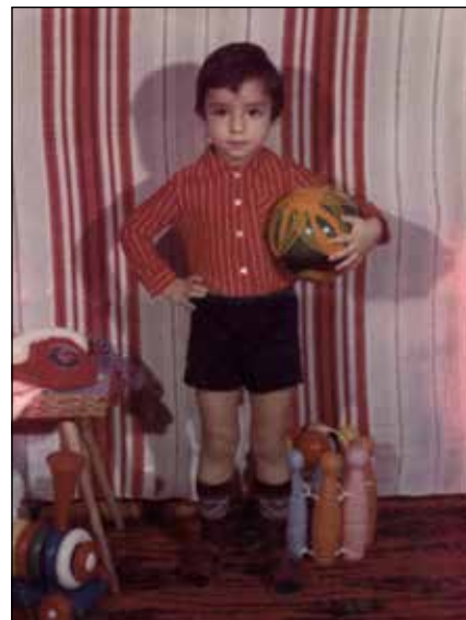
Ekkor még focistának készült

– Az első, számomra fontos állomás az 1993-as őrmesteravatásom