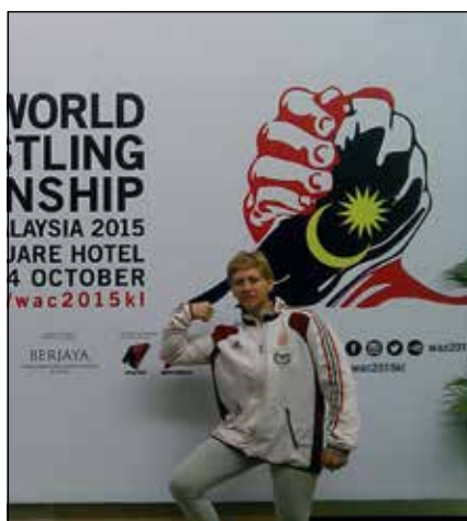
A sportoló ez évben Malajziából tért haza érmeikkel

Rajtam nem múlik, én mindent megteszek, lelkiismeretesen készülök, elszántan edzek. Nagy álmom, hogy a világbajnoki dobogó legtetijén álljak, aranyéremmel a nyakamban, és a hazámért, értem szóljon a magyar Himnusz.