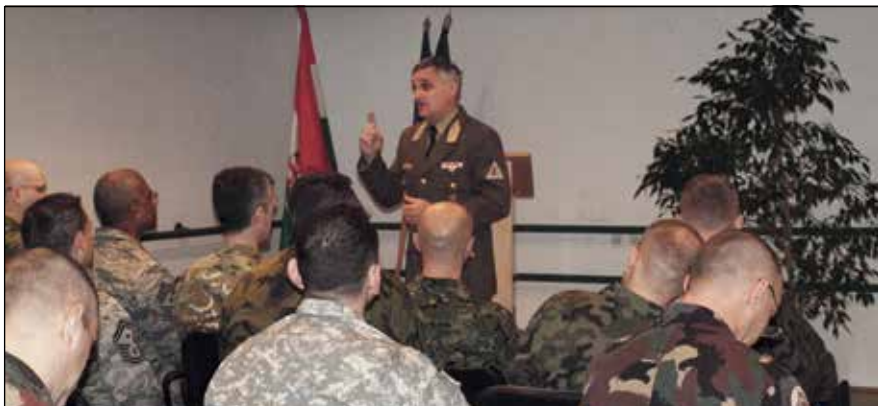
Bozó Tibor dandártábornok, az MH Altiszti Akadémia parancsnoka beszédet mond a rendezvény megnyitóján

A nemzetközi héten az ÖVAT 3-tanfolyam állományán kívül a Magyar Honvédség egység szintű vezénylőzászlósa, az alakulatokat képviselő vezető altisztek mellett a STANAG 2.2.2.2 angol nyelvtanfolyamon részt vevő állomány is lehetőséget kapott ismeretei ilyen irányú bővítésére. A továbbképzés egyik érdekessége volt a szerb haderőben működő altisztfejlesztés