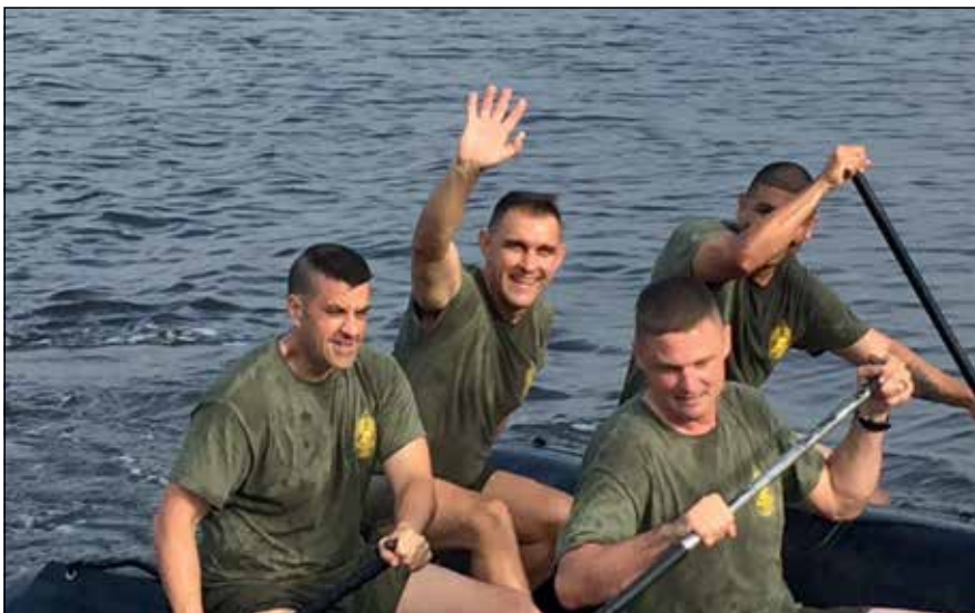
Jelszó: „Aki lemarad, kimarad!”. Ezzel minden tengerészgyalogos tisztában van