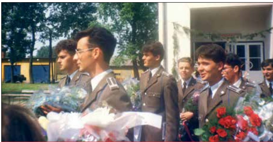
Ballagás a katonai középiskolában

– A vezénylőzászlós is, mint bármely más vezető beosztásban tevékenykedő ember, mindig tanul és igyekszik fejleszteni a képességeit mind elméleti, mind pedig gyakorlati ismeretekkel. A munkámhoz elengedhetetlen, hogy ismerjem az időgazdálkodás, illetve konfliktuskezelés hatékony módjait, továbbá a modern pszichológiára épülő tárgyalástechnikai módszereket. Fontosnak tartom, hogy vezetőként képes legyek megfelelő nyitottsággal, rugalmassággal és dinamizmussal