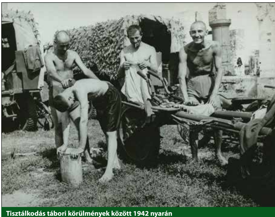
Tisztálkodás tábori körülmények között 1942 nyarán

Örökké visszatérő téma volt a legénységnek az elégtelen étellemezés is. A magyaros ételekhez szokott honvédek keserűen vették tu-