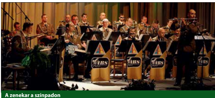
A zenekar a színpadon