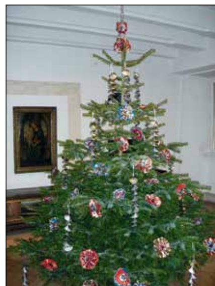
A Nagytétényi Kastélymúzeum karácsonyfa-kiállításának egy darabja