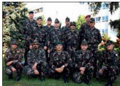
A Magyar Honvédség legmagasabb szintű altiszti képzésén 13 rangidős altiszt vesz részt

Az idejű tanfolyam sok tekintetben unikumnak számít. Az egyik sajátossága, hogy mind önálló, mind pedig kötelekzászlóalj-szintű vezénylők részt vesznek a tanfolyamon tíz különböző alakulat képviselőiben. A megoszlás is érdekes, hiszen a hallgatók az MH Összhaderőnemi Parancsnokság alárendeltségébe tartozó szárazföldi és légi haderőnemek, a Honvéd Vezérkar közvetlen, valamint az MH Logisztikai Központ alakulataitól érkeztek. A beiskolázott vezénylőzászlósok által képviselt szakterületek tekintetében is izgalmas a kurzus összetétele, mivel harcoló, harctámogató, harcbiztosító alakulatok altisztjei egyaránt megtalálhatók a névsorban, de az oktatás területéről is érkeztek hallgatók. A már felsorolt szakmai elemek sokszínűsége biztosítja a kurzus alapvető céljai között szereplő