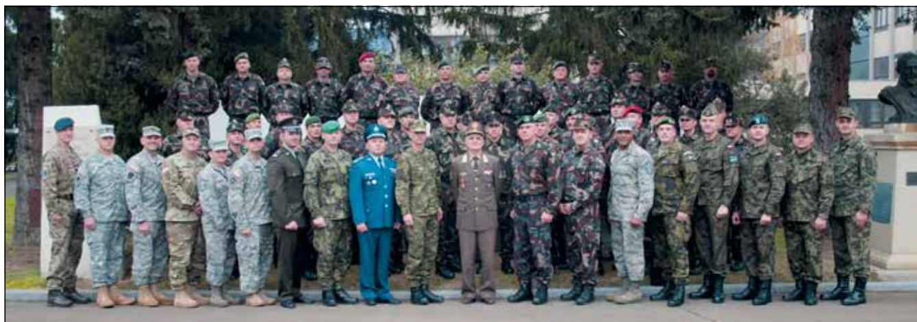
A tanfolyam kitűnő lehetőséget biztosított a NATO-val, a részt vevő partner- és tagországokkal kapcsolatos ismeretek bővítésére

A második, az általános modul, más néven erőgazdálkodás-ismeretek, sokrétű információt biztosít például az egészségügyi ellátás rendszeréről, a logisztikai bizto-