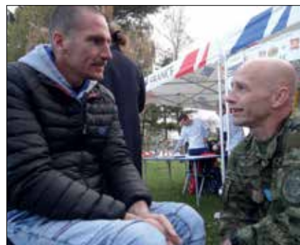
A Szövetséges Műveleti Parancsnokság vezénylőzászlósa számára fontos a nyíltság és megközelíthetőség