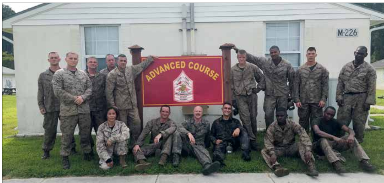
Emlékfotó a tanfolyamtársakkal