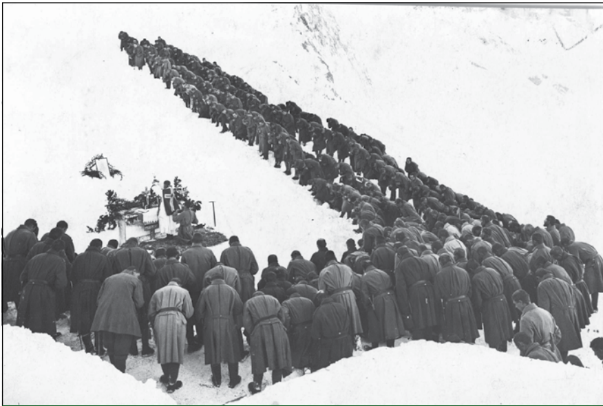
Tábori mise 1942 telén

domásul, hogy a magyar csapatok élelmezéséről a hadszíntéren – a megszállt ukrán területen felhalmozott saját készleteiből – a német hadsereg fog gondoskodni. Ezen megállapodásban vállalt kötelezettségüket a németek természetesen a saját normaadagolásuk szerint teljesítették. Műméz, kondenzált tej, sajt, margarin, pudringpor, cukor, csokoládé és számtalan konzerv váltotta fel az ízes és tartalmas ételeket. Az első vonalban szolgálatot teljesítő honvédek többnyire naponta egyszer kaptak meleg ételt, este rendszerint hideg ennivalóval kellett beérniük. A csapatok élelmiszer-szükségleteinek kiegészítése a gyakorlatban javarészt a helyszíni beszerzések-