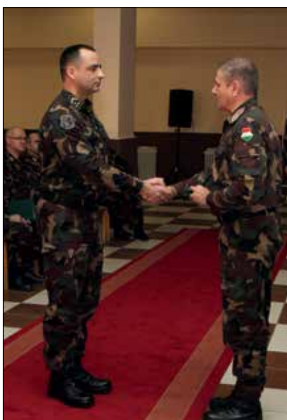
A Magyar Honvédség első számú katonájával, dr. Benkő Tibor vezérezredessel

építeni az ezrednél szolgáló legénységi, altiszti állomány és a Magyar Honvédség nimbuszát.