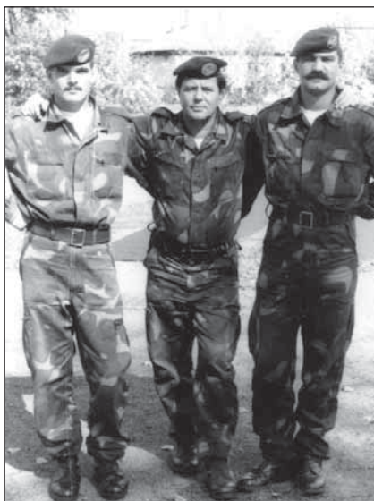
A szerző (balról) egykori katonatársai-val

Az életünket öt pont határozta meg, 1) a feladat, 2) a fegyver, 3) a felszerelés, 4) a katonák 5) és a kaja. Nagyon egyszerű szemlélet, úgy gondolom. Ha ezeket betartjuk, akkor minden rendben. Ezek a pontok segítenek az alkalmazás előtti