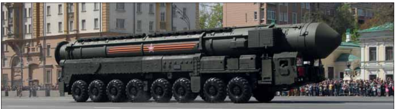
Az újonnan bemutatott eszközök között szerepelt az RSz-24 Jarsz típusú interkontinentálisrakéta-indító (ICBM) harcjármű is

A harcjárművek felvonulását szintén a „győzelem fegyvereit” bemutató eszközök kezdték meg. Elöl a legendás T-34/85 típusú harckocsiból álló alegység haladt, majd a Szu-100 típusú páncélvadász-alakzat következett. Ezek után érkeztek a korszerű eszközök, köztük a BTR-82AM, a BTR-80 tengerészgyalogság részére kifejlesztett korszerűsített változata, és látható volt a BMD-4M deszantharcjármű,