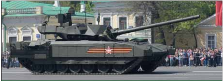
Nagy érdeklődés előzte meg T-14-es harckocsik felvonulását

A gyalogos felvonulás sorát a győztes alakulatok, valamint az egyes frontok zászlóit vivő katonák menete nyitotta meg. A szárazföldi