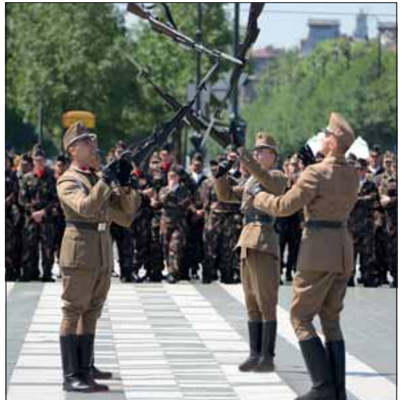
Az MH BHD 32. Nemzeti Honvéd Díszegységénél elhivatott altisztek szolgálnak

és utáni feladattisztázásnál. Egy biztos, ha a katonát látja, hogy csak akkor ülsz le magaddal foglalkozni, amikor már neki mindene megvan, akkor a tűzbe megy érted. Ha ezt nem teszi meg ezek után, akkor nincs helye a csapatban.