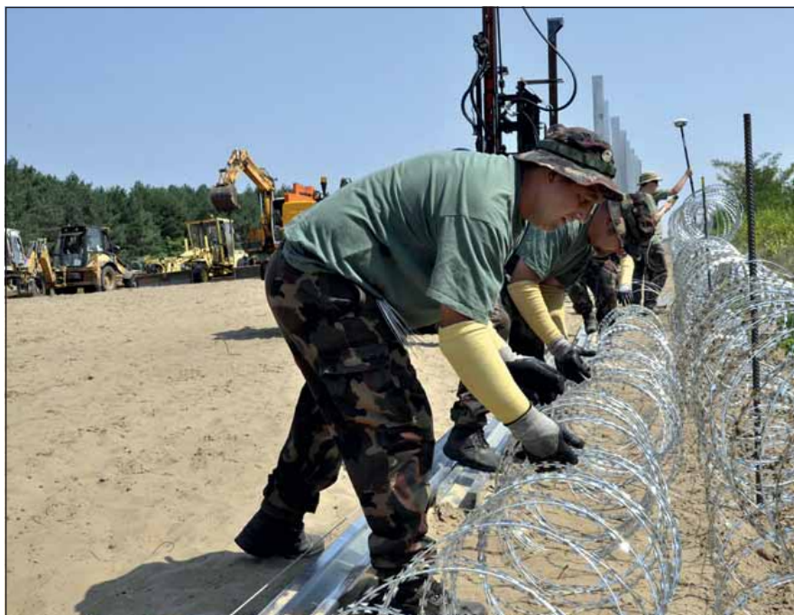
Ez év nyarán-őszén a Magyar Honvédség rég nem látott nagyságú és horderejű feladatban vett részt

Különösen fontos szerep hárul a családra, ha a szülők valamelyike hosszabb-rövidebb időt távol tölt, ritkábban jár haza. Egy ilyen helyzet megterhelheti a mégoly harmonikusnak tűnő kapcsolatokat is. Ilyenkor a család egy időre „egypiléléssé” válik, ami az otthon maradt félnek jelentős pluszterhet jelent, hisz nincs, akivel a napi rutinfeladatokat megoszthatná, akivel a felelős döntéseket meghozhatná. A másik fél, aki távol van, kénytelen nélkülözni a számára igazán fontos személyeket. Minél erősebb a családon belüli kötődés, érzelmileg annál megterhelőbb az érintettek számára a távollét.