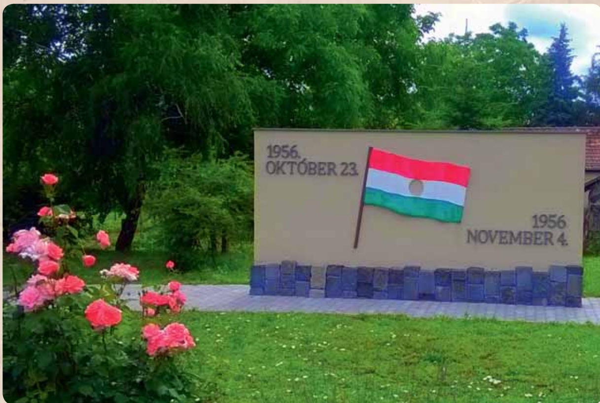
Emlékhely, úton a püspökszilágyi lőtér felé

A Johann Kempen von Fichtenstamm parancsára 1849. október 6-án kivégzett gróf Batthyány Lajos Schickedanz Albert által tervezett mauzóleumát 1874-ben állították fel a mai Fiumei úti temetőben.