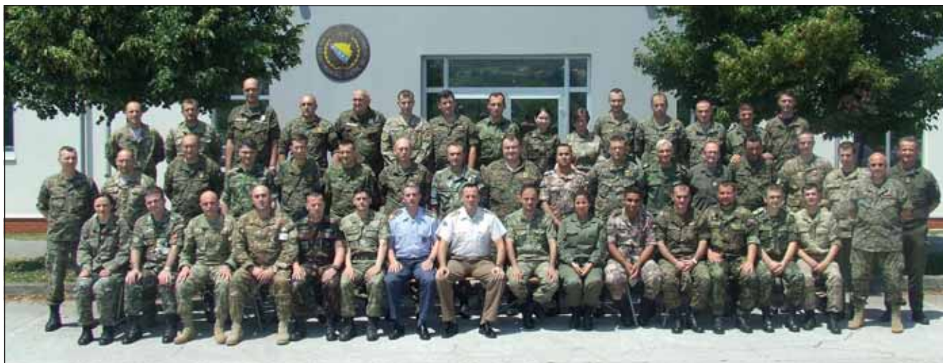
Csoportkép a tanfolyam résztvevőiről, az oktatókról és a hallgatókról

Ukrajna, Jordánia) 7 külföldi hallgatót foglalt magába. Természetesen, mint minden más tanfolyamnak, ennek is voltak „bemeneti” követelményei. Alapvető elvárás volt a minimum STANAG 2-es szintű angol nyelvtudás, az alapszintű számítógép-kezelési ismeret, illetve az alap altiszti tanfolyam elvégzése.