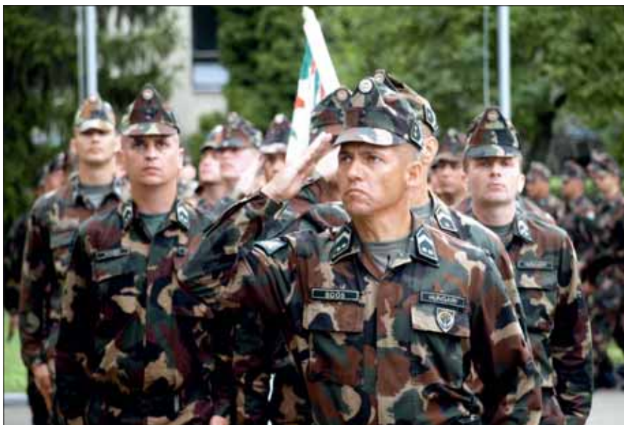
A törzsszászlós 2013 augusztusától tölti be az MH Altiszti Akadémia vezénylőzászlósi beosztását

aki olyan órát tartott, hogy leesett az állam. Nagyon tisztellem a tudást és legalább ennyire a profeszszionális hozzáállást, mert a tehetőség egyedül nagyon kevés, ha nem társul akarattal, akkor az inkább átok, mint áldás. Visszatérve a példaképekre: talán példakép lehet az a srác is, akinek nem tudom a nevét sem, csak köszönünk egymásnak találkozáskor. Mindennap látom a laktanya és a Duna-part közötti kerékpárúton, én futok vele közösen, ő pedig hajtja magát a kerekesszékekben, próbál ember maradni és emberi életet élni, úgy is, hogy a legkevésbé sincs irigylésre méltó helyzetben. Az emberi tartás, a jó szándék és leginkább a cselekedetek emelhetnek valakit példaképpé.