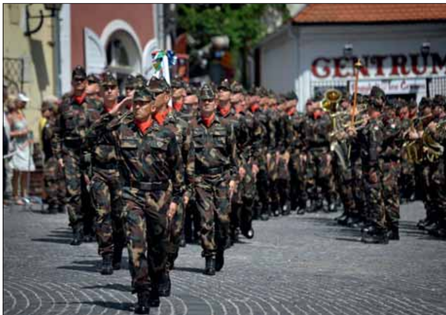
Díszmenet Szentendre főterén

A rendezvényt megtisztelte jelenlétével Magyarország honvédelmi minisztere és a Honvéd Vezérkar főnöke. „Sok minden megváltozott