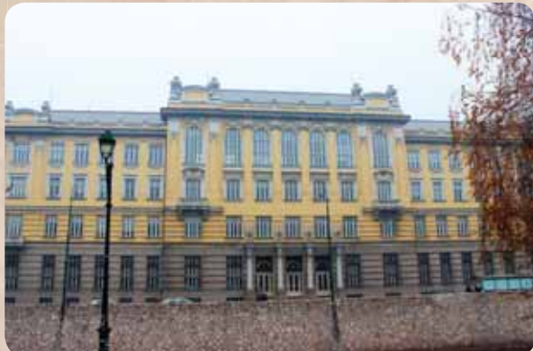
Az első posta

1869. október 1-jén az Osztrák–Magyar Monarchiában alakították meg először a postai szolgálatot. A Bosznia-Hercegovina – az 1878-as berlini döntés alapján történt – megszállását követően Szarajevóban felépített katonai (hadi-) posta mai képe a Miljacka folyó partján.