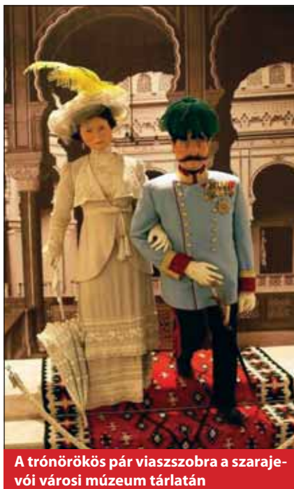
A trónörökös pár viaszszobra a szarajevói városi múzeum tárlatán

A főméltóságú pár 1914. június 27-én, késő délután érkezett Ilidža híres szállodanegyedébe. Vélhetően érezhető volt bizonyos felszabadult hangulat köreikben, hiszen a hadgyakorlat simán „lement”. Talán ennek tudható, hogy egy hirtelen ötlettől vezérelve beutaztak Szarajevóba, a „42 ezer fő lakosú egzotikus félkeleti városba, iparművészeti boltokat kerestek fel, köztük szőnyegárudát.” Mi is voltunk ott – a kirakatokat látva egyik társunk találóan jegyezte meg, hogy „ilyen a bazárba zárt idő.” Mi arra voltunk kíváncsiak, hogy Ilidžában mi zárta be az időt. Maradt-e „monarchiás hangulat”? A négysoros allén trappoló konfli-