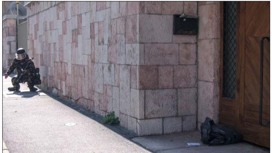
A bejáratnál „felejtett” bőrönd

Mind kiderült, a „bőröndös akció” csupán figyelemelterelés volt, ugyanis nem sokkal később az objektum hátsó bejáratát egy teherautóval, óriási robajjal betörték, ám a gépjárművet a felállított vasbeton