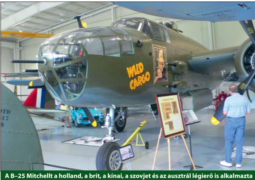
A B-25 Mitchellt a holland, a brit, a kínai, a szovjet és az ausztrál légierő is alkalmazta