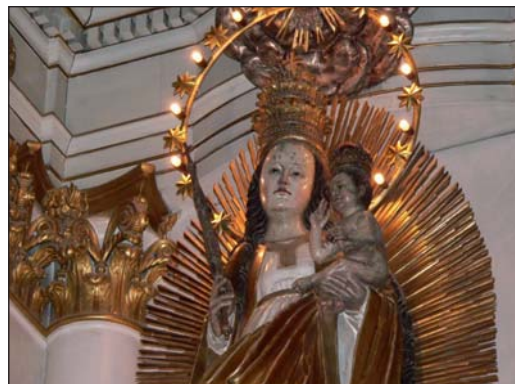
Nagyboldogasszony napja a Mária-kegyhelyeken híres búcsúnap

Augusztus hónap a MH Altiszi Akadémia, az altisztek és leendő altisztek életében hagyományosan a bevonulás, a különböző alapki- képzések, a tanév kezdete. Az első évesek várakozással és bizalommal tekintenek előre és megkezdik ka-