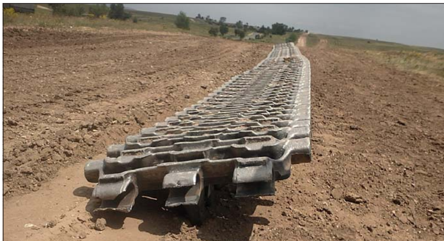
2015. június 8-án a gyakorlótér újra láncok gyötréséről porlott

Pirkadatkor kékesfehér füst száll az erdő fölé, beindultak a motorok, az esti körlet nyomait szorgos kezek takarítják. A menetoszlop megalakítását rádióval kapott rövid utasítások jelzik. A század a készenlétet kis idő elteltével eléri, elkezdik a biztosított menetet a támadóállás-körletként kijelölt erdős terület irá-