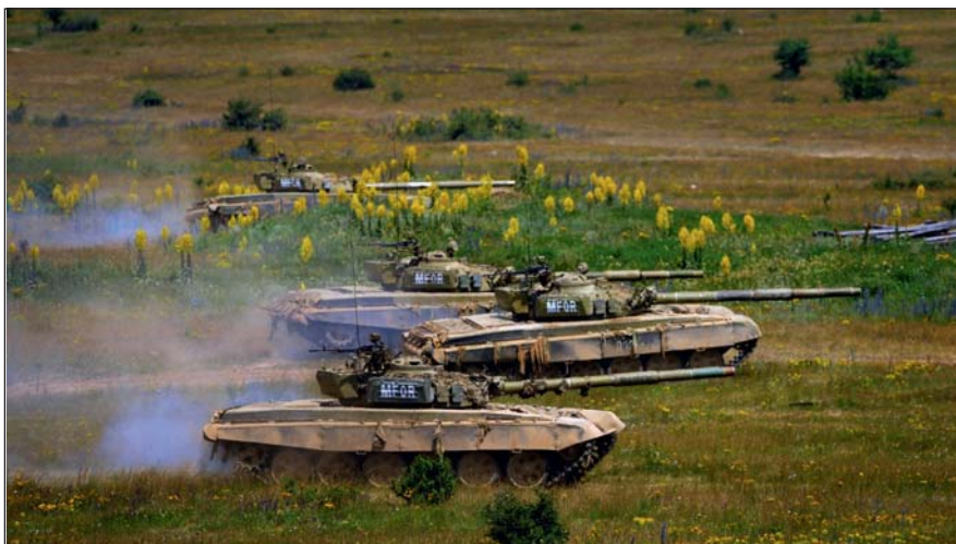
Harcokocsik éles lögyakorlata: az összhang megkérdőjelezhetetlen, a látvány felemelő, a hanghatás félelmetes

nyában. Az erdei úton sorra tűnnek elő a soktonnás monstrumok. A frissen feltört föld illata a dízelmotor kipufogófüstjével keveredve megmagyarázhatatlanul kellemes, mással össze nem hasonlítható, a harckocsizók sajátjává vált élménnyel ajándékozza meg a fanatikusokat. A tornyok a meghatározott rendben, a biztosítandó terület irányába néznek. Az ellenerőszázad kijelölt állománya szórványos ellenséges tevékenységet imitálva húzódik vissza Hajmáskér irányába. Minden megtett kilométer kihívásban és feladatokban bővelkedett, ezzel segítve a század felkészülését, valamint biztosítva a lehetőséget arra, hogy az alegység számot tudjon adni az eddig végrehajtott kiképzéseken megszerzett tudásáról. A támadóállás-körlet elfoglalását követően, a hajnaltól kora délutánig tartó harcászati mozzanat végén jut egy lélegzetvételnyi idő arra, hogy a katonák ellenőrizzék a fegyvereiket, a felszereléseket, végrehajtsák az előírt technikai kiszolgálásokat. Egyben felkészülnek a délutáni támadó feladat végrehajtására, a célobjektum elfoglalására. A század parancsnoka újra (már sokadik alkalommal) terepasztalt készített, ahol aztán a műveleti terület berendezése után megkezdte az együttműködés megszervezését a támadó feladatban részt vevő alegységek között.