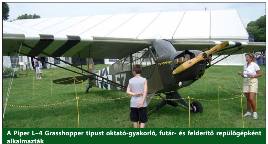
A Piper L-4 Grasshopper típust oktató-gyakorló, futár- és felderítő repülőgépként alkalmazták

A kilencedik alakzat a „Nagy Hét” néven repült. A Nagy Hét az 1944. február 19–26. közötti napokat jelentette, amikor nagyszabású bombatámadást intéztek a német repülőgépgyártás ellen. A B-17 és B-24 típusú amerikai bombázók közül 3000 Angliából, 500 Olaszországból szállt fel, és mintegy tízezer tonna bombát dobott le. A B-17 Flying Fortress négymotoros egyi-