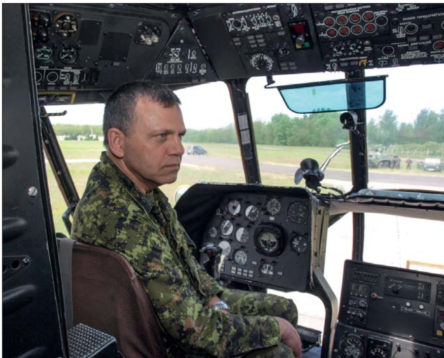
A kanadai vendég Szolnokon kezdte az ismerkedést a Magyar Honvédséggel

Másnap Magyarország történelmével és kultúrájával ismerkedett a kanadai vendég. Ehhez jobb helyszínt nem is találhattak volna a program szervezői, mint Eger. A főtörzszászlós már az odaúton elismerően nyilatkozott hazánk földrajzi adottságairól, a táj szépségéről. A hevesi megyeszékhely-