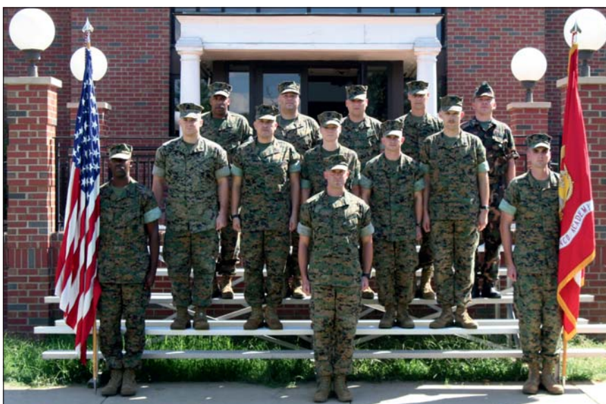
A főtörzsőrmester a külföldi képzések és a missziós szolgálat során jól hasznosíthatta magas szintű angol nyelvtudását

„Egyetlen magyar altisztként az afganisztáni hadszíntér különböző régióiból beérkező jelentések feldolgozásában, továbbításában, főként amerikai és angol tisztekkel, főtisztekkel dolgoztam együtt. A misszió befejezése után világossá vált számomra, hogy váltanom kell, mert még több szinten is bizonyítani akarok. A parancsnokaim lehetővé tették számomra, hogy átkerülhessek Kecskemétre, jelenlegi beosztásomba. Ez nagyon jó döntésnek bizonyult, mert itt teljesen más a felelősségi szint, aminek nap nap után meg kell felelnem. A