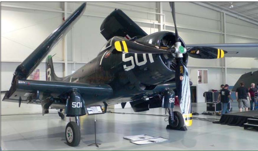
Egy AD-4 Skyraider repülőgép a múzeumi hangárban

ke a leghíresebb nehézbombázóknak. Kis számban a magyarországi bombázásokban is részt vett. Az alakzatot 2 B-17 alkotta.