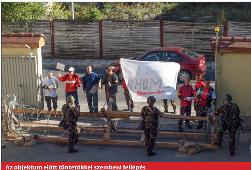
Az objektum előtt tüntetőkkel szembeni fellépés

A földi védelmi reagálóképességek fokozása érdekében számos váratlan eseményre, harci szituá-