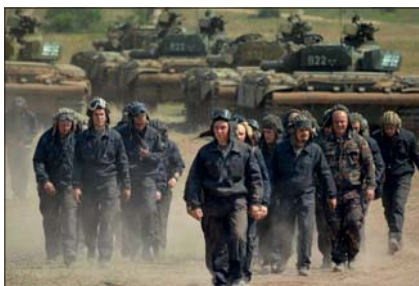
A technika és az azt alkalmazó személyzet összhangja példás volt

A harckocsiszakaszok és a lövészzakasz előrevonása, szétbontakozása felemelő látvány. A század egy meghatározott feladat