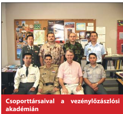
Csoporttársaival a vezénylőzászlósi akadémián