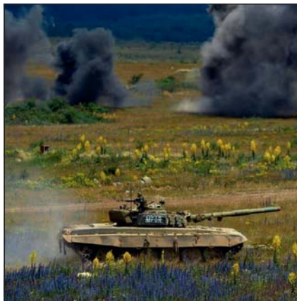
Az MH 25. Klapka György Lövészdandár 11. Harckocsizászlóaljának harckocsija a gyakorlótéren

A Gömbölyű-hegy lábánál kijelölt körletben nehézkesen cammognak be a vasszörnyek. Az aljnövényzet és a terepegyenetlenségek sem nagyon akarnak akár csak egy napra is egyé válni a nehézkes harckocsilánccal. A megindulási