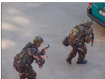
Az alakulat katonái gyorsan, határozottan és hatékonyan oldották meg feladataikat

A harc bármilyen formájáról is legyen szó, a siker az állomány ka-