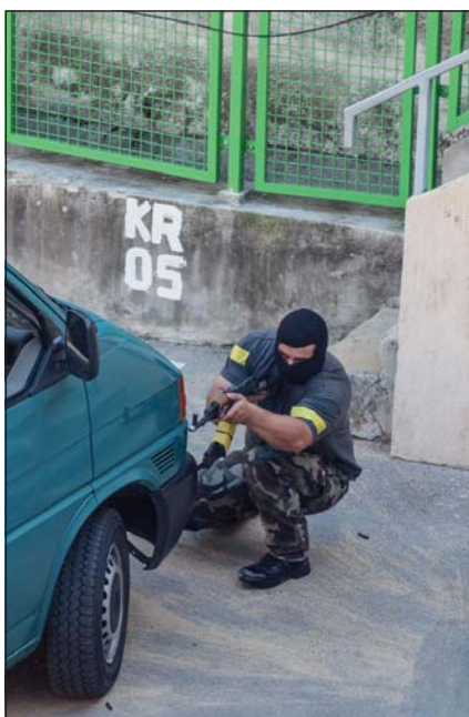
A védőknek számos váratlan eseményre, harci szituációra kellett reagálniuk

cióra kellett felkészülni, illetve reagálni: légitámadás, vegyi riadó, az objektum előtt tüntető tömeg széteszlatása, autóba rejtett pokolgép robbanása a bejáratnál, bomba a szikla udvarán, mesterlövész belövése a szemben lévő várból, aknarobbanás a sziklatetőn, sziklaomlás a bombázástól, sérültek mentése, osztályozása, ellátása, kórházba szállítása, tűzoltás és műszaki mentés, ki- és belépő személyek és gépjárművek ellenőrzése, átvizsgálása, vegyi mentesítés, a fokozott feszültséget, háborús stresszt nehezen tűró bajtársak lecsillapítása és megnyugtatósa, és nem utolsósorban a közös együttműködés a Veszprém helyőrségben lévő társszervekkel, a városi tűzoltósággal és a rendőrséggel.