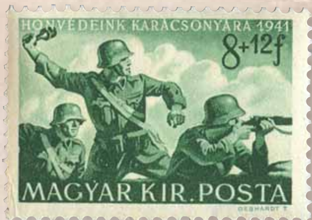
Gránátot dobó honvéd