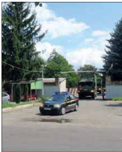
Oszlopmenet indul a káli objektumból

Az átvétel és a betárolás során a harcanyagraktár állománya sokéves tapasztalatával és anyagismeretével magas színvonalon látta el szakmai