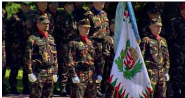
Nagy őrmester a csapatzászlóval

Nagy őrmester munkája során foglalkozott szerződéses állományú pályakezdők, katonai végzettséggel nem rendelkező tisztek és altisztek, tűzoltók, tiszti és altiszti hallgatók, önkéntes műveleti tartalékos katonák, sőt olimpiakonok kiképzésével is. Igyekezett minden olyan tanfolyamra jelentkezni és azt eredményesen teljesíteni, amelyet vagy a beosztásához, vagy egyéni ambíciói megvalósításához szükségesnek ítélt. Így fontos állomás volt számára 2012, amikor elvégezte a C-IED Train the Trainer (Rögtönzött robbanóeszközök elleni tevékenység) nemzetközi tanfolyamot. Ter-