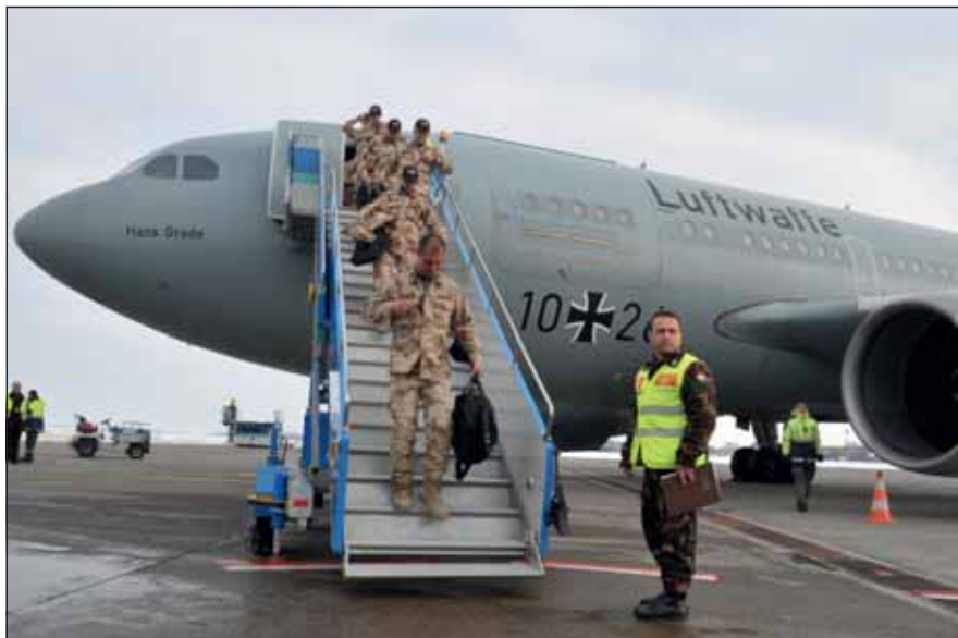
Amikor nem teher az utazás: hazaérkezés missziós szolgálatból

Az esetek döntő hányadában a katonák nehezen élték meg az alakulatok felszámolását, jobb esetben más helyőrségbe való átköltözte-