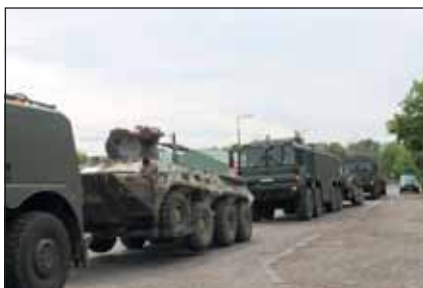
A szállításokat MAN, Mercedes és Volvo típusú konténerszállító gépjárművek, valamint RÁBA típusú tehergépjárművek végezték

feladatát. Sokat számított a korábbi nagy volumenű anyagátcsoportosítások során szerzett rutin. A konténerek Kál és Pusztavacs közötti rugalmas cseréje érdekében tranzitraktárakat alakítottak ki, melyek kezelői az átadó katonai szervezet képviselői voltak. A Pusztavacsra beszállított harcanyagokat az átadás-átvétel lebonyolításáig ezekben a raktárakban helyezték el. Az anyagok átvétele a meghatározott minőségi és mennyiségi ellenőrzés mellett történt, melyet a harcanyagraktár vezető állománya koordinált a helyi operatív részleggel.