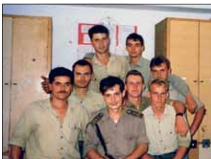
Az altiszt hamar megtanulta a kreativitás és a gondoskodás hasznosságát és alkalmazását

Utána éreztem, hogy a parancsnokaim és a szakmailag alárendeltek is bíznak bennem.