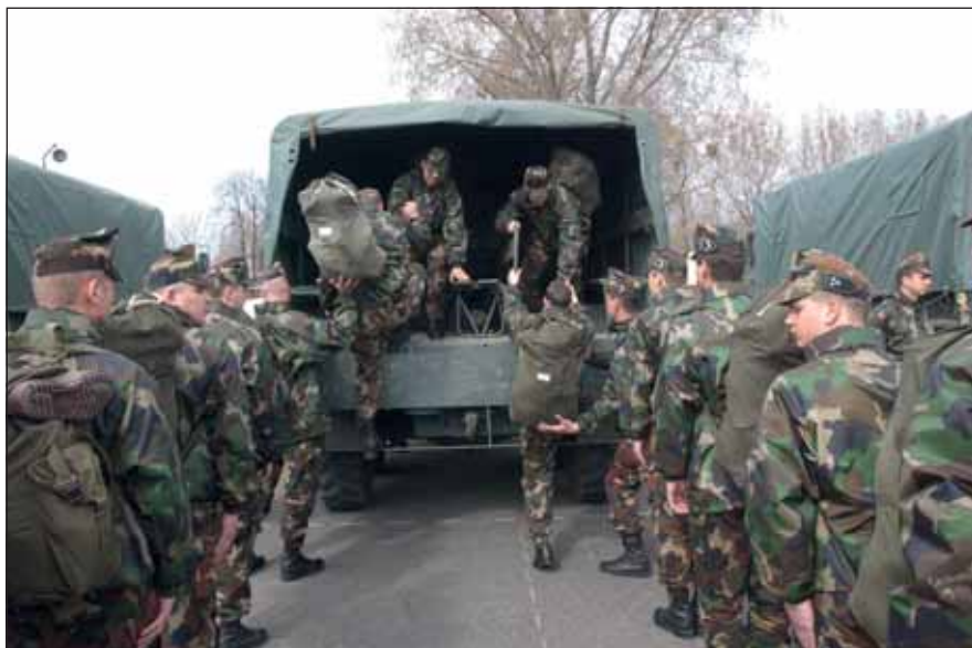
Az ingázás mellett a szolgálati feladatok is gyakran platóra szólítják az állományt

Köztudott, hogy az ingázás nem kellemes dolog, egy idő után fárasztó, sőt megterhelő; ha esik, ha fúj, ha