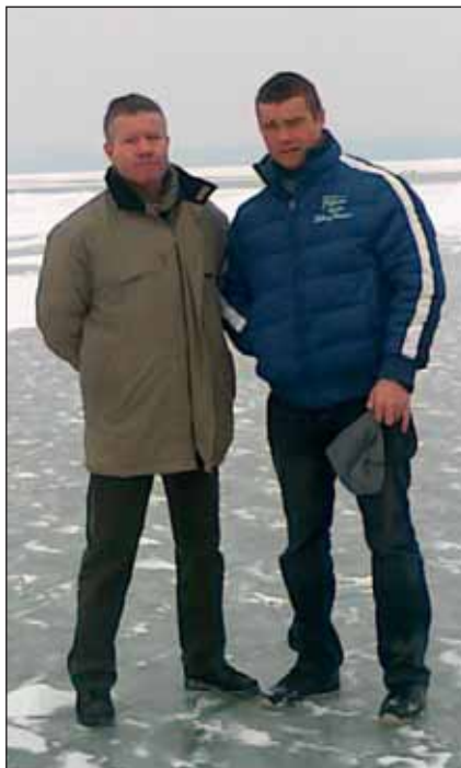
Apa és fia

Elismerések és kitüntetések szintén jellemzik a két katona életútját. Az