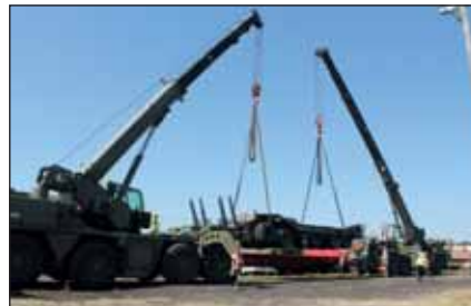
A daruzás nagy szakértelmet és összehangolt munkát igényelt

bevagonyozás, kötözés, őrzés-védelem, szállítmánykísérés, daruzás, logisztikai és egészségügyi biztosítás, operatív részleg-szolgálat, gépjárművezetés, riasztó-értesítő készenléti szolgálat, szállítmány-szakkísérés és felvezetés.