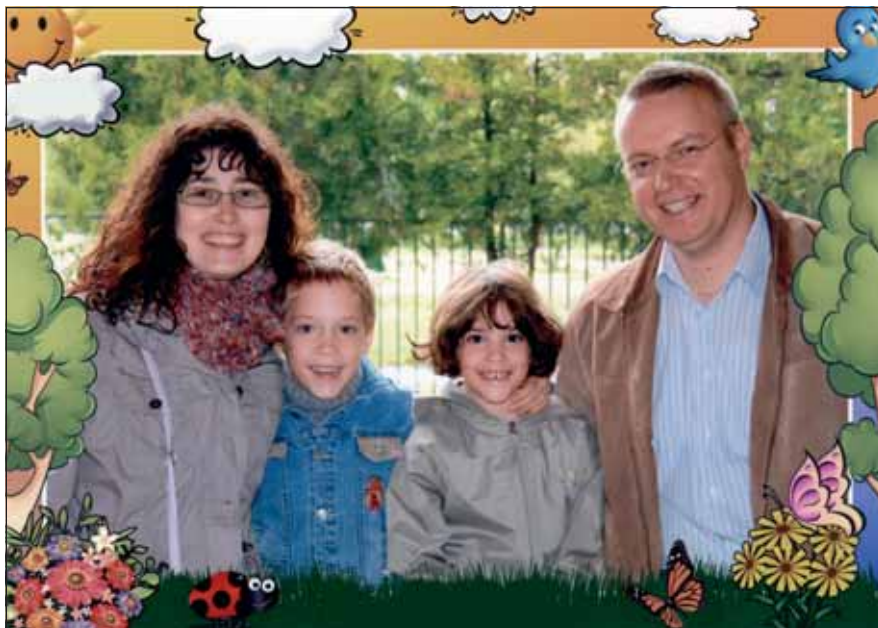
Asztalos főtörzsászalós: A lényeg az öröm, ami a karácsonyi készülődésnél és az ajándékozásnál megmarad bennünk és gyermekeinkben