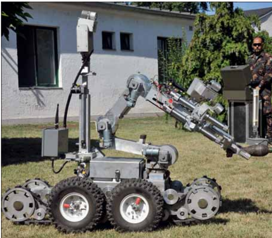
Az ANDROS F6A kezelését hathetes tanfolyamon sajátítja el az állomány

ugyanolyan könnyen fog bánni a másikkal. A 6 hetes tanfolyam elméleti oktatással kezdődik, ami alapvető fontosságú: először meg kell tanulni, hogy milyen az eszköz felépítése, milyen terhet bír, vagy milyen vezérléssel lehet működtetni (rádió vagy optikai kábel). Ezt követi az irányítás, ami ebben a fázisban még csak szervizkábelen történik (rövid, kb. 2.5 méteres kábel). Lényeges, hogy folyamatosan a robot mellett legyünk, és bevesszük, hogyan is mozog, reagál a karja a „parancsokra”; milyen módon kell egy akadályt megközelíteni, azon átmászni, és akkor hogyan is viselkedik a robot maga. Amikor már csak kamerákon keresztül mozgathatjuk a szerkezetet, természetesen minden más. Ezt a fázist kell a legtöbbet gyakorolni. A kamerán keresztül meg kell tanulnunk érezni a robotot, és biztosan tudni kell, hogy mire képes valójában, hol húzódnak működésének határai. Csak így képes a kezelő megtervezni, hogyan is fogja megoldani az adott feladatot. Nagyon sok gyakorlásra van ahhoz szükség, hogy az operátor magabiztosan tudja irányítani a robotot. A tanfolyamon a leendő kezelők csak a robot irányításának és karbantartásának alapjait képesek elsajátítani. A kurzus elvégzése után még nagyon sok gyakorlásra