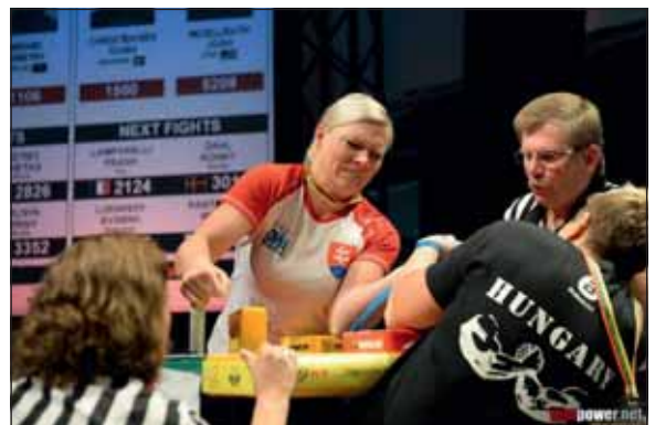
A sportágnak komoly és komplex szabályai vannak

– Mindenekelőtt rengeteg edzésel. Elsősorban súlyzós edzéseket végzek, minden izomcsoportra. Ezt úgy kell elképzelni, mint egy testépítő edzést, de én nem az izmok formálására törekszem, hanem minél nagyobb izomerő megszerzésére. Rengeteg olyan kiegészítő edzést is végrehajtok, amellyel a fogást és a tartást tudom fejleszteni. Ilyen gyakorlatok például a kötélmászás, ahol mindig láb segítségével nélkül, csak karból mászok fel és ereszkedem le, illetve a mostanság nagyon felkapott „street workout” edzések,