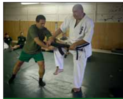
Fegyveres támadó ártalmatlanítása