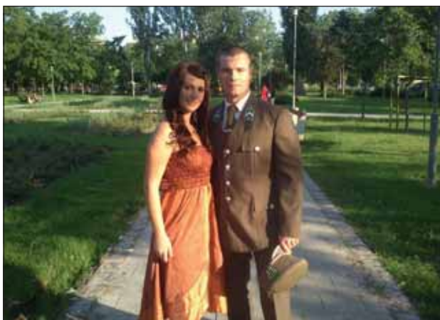
Az altiszt élete párjával