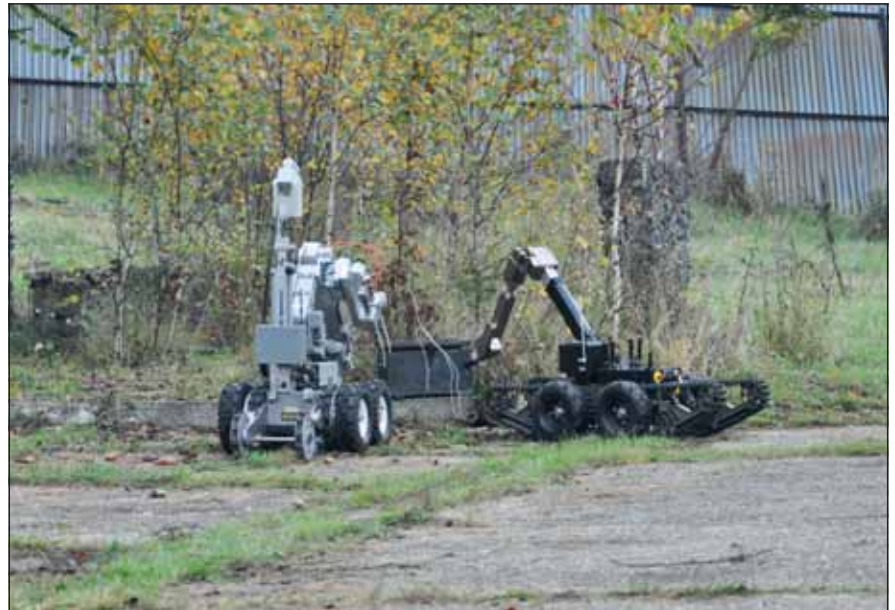
A két robot a szlovákiai Ground Pepper 2014 gyakorlaton

Ezúton szeretném megragadni az alkalmat, hogy egy kicsit alaposabban bemutassam a robotokat, hiszen nem csak annyit tudnak, hogy visszaadják a kulcsomót és felteszik a gyermekek fejére a sapkát. A külső szemlélő számára, kívülről nagyon egyszerűnek tűnik a kezelésük, de hozzá kell tenni: az, amennyit egy bemutatón látnak be-