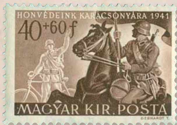
Zászlót tartó huszár