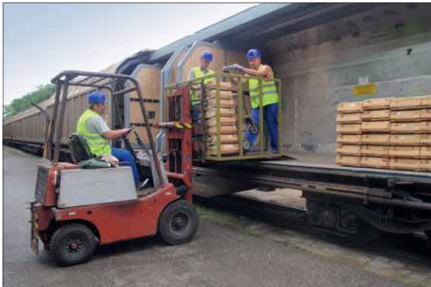
Előkészületek a vasúti szállításra

Táborfalván szakképzett állomány hajtotta végre a vagonokból a szállítmányok kirakodását, mely feladat az idő múlásával, az újabb és újabb szerelvények érkezésével egyre jobban és összeszedettebben zajlott. Minden második héten érkezett újabb szállítmány és ezzel együtt egy újabb kihívás az állomány részére: a vagonok kirakodása, majd az anyagok raktározása. Ez néha könnyebb, néha nehezebb és összehangoltabb munkát követelt, mivel a határidő igen szoros volt. Az altiszti állomány a munkálatokból aktívan kivette a részét: az anyagok átvételénél 3 fő zászlós dolgozott, akik 1 fő zászlós raktárvezető irányításával a kirakodásokat, az anyagok átvételét, a raktározási munkákat végezték. Az operatív részlegben 1 fő főtörzsőrmester a nyilvántartások naprakész vezetéséért volt felelős, 1 fő beosztott zászlós csapatlogisztikai munkálatokat, valamint fegyveres kíséresi feladatokat hajtott végre. Az intézményi tűzoltóság állománya 1 fő zászlós tűzoltóparancsnok vezetésével a katasztrófavédelmi feladatok biztosítását látta el. Egy