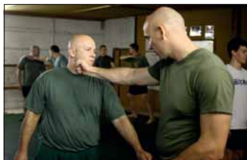
Háromszázhatvanöt érzékeny pontot tartanak számon a testen a szakemberek

Novemberben Szentendrén, a honvédség első számú kiképzőbázisán gyűltek össze az alakulatok testnevelői, akik módszertani foglalkozáson vettek részt összesen két és fél hét időtartamban. Az első héten többek között egy újralesztési tanfolyamot is tartottak a szakembereknek az MH Egészségügyi Központ munkatársai, a képzés gerincét azonban az alapszintű katonai közelharcjártasság fokozása adta. „A cél a folyamatos szinten tartás, és emellett azt is szeretnénk, ha a résztvevők a bőrükön éreznék az alaptanfolyam hatásait: ha belátják a közelharc szükségességét, jobban tudják ők is képviselni a közvetlen parancsnokuk felé, hogy ezekre a készségekre szükség van. Dr. Eleki Zoltán alezredes, az MH Kiképzési és Doktrinális Központ kiemelt főtisztje szerint a résztvevők többségének nincs különösebb jártassága a küzdősportokban. „Ezen a kurzuson mindenképpen