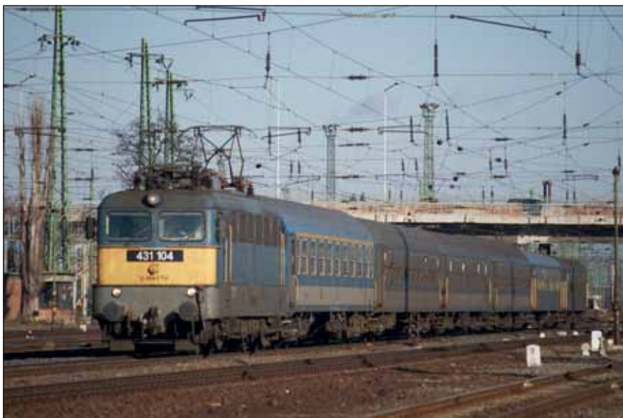
Szerelvény érkezik a Déli pályaudvarra. Vajon hány katonák készülődik a leszálláshoz?

Mikor kezdődik a munkaideje az ingázó katonának? Amikor kilép a lakás ajtaján és elindul a pályaudvarra, amikor felszáll a vonatra, buszra, beszáll a saját autójába, vagy amikor otthon nekiáll összecsomagolni, mert menni kell, és már a munkahelyén jár az esze (vagy „még mindig ott”, mert ilyen rövid idő alatt nem tudott kikapcsolódni, „leereszteni”, nem tudta ki-