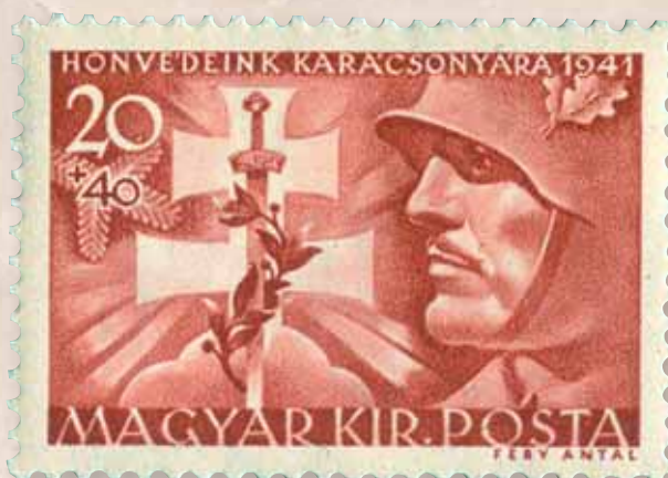
Kettős kereszt, honvédfej