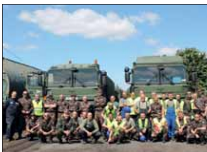
Az MH ARB altisztai és legénységi állományából kb. 200 fő vett részt a munkában

Kálból Pusztavacsra 1500 tonna harcanyag lett átszállítva közúton; 141 menetparancsot adtak ki, 148 esetben lett biztosítva fegyveres kísérő (minden esetben altiszt). A szállításokat MAN, Mercedes és Volvo típusú konténerszállító gépjárművek, valamint RÁBA típusú tehergépjárművek végezték, személyzetük közreműködésével. Kálból Táborfalvára 8 vasúti szerelvény több mint 3000 tonna harcanyagot szállított át, amely csak a számokat tekintve is hatalmas feladat volt, főleg az idei nyár időjárás viszonyosságai, a nagy meleg és a rengeteg eső közepette. Az állomány feltétlenül elismerést érdemel, hiszen sokszor reggeltől estig, hétvégi túlórákkal végezték munkájukat. Olyan kollégák is lelkiismeretesen dolgoztak, akik a laktanyák bezárásával nem maradnak tovább a honvédség állományában. Kalocsán május 26-án kezdődtek a munkálatok, melyekben összesen 148 katona vett részt, 102 fő altiszt és 46 fő legénységi állományú. Az ARB más bázisairól a feladatba 84 főt vontak be, 74 fő altisztet és 10 fő legénységi állományú katonát. Feladatuk volt a szállítás előkészítése, szállítás, vontatás,