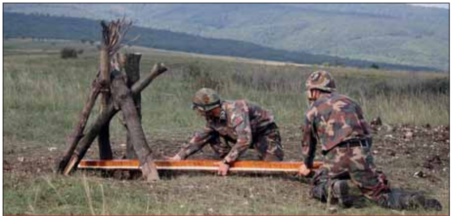
Szerelt töltet robbantása

Az áthelyezés utáni beilleszkedésemet segítette, hogy korábbi alakulattal, az időközben átszervezett MH 34. Bercsényi László Különleges Műveleti Zászlóaljjal kellett és kell együtt dolgoznom. Természetesen az irodai munka már nem volt ismeretlen számomra, mégis szinte mindent újra kellett tanulnom, a helyi viszonyoknak és elvárásoknak megfelelően. Nagy hasznát vettem a korábbi, főként a CKELMK-ben és a NATO-beosztásokban szerzett tapasztalataimnak, valamint a közvetlen munkatársak és az előljárók segítségének, iránymutatásának. Lassanként megtanultam az ÖHP működési rendjét, az ügyiratok elkészítésének fortélyait, hogy ki kinek írhat, ki mit írhat alá és hogyan, egyszóval – egyik kollégám szavait idézve – „ az irodai túlélés szabályait ”. Mivel a különleges műveletet mindig is egy kis titokzatosság vette körül, illetve egy a Magyar Honvédségen belül fiatal fegyvernem támogatása érdekében igyekszem tevékenykedni, ezért sok terület irányában szükséges az együttműködés. Talán az volt a leginkább szokatlan számomra, hogy a feladatok széles spektrumában való hirtelen váltásokat is tudjam kezelni. Előfordult például, hogy reggel még gépjárművet igé-