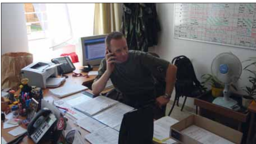
A napi feladatok végrehajtása közben