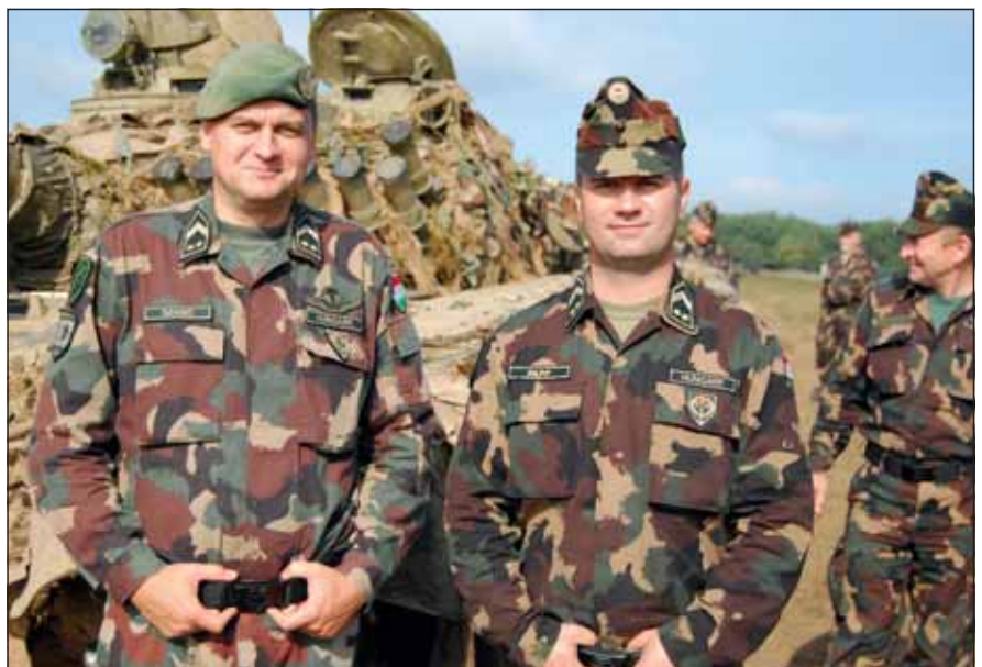
Altisztek a Közös Fellépés 2014 gyakorlaton

Az adminisztratív feladatokon kívül az értekezletek és rendezvények szervezésébe, a munka- és kiképzési tervek elkészítésébe, ügdarabok és parancsok előkészítésébe, valamint a napi tevékenység egyik fő platformját képviselő IMR-en (Információ Menedzsment Rendszer) folyó feladatvégrehajtásba, egyszóval a kidolgozó munkába is bevonták/bevonják a tapasztalt és rátermett altiszti állományt. Úgy érzem, tapasztalataimnak és az előjáróim türelmének hála, sikerült gyorsan beilleszkednem. Erre azért is nagy szükség volt, mivel – csakúgy, mint más alakulatoknál – az ÖHP-n is folyamatos létszámhiány van, ami nem engedi meg, hogy valaki csak egy feladatra koncentráljon. A részleget érintő összes feladat ellátásában az altiszti állománynak is jártasnak kell lennie, ami azért is fontos, mivel előfordul, hogy a tisz-