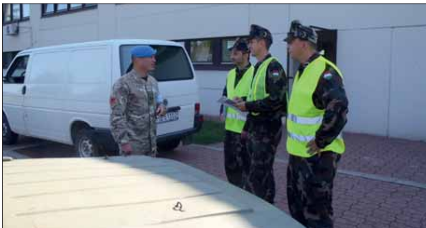
Az angol altiszt nagyon elégedett a magyar katonairendőr-jelöltekkel

ENSZ-katonákat érintő ügyekben kell eljárunk.