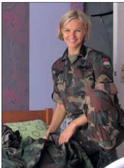
Az MH Altiszi Akadémián, immár egyenruhában

véleményem, akkor is, ha ez építő vagy nem építő, itt pedig újra kell tanulnom viselkedni, egy más rendszerben, máshogy szocializálódni.