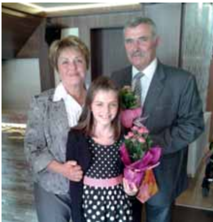
Nyers József köszöni feleségének a kitartást és erőt, amellyel olyan sokszor segítette át a katonái nehézségein

Nyers József ezredes a Magyar Honvédség II. Rákóczi Ferenc Műszaki Ezred parancsnoka. Nézem, ahogyan készülődik, s közben gondolkodom. Figyelem a mozdulatait, próbálom elképzelni a majdani interjút. Aláír még néhány papírt, miközben parancsokat ad, dönt, intézkedik. Megfontoltan, lassú, kimért gesztusokkal, határozottan. Tipikus parancsnok – villan át az agyamon, de hosszan elmerengni ezen nincs túl sok időm, mert pár pillanattal később már az iroda kényelmes foteljeiben ülünk, s elmélyülten hallgatom, ahogyan beszél.