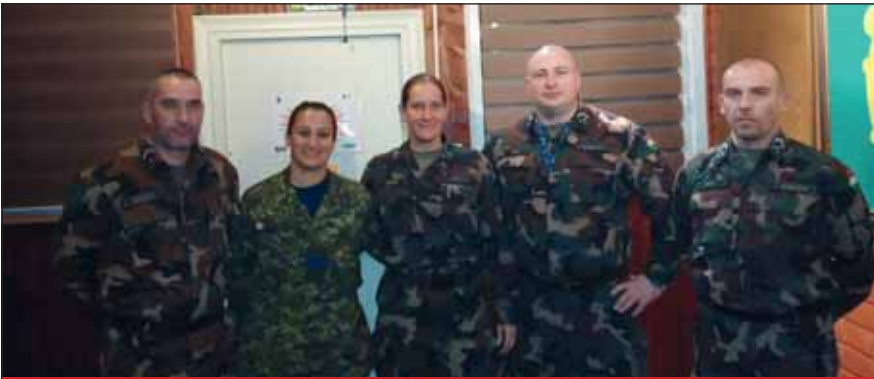
A magyar csoport sikeresen együttműködött más nemzetek katonáival

(Bosznia és Hercegovina, Koszovó, Szerbia), valamint a Balkánon a KFOR és EUFOR részére logisztikai támogatást biztosító országok (Görögország, Macedónia, Bulgária és Albánia) területén végrehajtott légi, szárazföldi és vasúti szállítások megtervezéséért, összehangolásáért, irányításáért és követéséért. A már felsorolt országok katonai közlekedési elemeivel való kapcsolattartás szintén a csoport feladatai közé tartozott.