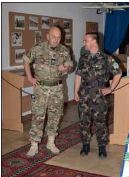
Tigyi törzszászlós az MH 86. Szolnok Helikopter Bázis vezénylőzászlósaként rendszerese találkozik a NATO-tagállamok rangidős altiszteivel

2000-ben, amikor a légierő berkeiben megszületettek az első vezénylőzászlósi beosztások, számára az egész csupán valamiféle misztikumnak tűnt. Nem látta át, nem tudta, miről is szól ez valójában. Van és kész. Katonaként egyszerű axiómaként tekintett a dologra, azaz bizonyítás nélkül elfogadta létjogosultságát. 2007 elején, az MH 86. Szolnok Helikopter Bázis megalkotásakor keresték meg, hogy elvállalná-e a repülő-műszaki zászlóalj vezénylőzászlósi beosztását, amit rövid gondolkodás után elfogadott. Az elhatározás mellett döntő érvként szól, hogy az eddigi pályafutása során felhalmozott kapcsolati tőkét kamatoztatni tudná egy közel háromszáz fős közösség tevékenységének, hatékonyságának javítása érdekében. Ez a mai napig meghatározó cél az életében, igaz most már a helikopterbázis teljes altiszti és legénységi állománya kapcsán. Még 2007-ben, amikor az élete első vezénylőzászlósi konferenciáján vett részt, ámulatba ejtette, sőt lenyűgözte az a hatalmas tudás és szakmai tapasztalat, amivel akkor szembesült. Elmondása szerint felemelő érzés volt számára rácsodálkozni más fegyvernemekre, látni a párhuzamokat és különbségeket. Akkor érezte először azt óriási erőt, amit az altiszti kar magában rejt. Büszke volt – mondja –, hogy egy ilyen testület tagja lehet. Vezénylőzászlósként fontosnak tartja a személyes példamutatást, az állományról történő gondoskodást, ám megjegyzi, egyet soha nem szabad elfelejteni: „Első a szervezet