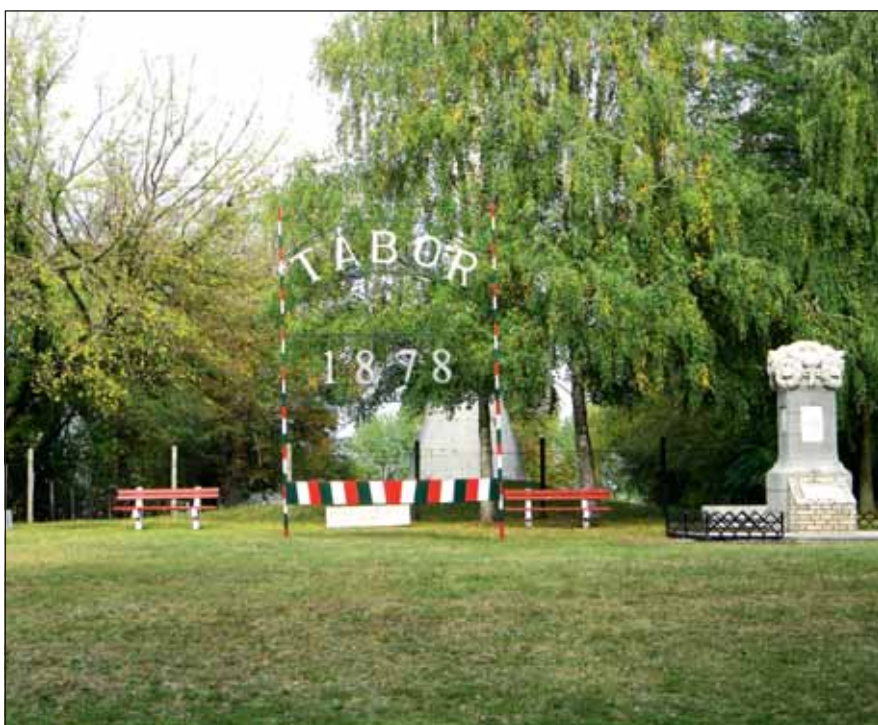
A helyőrségi emlékpark