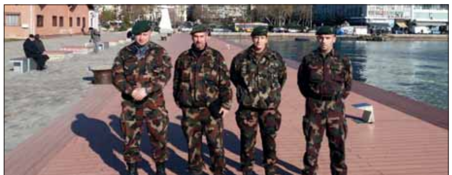
A magyar MovCon MILU-részleg a pristinai KFOR-parancsnokságon az Összhaderőnemi Logisztikai Támogató Elem alárendeltségében tevékenykedett

Ennek ellenére a MILU-részlegnek nem volt egyszerű dolga, hiszen a Koszovóban elvégzendő feladatkör igen összetett és szerteágazó volt. A csoport felelt az Egyesített Balkáni Hadszintér területén