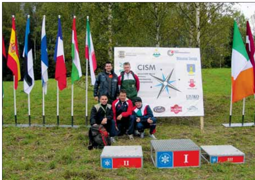
A főtörzsőrmester évek óta eredményesen szerepel hazai és rangos nemzetközi versenyeken

lett, majd ifi és junior korosztályban számos országos dobogós helyezést ért el. Ez az időszak megalapozta a sporthoz való szoros kötődését. 1996-tól 1997-ig a sportélet összefonódott a katonasággal, amikor is Veszprémben, később Taszáron szolgált sorkatonaként. Az akkori parancsnokai hamar meglátták benne a tehetséget. A katonai sportrendezvények állandó szereplőjévé vált. Sorkatonai pályafutásának kiemelkedő lehetősége volt, hogy részt vehetett az akkor Spanyolországban megrendezett katonai világbajnokságon, valamint a Belgiumban tartott junior világbajnokságon.