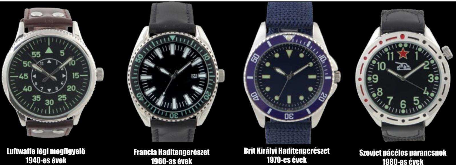
Luftwaffe légi megfigyelő 1940-es évek

A 19. század közepe óta a világtengereken és csatatereken szolgáló katonai állományoknak különlegesen jó minőségű órákra volt szüksége. Ennek következtében felgyorsult a ma is jól ismert karórák fejlesztése. A katonai repülőgépek hadrendbe állításával újabb innovációk kezdődtek. A Legendás katonai órák sorozatban Ön is megismerheti a különleges időmérő eszközök lenyűgöző történetét.