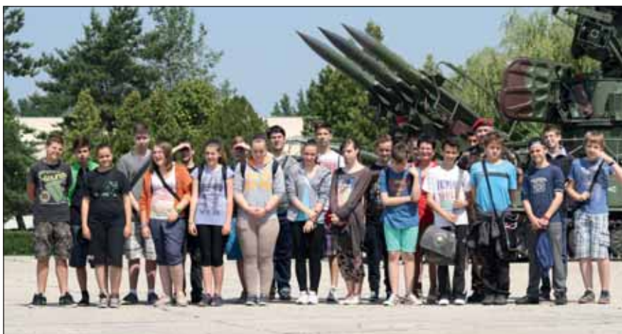
Emlékfotó a „rakéták árnyékában”

Az alakulat katonái örömmel mutatják meg a látogatóknak a fegyverrendszereiket, melyekre méltán büszkék. Így a Mistral közeli hatótávolságú, valamint a 2K12 KUB kis hatótávolságú légvédelmi rakétarendszer elemeit. A