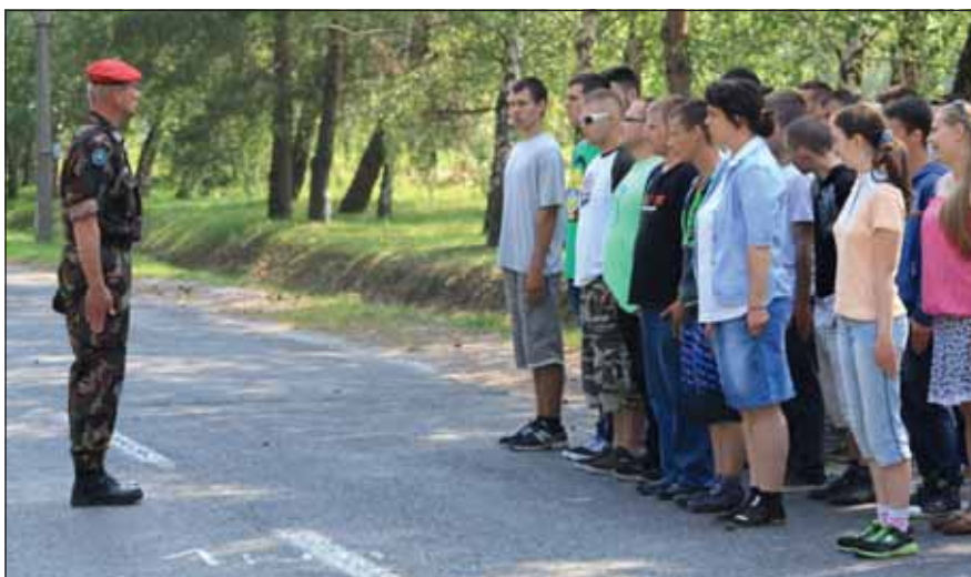
A fiataloktól sem idegen a katonás alakítás

fentieken kívül számos olyan képességgel is rendelkezik az MH 12. Arrabona Légvédelmi Rakétaezred, amely a közelmúltbeli missziós szerepvállalásból adódóan jelent meg a laktanyában.