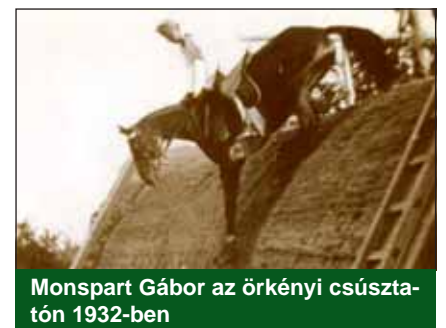
Monspart Gábor az örkényi csúsztatón 1932-ben

Szintén a világháború alatt került a táborba Szabó Lőrinc (1900–1957) Kossuth-díjas költő, műfordító a