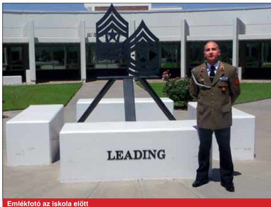
Emlékfotó az iskola előtt

Hadművellet . Tulajdonképpen ez a tanszék adja meg az alapot és a gyakorlati tapasztalatot ahhoz, hogy a hallgató alkalmazni tudja mindazt a tudást, amit a többi tanszéktől kap. Számítógépes szimulációval és tervezőprogrammal támogatott gyakorlatok során szerez jártasságot a hadművelleti tervezés, végrehajtás és értékelés feladataiban zászlóaljtól hadosztályszintig. A hallgatók a gyakorlatok során rotálódnak, és eredeti szakmájuktól függetlenül minden katonai szakág tevékenységéből gyakorlatot kell szerezniük. Lehet, hogy egyik nap a felderítőfőnökséget képviseli, egy másik nap pedig már a sze-