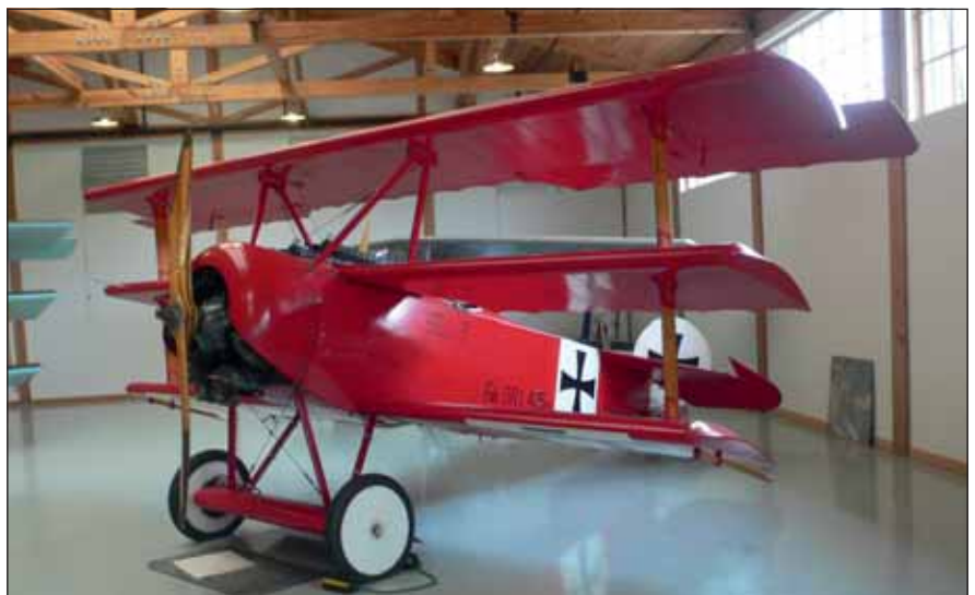
A híres „Vörös Bátor”, Manfred von Richthofen által is vezetett Fokker Dr.I típusú repülőgép

Látható a virginiai gyűjteményben egy francia gyártmányú Nieuport 17 típusú repülőgép is, mely egyike volt a háború legjobb csillagmotoros repülőeszközeinek. Jó manőverezőképesége és emelkedési sebessége miatt fölénybe került a korai német gépekkel szemben. Az ellenség ballonjai leküzdéséhez a szárnyak alá rakétákat lehetett rögzíteni. A kiállított repülőgép az Egyesült Államok légierje kiképzőalakulatának színeit viseli.