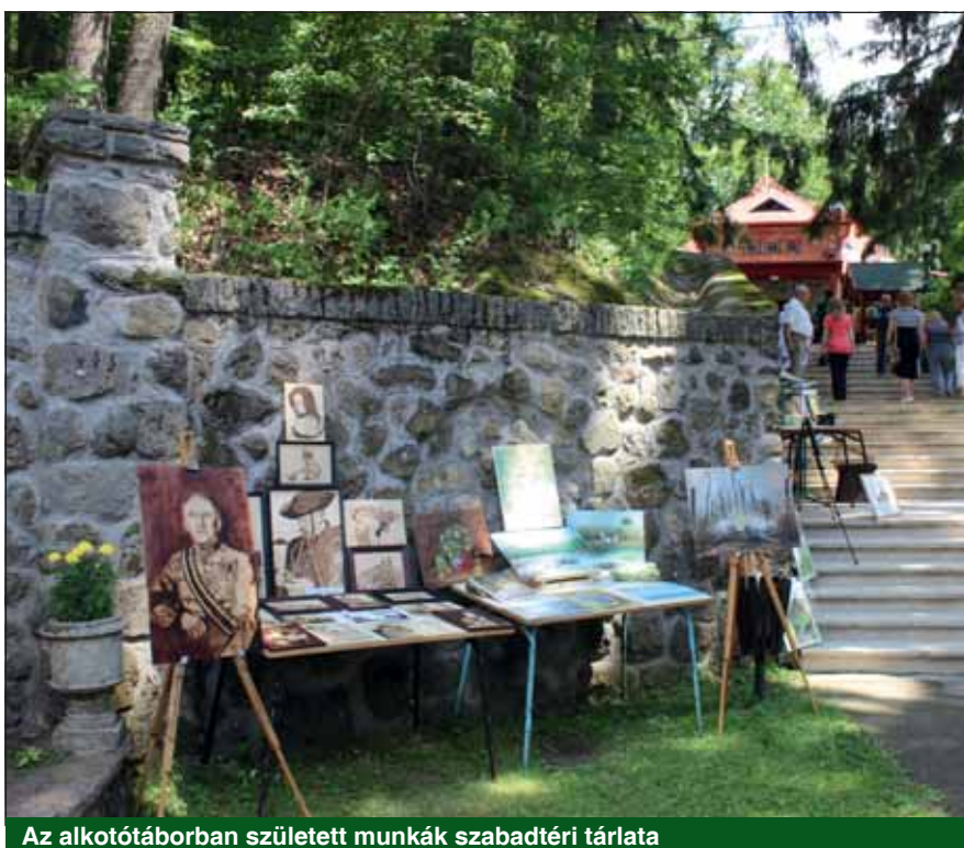
Az alkotótáborban született munkák szabadtéri tárlata