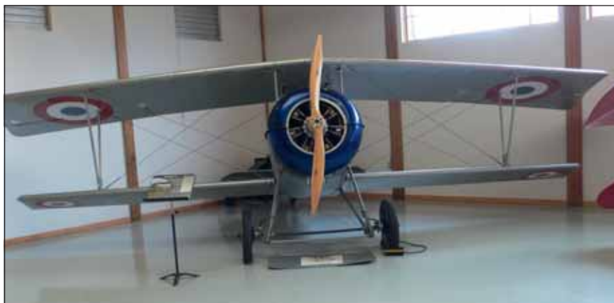
A Nieuport 17 típusú repülőgép is egyike volt az első világháború legjobb csillagmotoros repülőeszközeinek