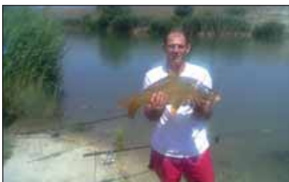
Szabó törzszászlós egyik hobbjaja a horgászat

– Azt gondolom, hogy nem vezénylőzászlóssá válunk, hanem vezetővé, vezénylőzászlósi beosztást ellátó vezetővé. Ez egy hosszú folyamat, ami egy megfoghatatlan időpontban kezdődik az ember életében. Tesszük a dolgunkat, képezzük magunkat, fejlődünk, s a parancsnok felfigyel ránk. Sokat segített az eddigi katonai pályafutásom alatt, hogy mindig találtam magamnak olyan parancsnokokat, akik a példaképeim voltak, figyeltem a munkájukat, hogyan vezetnek. Ezeket a tapasztalatokat gyakran tudom alkalmazni. 1990-től sok emberrel találkoztam, így az emberismeretem – ami elengedhetetlen egy vezető részéről – folyamatosan fejlődött. Más oldalról látsz emberi viselkedési formákat a hazai és külföldi szolgálat alatt, mást a sport terén. Két alkalommal szolgáltam az MH Magyar Műszaki Kontingens állományában, ahol a családtól való huzamosabb távollét alatt sokkal inkább középpontba került a katona emberi, szociális oldala. Visszatekintve, mindig szerettem irányítani, a feladatok megoldásában az ésszerű, egyenes, gyors és korrekt megoldásokat kerestem.