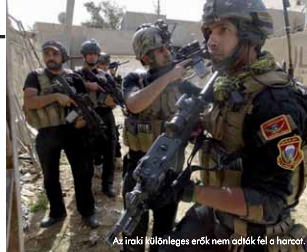
Az iraki különleges erők nem adták fel a harcot.

Nehezen várható a jelen helyzetben, hogy az ENSZ megegyezzen egy határozott erőt képviselő szervezettel (ilyen lehet például a NATO) az ismételt iraki fegyveres beavatkozásról, amely