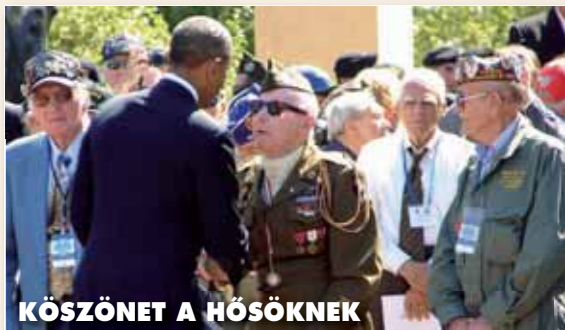
KÖSZÖNET A HŐSÖKNEK

A Colleville-sur-Mare-i amerikai temető emlékművének üzenete még soha nem volt ilyen aktuális, az égbe nyúló bronzalak az amerikai ifjúság lelkét szimbolizálja. Az emelvényen a francia és az amerikai elnök mögött ötven veterán. A legfiatalabb 88 éves, a rangidős 94. A köszöntőbeszéd után Barack Obama, felrúgva a protokolláris rendet, minden veteránnal személyesen fogott kezét, átnyújtva valami emberit a politika rideg játékszabályain túl. Az unokák generációjának köszönetét a csillogó szemű egykori ejtóernyősöknek, tengerészeknek, harcokocsizóknak.