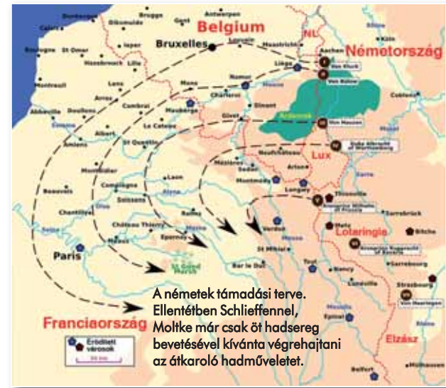
A németek támadási terve. Ellentétben Schlieffennel, Moltke már csak öt hadsereg bevetésével kívánta végrehajtani az átkaroló hadműveletet.

A XVII. terv ugyanakkor még mindig nem kezelte a súlyának megfelelően a német jobb szárny jelentette veszélyt. További gondot jelentett, hogy a franciák lotaringiai támadó erejét túl- az ot-