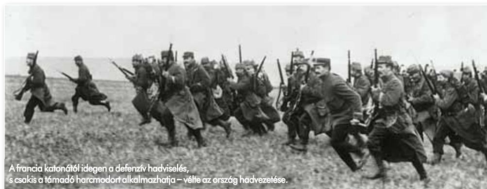
A francia katonától idegen a defenzív hadviselés, s csakis a támadó harcmodort alkalmazhatja – vélte az ország hadvezetése.

Az „A terv” esetén kulcsfontossággal bírt a gyorsaság, két okból is: egyfelől a francia szövetséges megsegítése miatt, másfelől azért, mert a sikerre csak addig mutatkozna esély, amíg a német hadsereg túlnyomó része a nyugati fronton van lekötve. A már említett probléma, azaz a vasúti hálózat fejletlenségének következményeképpen ugyanis az orosz hadvezetés nem tudná gyorsan fel-