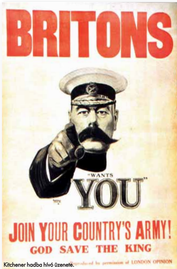
Kitchener hadba hívó üzenete.

Mint látható, Franciaország a kontinentális háborúban nem számíthatott jelentős létszámú angol csapatokra, ezt azonban jócskán ellensúlyozhatta másik szövetségese, Oroszország, amely valamennyi hatalom közül a legnagyobb, közel 1,5 millió békeleltámasz haderőt tartott fenn; ez a szám a mozgósítás után 4,5 millióra nőtt. A viszonylag fejletlen vasúthálózat miatt ugyanakkor a mozgósítás, az átcsoportosítás és az utánpótlás biztosítása is nehézségekbe ütközött.