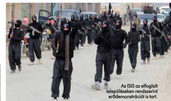
Az ISIS az elfoglalt településeken rendszerint erődemónstrációt is tart.