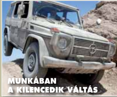
MUNKÁBAN A KILENCEDIK VÁLTÁS

A hivatalos átadás-átvétellel, illetve a NATO béketámogató szolgálati jelek adományozásával, több mint hat hónapos munkájának utolsó hadszíntéri feladatához érkezett az MH Művelési Tanácsadó Csoport (MTCS) második váltása. Az ünnepi eseményen a leköszönő és az új váltás katonái mellett megjelentek a partneralakulatok, az afgán határőrség és a készenléti rendőrség vezetői, továbbá részt vett az ISAF Északi Régió parancsnoka, Bernd Schütt vezérőrnagy, illetve helyettese, Craig Timberlake dandártábornok is. Az MTCS-2 és MTCS-3 közötti váltással egy időben sor került a nemzeti rangidős feladatok és az MH Nemzeti Támogató Elem parancsnoki feladatainak átadás-átvételére is.