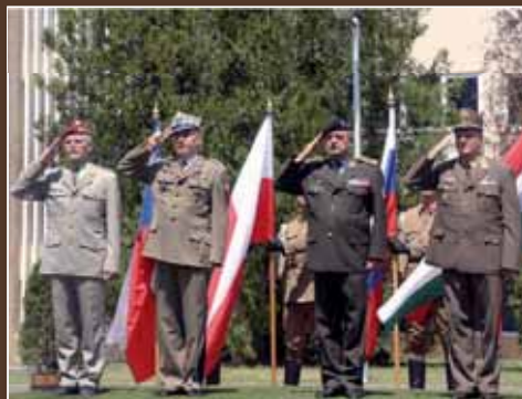
Honvéd Vezérkar