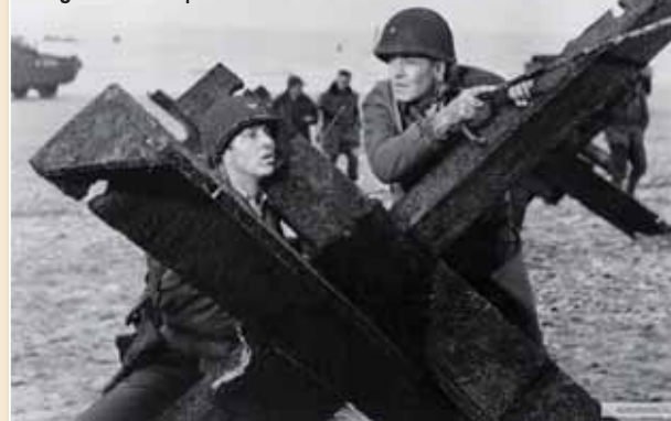
A leghosszabb nap

Ezt követően Steven Spielberg nyúlt a partraszállás témájához, és ugyan nem ez volt a célja, de ő is tett róla, hogy jó ideig senki se akarja hasonló formában követni a példáját: az 1998-as „Ryan közlegény megmentése” indító partraszállásos jelenete, illetve a film másik tetőpontját jelentő végső városarc minden szempontból etalon, lebilincselően pergő, sokkoló és megunthatatlan. Arról már bőven lehet vitatkozni, hogy a kettőt összekötő idő méltó-e ezekhez, de tulajdonképpen nincs is jelentősége – a Tom Hanksszel, Matt Damonnel, Tom Sizemore-ral és Edward Burnsszel leforgatott mozi eleje és vége az azóta eltelt bő másfél évtizedben is etalon maradt, és valószínűleg az is marad, amíg valaki egyszer neki nem fog hasonlóan epikus formában feldolgozni a témát. Spielberg és Hanks egyébként úgy érezte, van még mit mondania Normandiáról és tágabb értelemben véve az európai hadszíntérről, így az általk megálmodott és finanszírozott tévésorozat, a 2001-es „Az elit alakulat” veterán katonák visszaemlékezései segítségével tovább gördítette a témát, és fogadtatására jellemző, hogy 2010-ben, „A hős alakulat” címmel, a csendes-óceáni eseményeket is hasonló formában dolgozták fel.