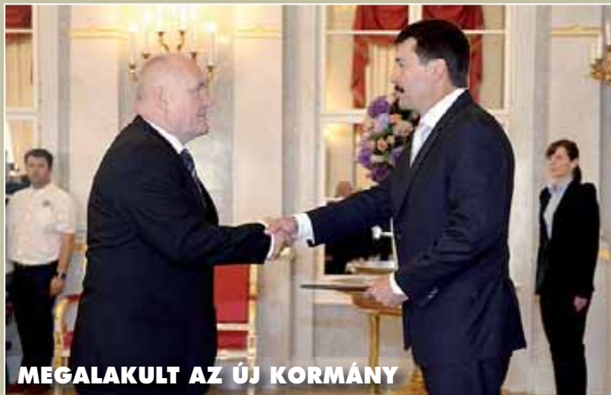
MEGALAKULT AZ ÚJ KORMÁNY