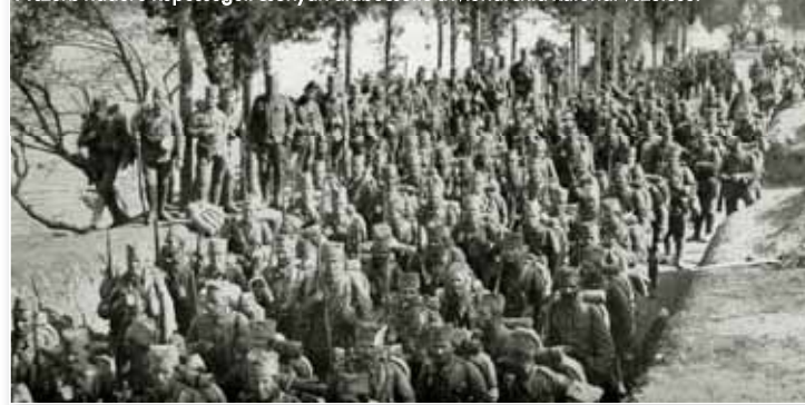
A szerb haderő képességeit csúnyán alábecsülte a Monarchia katonai vezetése.

Éppen ezért az 1., a 3. és a 4. hadsereg mellett a 2. hadseregnek csak egy hadtestét vezényelte északkeletre, míg a másik hármát – továbbá az 5. és a 6. hadsereget – délen vetette be. E döntése két okkal magyarázható: a remélt gyors sikerrel egyrészt a soknemzetiségű hadserege harci szellemét kívánta feltüzélni, másrészt a Monarchia ingadozó – bár egyelőre semleges – szomszédjait, Olaszországot és Romániát akarta visszatartani az antant oldalán történő hadba lépéstől. Alábecsülte azonban a szerbek katonai erejét, így a várt könnyű győzelem elmaradt.