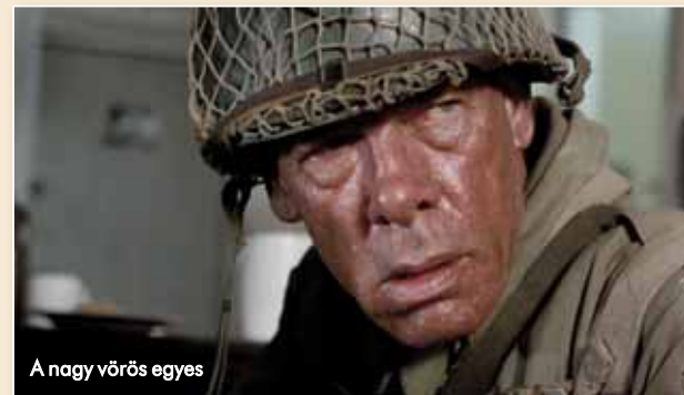
A nagy vörös egyes

A partraszállás történetét kis epizódok és számtalan karakter egyéni sztoriján keresztül feldolgozó film egészen 1993-ig, a Schindler listájáig a valaha forgatott legrágább fekete-fehér mozinak számított 10 millió dolláros büdzséjével. A korabeli kritika itt-ott kissé terjengősnek találta, népszerűsége ennek ellenére a mai napig töretlen, a maga idejében pedig az egyik legsikeresebb alkotás volt a mozikban, és több mint 50 millió dollárt fialt a pénztáraknál. Érdemes megjegyezni, hogy „A leghosszabb nap” emellett az első volt azon A-kategóriás háborús filmek sorában, amelyet Amerikán kívül bizonyos kritikuskok totális értetlenséggel fogadtak, hiába harcoltak annak idején vállvetve a sávos-csillagos lobogókkal Normandiában: többen is túlélelizáltak, propagandisztikusnak ítélték az amerikai szereplők és az amerikai hadsereg bemutatását. Utóbbi hibás persze valamennyire érthető, hiszen 1962-ben a hidegháború legfagyosabb időszakában jártunk – ebben a korszakban az Egyesült Államok erőt akart mutatni, és nyilvánvalóan a Pentagonból is elég rendesen beleszóltak abba, mi kerülhet a hasonló filmekbe, és főleg hogyan.