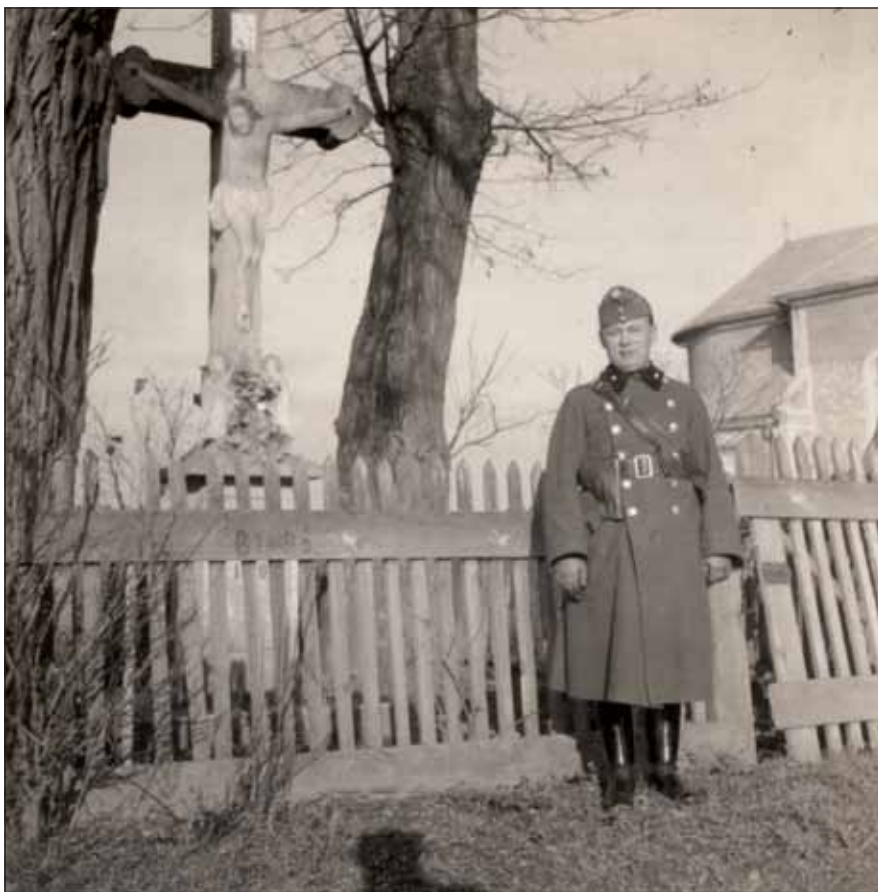
Nagyapám esküje szellemében harcolt az életért, gyógyított

Nagyapám látott halált, életet adott, nehéz döntéseket hozott. Esküje szellemében harcolt az életért, gyógyított. Nem panaszkodott,