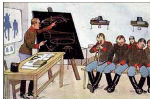
Egy érdekes téma

Én szerencsére már kisgyerekkorom óta rendszeresen sportoltam és szorgalmasan tanultam. Az egyik kedvenc mondásom mind a mai napig: „Ép testben, ép lélek!”. E tényezők nem engedték számomra, hogy a rossz példát kövessem, ahelyett inkább az arra méltó kollégák útmutatásai és jómagam elvrendszereinek irányjelzői szerint éltem az életemet. Röviden kifejtve: több sikeres nyelvvizsgát tettem, szakmát szereztem, majd egyetemi tanulmányokat folytattam munka mellett – mindezt akkor még nem is volt szükségem. De ma már látom,