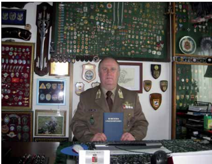
Forray alezredes kedves tárgyai körében

Az impozáns gyűjteményben helyet kapott a külhoni katonai szervezetek készleteiből összeállított borkollekció is, amelynek különösen említésre méltó darabjai az osztrák haderő akadémiai évfolyamainak, valamint az olasz Folgore speciális ejtőernyős alakulat „emlékborai”. Természetesen egy katonai gyűjtemény nem lenne teljes lő- és szűrő-