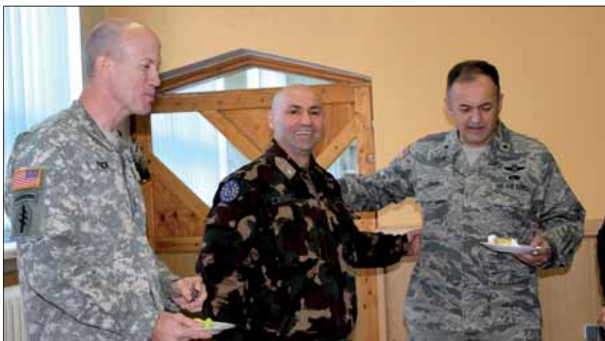
Ebédidőben is szóba kerülnek a szolgálati feladatok

alatt szembesült azzal, hogy bizonyos esetekben az Isten és a család szolgálata tekintetében kompromisszumot kellett kötnie. A katonai szolgálat teljesítése több esetben előnyt élvezett a családdal, a magánélettel és a hitélettel szemben.