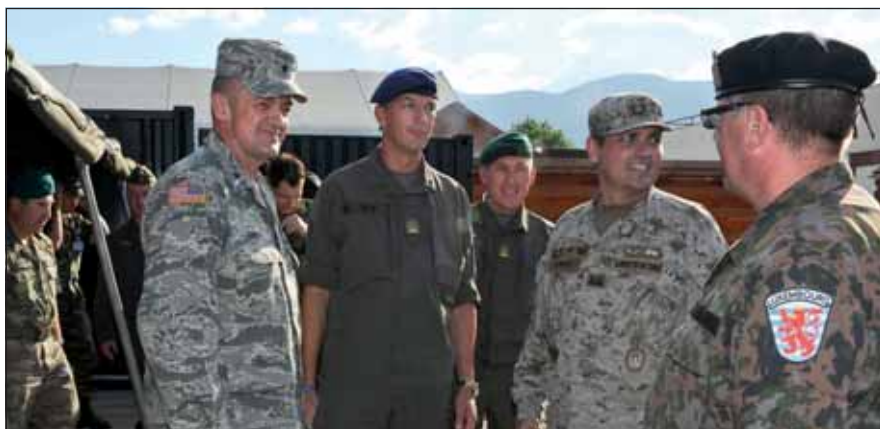
A parancsnok nemzetközi környezetben

A szolgálat elsődlegessége. Hart dandártábornok közel három évtizedes, légierőnél eltöltött szolgálata