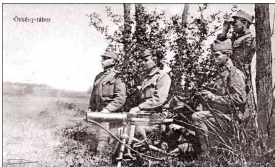
Gépfegyveres kiképzés 1914 júliusában

orosz és bosnyák hadifoglyot szállásoltak el a barakkokban, valamint a táborba vezető makadámutat (ma Tarcsay Vilmos) építették. 1920 után ezeknek a barakképületeknek egy részét lebontották, a többi lóállássá alakították át. A világháború végén a saint-germaini békediktátum feldarabolta az Osztrák–Magyar Monarchiát. Függetlenül attól, hogy Magyarország a trianoni békét csak 1920. június 4-én írta alá, a birodalom közös intézményeinek felszámolása 1919-ben megkezdődött. Ezzel számunkra egy közel 400 éves Habsburg-birodalmi befolyás szűnt meg. A Tanácsköztársaság bukása után, 1919. augusztus 2-ától ez a térség is román megszállás alá került. A megszállás alatt a tábor területén hadifoglyotábor