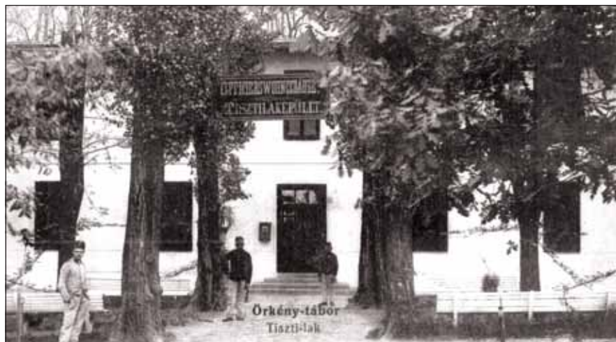
Tiszti lakások a kiképző bázis területén