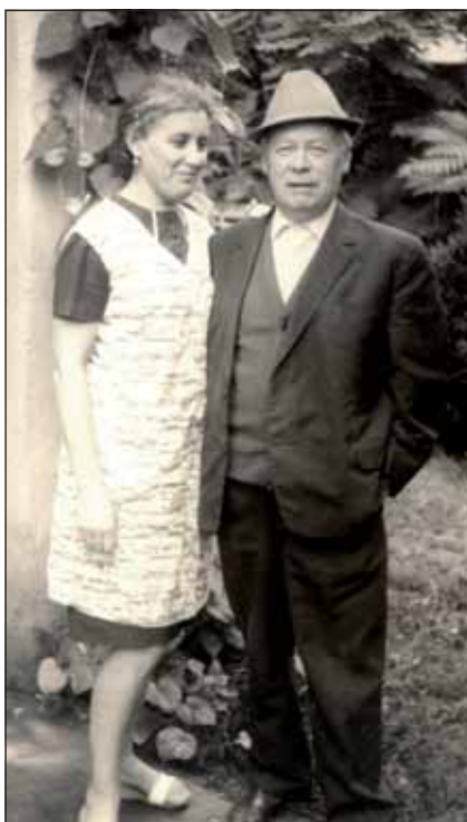
Nagyszüleim a háború után

hogy nem elég jók az eszközök vagy a körülmények, tette a dolgát, mert hitt abban, amit csinált. Talán éppen ez a hit adott neki erőt a háború túléléséhez, talán ezért sikerült megőriznie az optimizmusát.