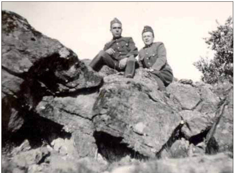
Pihenőidőben egyik bajtársával

– Nagyapád az egészségügyi oszlop főhadnagyaként került ki a Don-kanyarba, több másik gyógyításra felesküdt orvostársával együtt. A sztorozsevojei ütközet alatt a műtétjeiket egy olyan kis orosz házban végezték, ahol a műtőnek kialakított helyiség 2,5 x 2 méteres volt úgy, hogy a falat körben még egy kb. 50 cm széles fapad is szegélyezte, amit az oroszok ágynak használtak. Így állni is alig