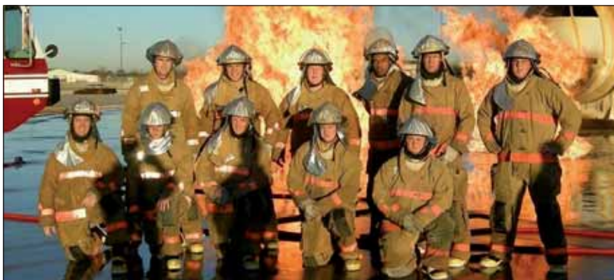
A csoport tagjai stílszerű háttérrel

– Szerencsére nagyon pozitív élményekkel repültem haza. Mielőtt kimentem, volt egy elképzelésem az országról, ami elsősorban filmek, híradások, elbeszélések alapján alakult ki. Ez a kép persze egyáltalán nem volt rossz. Mindenképpen kiemelném, hogy nagyon segítőkészek voltak velünk. Érdekes volt számukra, hogy európaiak vagyunk, szinte a Föld másik feléről jöttünk. Igyekeztek mindenben megkönnyíteni az ott-tartózkodá-