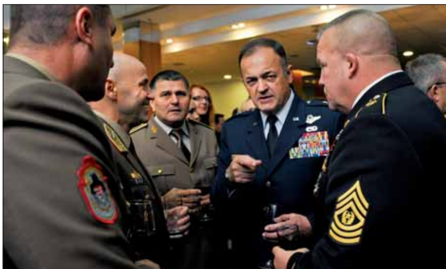
Feladategyeztetés kötetlen formában

Változások. Egy új szervezet megalkotására vonatkozó parancsok, utasítások jelentősen befolyásolják a kialakuló katonai szervezet életét. Az amerikai haderőben a kilencvenes évek végére megváltozott a tartalékos és aktív szolgálat kötelemeinek értelmezése, a kettő viszonyában előtérbe került a tartalékos szolgálat. A korábbi teória szerint az aktív szolgálatnál rendszeresített haditechnikához csatlakozott be a tartalékos, míg napjainkra a helyzet teljesen átalakult. Amennyiben a megváltozott körülmények kiugró adrenalin szintet eredményeznek a katonában és indokolt a párbeszéd folytatása, akkor ne habozzunk: az érintett személy mellett konzultáljunk a barátokkal, a családtagokkal, és jelezzük a problémát a tábori lelkésznek. Mindenki értékes része az adott katonai szervezetnek, a parancsnoknak mindig rendelkezésre kell állnia, ha indokolt. Az egészsé-