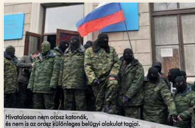
Hivatalosan nem orosz katonák, és nem is az orosz különleges belügyi alakulat tagjai.

Az elemzők egyetértnek abban, hogy Ukrajnáért senki nem akart ringbe szállni, és talán az ország gyorsabb nyugati integrációjának sincs igazán sok hathatós támogatója. A most aláírt társulási szerződés is csupán egy technikai egyezmény, Törökországnak is van ilyen már 1964 óta. Ezt a szerződést Putyin felreértelmezte. Kérdés: szándékosan vagy véletlenül? Mindenesetre a Krím félsziget Oroszországhoz csatolása geopolitikailag hibás taktikai lépésnek bizonyult, s úgy tűnik, egy új hidegháborús helyzet kialakulásának vagyunk szemtanúi.