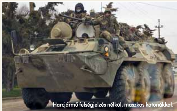
Harcjármű felségjelzés nélkül, maszkos katonákkal.

Vlagyimir Putyin a kialakult helyzetet kihasználva nem csupán a Krím félsziget, hanem más ukrán területek annak