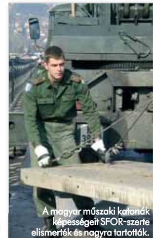
A magyar műszaki katonák képességeit SFOR-szerter elismerték és nagyra tartották.