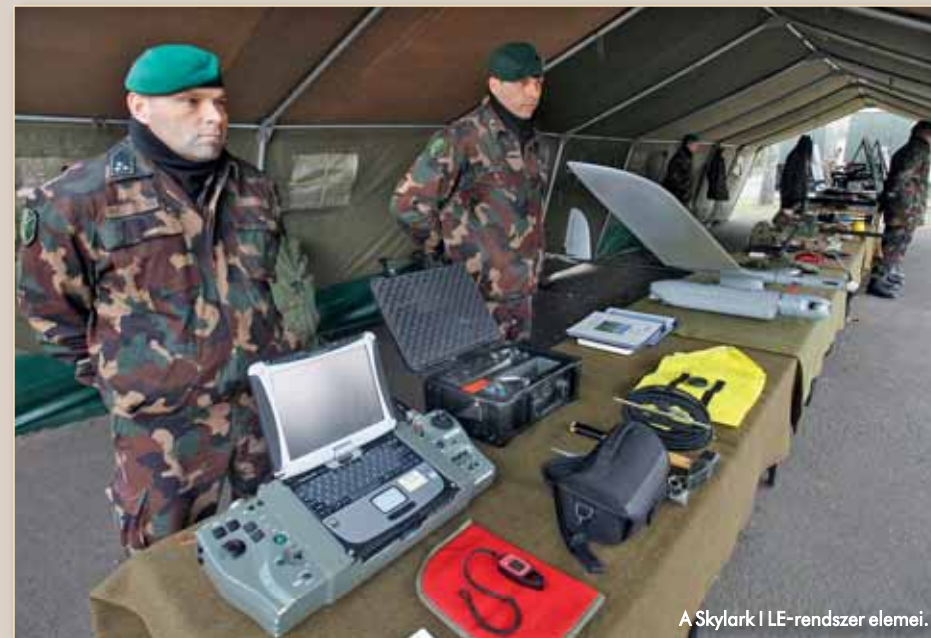
A Skylark I LE-rendszer elemei.

Grípet vagy egy szállítóhelikoptert. A távolról irányított felderítő-repülőgép azokon a helyeken is képes megoldani