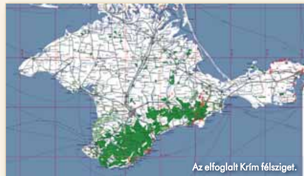
Az elfoglalt Krím félsziget.