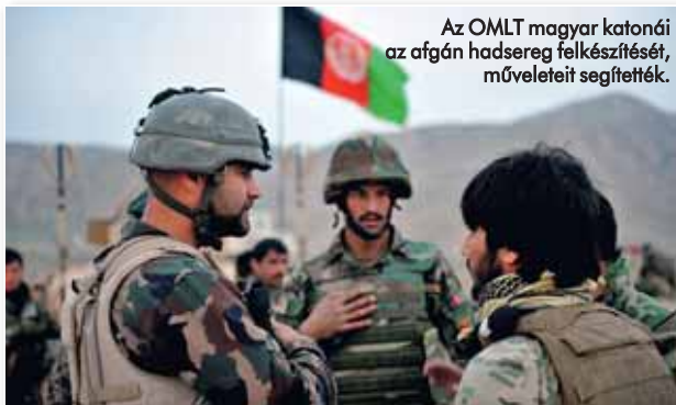
Az OMLT magyar katonái az afgán hadsereg felkészítését, műveleteit segítették.

A NATO Szomália partjainál az Ocean Shield művelettel szorította vissza a tengeri kalózkodást; ebben a sikeres műveletben is szolgált magyar katona. A 2005-ös pakisztáni földrengés következményeinek elhárításában segédkező NATO műszaki támogató csoport egyik katonája magyar volt, miként a 2011-es líbiai Unified Protector művelet műveletirányítási parancsnokságán is dolgozott egy