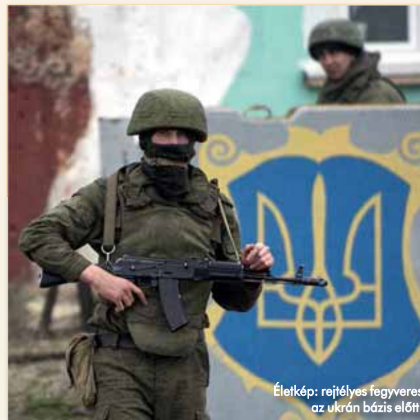
Életkép: rejtélyes fegyveres az ukrán bázis előtt.