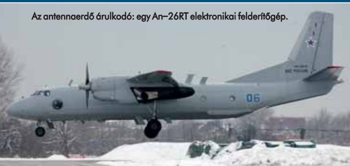
Az antennaeerdő áruklodó: egy An-26RT elektronikai felderítőgéppé.