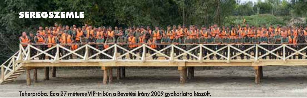
Teherpróba. Ez a 27 méteres VIP-tribün a Bevetési Irány 2009 gyakorlatra készült.

A század képes fém aljzatú és fa felületű, úgynevezett vegyes szerkezetű hidak összeállítására is, azonban a kiképzéseken inkább az elemenként épített hidak összeállítását gyakorolják.