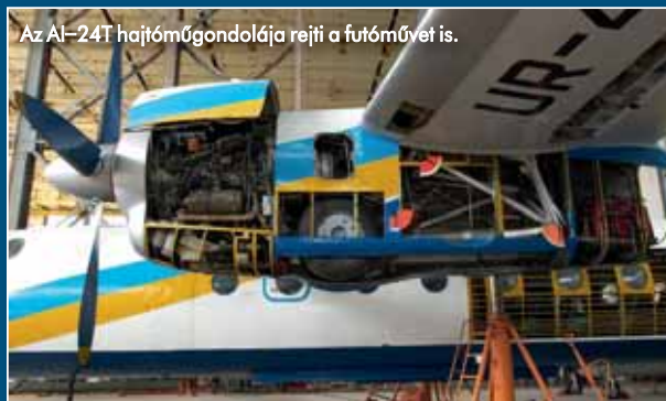
Az AI-24T hajtóműgondolójá rejtji a futóművet is.

törmelékeket, s így a négytollú, állandó sebességű légcsovar is védettebb. A gép robusztus felépítése, a sokat tűrő, a talajviszonyoktól függően a pilótáfkékből változtatható nyomású abroncsokkal felszerelt futóműve, valamint sárkányszerkezete is a kemény körülmények közötti üzemeltetést segíti. Csakúgy, mint a minimális infrastruktúra-igény. Kis túlzással, ahol kerozint tud tankolni, ott képes is üzemelni az An-24-es, köszönhetően a bal hajtóműgondolába épített TG-16M segédgázturbinának (APU), amely a repülőgép áramellátását biztosítja a földön. Mindkét légcsovar és a szélvédő is elektromos jégtelenítőszerrel kapott, a szárnyakat a hajtóműből elvezetett forró levegő jégteleníti. A gép orra az akkori szovjet szoká-