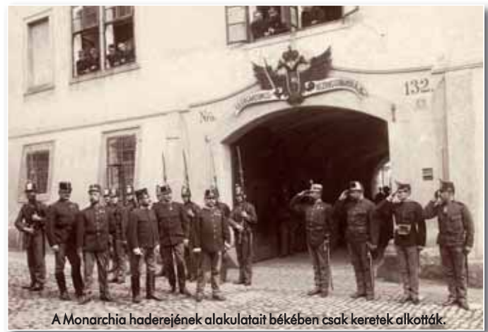
A Monarchia haderejének alakulatait békében csak keretek alkották.

zően száztizenkettőre emelték, amelyekből 47 esett Magyarország, négy pedig az 1908-ban anektált Bosznia-Hercegovina területére, míg a három partvidéki kerület elsősorban a haditengerészet részére volt fenntartva. Minden kerület (természetesen leszámítva a haditengerészetieket) egy közös gyalogezredet állított ki.