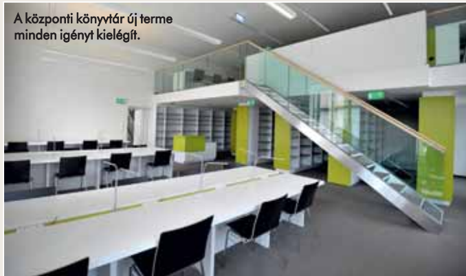
A központi könyvtár új terme minden igényt kielégít.