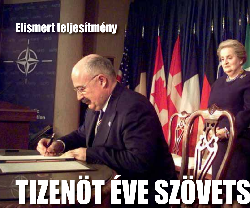
Martonyi János külügyminiszter 1999. március 12-én írta alá hazánk NATO-csatlakozási dokumentumát.