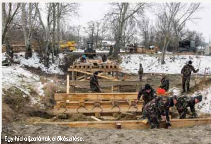
Egy híd aljzatának előkészítése.

– Többnyire kétfajta fahidat építünk – folytatja Baranyai százados. – Az egyik típust teljes egészében a helyszínen, elemenként állítjuk össze. Az aljzat elkészítése után egyesével rakjuk helyükre a hosszartókat és szögeljük fel a pallókat. Ez hosszabb ideig tartó munkával jár, az eredmény viszont egy tartós és külsőre is szép híd. Amikor viszont kevesebb idő áll rendelkezésünkre, akkor az úgynevezett nyompálya-blokkos építést alkalmazzuk. Ennek az a lényege, hogy a helyszínen nem darabonként, hanem előre gyártott, 5x2 méteres blokkokból rakjuk össze a hidat. Ezzel a módszerrel nagyon gyorsan haladunk, a szerkezet később könnyen szét is bontható. Meglehetősen, az így elkészült „ter- mék” kevésbé tetszetős, de hadihídnak kiválóan megfelel. Hosszuknak nincs jelentősége, a meghatározó szempont az áthidalandó akadály mélysége, ami az utasítások alapján legfeljebb 6-8 méter lehet. Az ennél hosszabb cölöpök azért nem felelnek meg aljzatnak, mert a