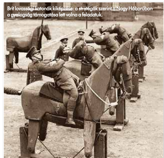
Brit lovassági katonák kiképzése: a stratégák szerint a Nagy Háborúban a gyalogság támogatása lett volna a feladatuk.

1914 nyarán a Monarchia hadereje a leggyengébb volt a kontinentális hatalmak haderői közül, e szempontból elég összevetnünk a tüzérségét a szövetséges németekével, illetve a legfőbb rivális oroszokéval. Az első világháború előestéjén Ausztria–Magyarország e fegyverneme összesen 2842 löveget tudhatott soraiiban, egy gyaloghadosztály 48, egy hadtest pedig 104 löveggel rendelkezett. A német hadsereg lövegeinek száma 9400 volt, egy hadosztály 72, míg egy hadtest 160 löveget állíthatott csatasorba. Oroszország összesen 6800 löveggel számolt: a cári hadosztályok 48, a hadtestek pedig 112 löveggel gazdálkodhattak.