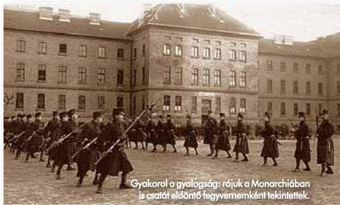
Gyakorol a gyalogság: rájuk a Monarchiában is csatát eldöntő fegyvernemként tekintettek.

A magyar királyi honvédség békelelétszáma meghaladta a harmincezer főt, hadiállománya 200 ezer katona volt. Kötelékébe nyolc gyalog- és két lovashadosztály, továbbá nyolc tüzérdandár tartozott. Az osztrák Landwehr nyolc gyaloghadosztállyal, lovassága hat ulánus- ezreddel, egy tiroli és egy dalmát or-