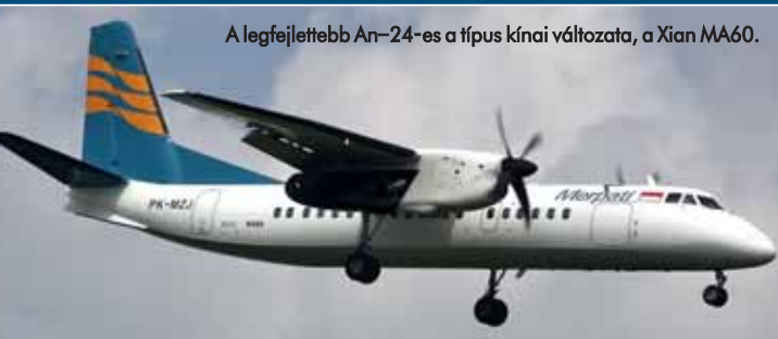
A legfejlettebb An-24-es a típus kínai változata, a Xian MA60.

1967-ben egy egészen különleges An-24B készült el, alkalmazkodva a hidegháborús elképzelésekhez. Ekkor a két egymásnak feszülő világrend mindkét oldalán úgy gondolták, hogy a harmadik világháború idején atom-, vegyi és biológiai fegyvereket is bevetnek. Az An-24RR változat feladata a légi felderítés volt, ehhez az orrfutó mögött, a géptörzs alsó részére két mintavételező szondát helyeztek el, melyben speciális papírszűrőkkel „fogták meg” a radioaktív részecskéket. A pilótafülke mögött mindkét oldalon egy-egy kisebb szondával keresték a kémiai harcanyagokat. Sőt, az An-24RR egy távirányítású rendszerrel a leszállóhelyről is tudott talajmintát venni, s képes volt a már begyűjtött mintákat a géptörzsben kialakított, légmentes laborhelyiségbe juttatni. 1968-ban három újabb gépet alakítottak át; szerencsére az eredeti feladatok végrehajtása (és a világháború) elmaradt, így a gépek a szovjet atomkísérletek során gyűjtötték a mintákat. Gyakran megfordultak a nukleáris ipari létesítmények felett, a radioaktív szennyezés jeleit keresve.