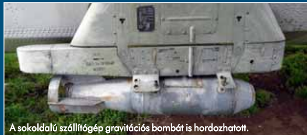
A sokoldalú szállítórepülőgép gravitációs bombát is hordozhatott.

feltűnnek az extra antennák. A gépek a fényképek és a hírszerzői jelentések szerezésére Afganisztánban is, ahol az 1979–1989 közötti háború során a mudzsahed erők rádióhívásait keresték. Érdekes, hogy egy-egy elektronikus felderítő An-26-ost – An-26SM és An-26Z-1 típusjelzéssel – a Német Demokratikus Köztársaság és Csehszlovákia is épített, saját erőből.