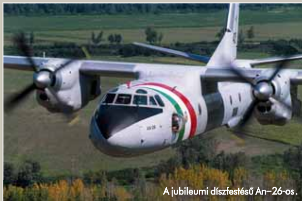
A jubileumi díszfestésű An-26-os.

– A navigátorok munkájának nagy része a földön zajlik: útvonalat tervezünk, beszerezünk a diplomáciai engedélyeket, üzemanyag-számvetéseket végzünk, ellenőrizzük az időjárás-előrejelzést és a légeret. Repülés közben segítjük a pilóták tájékozódását is, mert a navigátor a gép baloldali „buborékjában” ül, ezért jobban kilát a gépből. Deszantnál pedig mi nyitjuk a rámpát; a célzókészülékünk