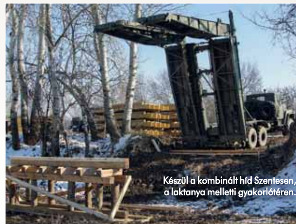
Készül a kombinált híd Szentesen, a laktanya melletti gyakorlótéren.

zelíthetősége érdekében azt minél egyszerűbb megoldással ki kell építeni.