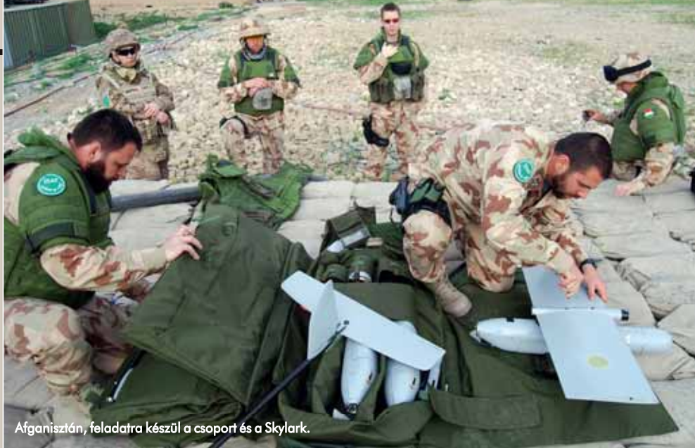
Afganisztán, feladatra készül a csoport és a Skylark.