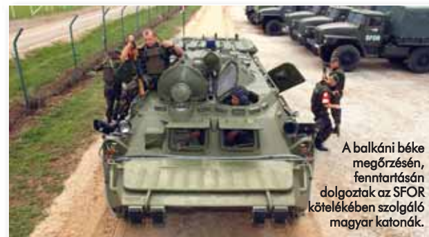
A balkáni béke megőrzésén, fenntartásán dolgoztak az SFOR kötelékében szolgáló magyar katonák.

a térségbeli helyzet normalizálásához, sőt, e művelet lezárása óta is részt veszünk a szövetség szarajevói parancsnokságának munkájában.