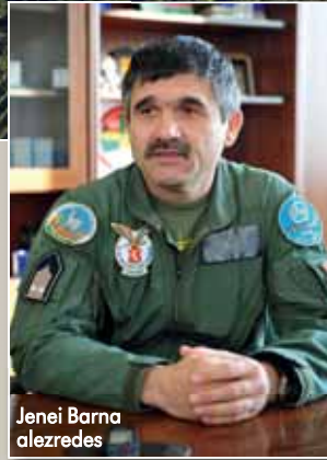
Jenei Barna alezredes

óta több mint hétszáz órát töltöttünk együtt a levegőben – emlékszük vissza „kapcsolatuk” kezdetére a szállítórepülő-század korábbi parancsnoka. – Szeretem ezt a gépet, „jóindulatú”, strapabíró, masszív konstrukció, vezetése korábban sosem tapasztalt élményt jelent. Komplikált berendezések és bonyolult elektronikai rendszerek nincsenek a fedélzeten, ezért a meghibásodás valószínűsége alacsony, a kezelése egyszerű. Az üzemeltetésével persze tökéletesen tisztában kell lenni, de nagyon közeli barátságba kerülhet vele a személyzet, ha a biztonságos és zökkenőmentes re-