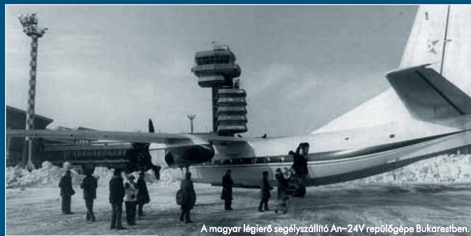
A magyar légierő segélyszállító An-24V repülőgépe Bukarestben.

Az An-24 harmadik prototípusát alakították át az első katonai változat, az An-24T prototípusának. A légierő kívánságára, az 1962-ben elvégzett első tesztek után alaposan átalakították a gépet, hiszen sem a hatótávolság, sem a rakodási lehetőségek nem voltak megfelelőek. Továbbfejlesztett, 2820 lóerős teljesítményű AI-24T hajtóművek, nagyobb üzemenyagtarályok, új teherterajtó, a domborzat térképezésére is alkalmas PSzBN-3N Emblema radar, 42 felhajtható ülés vagy 24 hordágy; a sorozatgyártású An-24T már valóban katonai repülőgép lett. A polgári An-24RV és RT változatokat az RU19A-300 kombinált APU/sugarhajtómű került a bal hajtóműgondolába, ez plusz 2,16 kN tolerőrt adott a gépnek.