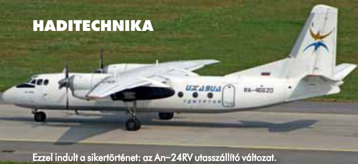
Ezzel indult a sikertörténet: az An-24RV utasszállító változat.