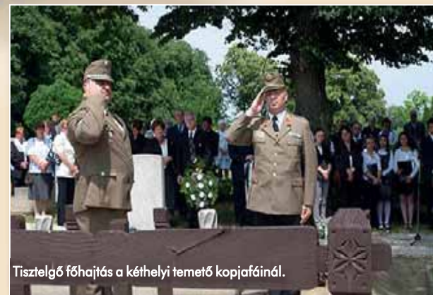
Tisztelegő főhajítás a kéthelyi temető kopjafáinál.