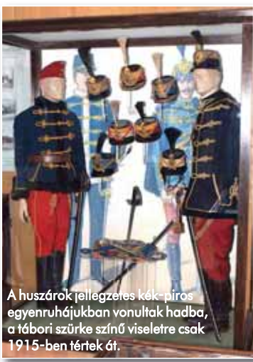
A huszárok jellegzetes kék-piros egyenruhájukban vonultak harcba, a tábori sűrű szürke színű viseletre csak 1915-ben tértek át.

A közös hadügyminiszter alárendeltségébe tartozó császári és királyi hadsereg vezényleti és szolgálati nyelve a német volt, békeidőben keretrendszerben és az általános védkötelezettség elvén működött. Nemzetiségi összetétele többek között a szárazföldi hadseregből és a haditengerészetből állt. Előbbi hármas tagolású volt: a császári és királyi (más néven közös) hadsereg, a magyar királyi honvédség és ennek osztrák megfelelője, a Landwehr, illetve a két népfőlkelés (m. kir. népfőlkelés, valamint a Landsturm) alkotta. A közös Hadügyminisztérium és az uralkodó, vagyis a legfőbb hadúr között a Katonai Iroda közvetített, míg a katonai vezetés a vezérkar kezében összpontosult. Emellett a magyar királyi honvédségnek és a Landwehrnek egyaránt volt miniszteriuma és főparancsnoksága is.