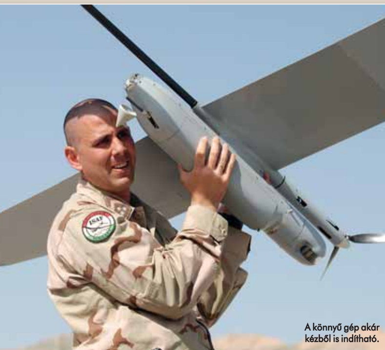
A könnyű gép akár kézből is indítható.

fényképeket is tudunk készíteni, maximum 15 kilométer hatótávolságon belül. A feladatok végrehajtása során a terepviszonyokat is figyelembe kell venni: ha hegyek közt „repülünk”, minél magasabb pontra próbálunk kitelepülni, hiszen az irányítás csak úgynevezett letelepített állomással lehetséges, mozgó gépkocsiból nem.