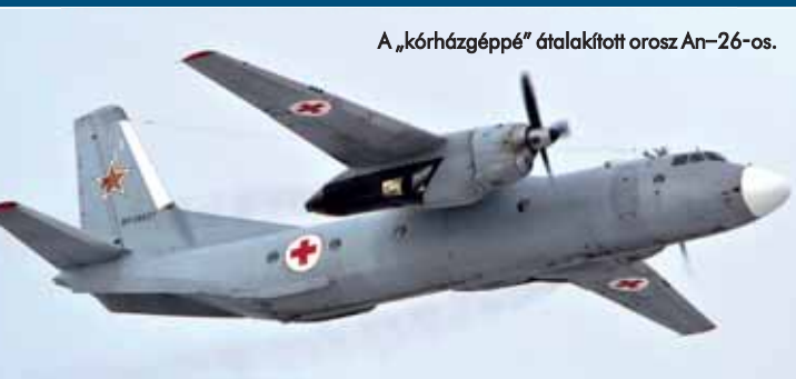
A „kórházgéppé” átalakított orosz An-26-os.