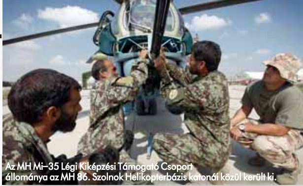
Az MH Mi-35 Légi Kiképzési Támogató Csoport állománya az MH 86. Szolnok Helikopterbázis katonái közül került ki.

Az afgán légierő állományának felkészítését támogatta Kabulban az MH Mi-35 Légi Kiképzési Támogató Csoport, amely a kilencedik váltás hazaérkezését követően 2013 májusában fejezte be missziós küldetését. Az MH Mi-17 Légi Tanácsadó Csoport 2011 szeptemberéig a Shindand Légibázison végzi az afgán helikopter-pilóták és ajtólovászok felkészítését, a műszaki oktatását, kiképzését. 2010 óta az MH Nemzeti Támogató Elem felel az Afganisztánban szolgáló magyar alakulatok, egyéni beosztá-