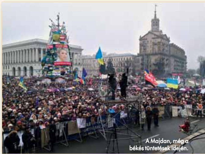
A Maidan, még a békés tüntetések idején.

Putyin orosz elnöknek az Ukrajnában 2013 vége óta zajló események adhat- tak aporóp tervének megvalósításához. Régóta készült erre, a félsziget elfoglalását professzionális módon hajtották végre. Stratégiailag ez mégis óriási hiba