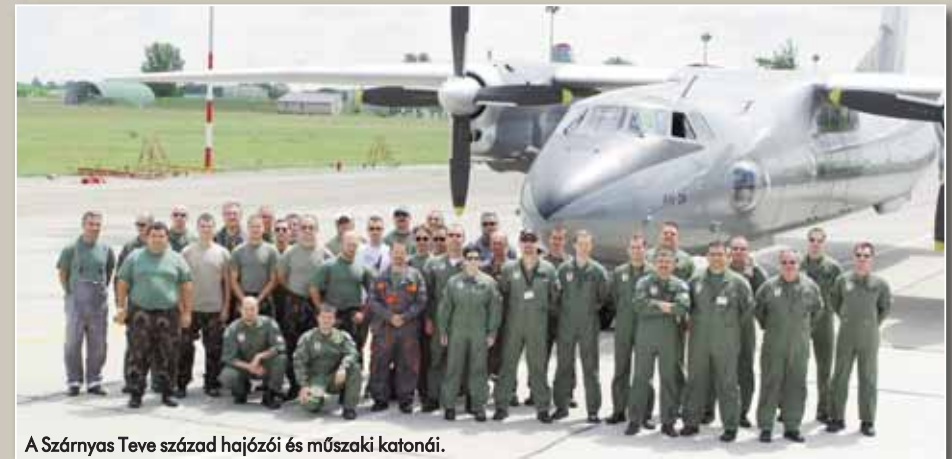
A Szárnyas Teve század hajózái és műszaki katonái.

– Kiváló gépet alkottak a tervezők, a negyven évvel ezelőtti szovjet reptéri körülményekhez igazodva „önállóvá” tették az An-26-osokat. Ennek köszönhető, hogy például a gép végéhez letett rakományt minden segítség nélkül, daruval emeljük a fedélzetre, a málhát