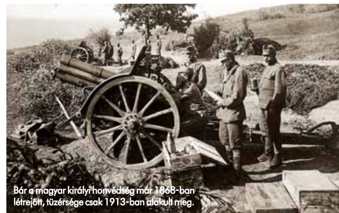
Bár a magyar királyi honvédség már 1868-ban létrejött, tüzérsége csak 1913-ban alakult meg.

A négy, egyenként több milliós hadsereget felvonultató kontinentális nagyhatalom – Franciaország, Oroszország, Németország és az Osztrák–Magyar Monarchia – stratégiai a megvívandó Nagy Háborút a 19. századi fegyveres konfliktusok nagyobb volumenű megismétlődéseként fogták fel, és a századfor-