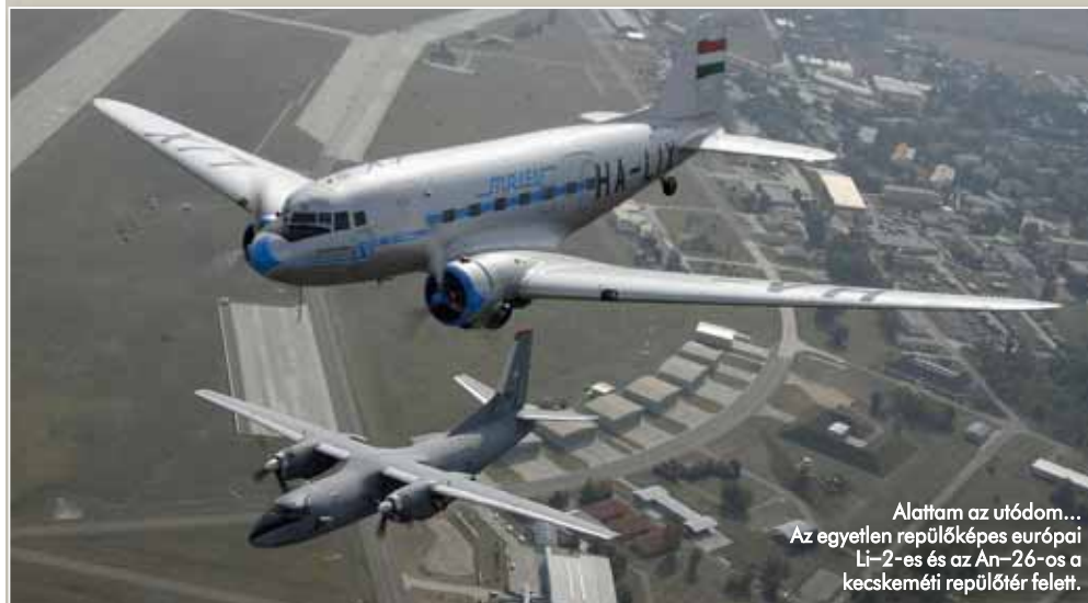
Alattam az utódom... Az egyetlen repülőképes európai Li-2-es és az An-26-os a kecskeméti repülőtéren felelt.