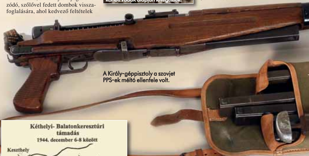
A Király-géppisztoly a szovjet PPS-ek méltó ellenfele volt.

A német harcokosik tűzfedezete alatt előrenyomuló magyar ejtőernyősök támadása fokozatosan tért nyert. A Kéthelytől nyugatra húzó dőlő szőlős dombokat ellenállás nélkül foglalták el. Ezzel tulajdonképpen teljesítették is a célt, de kihasználva a lendületet, folytatták a támadást. Látna, hogy a szárnyakon támadó német erők is sikeresen nyomultak előre, Tassonyi őrnagy úgy döntött, hogy felkészülnek Kéthely elfoglalására. Ehhez továbbra is