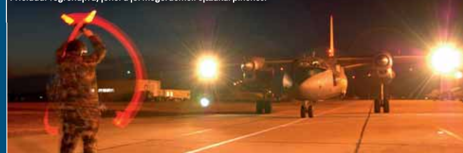
A feladat végrehajtva, jöhet a jól megérdemelt éjszakai pihenés.

Készült kórházgép is a típusból: a két An-26M teherterébe egy intenzív osztálynak megfelelő, betegkezelésre alkalmas egységet és egy műtőt építettek be. A gép hátsó részében egy kisebb pihenőhelyiséget kapott az egészségügyi személyzet. A bal hajtóműgondolában a RU19A-300 kombinált APU/sugárhajtóművet a TA-9 segédgázturbina váltotta, amely az egészségügyi felszerelés megnövekedett áramigényét is képes kielégíteni. A két repülőgép a szovjet hadsereg számos katonájának életét mentette meg Afganisztánban.