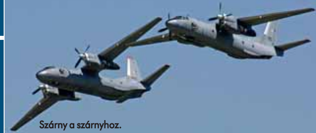
Szárny a szárnyhoz.

Az An-26RT típusjelzés rögtön két eltérő változatot is jelölhet. Az első változat elektronikai felderítő-repülőgép, amely az ellenséges radar- és kommunikációs rendszerek felderítésére, azonosítására, helyzetük meghatározására alkalmas. A repülőgép fedélzeti rendszereiről és a munkaállomásokról – érthető okokból – keveset lehet tudni, de a gép törzsén természetesen azonnal