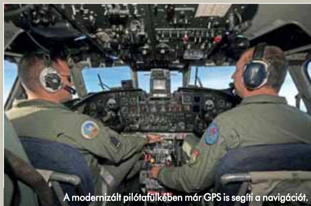
A modernizált pilótafülkében már GPS is segíti a navigációt.

A 2002-es prágai NATO-csúcstalálkozón a tagállamok vezetői úgy döntöttek, hogy növelik országaik légi szállítási képességét, hazánk ezért 2004-ben vásárolt az ukránoktól egy új An-26-ost. Ugyanebben az évben, egy újabb átszervezés következtében, az alegység a kecskeméti MH 59. Szentgyörgyi Dezső Repülőbázis állományába került. (forrás: hunaf.hu)