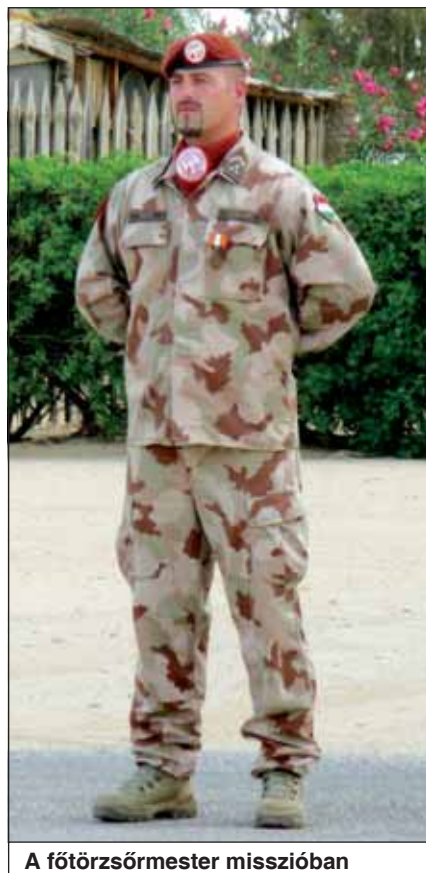
A főtörzsőrmester misszióban

Hírek, információk a haderőről www.honvedelem.hu