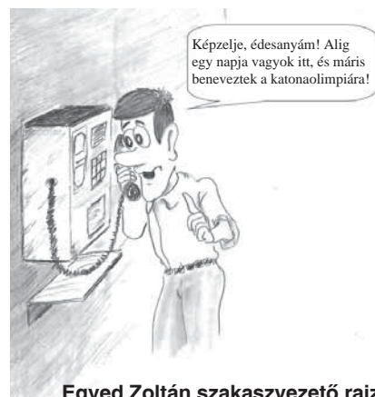
Egyed Zoltán szakaszvezető rajza