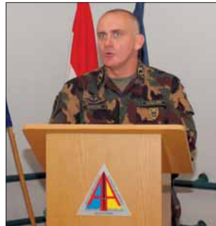
Az MH vezénylőzászlósa az előadói pulpituson

A csapatépítést megelőzően az MH vitéz Szurmay Sándor Budapest Helyőrség Dandár Protokoll, Rekreatív és Kulturális Igazgatóság munkatársai tájékoztatták a jelenlévőket az iroda működéséről és feladatrendszeréről. Ismertették a végrehajtott, illetve a jövőben rendezendő kulturális, családi és katonai vonatkozású programokat, és arra kérték a résztvevőket, alakulatuknál ismertessék a beosztott állománnyal az igénybe vehető szol-