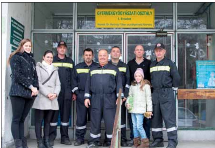
A delegáció az intézmény bejáratánál