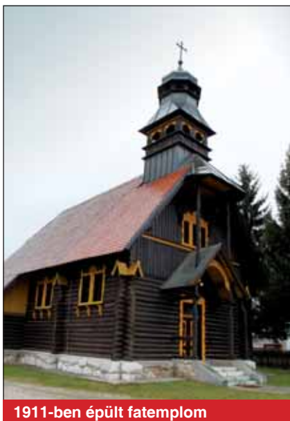
1911-ben épült fatemplom