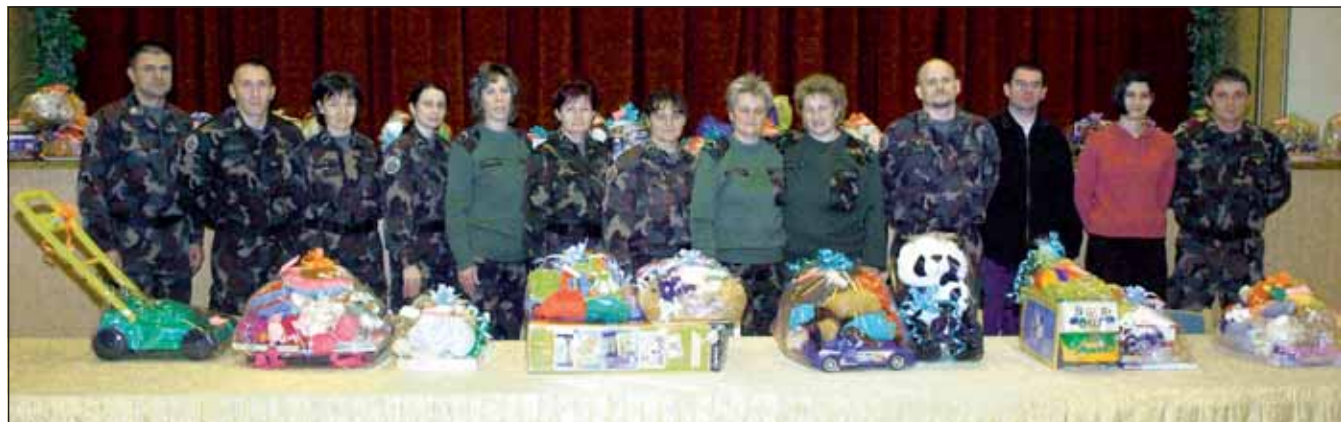
Az ajándékok és az ajándékozók