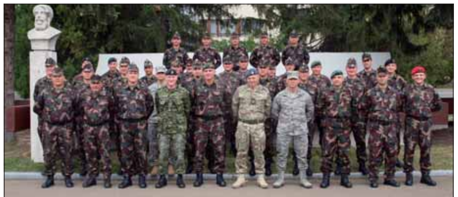
„Nemzetközi” csoportkép a résztvevőkről

Abraham Maslow piramisa és a helyzetfüggő vezetés alapelvei már régi ismerősként üdvözöltek minket, ám a helyzetorientált vezető magatartásformái és a konfliktuskezelés módszerei, külön kibontva a szervezeti és a személyes konfliktusokra, már számunkra is jelentettek kihívást. A DISC személyiség-teszt pedig csupán néhányunk számára volt ismerős, így a csoport megtanulhatott egy teljesen újszerű önismereti eljárást, amely azt vallja, hogy rossz személyiség-típus nem létezik, csupán az adott vezető nem találta meg a hozzá legjobban illő módszert. Egyéni kiértékelése után mindenki egy világos(abb) képet kaphatott arról, hogy miként tud vezetőként irányítani embereket. Ezen túl foglalkoztunk még a mentorálás kérdéskörével, a vezénylőzászlós feladataival, valamint megcsodálhattuk Kalamár főtörzszászlós tucatnyi fantasztikus koordinátarendszerét, amely a vezetéselmélet legmélyebb bugyraiba is elvitt minket.