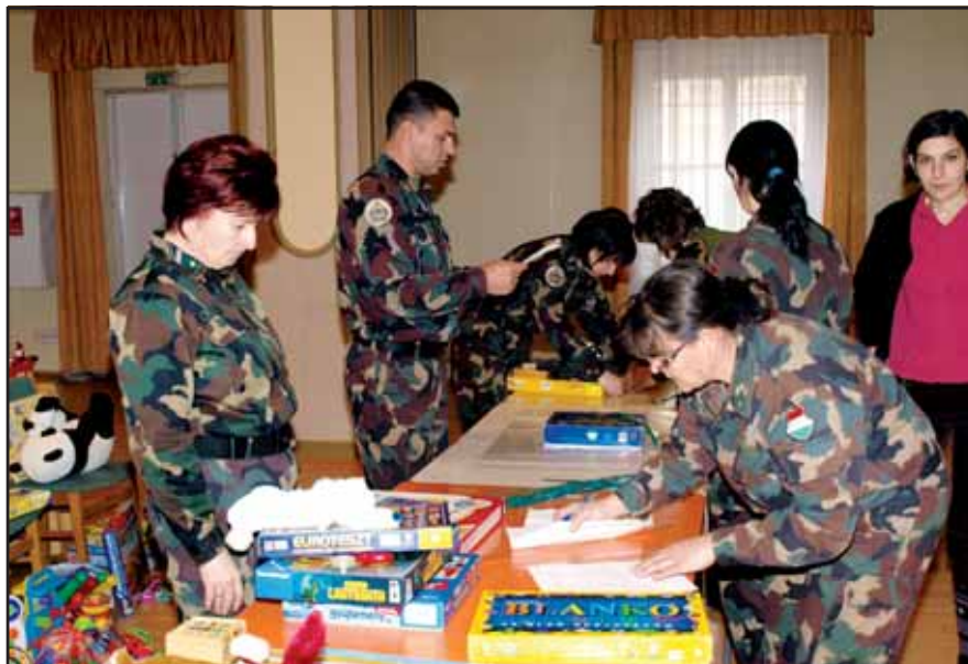
Készülnek az ajándécsomagok

A karácsony mindig is a szeretetről, a családról szólt. A jelenlegi nehéz gazdasági helyzetben igen szép összefogás tanúi lehettünk a szolnoki Tiszti Kaszinó Honvéd Hagományörző Egyesület és a Tiszthelyettesi Klub kezdeményezésében. A két szervezet felhívására, az MH 86. Szolnok Helikopter Bázis híradó-informatikai főnökségének hathatós segítségével a bázis állománya egy emberként mozdult meg, hogy a rászoruló katonacsaládok gyermekei is átélhessék a bevezetőben megemlített önfeledt és boldog pillanatokot. Közel száz katona adta össze gyermekei feleslegessé vált, megunt játékait, hogy más családok apróságainak szerezzenek így örömet. A kezdeményezés példaértékű, ám a katonákat mindig is jellemezte az összefogás, a bajtársiasság, egymás segítése. A gyűjtés eredményeképpen huszonkét katonatársunk harminckilenc gyermeke kapott ajándécsomagot,