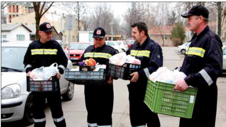
Irány a kórház!