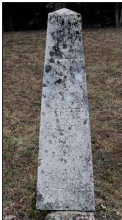
Magyar katona nyughelye Paléban

A boszniai Szerb Köztársaság politikai és katonai vezetése innen irányította az eseményeket. A magyar hadtörténelem szempontjából azt érdemes tudni még, hogy a szandzsákba vezényelt bakák Pale városán keresztül meneteltek például Novi Bazarba, illetve szolgálatuk leteltével onnan vonultak vissza Sarajevóba.