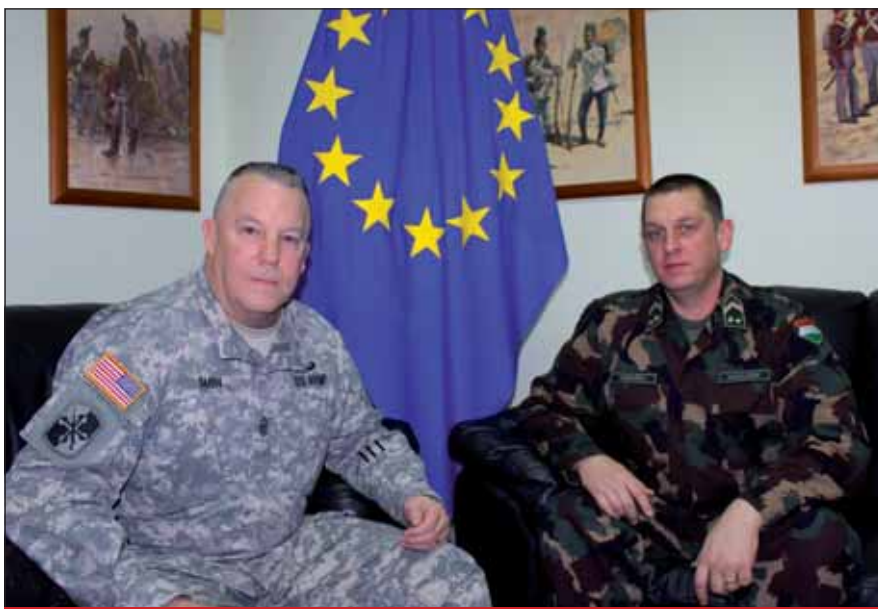
Amerikai és magyar altiszt megbeszélése

A változás, a fejlődés érzékelhető jele az is, hogy ma már az altisztek sokkal képzetebbek, iskolázottabbak, mint elődeik. Itt nemcsak a