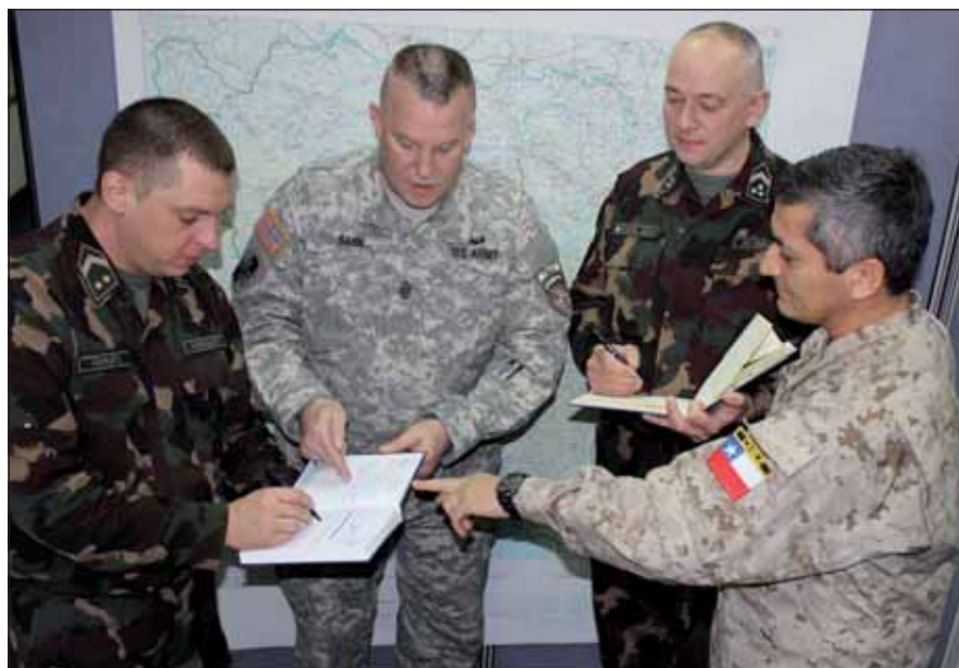
A siker kulcsa a nemzetközi együttműködés

Sann főtörzszászlós, az iskolai tanulmányai mellett, az altiszti szolgálat során kiemelten fontos ismeretekre és tapasztalatokra tett szert. Elmondása szerint igen sokat tanult a nemzetközi missziókban a külföldi partnerektől. A katonákkal való közvetlen együttműködés során bebizonyosodott számára, hogy a katona mindig katona. Függetle-