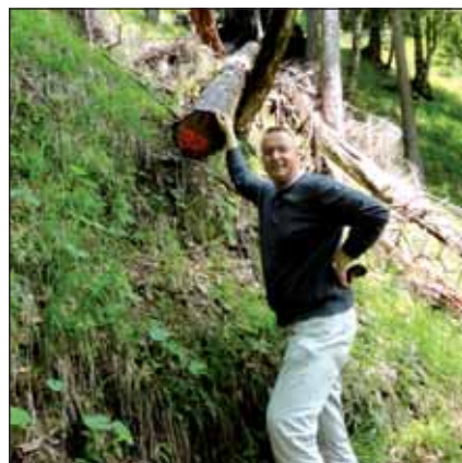
Egy kis túra a képzés szünetében

A tanfolyam kiemelt témája volt a kulturális különbségek és sokszínűség nemzetközi környezetben való kezelése, amely már a kurzus első napjaiban megalapozta a nemzeti, vallási, faji, nemi különbözőségek elfogadását. A rangidős altiszt feladatkörébe tartozó kihívásokat, így a motiváció (motivation), a csapatépítés (team building), a tanácsadás (counselling) és a konfliktuskezelés