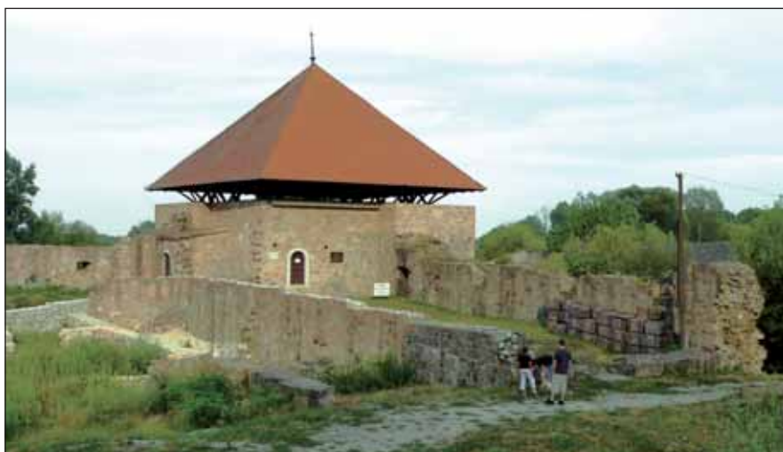
Az Ónodi vár

Látogatás az Ónodi várban és a Muhi csata emlékművénél