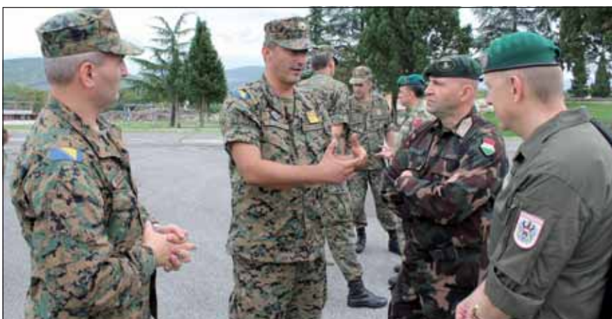
Az EUFOR törzsfőnöke altisztek társaságában