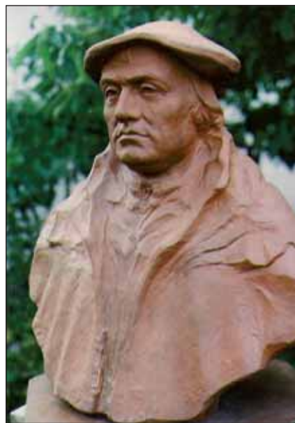
Luther Márton hitet tett az egyház megújítása mellett (Mészáros István szobrászművész alkotása)

dósi álltak be a reformáció, a nép szolgálatába, hogy a nekik adatott talantumok által szolgálják, a reformáción túlmenően, a sebzett hazá üggyét. Bár az ország kívülről nézve idegen hatalom foglya volt, a lélek szárnyalhatott, a szellemi élet meglevénedett, maradandót alkotva a későbbi korok számára is. Valósággá lett az újszövetségi Ige: „Ahol az Urnak lelke, ott van a szabadság.”