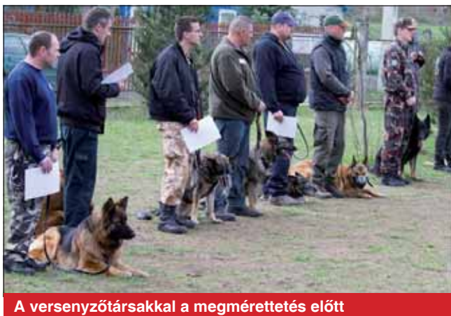
A versenyzőtársakkal a megmérettetés előtt

ből 84-et hoztam magammal, összesen 172 pontot sikerült elérnem. Ez összetettben a harmadik helyezést jelentette.