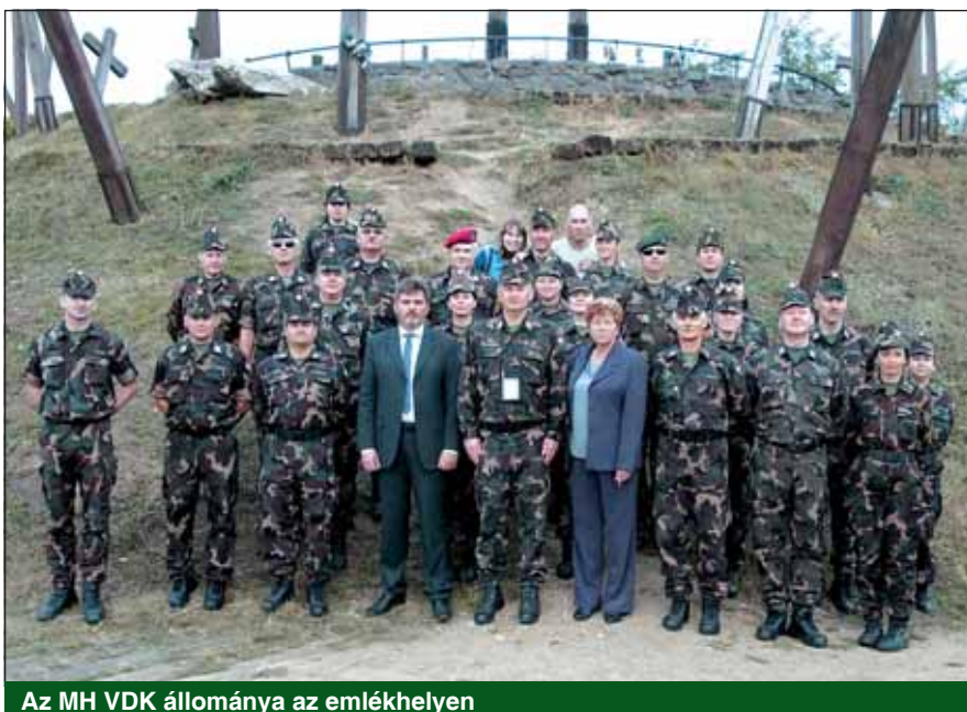
Az MH VDK állománya az emlékhelyen