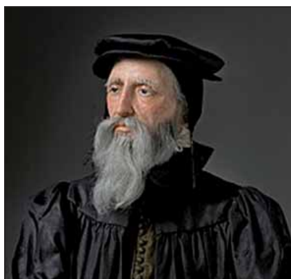
Kálvin János az ún. helvét irányzathoz tartozott

A három részre szakadt Magyarországon a reformáció tanai igen kedvező fogadtatásra találtak. Egy legyőzött, félreállított nemzet kezdett felocsúdni mélységes szomorúságából, amikor a vigasztaló üzenetet, a reménységre ösztönző hitvallásokat saját nyelvén érthette, hallhatta, olvashatta. A török iga alatt elveszett nemzeti lét okozta fájdalomok között Isten kiválasztó, megmentő és gondviselő szeretetéről, az Istenhez való odafordulás, a megtérés új értékeket felmutató lehetőségének örömeiről hangozott a prófétai ihletettséggű üzenet. S érdekes módon, a török nem látott ebben a maga sajátos szempontjait bármiben is sértő rosszat, így tehát a megszállt területeken szabadon terjedhetett az új hit. A lakosság nagyobb része a reformáció hitelvei alapján talált vigaszra, reményre. Kivételes szellemi képességű prédikátorok, tanítók, írók, költők, zenészek, a természettudományok kitűnő tu-