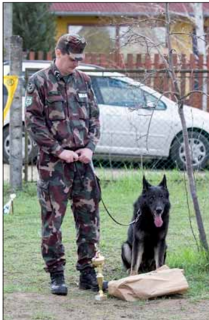
A kiképző altiszt a kutyájával