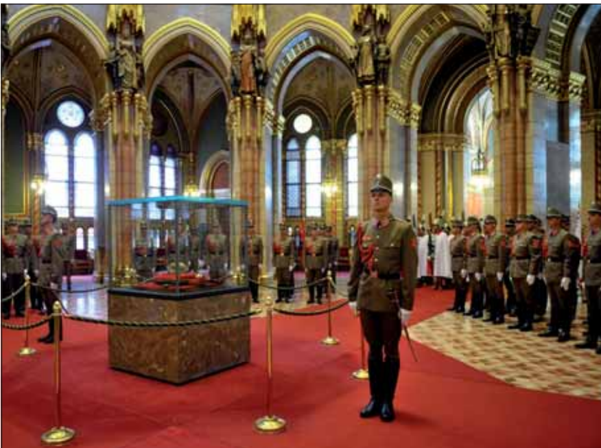
A Szent Korona őrzésének ünnepélyes átvétele

szű utazásuk ellenére mosolyogva és átéléssel éneklik el a székely vagy magyar himnuszt. Ezért is érdemes itt lenni. Az idő múlásával itt is – mint minden újonnan megalakult intézmény esetében – előjönnek a gyerekbetegségek, amit parancsnokaink, előljáróink a lehetőségekhez mérten igyekeztek megoldani. Nap mint nap feltettük magunkban a kérdést, mikor hajnalban alig fél tucat honatya éppen a halászatról cserélt eszmét, hogy valójában kinek is teljesítünk tiszteletet? Természetesen alapvetően neki, a Szent Koronának. A nemzeti ünnepeken való jelenlétünkör, a korona menekítéséről megemlékező emléktábla koszorúzásakor, egy Mátyás-templomi mise vagy az augusztus 20-ai Szent Jobb-körmenet során azonban rádöbbenünk: ennél sokkal összetettebb feladat a miénk. Ezen eseményeken meghalljuk a háttérből a suttogásokat, érzékeljük az elismerő pillantásokat: igen, mi vagyunk azoknak az egykori koronaőröknek az utódai, akikről eddig a fenti rendezvények résztvevői csak olvastak vagy nagyapáik elbeszéléseiből hallottak. Szerencsések vagyunk, amiért ezeknek a nem mindennapi eseményeknek a részei lehetünk.