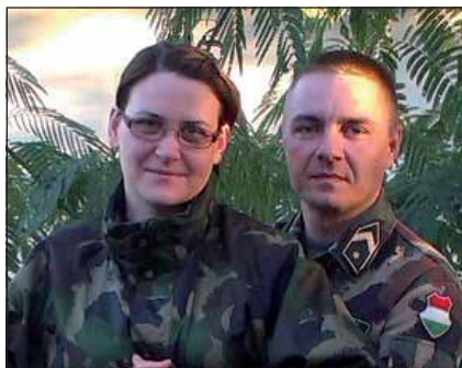
„Megtaláltam azt a társat, akinek fél év távollét nem jelent gondot a kapcsolatunkban”

– Nős vagyok, két fiú és két leány apukája. Az első házasságomnak az 1999-es missziómat követően vége szakadt. De jelenlegi feleségem személyében megtaláltam azt a társat, akinek fél év távollét nem jelent gondot a kapcsolatunkban. A célok közösek, ő hajlandó vállalni az itthoni nehézségeket, én a külszolgálatjal járókat. Ő is katona, szintén itt, Szentesen szolgál, a műszaki ezred híradószakaszának állományá-