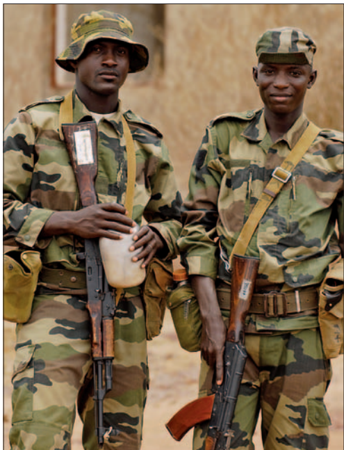
Két katona az általunk kiképzettek közül

Kiképzőcsoportunk az EUTM Mali 1. váltásaként április 12-én indult útnak Budapestről – párizsi légihíddal – Bamakóba. Mivel civil járattal utaztunk, így az összes felszerelésünket magunkkal kellett vinnünk, beleértve a fegyverzeti anyagokat is. Helyi idő szerint 20:15-kor szállt le a gépünk Bamakó repülőterén, ahol 37 fokos hőség fogadott minket az otthoni 12 fok után. Az éjszakát egy az EUTM Mali által őrzött szállodában töltöttük, majd másnap a helyiektől bérelt busszal indult a csoport Koulikoróba. Az utazás másfél óráig tartott. Megérkezésünkkor a kiképzőbázis törzsfőnöke fogadott bennünket. Rövid bemutatkozás után elkísértek minket a szállásunkhoz. Örömmel tapasztaltuk, hogy az állandó szállásaink felújítása befejeződött, így elfoglalhattuk azokat. A kiképzői állomány részére négyfős körleteket alakítottak ki, melyeket légkondicionáló berendezéssel is felszereltek.