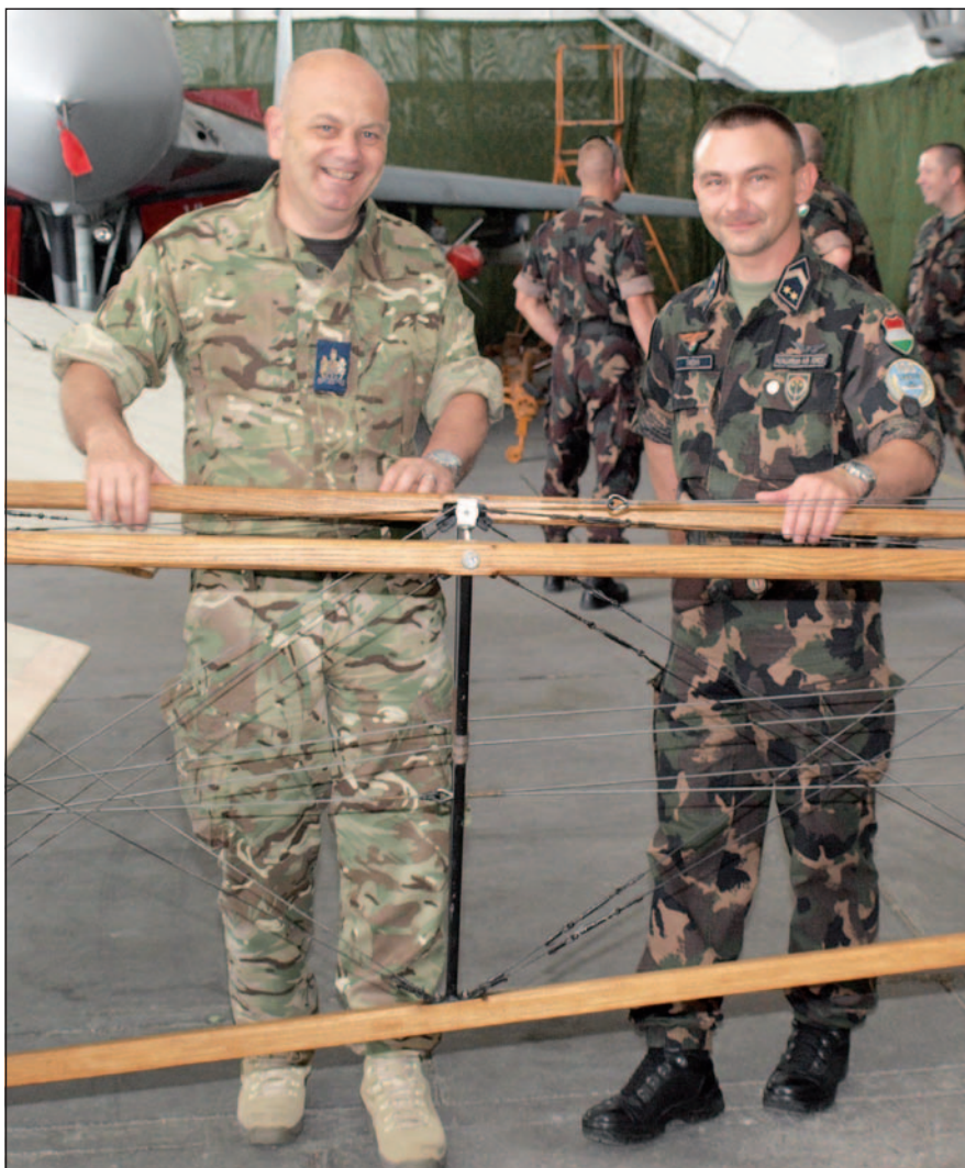
A brit vendég az interjú készítőjével

vánvalóan kevés szabadidővel rendelkezik. Hogyan tolerálja ezt a családjá?