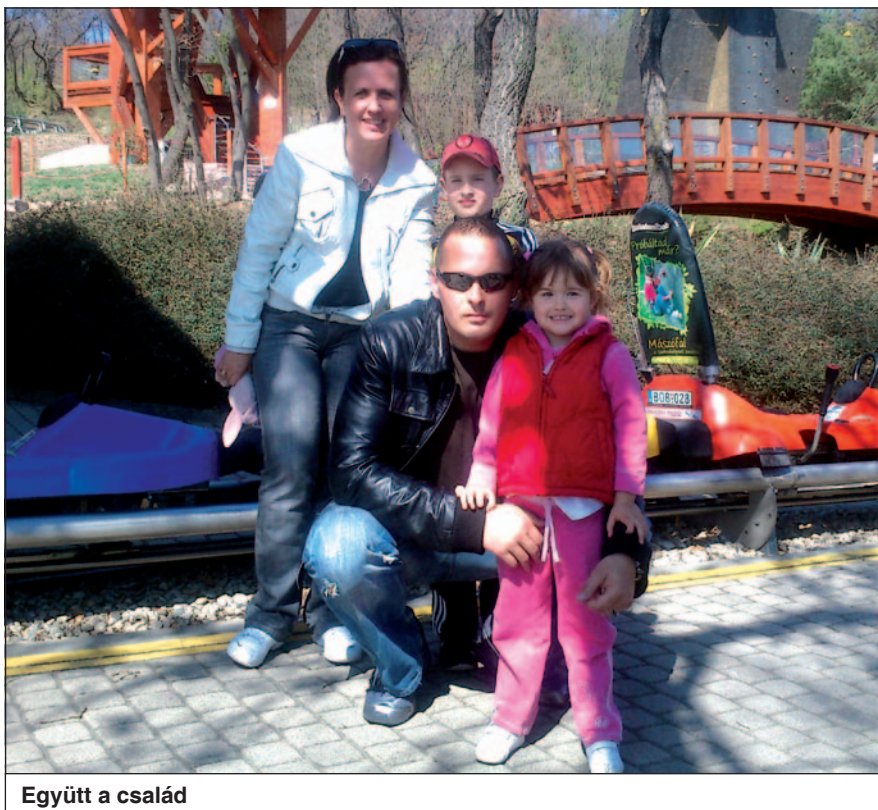
Együtt a család

2011. szeptembertől 2012. márciusig ISAF egyéni beosztás, Mazar-e-Sharif, Afganisztán (Pass Office WO). Jelenleg elvárás, hogy a magyar katona rendelkezzen missziós tapasztalattal. Úgy gondolom, egy ilyen feladatrendszerben kipróbálva magát, az embernek lehetősége adódik arra, hogy megismerje a saját határait, nem is beszélve arról a nemzetközi környezetben szerzett tapasztalatról, amelyet itthon is tudok kamatoztatni a munkám során. Életem egyik legemlékezetesebb élménye 2002-re datálódik. Cipruson logisztikai tiszthelyettes voltam az akkor még őrnagy Domján Lászlónak, akivel a misszió befejezése után következő alkalommal az MH ÖHP-n egy tapasztalatfeldolgozó továbbképzésen találkoztam 2009-ben, ahol ő már dandártábornokként a Műveleti és Irányítási Központ parancsnokaként vett részt mint ellenőrző előjáró. Még akkor, annyi év után is megismert, jó szívvel köszöntött és beszélgetett velem. Számomra ez óriási megtiszteltetés volt.