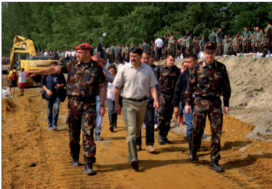
A 2013-as árvízi mentésnél az aktív katonák mellett nagy számban dolgoztak tartalékosok is

A szervezetből történő kiválásnak számos oka lehet, melyeket alapvetően két nagy csoportba sorolhatunk. Az egyik az önhibán kívül eső ok – mint objektív tényező – miatti kiválás (pl. szervezeti racionalizálás, egészségügyi alkalmatlanság, nyugállományba helyezés stb.), a másik pedig az egyéni döntésen/