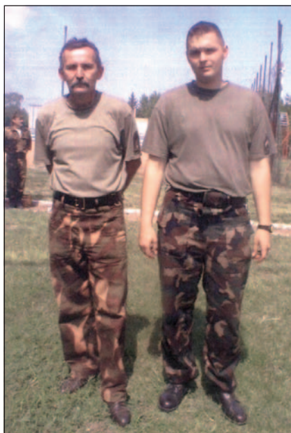
Apa és fia

– A fiam szakács szeretett volna lenni, ám a későbbiek során magával ragadták azok az értékek, amelyek annyira jellemzőek ránk, katonákra: a hazaszeretet, a felelősségtudat, a fegyelem, a precizitás, hogy csak néhányat említsek. Már a középiskola kezdetétől rendőr vagy katona szeretett volna lenni, valószínűleg az én ráhatásomra.