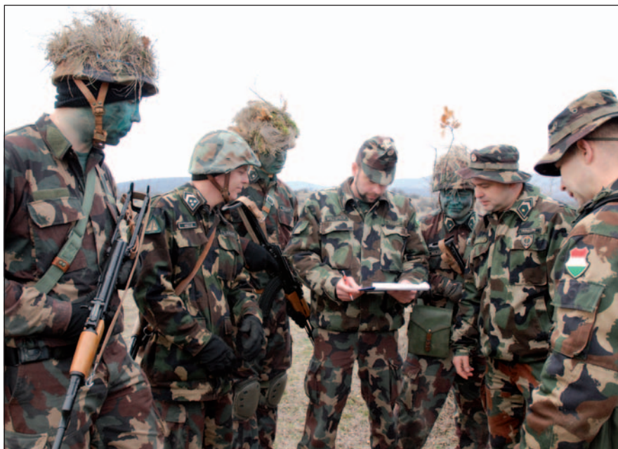
Fontos, hogy a tanfolyam egységes szintre hozza az altisztek harcászati, kiképzési, vezetési és törzsmunkához kapcsolódó ismereteit

Rangidős altiszteket írok, mivel hiszem, hogy nem csak a vezénylőzászlósok az egyedüli letéteményesei ennek a komplex, több lábon álló vezetési struktúrának. A Honvéd Altiszti Folyóirat hasábjain az elmúlt 12 évben számos alkalommal publikáltak kollégáim, akik voltak olyan szerencsések és kiérdemelték, hogy más országok haderejében szerezhettek iskolai végzettséget, vehettek részt vezetői vagy szakmai felkészítésen. Jómagam 2004–2005-ben végeztem el az Amerikai Egyesült Államok szárazföldi haderejének vezénylőzászlósi akadémiáját. Magam is azon szerencsések közé tartozhatom, akiket a rangidős altiszti beosztásba a kezdetek kezdetén neveztek ki. Tanulmányaim és a későbbi tanfolyamok, külföldi látogatások, tapasztalatcserék, illetve külhoni szolgálatom alatt megerősödött abbéli meggyőződés, hogy nem csak a vezénylőzászlósok az egye-