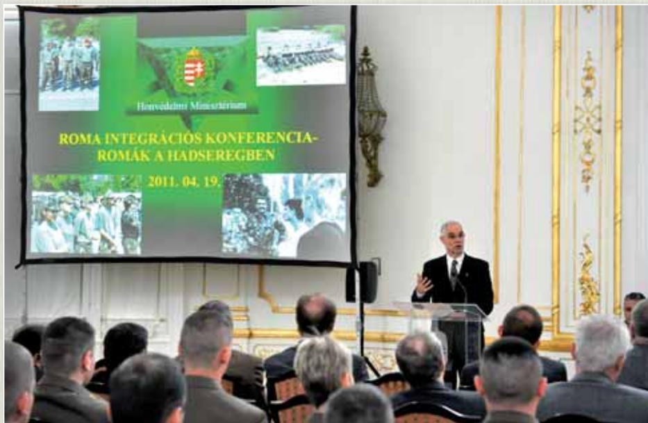
Többéves múltra tekint vissza a roma integrációs program.

vezetnél készítettem mély-, illetve strukturált interjúkat. A kérdések között szerepelt: a roma származású katonák mennyire érzik úgy, hogy befogadták őket, és hasznos része lett a bajtársi közösségnek. A szinte egyöntetű válaszok szerint a megkérdezetteknek semmilyen problémájuk nem volt roma származásuk miatt. A lényeg az volt számukra, hogy megfelelő színvonalon, együtt végezzenek el a rájuk bízott feladatot.