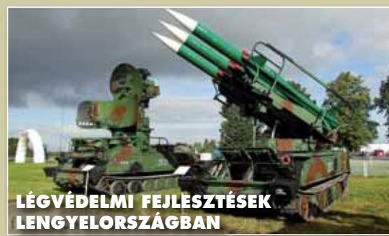
LÉGVÉDELMI FEJLESZTÉSEK LENGYELORSZÁGBAN

A lengyel védelmi minisztérium bejelentette, hogy két különálló beszerzést indít lengyel légvédelmi rendszer fejlesztésére. Első lépésként közepes hatótávolságú, repülőgépek és rakéták ellen használható légvédelmi rakétarendszert szereznek be. A minisztérium szakértői megkeresték a lehetséges gyártókat, akik június 21-ig jelentkezhetek ajánlataikkal Varsóban. A kis hatótávolságú csatlékvédelmi rakéták beszerzése is hamarosan megkezdődik, a tervek szerint az első ilyen eszközök már 2017-ben hadrendbe állhatnak. A két program becsült összköltsége eléri a 3,75 milliárd dollárt. (www.defensenews.com)