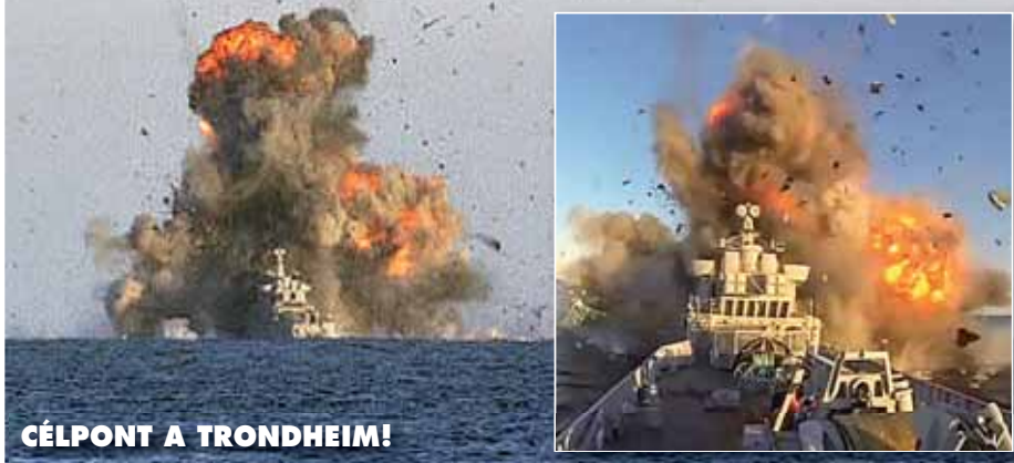
CÉLPONT A TRONDHEIM!

Sikeres rendszerbe állító éleslövészetet hajtott végre a Norvég Királyi Haditengerészet június hatodikán. A célpont a kiselejtezett és minden szennyezőanyagától, kőolajszármazéktól megtisztított KNM TRONDHEIM fregatt volt. A Koenigsberg cég fejlesztette Naval Strike Missile hajó elleni rakétát egy Skjold-osztályú korvettről indították, s ezt követően sikerrel csapódott a célpontba, a TRONDHEIM felépítményébe. A fegyverrendszer célja az ellenséges hajó megbénítása, a további feladatok végrehajtásának megakadályozása. Méretét, egyben robbanófejeének nagyságát korlátozza, hogy a rakéta a légi indítású, az F-35 Lightning II vadászbombázó belső fegyverterébe tervezett Joint Strike Missile hajófedélzetre átalakított változata. (www.flightglobal.com)