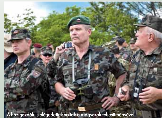
A házigazdák is elégedettek voltak a magyarok teljesítményével.

A tervek szerint 2014-ben is megrendezik az Adriai Csapást, a szlovén kollégák pedig ismét számítanak a magyar szakemberek közreműködésére.