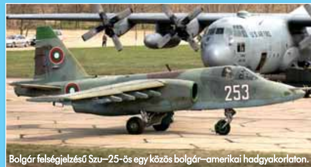
Bolgár felségjelzésű Szu-25-ös egy közös bolgár-amerikai hadgyakorlaton.

jét. A kiváló tömeg/tolóerő aránnyal rendelkező, remek aerodinamikai kialakítású, két hajtóműves gép továbbfejlesz-