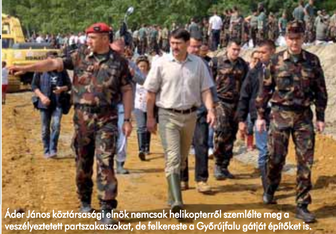
Áder János köztársasági elnök nemcsak helikopterről szemlélte meg a veszélyeztetett partszakaszokat, de felkereste a Győrújfalú gátját építőket is.

– Épp a veszélyhelyzet kihirdetése előtt egy nappal vonult be tíznapos budapesti kiképzésre mintegy háromszáz tartalékos katoná. Őket a másnap már a gáton érte. A védelmi tartalékosok a védekezés első napjától dolgoztak, a műveleti tartalékosoknak pedig azonnal kiküldték a behívóparancsot. Behívási rendszerünk első éles tesztjén jó tapasztalatokat szereztünk. A legnagyobb létszámú mozgósításkor mintegy 700 tartalékost értesítettünk ki, és 92 százalék volt a bevonulás aránya. Ez példátlanul nagy fegyelmeltségre