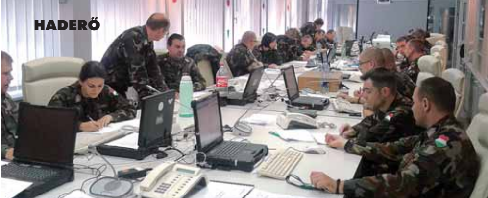
A Magyar Honvédség minden szintjén operatív csoportok koordinálták az árvízi védekezést.

gezték. A védekezést többek között huszonnégy PTSZ-M úszó lánctalpas gépjármű, és négy Mi-8/17-es helikopter is segítette.