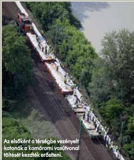
Az elsőként a térségbe vezényelt katonák a komáromi vasútvonalon föltésztést kezdték erősíteni.