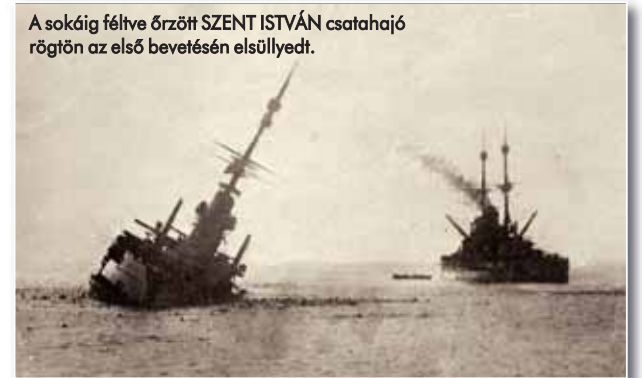
A sokáig féltve őrzött SZENT ISTVÁN csatahajó rögtön az első bevetésén elsüllyedt.