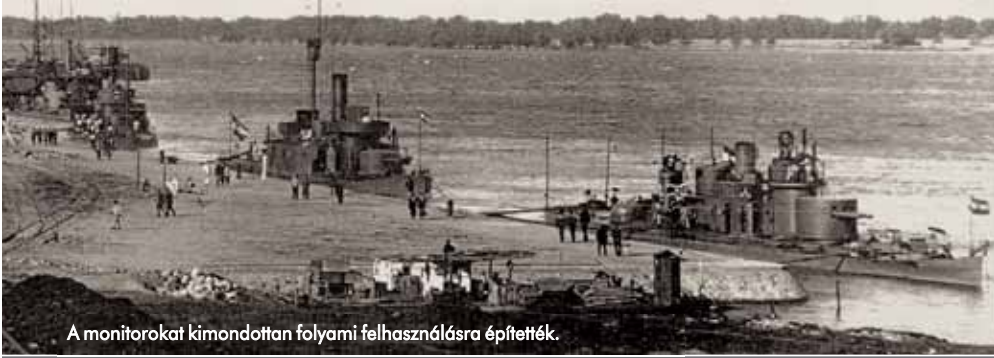
A monitorokat kimondottan folyami felhasználásra építették.

tengeren nem vált be, a folyókon vízszint annál inkább. A monitorok 1872-től hazánkban is bizonyíthatóan képeségeiket: ennek közvetlen előzményeként 1871-ben, vagyis az 1867. évi kiegyezés és az Osztrák–Magyar Monarchia születése után négy évvel, a Duna védelmére létrehozták a császári–királyi (1889. október 17-től császári és királyi) haditengerészet Budapesti Különítményét. Fennállása során a Duna-flottilla összesen tíz monitort kapott, melyeket a Monarchia folyóiról neveztek el: 1872-ben a MAROS és a LEITHA (LAJTA), 1892-ben a SZAMOS és a KÖRÖS, 1905-ben a TEMES és a BODROG, 1914–15-ben az ENNS és az INN, 1915 közepén pedig a SAVA és az 1917-ben BOSNA névre átnevezett TEMES II állt hadrendbe. Emellett az 1890-es évek közepétől a flottilla hajóállománya a monitornál kisebb, de gyorsabb egységekkel, űrnaszádokkal is gyarapodott.