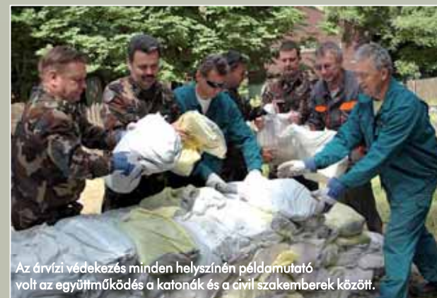
Az árvíz védekezés minden helyszínén példamutató volt az együttműködés a katonák és a civil szakemberek között.