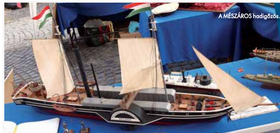
A MÉSZÁROS hadigőzös.

A szabadságharc leverése után a magyarországi folyami hadihajózás természetesen osztrák irányítás alá került. 1850. november 30-án hozták létre a császári-királyi flottillahadtestet, amelyet