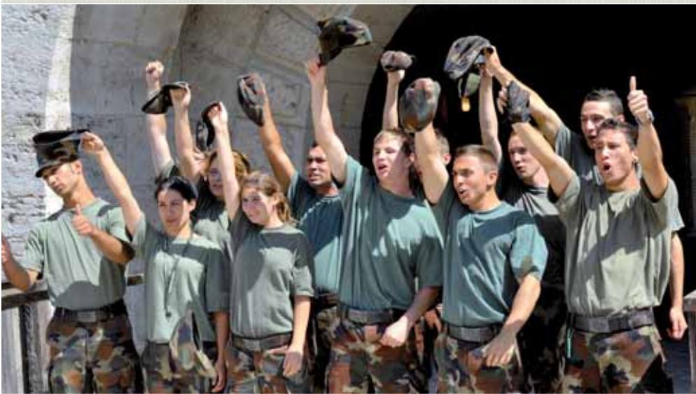
Csapatmunka, elkötelezettség: a katonai karrier mindenki számára nyitott.

A honvédelmi tárca Lippai Balázs esélyegyenlőséget segítő ösztöndíjjával is segíteni kíván a hátrányos helyzetű, vagy magukat roma származásúnak valló középiskolásoknak, illetve felsőfokú intézményben tanulóknak. Az ösztöndíjat egy nap-tári év két tanulmányi félévében, összesen tíz, KatonaSuli-programban részt vevő, a katonai alapismereteket szabadon választott érettségi tantárgyként tanuló, illetve a honvédelmi ismeretek tantárgyat felvett fiatal nyerheti el. Az ösztöndíj havi mértéke a köztisztviselői illetményalap 25%-ának személyi jövedelemadó-előleggel növelt összege.