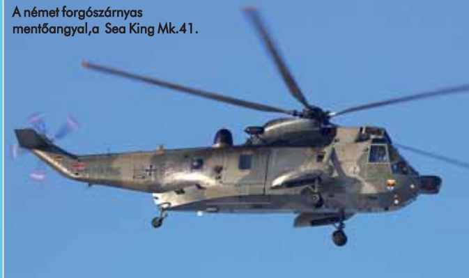
A német forgószárnyas mentőangyal, a Sea King Mk.41.

felségjelzését viseli. Németország még 1969-ben, első külföldi országgént rendelt 22 példányt az amerikai Sikorsky S-61-es Nagy-Britanniában, licenc alapján gyártott változatából, a Sea King-ből, amelyekkel a partközeli kutató-mentő feladatokat kívánták ellátni. A helikoptereket 1973 áprilisa és 1974 szeptembere között szállították le.