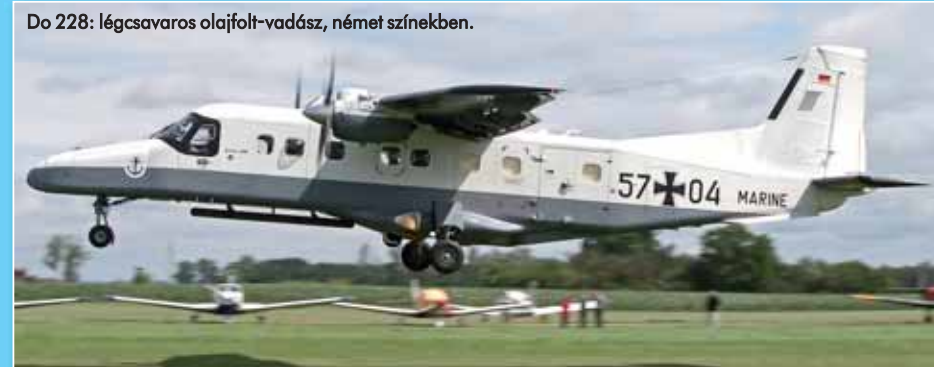
Do 228: légszavaras olajfolt-vadász, német színekben.

Szintén a német haditengerészettől érkezik a másik „ismeretlen”, a Dornier Do 228-as repülőgép is. A turboprop típus két példánya a tengeri szennyöződések felderítésében jeleskedik. A gépet kifejezetten rövid fel- és leszállások végrehajtására, könnyű teher- és személyszállítási feladatokra tervezte a Dornier Repülőgépgyár. A típust Németországban 1981 és 1998 között gyártották. A haditengerészet két Do 228 LM változatú gépe a 3. „Graf Zeppelin” századnál szolgál. Fedélzetén oldalra néző radarrendszer, infravörös, lézert és ultravioleta fénytartományban működő érzékelő, illetve repülés közben levegőmintákat készítő eszköz is dolgozik. A gépek az Északi- és a Balti-tenger hajóforgalmát, a hajók esetleges szennyeződéseit követik nyomon, egy felzárkóval legfeljebb 2800 kilométeres hatósugárban.