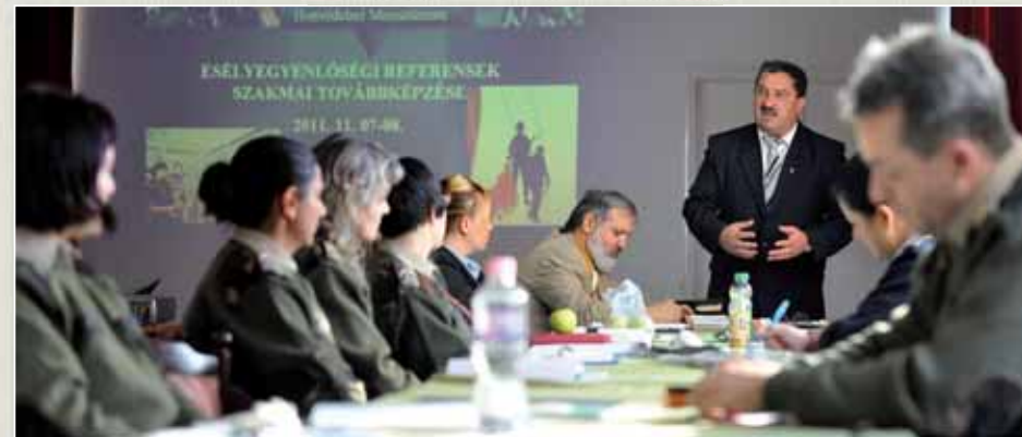
Állandó partner az Országos Roma Önkormányzat.

gátat során mindenki együtt, a cél elérése, a feladat maradéktalan végrehajtása érdekében végzi a munkáját. Az alezredes tudományos igényű érvekkel támasztotta alá, hogy a mindennapok során hogyan is érvényesülnek a katonaközösség esélyegyenlőséggel kapcsolatos elvárásai. 2012-ben kisebbségi esélyegyenlőségi tanácsadó szakon szereztem diplomát a Szent István Egyetemen, és a diplomamunkámat a Magyar Honvédség és a Honvédelmi Minisztérium romastratégiájáról írtam – mondta –, s ennek kapcsán több katonai szer-