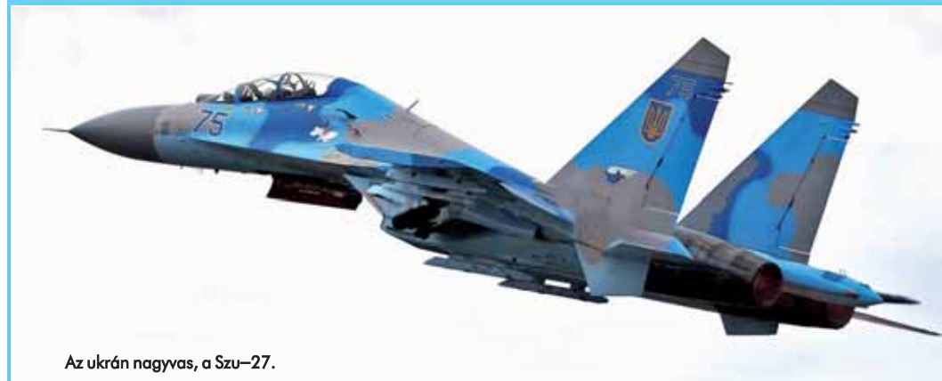
Az ukrán nagyvas, a Szu-27.