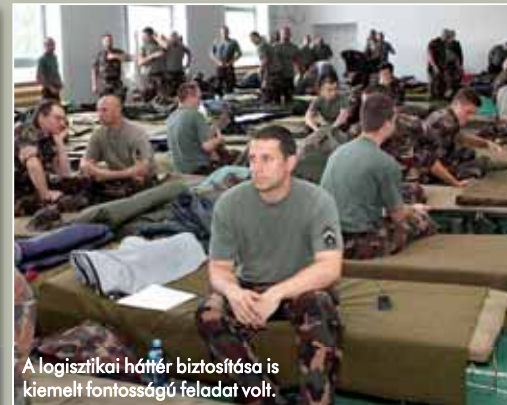
A logisztikai háttér biztosítása is kiemelt fontosságú feladat volt.

járművek a védekezéshez szükséges felbontású és pontosságú légi felvételekkel látták el a szakembereket. Az árvíz levonulása után sem nélkülözték a katonákat a gátakon: a vegyvédelmi-ek Dunabogdány térségében fertőtle-