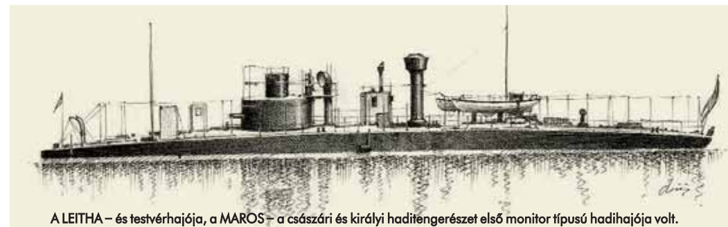
A LEITHA – és testvérhajója, a MAROS – a császári és királyi haditengerészet első monitor típusú hadihajója volt.

Új hadihajótípus született tehát, ami ugyan a kis oldalmagasságú test miatt a