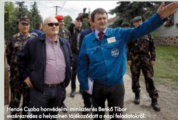
Henke Csaba honvédelmi miniszter és Benkő Tibor vezérezredek a helyszínen tájékozódott a napi feladatokról.

– Megítélesem szerint gyorsan és rugalmasan reagáltunk minden helyzetre, megkeresésre a védekezés kezdetekor és feladataink teljesítésének teljes ideje alatt egyaránt. A saját előrejelzési rendszerünkben és a híradásokból származó információk kellő előrelátást biztosítottak számunkra, melyek alapján már május 31-én elrendeltem, hogy ellenőrizzék a technikai eszközök és a személyi állomány bevetettségét. Először június 3-án délután kérték segítséget a honvédségtől. Másnap reggel már 200 katona dolgozott a Komárom környéki gátszakaszokon, s aznapra az árvízi védekezéshez szükséges lánctalpas kételtű járművek is megérkeztek a térségbe. Bázislaktanyákba csoportosítottuk a személyi állományt, hogy mindig teljesíteni tudjuk a folyamatosan érkező és egyre bővülő igényeket. A védekezés csúcspontján, Budapesten extra tartalékként, félórás készenléten állt több, szükség esetén rövid időn belül a kritikus helyszínekre vezényelhető katona.