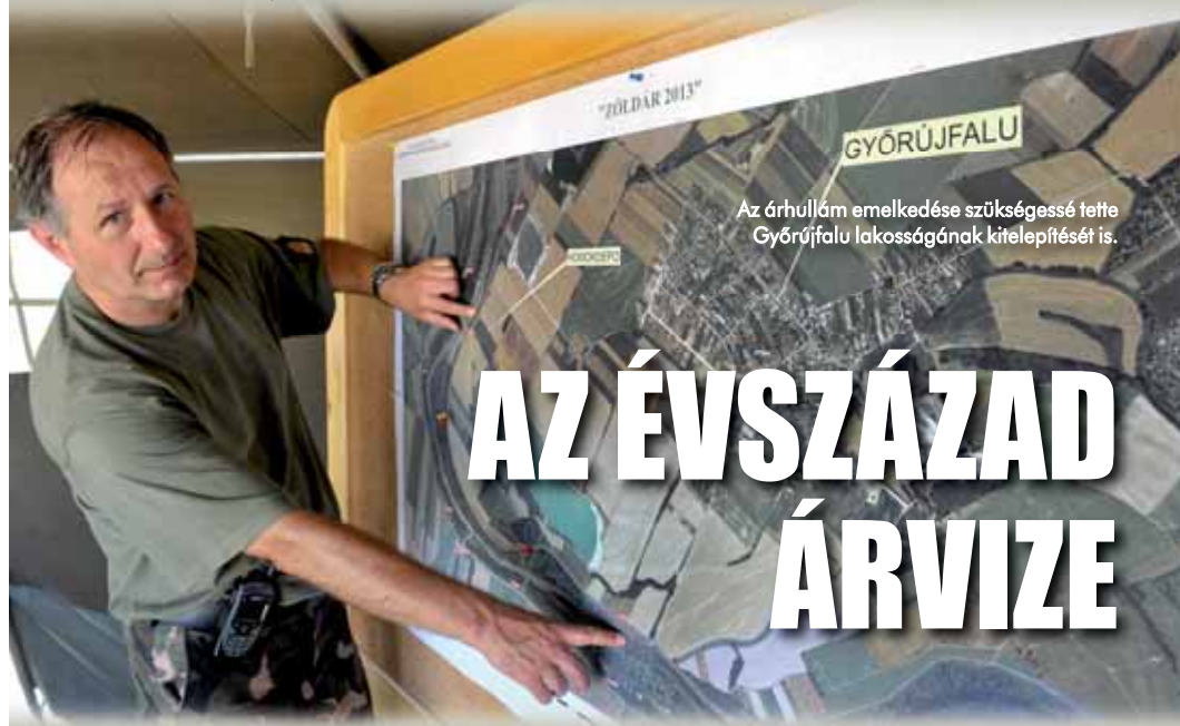
Az árhullám emelkedése szükségessé tette Győrújfalú lakosságának kitelepítését is.

A LEVONULÓ ÁRHULLÁM A DUNA CSAK NEM TELJES MAGYARORSZÁGI SZAKASZÁN IDÉZETT ELŐ SZÁZESTENDŐS REKORDOKAT MEGDÖNTŐ VÍZÁLLÁST. AZ ÁRADAT „KORDÁBAN TARTÁSÁBAN”, AZ EMBERI ÉLETEK ÉS AZ ANYAGI JAVAK MEGÓVÁSÁBAN HIVATÁSOSOK ÉS ÖNKÉNTESOK TÍZEZREI VETEK RÉSZT, KÖZTÜK A MAGYAR HONVÉDSÉG KIJELÖLT ERŐI.