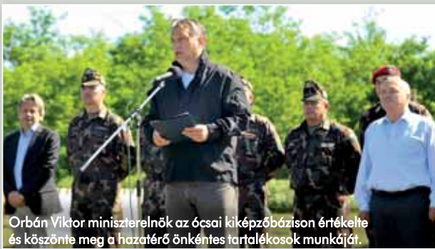
Orbán Viktor miniszterelnök az ócsai kiképzőbázison értékelte és köszönte meg a hazatérő önkéntes tartalékosok munkáját.

– A katonai bűvárok több mint 700 merült órát dolgoztak a védekezés során. Ez mindenképpen rengeteg munkát jelentett, de a kiképzés részét képezi az olyan jellegű feladatok, amiket a védekezés megkövetelt. A gátak víz alatti megerősítése mellett folyamatosan ellenőrizték a védművek állapotát, és fontos feladatuk volt a kikötői pontonok elkötése, áthelyezése, mivel azok veszélyeztetik a védekezést. Fontos szerepük volt az anyagi javak mentése és az emberi életek megővése során is. Nagymarosnál történt meg, hogy az árvíz elől kiköltöző házaspár egyik tagjának az életmentő szivógyszerei a házban maradtak. Ekkor bűváraink kenuval visszazsaeveztek az ingatlanhoz, és kihozták a gyógyszereket.