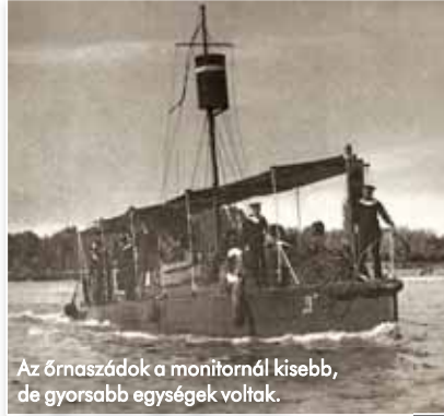
Az űrnaszádok a monitornál kisebb, de gyorsabb egységek voltak.