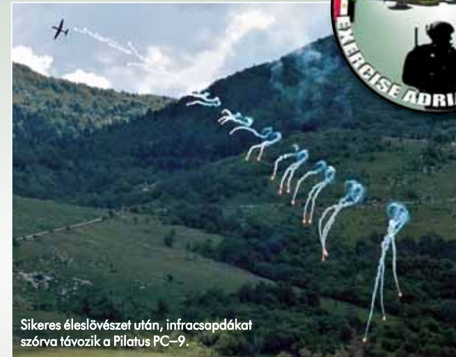
Sikeres éleslövészet után, infracsapdák szórva távozik a Pilatus PC-9.

PRC-117F rádióval együtt. Az ERICs új, páncélozott Mercedes terepjáró gépkocsija kifejezetten jól vizsgázott a helyszínén. Lézeres célmegjelölőt viszont nem vihettünk magunkkal – tette hozzá az oktatótisz –, mert Szlovéniában a jelenlegi szabályok szerint még lőtéren sem szabad ilyet használni.