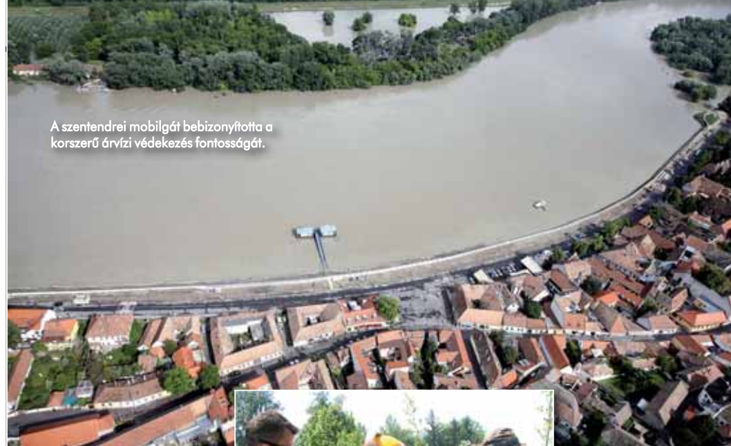
A szentendrei mobilgátat bebizonyította a korszerű árvízi védekezés fontosságát.