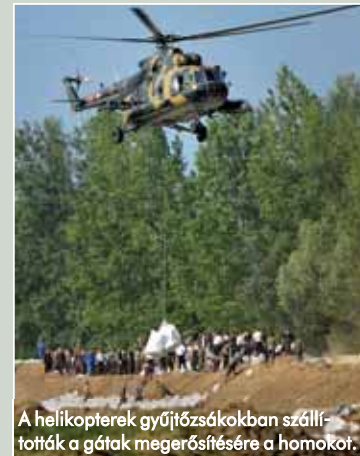
A helikopterek gyűjtőszakokban szállították a gátak megerősítésére a homokot.

– Több mint 1400 tartalékos vett részt a munkában a védekezés első napjától. Tapasztalatukkal, létszámukkal megszokozták a honvédség erejét. Bizonyították, hogy a rendszer működik. Úgy gondolom, szükség van olyan bátor fi-