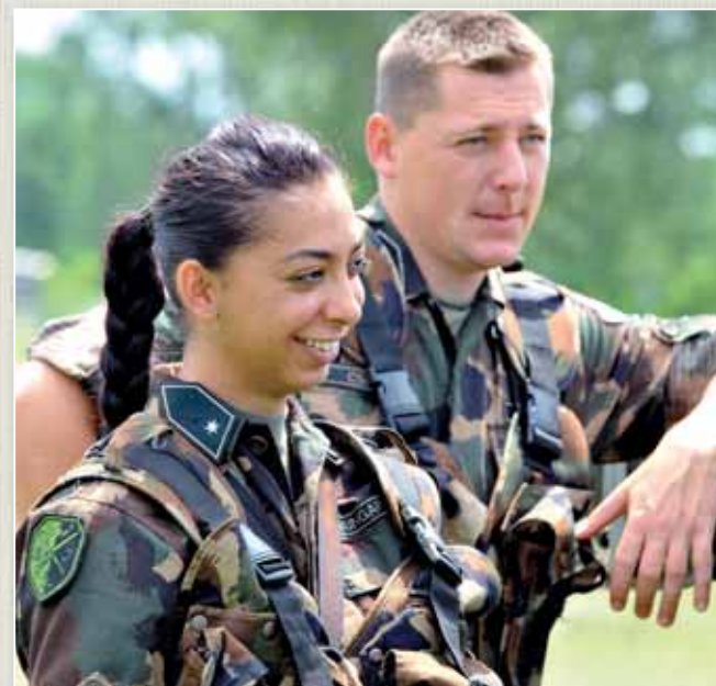
A Magyar Honvédség jelenleg is biztos, kiszámítható jövőképet nyújt.

Az együttműködési megállapodás egyik kiemelt pontja alapján zajlanak egy szemléletformáló, pozitív romaképet adó film előkészületei. A példamutatásnak szánt alkotásban roma származású katonákat kívánunk megszólaltatni, bemutatva munkahelyi környezetüket, és ha lehetséges, családi indíttatásukat, otthoni környezetüket is. Nem csupán a roma származásúaknak, hanem a társadalom más csoportjainak kívánjuk tehát bemutatni: íme, vannak roma származású katonák, akik eltökéltek voltak céljaik megvalósításában, s ebben nem akadályozhatta meg őket semmilyen hátráltató körülmény – emelte ki a leendő film talán legfontosabb üzenetét az alezredes. Hozzátette, természetesen nem akarnak rózsaszín képet alkotni, éppen ezért kívánják megszólaltatni a családtagokat is, bemutatva azt, hogy ők miként látják a katonai hivatáshoz vezető utat.