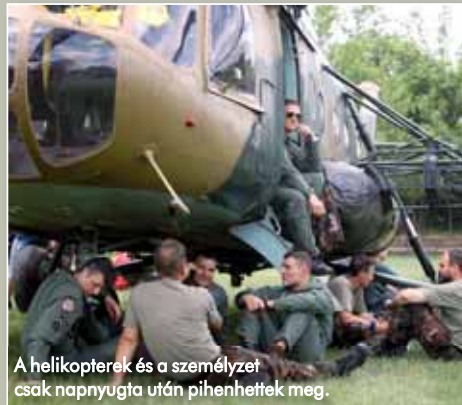
A helikopterek és a személyzet csak napnyugta után pihenhettek meg.

– A híradásokban, a mi jelentéseinkben is jelzett létszámok csupán a területen, a gátakon dolgozókról adnak információt. De nem szabad elfelejtenünk, hogy tevékenységüket további több száz