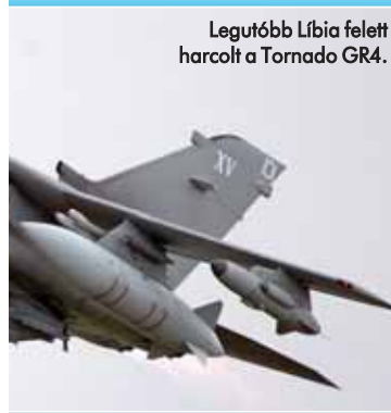
Legutóbb Líbia felett harcolt a Tornado GR4.

jét. A kiváló tömeg/tolóerő aránnyal rendelkező, remek aerodinamikai kialakítású, két hajtóműves gép továbbfejlesz-