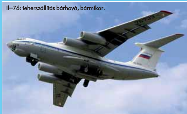
Il-76: teherszállítás bárhová, bármikor.

ti viszonyoktól függően a magasan repülő célokat 650, míg az alacsonyan szálló gépeket 400 kilométeres távolságból észlelheti. A repülőgép törzsében kialakított munkahelyek képernyői előtt a feladat típusától és hosszától függően, egymást váltva 13–19 szakember dolgozik. Az AWACS-ek a balkáni válság során sokáig a magyar légtérben repülve felügyelték hazánk és a Balkán északi felének légtérét.