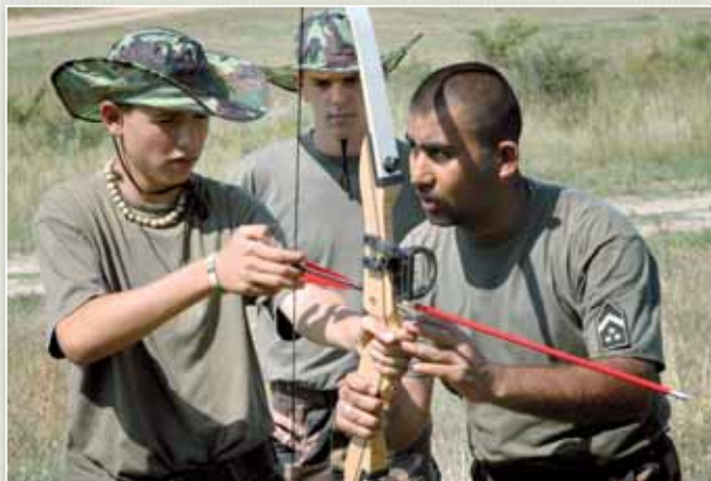
Esélyegyenlőségi tábor: útmutatás a jövő katonáinak.

A jogi szabályozók is biztosítják, hogy a megfelelő képzettséggel, tudással, szakértelemmel rendelkező, illetve a fizikai és egyéb feltételeknek eleget tevő katonák előbbre jusson a ranglétrán. Az alezredes szertint nincs semmilyen különbség a roma származásúak vagy a nem roma származásúak haderőbeli mobilitása között. Személyesen is ismerek magát roma származásúnak valló, felelős beosztást, vezető funkciót betöltő katonát, altisztet és tisztet – tette hozzá az esélyegyenlőségi referens.