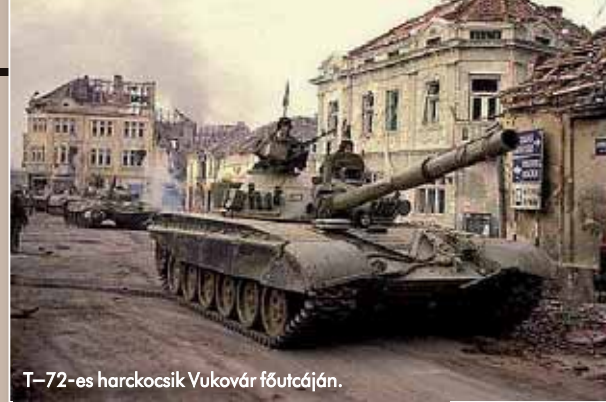
T-72-es harckocsi Vukovár főutcáján.

1991-ben tehát a Magyar Honvédség azzal találta szemben magát, hogy a határaink mellett olyan háború folyik, amelyik bármelyik pillanatban veszélyeztetheti a Magyar Köztársaság biztonsá-