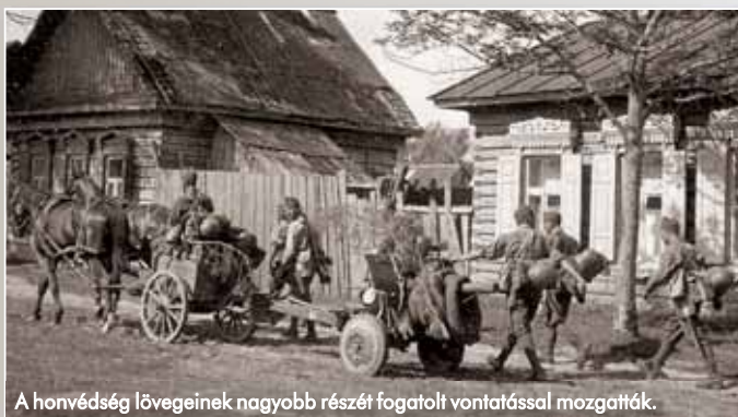
A honvédség lövegeinek nagyobb részét fogatolt vontatással mozgatták.

Időközben a keleti hadszíntéren tomboló háború a németek számára kedvezőtlen fordulatot vett. A Barbarossaterv kudarca, valamint a szovjet Vörös