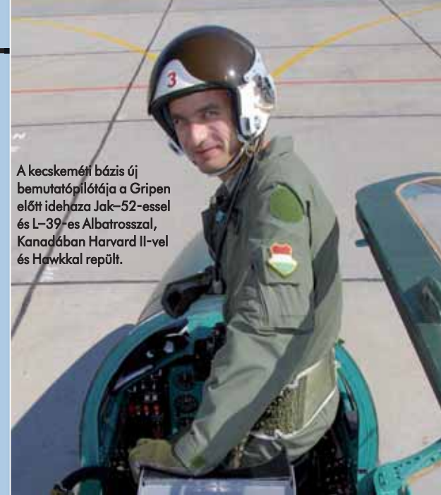
A kecskeméti bázis új bemutatópilótája a Gripen előtt idehaza Jak-52-essel és L-39-es Albatrosszal, Kanadában Harvard II-vel és Hawkkal repült.

– Következett az ejtőernyős kiképzés, majd pedig Szolnokon az elméleti felkészülés. A leghangúlyosabb tárgy az angol és a testnevelés volt, de tanultunk repüléselméletet, műszaki ismereteket, légi jogot és navigációt is. A végén pedig Jak-52-essel repültünk. 2005. május 11-én, évfolyamom első csoportjában utazhattam Kanadába. A reginai egyetemre jártunk három hónapig. Mindvégig a nyelvtanuláson volt a hangsúly, általában és szakmai angolt tanultunk. Ez idő alatt szinte meg sem szólaltam magyarul.