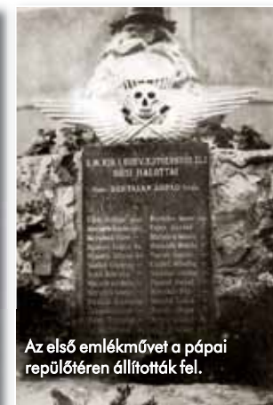
Az első emlékművet a pápai repülőtérre állították fel.