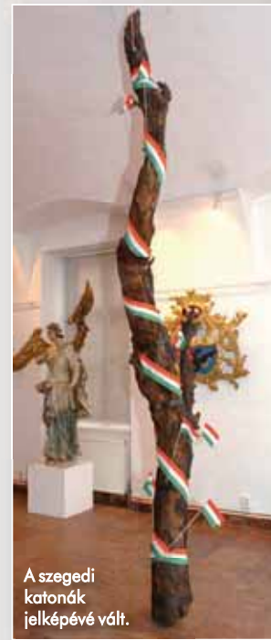
A szegedi katonák jelképévé vált.

A doberdói fát először a kultúrpalota kupolacsarnokában helyezték el, innen a Móra Ferenc Múzeum gyűjteményébe került, ahol a második világháború végéig volt látható, majd a '90-es években átszállították a Fekete-házba. Közel egy