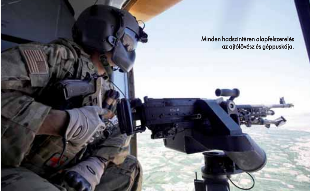
Minden hadszíntéren alapfelszerelés az ajtólövész és géppuskája.

mányos” géppuskákhoz hasonlóan kezelheti. A jellemzően 400-410 löszer a deszantter bal oldalán lévő konténerből jut el a fegyverhez. E helikopterekkel elsősorban támogató feladatokat hajtottak végre.