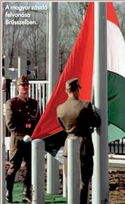
A magyar zászló felvonása Brüsszelben.

tosítására csupán egy hadosztálynyi erőnk volt, mobil harcscoportokat hoztunk létre annak érdekében, hogy bárhol gyorsan bevetethetők legyenek. Ekkor és többek között ennek érdekében alakítottuk meg annak idején a 88. légimozgékonyasági zászlóaljat is. Kiválóan teljesítettek a felderítőerők is, folyamatos információkat kaptunk tőlük a szerb erők mozgásáról, harcckészültségéről és harcátékéről. A szállító- és harci helikopterek folyamatosan készen álltak egy esetleges támadás elhárítására, lokátorosaink pedig folyamatosan figyelték a szerb légteret. A lakosság számára is megnyugtató volt csapataink jelenléte, hiszen mint már említettem, több határ- és légtérsértés is történt. Minden területen nagyon sok tapasztalatra tettünk szert, amit aztán később kamatoztattunk is. 1991–1995 között például a válságkezelésben részt vevő minden szervezeten (a Belügyminisztérium, a katasztrófavédelem, a határőrség, a közgazdaság és a hadsereg) tetten a dögát, de kü-