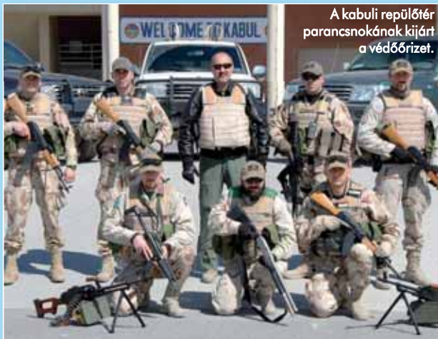
A kabuli repülőter parancsnokának kijárt a védőrizet.

– Az egész életem a repülés körül forog, vadászgéppel közel 2500 órát töltöttem a levegőben. Ezen kívül kipróbáltam jó néhány repülőeszközt: a motoros ernyőtől a helikopteren, a sár-