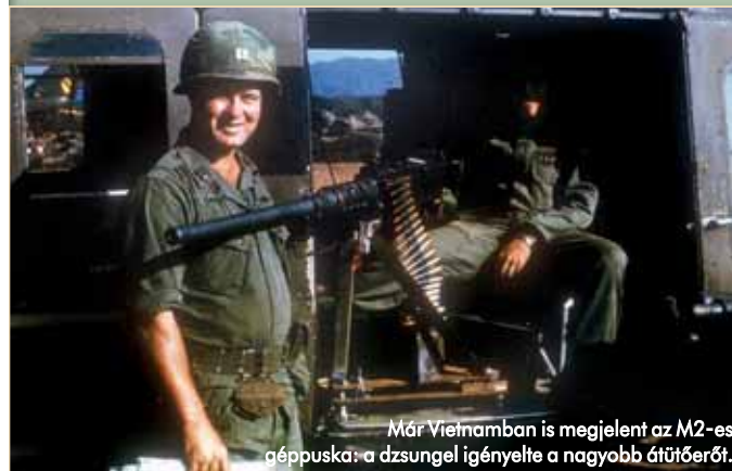
Már Vietnamban is megjelent az M2-es géppuska: a dzsungel igényelte a nagyobb átütőerőt.

A dél-afrikai légierő Franciaországtól vásárolt forgószármásainak, pontosabban az Aérospatiale AS-316B Aouette III gázturbinás, könnyű szállítóhelikoptereinek egyik változatát Matra MG 151/20 20 mm-es gépágyúval látta el. A helikopter bal oldalán, speciális konzolrendszerre elhelyezett fegyvert a fedélzeti oldallövész a „hagyó-