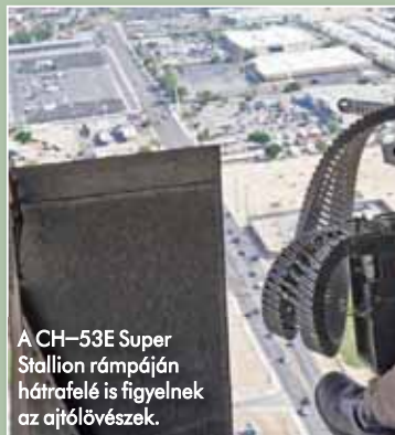
A CH-53E Super Stallion rámpáján hátrafelé is figyelnek az ajtólövészek.

sára alkalmas, ezáltal élő erő és páncéloszatlan járművek ellen igen hatásos. A fegyvert, annak is a GAU-2B/A nevet kapott, az amerikai légierő által rendszeresített változatát a mai napig alkalmazzák az UH-60 helikoptercsalád szállító és különleges feladatú változatain. A HH-60H harci kutató-mentő helikopterek Afganisztánban, az A/A49E-13 fegyverrendszer részeként használják a GAU-17/A, 2000 és 4000 lövés/perc választható tűzgyorsaságú géppuskát. E hatsövű géppuskák voltak a legendás MH-53 Pave Low nehéz különleges műveleti helikopterek legfontosabb fegyverei. Az éjszakai bevetéseken a nagy tűzgyorsaság mellett a nyomjelző lövedékek zöld lézernyalábjai fejtettek ki komoly lélektani ha-