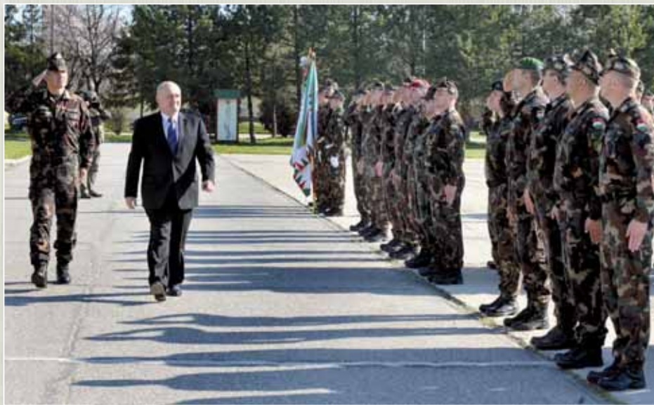
A Harcosprogramot Hende Csaba honvédelmi miniszter ünnepélyes keretek között nyitotta meg az MH 5. Bocskai István Lövészdandár hódmezővásárhelyi helyőrségének laktanyájában.