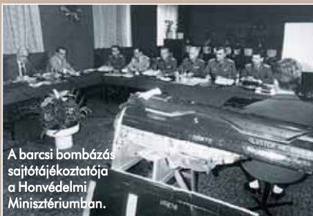
A barcsi bombázás sajtótájékoztatója a Honvédelmi Minisztériumban.

ezért aztán nagyon meglepődtek, amikor például másfél óra alatt hidat vertek a Száván. Műszaki katonáinknak persze ez nem volt nagy kunszt: a Dunán bármikor harminc perc alatt felépíthetnek egy hadihidat.