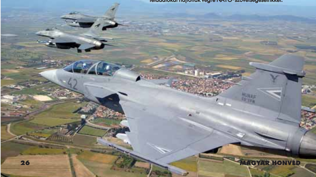
A magyar JAS–39-es század repülőgépei több hadgyakorlaton is közös feladatokat hajtottak végre NATO-szövetségeseinkkel.

Főhadnagyként Taszáron, ezredmegfigyelői beosztásban szolgáltam, amikor a MiG–21-esem hajtóműve Komló légtérben kigyulladt. A gép szerencsére egy erdős területre zuhant, engem pedig a kutató-mentők a kecskeméti honvédkórházba szállítottak. Ez egy pénteki napon történt, aztán szerdán már a Balaton partján fociztam.