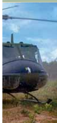
Egzőfitikum: dél-afrikai Aouette III helikopter 20 mm-es gépágyúval az ajtajában.