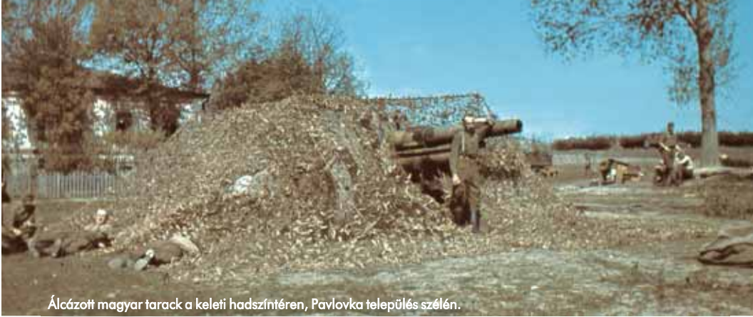
Álcázott magyar tarack a keleti hadszíntéren, Pavlovka település szélén.

kezdődött Diósgyőrben a sorozatgyártás: a nehéztarackból végül összesen 26 készült 1941–43-ban.