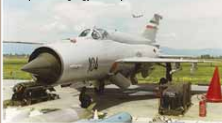
A jugoszláv MiG-21-esek fegyverarzenáljában szerepelt az angol gyártmányú kazettás bomba is.