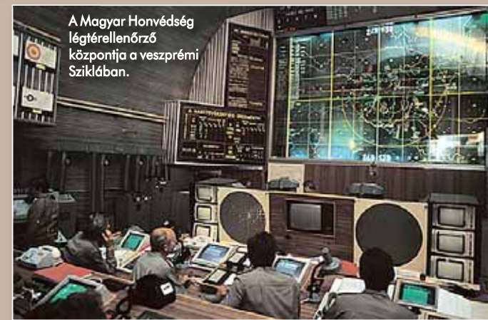
A Magyar Honvédség légtérelenőrző központja a veszprémi Sziklában.

gát is. Csak a fiatalabb korosztálynak említem meg, hogy a „bellháború” során Barcsra is hullottak bombák, a szerb légiőri gépei többször is szűk magyarországi fordulóval támadták ellenségeiket. A teljes határszakaszon aknázárt telepítettek, s mivel a határvonalat nem vonalzóval húzták meg, esetenként megmésértették szuverenitásunkat. Ugyanis rövid távon, kis időre magyar területet is igénybe vettek átkaroló műveleteikhez. Ebben a helyzetben azonnal lépni kellett. Csakhogy 1991-ben, a korábbiakban már említett okok miatt olyan alkotmányos, törvényi, jogszabályi háttér nem állt a Magyar Honvédség rendelkezésére, amely útmutatást és felhatalmazást adott volna a megteendő lépésekre. Csak később került az alkotmányba az a 19/E paragrafus, amely már meghatározta a hadsereg feladatait az