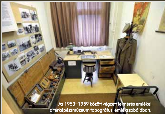
Az 1953–1959 között végzett felmérés emlékei a térképmúzeum topográfus-emlékszobájában.

1964-ben új jelkules, ezzel együtt új tartalmi előírások léptek életbe. Ez szükségessé tette a térképek megújítását, melynek alapját az 1953–1959 között végzett felmérés során készült 1:50 000 méretarányú térképek adták. A helyesbítés légi fényképek felhasználásával és helyszíni ellenőrzéssel történt, a munkálatok 1968-ig tartottak. Emellett megkezdődött a honvédségi területek és objektumok nagy