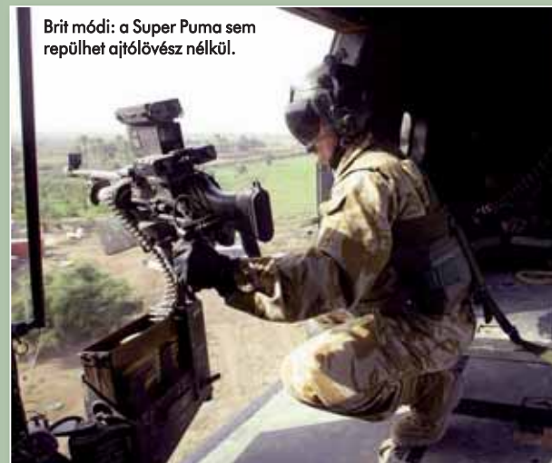
Brit módi: a Super Puma sem repülhet ajtólövész nélkül.

A számos csataterén megfordult Mi-8/Mi-17 szállítóhelikopter-típus az első, komoly háborús tűzkeresztségen Afganisztánban, 1979 és 1989 között esett át. Az ázsiai országban bevetett Mi-8-as változatokat eleinte egyetlen, a jobb oldali ajtóba elhelyezett, 7,62 mm-es PKM közepes géppuska védte. A fegyvert eredetileg a fedélzeti technikus kezelte, de