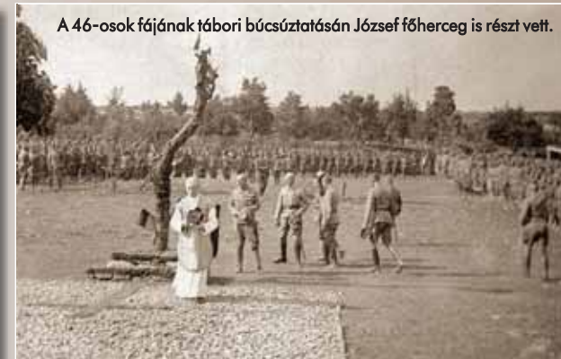
A 46-osok fájának tábori búcsúztatásán József főherceg is részt vett.