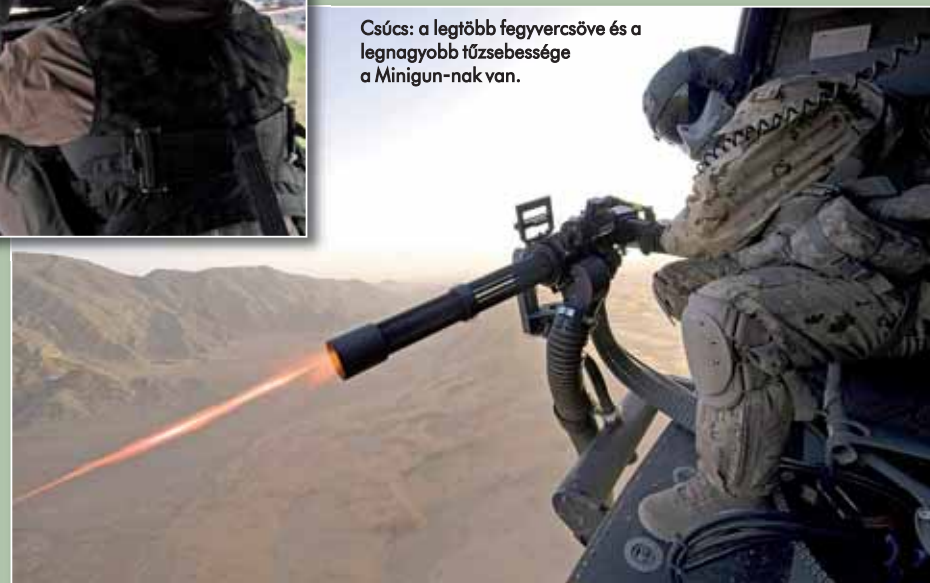
Csúcs: a legtöbb fegyvercsöve és a legnagyobb tűzsebessége a Minigun-nak van.

alakulatok műszaki szakemberei helyeztek el erősebb, nagyobb hatótávolságú fegyvert a bal oldali ajtóban, nevezetesen a 12,7 milliméteres kaliberű NSzV-12.7 nehézgéppuskát, illetve az AGSz-17 Plamja 30 milliméter automata gránátvetőt. A helikopterek a hegyvidéki területen így már nagyobb hatékonysággal és messzebről tudták felvenni a harcot a vállról indítható légvédelmi rakétákkal és nehézgéppuskákkal is felszerelt mzdzsahed harcosokkal szemben.