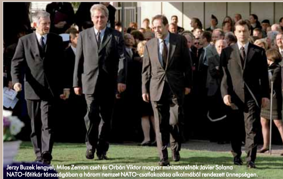
Jerzy Buzek lengyel, Milos Zeman cseh és Orbán Viktor magyar miniszterelnök Javier Solana NATO-főtitkár társaságában a három nemzet NATO-csatlakozása alkalmából rendezett ünnepségen.

tosítására csupán egy hadosztálynyi erőnk volt, mobil harcscoportokat hoztunk létre annak érdekében, hogy bárhol gyorsan bevetethetők legyenek. Ekkor és többek között ennek érdekében alakítottuk meg annak idején a 88. légimozgékonyasági zászlóaljat is. Kiválóan teljesítettek a felderítőerők is, folyamatos információkat kaptunk tőlük a szerb erők mozgásáról, harcckészültségéről és harcátékéről. A szállító- és harci helikopterek folyamatosan készen álltak egy esetleges támadás elhárítására, lokátorosaink pedig folyamatosan figyelték a szerb légteret. A lakosság számára is megnyugtató volt csapataink jelenléte, hiszen mint már említettem, több határ- és légtérsértés is történt. Minden területen nagyon sok tapasztalatra tettünk szert, amit aztán később kamatoztattunk is. 1991–1995 között például a válságkezelésben részt vevő minden szervezeten (a Belügyminisztérium, a katasztrófavédelem, a határőrség, a közgazdaság és a hadsereg) tetten a dögát, de kü-