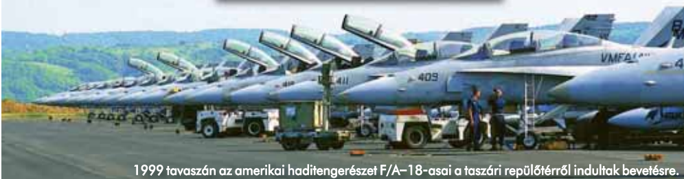
1999 tavaszán az amerikai haditengerészet F/A-18-asai a taszári repülőtérről indultak bevetésre.