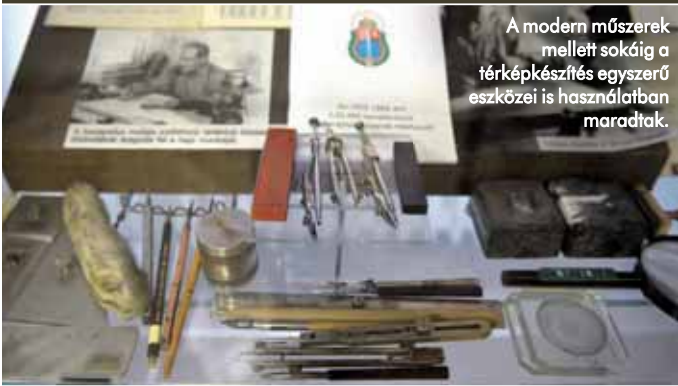
A modern műszerek mellett sokáig a térképkészítés egyszerű eszközei is használatban maradtak.

gazdálkodtak idejükkel, a rájuk bízott pénzzel, egyéb értékekkel. Dolgukat ugyanakkor számos tényező nehezítette: akkortájt még sokfelé hiányzott a villanyvilágítás, nehézkes volt a helyközi közlekedés, s ki voltak téve az időjárás viszontagságainak is. Szerény körülmények közepette végezték napi 10–14 órás munkájukat, melynek során 15–20 kilométert gyalogoltak vagy bicikliztek. A nehézségeken viszont átsegítette őket, hogy ez a fajta vándorélet megőrzött valamit az expedíciók romantikájából.