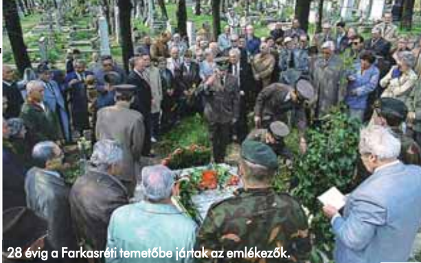
28 évig a Farkasréti temetőbe jártak az emlékezők.

Az avatás 1985. április 12-én lett volna, de közben a rendőrség tudomására