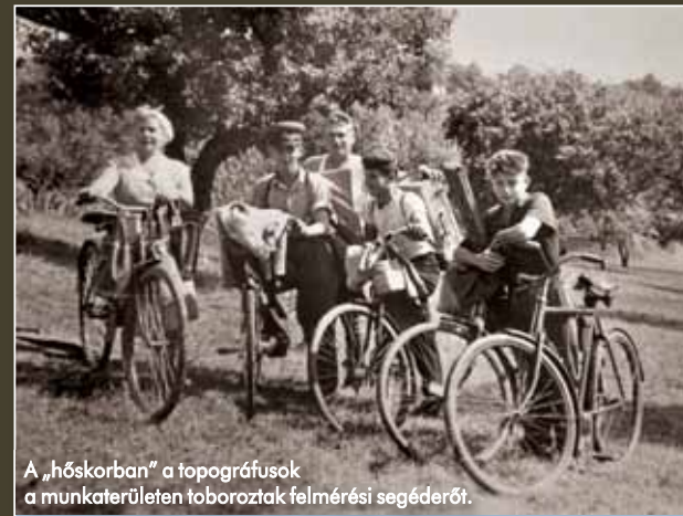
A „hőskorban” a topográfusok a munkaterületen toboroztak felmérési segéderőt.