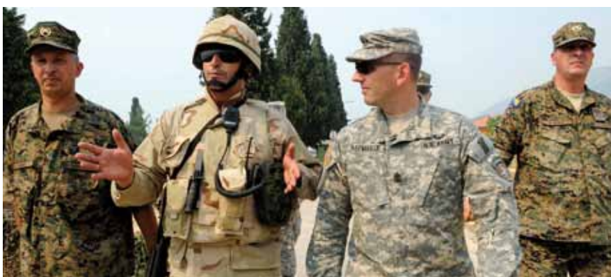
Haymaker főtörzszászlós (jobbról a második)

A Nyugat-Balkán több évtizede a nemzetközi politika és természetesen a média érdeklődésének középpontjában áll. Jelenleg NATO- és EUFOR-alárendeltségben lévő katonák teljesítenek fegyveres külszolgálatot Bosznia-Hercegovinában. A nemzetközi katonai erők központja a Szarajevó melletti Camp Butmir tábor területén található. A két katonai misszió a „Berlin plusz” egyezmény alapján jól megfér egymás mellett, sőt hatékonyan egészítik ki egymást. Írásunk a két nemzetközi szervezet rangidős altisztjeinek munkájába és napi elfoglaltságába nyújt betekintést.