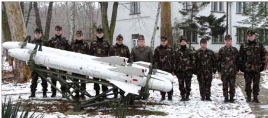
Közös fotó a látogatás emlékére

A raktárbejárást követően a számomra legfontosabb dolog következik: fórum, kötetlen eszmecsere az ott szolgáló maroknyi altiszttel. A beszélgetés hosszú, de úgy gondolom, így van értelme. Kis alegység, az ilyen katonai közössé-