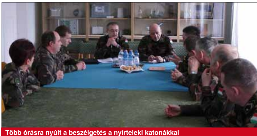
Több órára nyúlt a beszélgetés a nyírteleki katonákkal