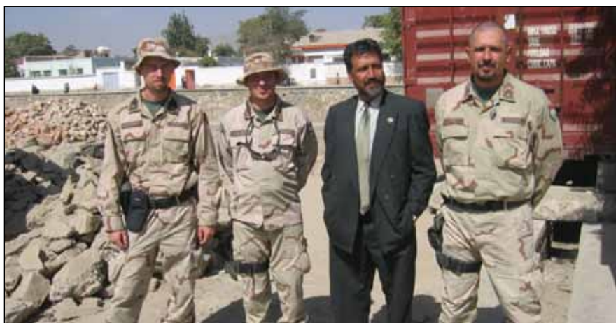
Misszióban Afganisztánban (jobbról az első)