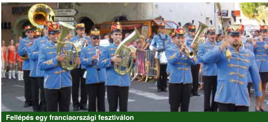
Fellépés egy franciaországi fesztiválon

– A Magyar Honvédségnek nagyszerű zenekarai vannak, kiváló szakmai tudással bírnak, a vezetők és a zenészek gyakran több diplo-