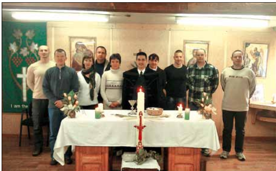
Húsvét Szarajevóban (www.taborilelkesz.hu)

Pontosan ismerte előre azt a „forogatókönyvet”, ami szerint eljártak ellene. Meg is mondta előre, hogyan fog szenvedni: megkínózzák, megölik. Tudta, hogy Júdás elárulja, Péter megtagadja, a tanítványok mind elpártolnak mellőle. Amikor felvonultak a pribékek, hogy megkötözzék, kérdezte őket: kit kerestek? Ők mondták, hogy a názáreti Jézust; elhangzott két rövid szó: Én vagyok . És azt olvassuk az evangéliumban, hogy ezek a felfegyverzett emberek hátrahőköltek és a földre estek. Később, amikor megkötözve