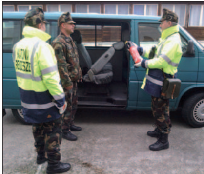
Honvédségi gépjármű ellenőrzése

A járőrrelap kiírása alapján délelőtt gépjármű-ellenőrzést hajtunk végre gyalogos járőrként a meghatározott útvonalon. A nap már erősen süt, a forgalom a városban viszonylag élénk, tempósan halad. Szemmel láthatóan rosszul pakolt honvédségi teherautó közeledik, ponyvája az egyik oldalon teljesen kidomborodik, míg a másik oldalon szinte lebeg az ürességtől. Karjelzéssel kiállítjuk a sorból. Udvarias, de határozott felszólításunkra a vezető kiszáll, lejelentkezik, majd átadja a szükséges okmányokat, amelyek mindegyike rendben van. Az autó közlekedésbiztonsági berendezései jól működnek, tartozékai rendben vannak. A rakomány „származásával” sincs gond, bár azt rosszul pakolták és rögzítették, ugyanis menet