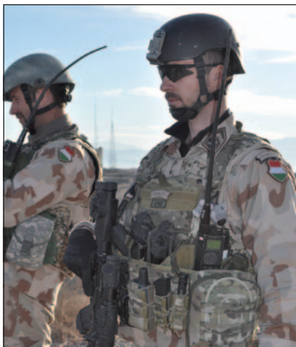
Egy új típusú fegyver, jármű vagy technikai eszköz, a megszerzett friss tudás magabiztosságot, önbizalmat biztosít

Afganisztánba érve, a feladatokat átvéve kiderül, mennyit is ér az izadtság, amivel az otthoni gyakorlótereket áztattuk. Itt már nagyon kevés lehetőség van a tét nélküli gyakorlásra. Valós, esetenként harci körülmények között kell vezetni, felelős döntéseket hozni. Ez a gyors reagálásra való képesség békekörülmények közt nagyon nehezen oktatható. Tapasztalatot, kreativitást, felelősségtudatot, „parancsnoki vénát” igénylő feladat, amelyet folyamatos döntési helyzetben, a rutin feladat-végrehajtást kerülve, példamutató pontossággal kell megoldani. A misszió végére mind a parancsnokok, mind a beosztottak kiképztségük magasabb szintjére lépnek. Ez a fejlődés jól kiaknázza-