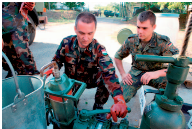
A levegő leválasztása a lefejtőponton

A résztvevők felkészültségüket a szakmai bemutatón és VIP-nap