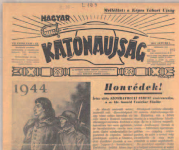
A Magyar Katonaujság 1944. január 1-jei számának címlapján vitéz Szombathelyi Ferenc vezérezredes, a m. kir. honvéd Vezérkar Főnöke írásában a honvédekhez szól.