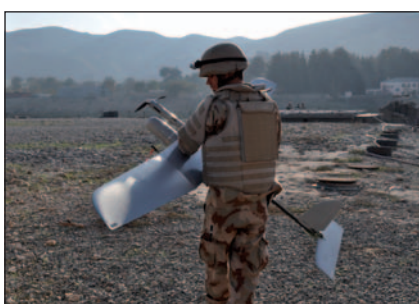
Feladat-végrehajtás valahol Afganisztánban

tó a későbbi feladat-végrehajtások során.