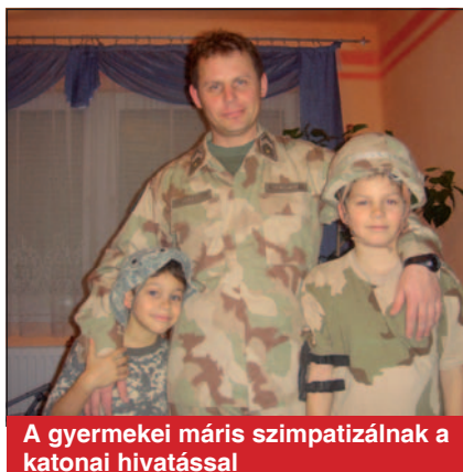
A gyermekei máris szimpatizálnak a katonai hivatással

1995-ben, részben a megalakuló IFOR-kontingensbe történő jelentkezés lehetősége miatt, részben párja unszolására ismét mundért öltött. Aktív katonai pályája Szentés helyőrségben indult szolgálatvezetőként. Fél év elteltével sikerült eredeti katonai szakképzettségének megfelelő beosztásba kerülnie, zászlóalj-technikusi helyre. A komáromi erődnél, a Bakony gyakorlótereinek műszaki munkálatai közben és az