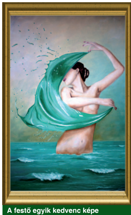
A festő egyik kedvenc képe