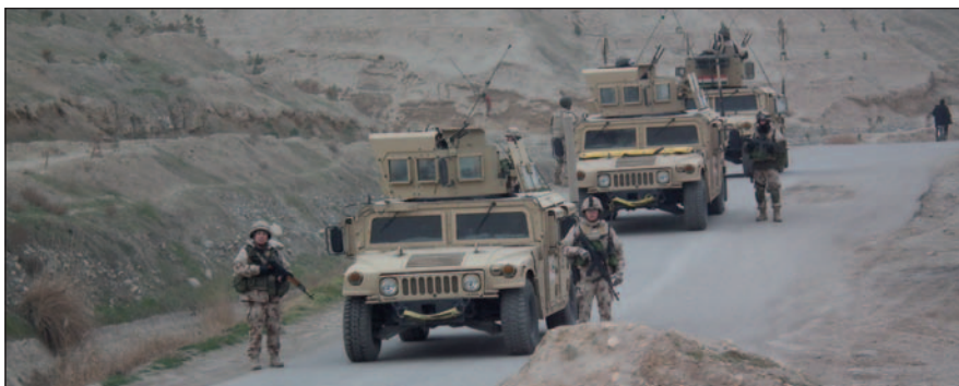
Valós, esetenként harci körülmények között kellett felelős döntéseket hozni