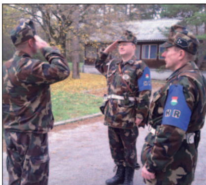
Járőr–katona típusú találkozás

Szolgálatunk további részében a gépjármű-üzemeltetés szabályainak betartását, valamint a menetokmányokat vizsgáljuk. A rutinellenőrzés során kiderül, hogy mennyire viselik gondját a járműnek, működnek-e világítóberendezései, hiánytalan-e a szerszámkészlet, a mentődoboz, érvényes-e a tűzoltó készülék. Ellenőrizzük, hogy a jármű személyzete az évszaknak megfelelő katonai ruházatot viseli-e, de a katonák alakíassága, egyéni ápoltsága vagy annak hiánya sem kerüli el a járőr figyelmét. Az utóbbi időben gyakran előfordul, hogy a feltárt problémát nem a gépjárműszemélyzet hanyagsága, hanem a technika kora vagy az adott típust sújtó alkatrészhány okozza. Gyakori hiányosság a járművek me-