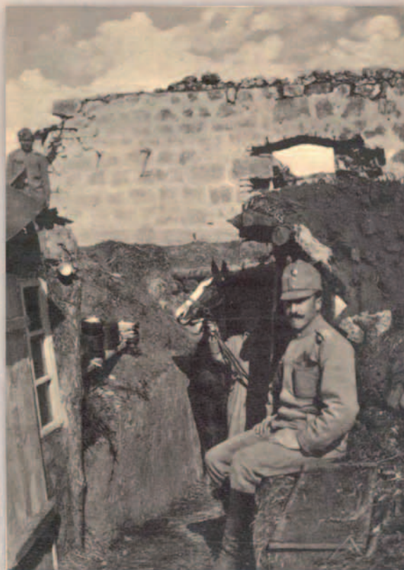
Felderítő szolgálat a hegyek csúcsán. Érdekes Újság 1916. január 9., IV. évfolyam 2. szám.