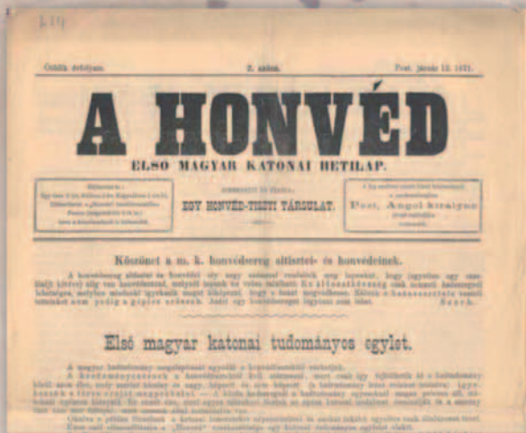
Az első magyar katonai hetilap, A Honvéd 1871. év január 12-i számának címlapján köszönetét fejezi ki a m. k. honvédsereg al-tisztjeinek és honvédeknek.