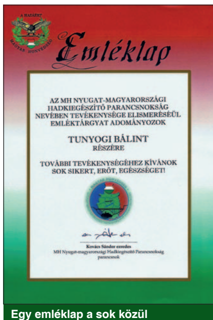
Egy emléklap a sok közül

többszöri átdolgozás után nyerte el végső formáját. Katona művészként nem meglepő, hogy van néhány katonatárgyú alkotása is; ezek is megtalálhatók virtuális galériájában ( www.btunyogi.gportal.hu ). A bonyolultabb képeknél vázlatot készít, és csak utána kezd el festeni. Természetesen ebben az esetben is több variációban gondolkodik. Van, hogy egy ültében elkészül egy alkotással, de van olyan képe is, amit egy hónapig festett, vagy két év után fejezett be. Az „Összefonódás” című festményen például egy egész hónapig dolgozott, hiszen mindig volt valami, amin finomítani kellett egy kicsit.