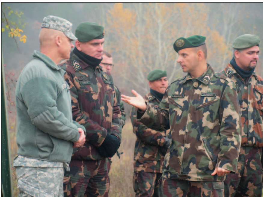
Az amerikai vendég magyar vezénylőzászlósok társaságában

– A Nemzeti Gárdába való felvétel követelményei megegyeznek az Amerikai Szárazföldi Haderőbe kerülés kritériumaival, azonos kiképzési követelményeknek és elvárásoknak kell megfelelnünk. Katonáink például a lövés alap-kiképzést Fort Benningben kapják meg, majd különböző szaktanfolyamokon, továbbképzéseken vesznek részt. Aztán visszatérnek saját alakulataikhoz és folyamatosan végrehajtják az adott kötelékre vonatkozó éves feladatot. Egy tipikus szervezet havonta egy hétvégén folytat összevont kiképzést. A civil életből a nemzeti gárdista pénteken este vagy szombaton reggel beérkezik a kiképzés helyszínére, majd két napon keresztül katonaként vég-