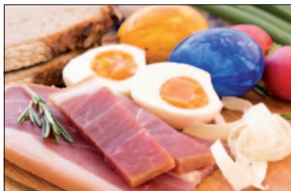
Húsvéti szín- és ízkaalkád

hozzáadjuk a cukrot és a liszt felét, majd jól összedolgozzuk a tésztát. A tálát ezek után alaposan lefóliázzuk és két órára meleg helyre tesszük. Ne feledjük, hogy a kalácstészta nem szereti a huzatot. A kelesztés után a megmosott tojások fehérjét elkülönítjük a sárgájuktól. Ügyeljünk arra, hogy külön keverjük ki a tojások sárgáját, illetve verjük fel a fehérjét, ugyanis így a kalácsunk sokkal lágyabb lesz. A megkelt tésztába beletesszük a felfert tojások habját, illetve a sárgáját, a maradék lisztet és a vaját. Ismét kelesztjük, tehát újra letakarjuk fóliával tálunkat, és hagyjuk másodszor is duplájára kelni a tésztánkat. Ezt követően a tésztába beleszórjuk a közben megáztatott mazsolát, a darált mogyorót, az apróra vágott kandírozott gyümölcsöt, a vaníliás cukrot, hozzáadunk egy csipet őrölt kardamomot és sót. Mindezeket nagyon jól összekeverjük. Belerakjuk a tésztát egy sütőformába (pl. kuglófsütő), meleg helyre állítjuk, hogy még egyszer megemelkedjen. A sütőnket 150 fokra előmelegítjük,