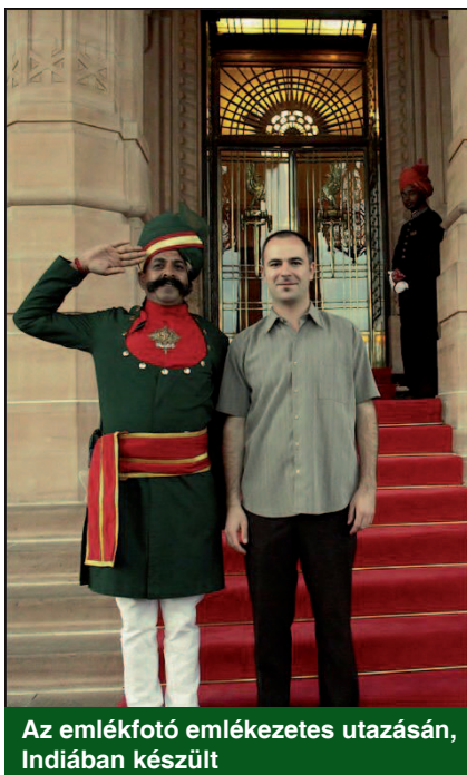
Az emlékfotó emlékezetes utazásán, Indiában készült

és külföldi utazásokkal teltek, melyek közül az indiai út volt nagy hatással rá. Egy igazán különleges világba csöppent. Több festőművésszel együtt Jodhpurban vettek részt alkotói táborban, melynek végén a maharadzsza is fogadta a ma-