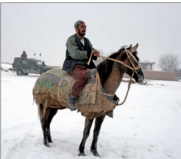
Afgán férfi lóháton az MH PRT-3 szolgálata idején