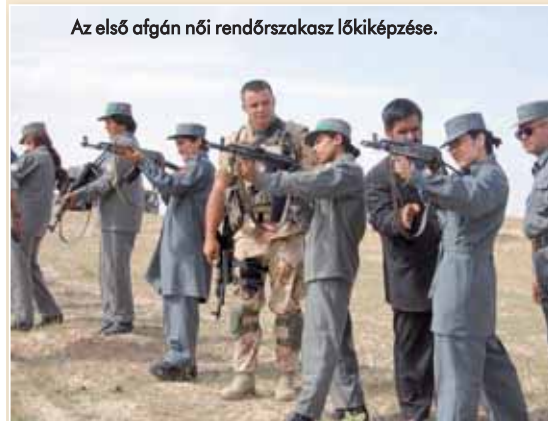
Az első afgán női rendőrszakasz lökiképzése.

S ha már a biztonság kérdésénél tartunk: a PRT-2-nek szerencséje volt ezen a területen is. Mandátumuk idején megnyugodtak a kedélyek a tartományban, s a PRT-1 ellen intézett kilenc támadással szemben ők „csak” egyet kaptak. De később erről a támadásról is kiderült, hogy vis maior volt, a támadók valójában összetévesztették az egyenruhákat. Persze a kontingens biztonsága nem csak ezen múlott. A katonai biztonsági és felderítő-, valamint tüzserész-szakemberek tevékenységével, illetve a szisztematikus közelbiztosító és nagyobb te-