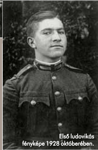
Első ludovikás fényképe 1928 októberében.