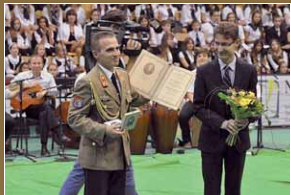
A város zenei életében kifejtett kiemelkedő munkásságáért 2011-ben a Székesfehérvári Helyőrségi Zenekar nyerte el a helyi önkormányzat által alapított Fricsay Richárd Zenei Díjat.

A zenészek ugyanis „papíron” fél nyolcra érkeznek be a laktanyába, majd