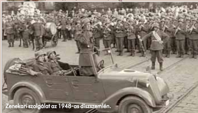
Zenekari szolgálat az 1948-as díszszemlén.

világháborút követően amúgy is megszűnt közös intézmény, miként megszűntek a közös alakulatok, köztük a 32-es gyalogezred is. A Tanácsköztársaság kikiáltásakor pedig – olvashatjuk vitéz tinódi Varga Sándor nyugállományú tábornok 1930-ban kiadott, a cs. és kir. 32. budapesti házi gyalogezredről írt könyvében – „szétfolyott és így a sírba dőlt fegyveres hatalmunknak egyik olyan egysége, amelynek több mint 17 évtizeden át az a magas hivatása volt, hogy a haza biz-