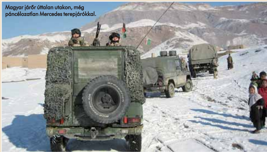
Magyar járőr útalan utakon, még páncéltalan Mercedes terepjárókkal.

gadva, mindent át kellett alakítani a felállítandó MH PRT igényeinek megfelelően. Az „alapanyag”, a könnyűgyalogszázad zömét biztosító szolnoki könnyű vegyes zászlóalj katonái rendelkezésre álltak – igaz, egészen más feladatra felkészítve. Ugyanakkor ebben az időben még kevesen tudták, hogy mi is valójában a PRT, milyen feladatai lesznek, s azok ellátásához milyen szervezeti elemeket kell felállítani stb. Miután egy előkészítő csoport Afganisztánból vizsdatérve elkészítette a jelentését, kiderült: a Magyar Honvédség (a Magyar Köztársaság) sem anyagilag, sem más téren nincs felkészülve arra, hogy önmaga állítson fel és működtessen egy PRT-t. A járható útnak az tűnt, hogy egy már működő, bevezetett PRT-t vegyünk át, folytatva a megkezdett tevékenységüket. Az akkori politikai, biztonsági helyzetnek megfelelően (az ISAF vezetésével egyeztetve) a választás a Hollandia által, a Baghlán tartománybeli Pol-e Khomriban működtetett PRT-re esett. A holland erőkre másutt volt szükség, így a Magyar Honvédség ezt a missziót vette át, az