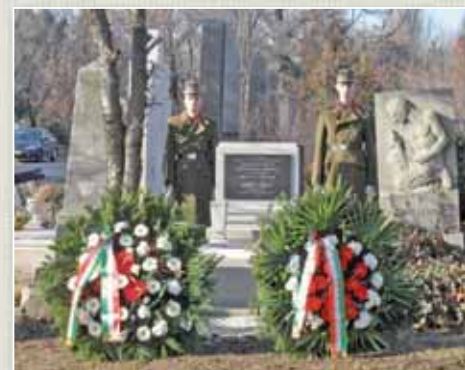
Kratochvil Károly altábornagy síremlékét a tábornok halálának 65. évfordulójára újították fel.

fővárosban is több tényező hátráltatja: az iratok például ninccsenek elektronikusan feldolgozva, a német ábécé szerint vannak rendszerezve, ráadásul nem egy okmányt gót betűkkel írtak. Az osztályvezető-helyettes megjegyezte: eddig mintegy 60 000 hősi halottat sikerült azonosítani, a végső cél pedig az, hogy az első világháború századik évfordulójára, tehát valamikor 2014 és 2018 között elkészüljön a szinte hiánytalan adatbázis. Ez aztán – a Hadtörténeti Múzeum honlapja mellett – a közel egyéves előkészítő munka eredményeként, 2011. december 8-án újjá indult hadisír.hu című portálon is megjelenjen.