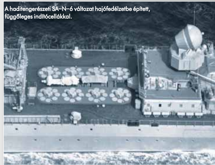
A haditengerészeti SA-N-6 változat hajófedélzetbe épített, függőleges indítócellákkal.

A rendszer „agya” a 8x8-as kerékkel, kiváló terepjáró tulajdonságokkal rendelkező Ural-532301-es te-