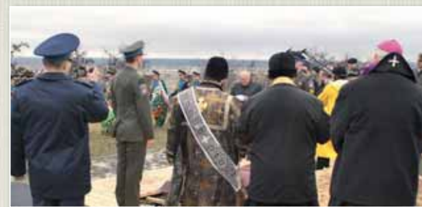
Idén áprilisban, a rudkinói II. Magyar Központi Katonai Temetőben öt magyar honvéd földi maradványait helyezték végső nyugalomra.

A hadisírok védelméről az 1949-es genfi egyezmény, illetve az azt kiegészítő – 1977-ben aláírt – jegyzőkönyv rendelkezik, emellett hazánk kétoldalú szerződéseket is kötött, amelyek részletesen meghatározzák az érintett felek feladatait, jogait, kötelezettségeit. Magyarország eddig hét állammal írt alá együttműködési megállapodást: elsőként – még 1995-ben – Németországgal, később pedig Oroszországgal, Ukrajnával,