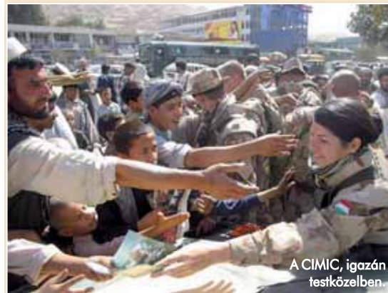
A CIMIC, igazán testközelben.