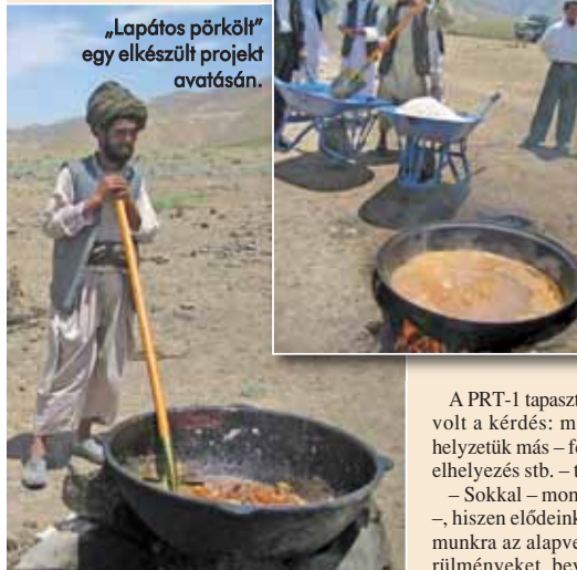
„Lapátos pörkölt” egy elkészült projekt avatásán.

A minden PRT által folytatott felújítások,