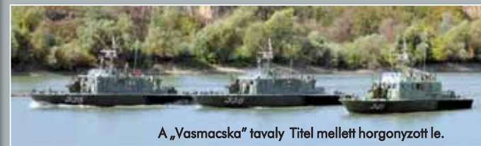
A „Vasmacska” tavaly Títel mellett horgonyzott le.