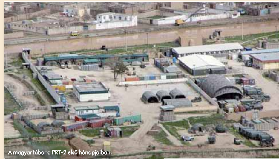
A magyar tábor a PRT-2 első hónapjaiban.

Az MH PRT-2 esetében ez azt jelentette, hogy a félmilliárd forintból 75 milliót használt fel a honvédelmi tárca, 25 milliót az egészségügyi tárca, 160 milliót pedig az igazságügyi és rendészeti tárca. A fennmaradó összeg hatékony felhasználásáról pedig a térségben már évek óta ténykedő ökümenikus, valamint a