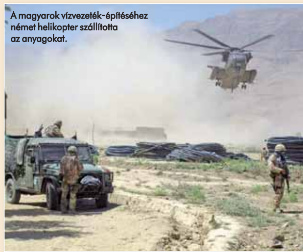
A magyarok vízvezeték-építéséhez német helikopter szállította az anyagokat.

Mindezen ismereteket Szabó ezredes is a műveleti területen sajátította el. No, meg ahogy mondja, az akkor már jól működő CIMIC háttéranyagaiból, valamint a PRT-k számára összeállított, hadszíntérismeretet, vallási, kulturális és egyéb szokásokat bemutató kézikönyvből.