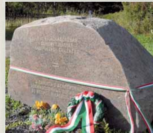
A gránitból emelt hadifogly-émlékművekre egységes felirat került.

egységes feliratokat, e mellé pedig egy, a földbe több méter mélyen süllyesztett betonalapra nyugvó, fémből készült kettős keresztet emeltek. Az emlékműveket oda telepítették, ahol egykor a hadifoglyotábor temetője állt. A helyiek nem háborgatják ezeket, épp ellenkezőleg: gondozzák, virágot, ko-