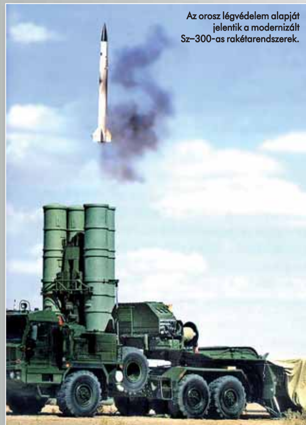
Az orosz légvédelem alapját jelentik a modernizált Sz-300-as rakétarendszerek.

herautóra épített 30K6E tűzvezető és irányítóközpont. A célok felderítését a 91N6E típusú, zavarvédett, háromdimenziós felderítő és célkövető radarral végzi, melyet már a jellegze-