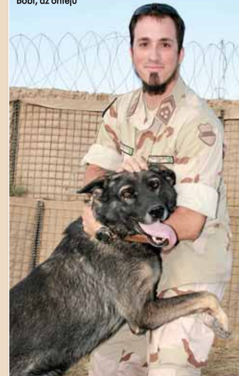
Bobi, az önféjű

Bobi, az ötféjű németjuhász és gazdija összeszokott „műveleti” páros. „Ő is veterán, már a második misszióját szolgálja. Munka-maximalista, sokszor előfordul, hogy kétszer is leellenőriz egy-egy autót. Az élete a pörgés. Nincs megállás, lelkesen rohan a kapu felé, hogy dolgozzon. A természetén és kutyaajelenzőin sokat kellett csiszolni, két év telt el, mire teljesen összeszoktunk. Ezért a nevében is mondhatom: ha egy újabb misszió lehetősége felmerülne, szívesen elvállalnánk.”