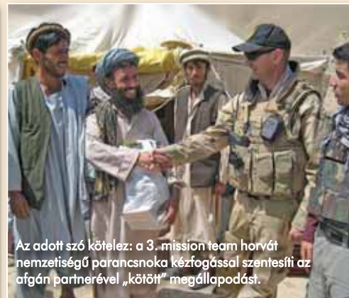
Az adott szó kötelez: a 3. mission team horvát nemzetiségű parancsnoka kézfogással szentesíti az afgán partnerével „kötött” megállapodást.

repszakaszokra kiterjesztett járórozéssal, a jelenlétet demonstráló (az afgán biztonsági erőkkel közösen üzemeltetett) ellenőrző-átértesítő pontok működésével tudatták a potenciális támadókkal: „itt vagyunk, figyelünk – meg se próbáld!” Többek között ennek is köszönhető, hogy mission team-jeik biztonságosan eljuthattak a tartomány legeludogottabb járásaiba, falvaiba is, így betölthették hivatásukat, a lakosság segítségét.