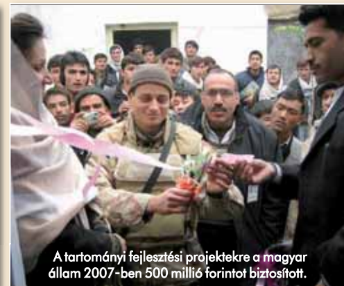
A tartományi fejlesztési projektekre a magyar állam 2007-ben 500 millió forintot biztosított.

Megérkezve állomáshelyükre, elkezdődött az átadás-átvétel roppant szerteágazó és nehéz feladata. (A táborban ugyanis „dupla kontingens” volt, a dokumentumok, harcparancsok nagy részét a hollandok nem fordították le angolra, valamint naponta távoztak és érkeztek a különböző konvojok.) A holland PRT – mindamellett, hogy feladatainak, megkezdett projektjeinek és technikai eszközeinek egy részét hátrahagyta – a feladat ellátásához szükséges anyagi fedezetet is átadta a magyar félnek, így a munkában nem volt „törés”. A helyi állami és társadalmi szervek, valamint a lakosság csak annyit érzékelt a folyamatból, hogy a német vezetésű RC North által ellenőrzött területen a külföldi katonai járművek más felségjelzessel közlekednek. A tábor átadás-átvételi ceremóniáján jelen volt a holland és a magyar honvédelmi miniszter is.