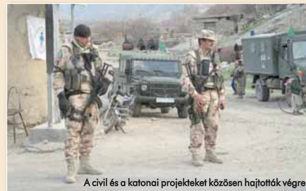
A civil és a katonai projekteket közösen hajtották végre.

– Lényegében csak a felkészülés zárogyakorlatán találkoztam először a leendő kontingensemmel, de jól felkészült parancsnoktársaimnak, helyetteseimnek