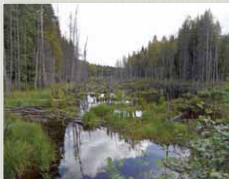
Karéliában mintha egy mitológiai tájon járnánk, ahol a mocsár és a mocsaras erdő váltogatja egymást.

Moldáviával, Olaszországgal, Szlovéniával és Romániával is. Az összképhez mindazonáltal hozzátartozik, hogy jelenlegi ismereteink szerint több tucat országban vannak magyar hadisírok.