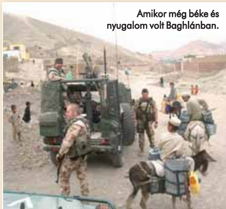
Amikor még béke és nyugalom volt Baghlánban.

baptista szeretetszolgálat, illetve a Földművelésügyi és Vidékfejlesztési Minisztérium munkatársai gondoskodtak. Ehhez jött még hozzá a honvédelmi tárca 125 milliós CIMIC-költségvetése, amely elégséges fedezetet nyújtott a misszió jelenlét-elfogadást segítő saját projektjeire.