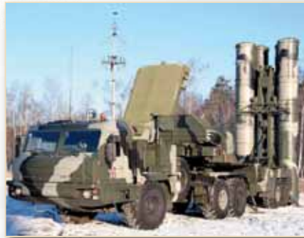
Az Sz–300PMU–2 rendszer 5P85SE indítójárműve, 9M96E2 rakétákkal.

Egyszerű, közepes hatótávolságú légvédelmi rakétarendszerek indult, de hasonlóan örök amerikai vetélytársához, ma már akár ballisztikus rakéták ellen is képes felvenni a harcot. Gumikerekes, lánctalpas hordozójárműveken vagy cirkálók, csatacirkálók fedélzetén egyaránt otthon érzi magát. Folyamatos fejlesztésének köszönhetően mára már Moszkvától a Távol-Keletig az orosz légvédelem gerincét adják az Sz–300-as és a továbbfejlesztett Sz–400-as légvédelmi rakétakomplexumok.