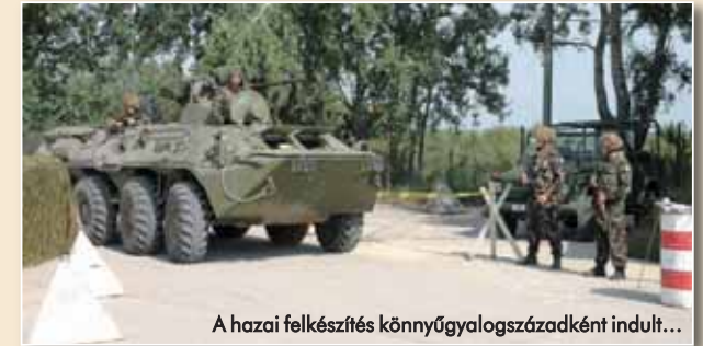
A hazai felkészítés könnyűgyalogszázadként indult...

kanadai táborban volt. A könnyűgyalogszázad feladata a fővárosban többek között járőrözés, VIP-kísérés, objektumörzés, ellenőrző-áteresztő és megfigyelő pontok működtetése volt. A három váltást is megélt könnyűgyalogszázad kiváló teljesítményének elismeréseként, 2006-ban a szövetségesek újabb szerepvállalásként arra kérték Magyarországot, hogy immár vezető nemzetként vegyünk át egy tartományi újjáépítési csoportot. Ehhez a jogi kereteket a 2115/2006 (VI. 29.) kormányhatározat biztosította. A tartományi újjáépítési csoport (PRT) nem kizárólag a