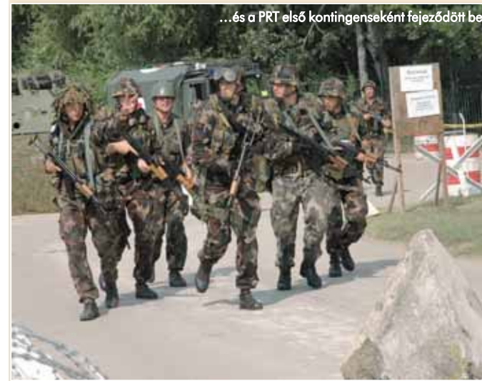
...és a PRT első kontingenseként fejeződött be.