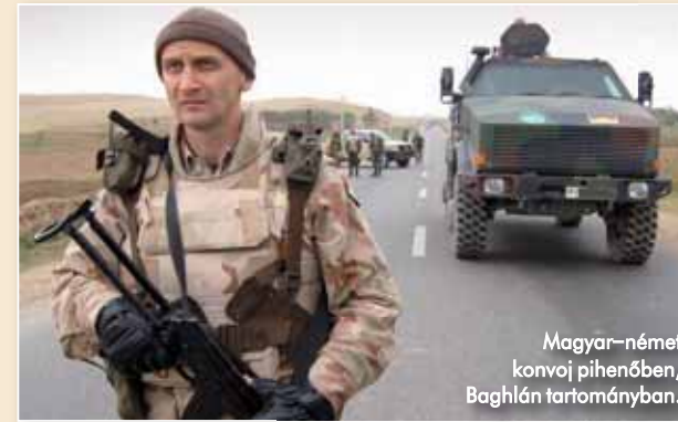
Magyar–német konvoj pihenőben, Baghlán tartományban.

2004 újabb mérföldkő: szövetségi felkérésre ugyanis augusztus elsején megkezdte szolgálatát Kabulban az MH 130 fős könnyűgyalogszáda is. A század a norvég zászlóalj-parancsnokság alárendeltségében ténykedett, állomás helye pedig a Kabul közeli Camp Julien