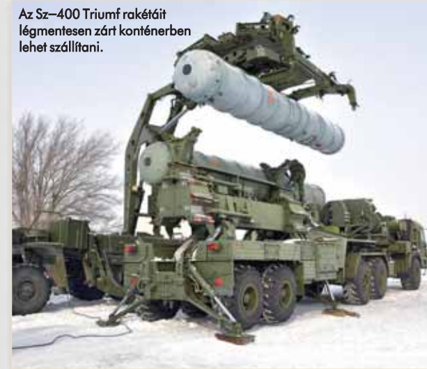
Az Sz–400 Triumf rakétáit légmentesen zárt konténerben lehet szállítani.

telepíthető rendszer lebeghetett, hiszen az imént említett két „proxyháború” (a szemben álló felek közvetlen konfrontáció helyett, harmadik szereplőkön keresztül megvívott háborúja) bebizonyította: az állandó helyre telepített és épített légvédelmi rakétaállások nem számíthatnak hosszú élettartamra. Így már az eredeti, 1978-ban hadrendbe állt Sz–300P (NATO-kódja: SA–10 Grumble) is gumikerekes járművekre építve készült el.