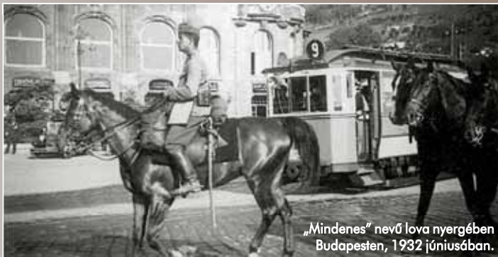
„Mindenes” nevű lova nyergében Budapesten, 1932 júniusában.

Sírjára és vaskoporsóba zárt holttestére 2012. július 11-én bukkantak a hadisírkutatók. A Magyar Tiszti Arany Vitézségi Éremmel is kitüntetett osztályparancsnok földi maradványai hazatértek, hogy november elején katonai tiszteletadás mellett hazai földben találjanak végső nyughelyet. Életútja – melytől néhány fotó segítségével villantunk fel – példa lehet az elkövetkező katonanemzedékek számára.