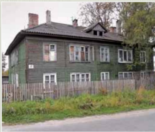
A hadifoglyok által épített kétszintes faházak Karélia-szerte megtalálhatók.

Ugyanígy jár el Magyarország is, amely az elmúlt években két központi temetőt létesített külföldön. Aligha meglepő, hogy erre a második világháborús magyar honvédség legvé-