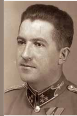
A Ludovika tanáráként a Kárpátokban.