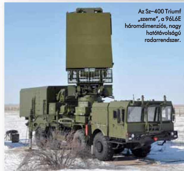
Az Sz-400 Triumf „szeme”, a 96L6E háromdimenziós, nagy hatótávolságú radarrendszer.

tes, bulldogfülkés kialakítású, szintén 8x8-as MZKT-7930 hordoz. A célok megsemmisítését a 92N2E célkövető radarral irányított, 5P85TE2 hordozó-indítójárművekről elinduló 48N6E, 48N6E2, 48N6E3, 48N6DM, 9M96E, 9M96E2 és 40N6E rakéták végzik. A légvédelmi rakétákat gondozásmentes, zárt „tubusokban” tárolják s onnan is indítják. Ez különösen az orosz távolkeleti területek miatt fontos, melyekre a szélsőségesen hideg és meleg időjárás egyaránt jellemző. Az Sz-400-as rendszerek elsőként természetesen Moszkva, valamint Közép-Oroszország városai, fontosabb területei mellett tűntek fel, de már folyamatban van a Kínával határos, a múltban több, kisebb-nagyobb fegyveres konfliktust is látott, ritkán lakott területek lefedése is. Mivel a rendszer által használt 40N6 légvédelmi rakétának is „csak” 400 kilométer a maximális hatótávolsága, az orosz-kínai határvidék teljes lefedésére még sokáig kell várni. Az Sz-400-as rendszer – éppen képességei miatt – egyelőre nem exportálható más országokba, bár a kínai-orosz közös fejlesztésű HQ-19-es légvédelmi rakétarendszer alapja éppen az Sz-400, s mindemellett több fénykép is felbukkant a Kínának szállított SZ-400-asokról.