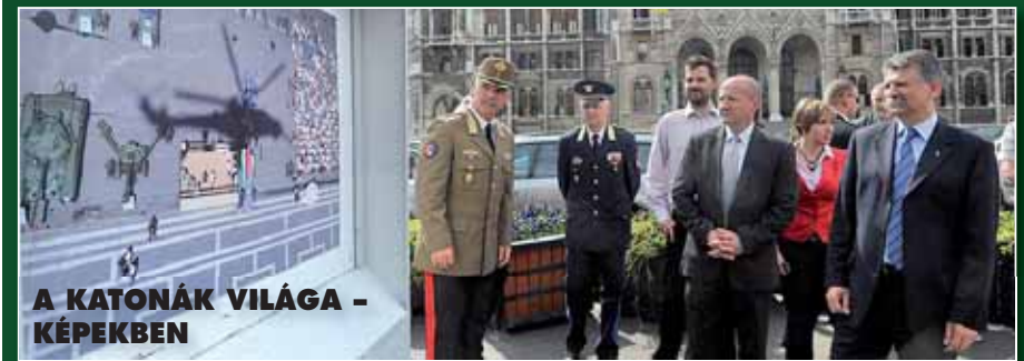
A KATONÁK VILÁGA - KÉPEKBEN

Mint 1996 óta minden évben, az idén is kettős rendezvénysorozat helyszíne volt Székesfehérvár. Május 17-én, a „Fehérvári katonái” nevű program keretében az érdeklődők statikus és dinamikus bemutatókon ismerkedhettek meg a katonák mindennapi tevékenységével. Ezt követte a „Fehérvári kőszönti katonáit” elnevezésű gálaest, a Vörösmarty Színházban.