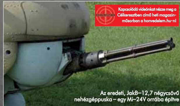
Az eredeti, JakB–12,7 négycsövű nehézgéppuska – egy Mi–24V orrába építve

Az 1975-ben megkezdett áttervezésnek köszönhetően a Mi–24P fedélzetére a GS–30-2 átalakított változatát, a GS–30K-t építették be. Az új változat vízthűtéses csövének hosszúságát 2044-ről 2400 milliméterre növelték; a csőtör-