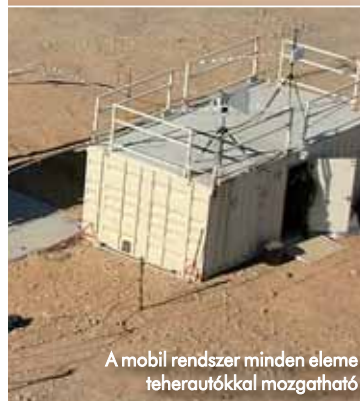
A mobil rendszer minden eleme teherautókkal mozgatható

A maximálisan 70 kilométer hatótávolságú, járművekre épített, könnyen áthelyezhető és telepíthető mobil rendszer