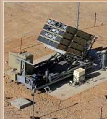
A mobil rendszer minden eleme teherautókkal mozgatható

Izrael a biztonsága érdekében jelentős erőfeszítéseket kívánt tenni, ám a 2000-es évek elején létező, a rakétatámadások elleni védelmet szolgáló rendszereket nem e közel-keleti ország méretére és