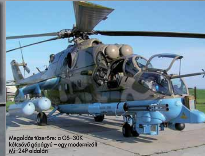
Megoldás tűzerőre: a GS–30K kétszövű géppágyú – egy modernizált Mi–24P oldalán

Az MH 86. Szolnok Helikopterbázis Afganisztánba készülő állománya levegő-föld éleslövészettel egybekötött négynapos zárógyakorlaton vett részt a Veszprém melletti Újmagorban. A gyakorlatot megtekintette Hende Csaba honvédelmi miniszter, aki a Mi–17 szállítóhelikopter ajtó-géppuskásának helyén, majd a Mi–24P operátorának ülésében repülve szerzett tapasztalatokat a katonai forgószármás-repülésről, a hajózók feladatairól.