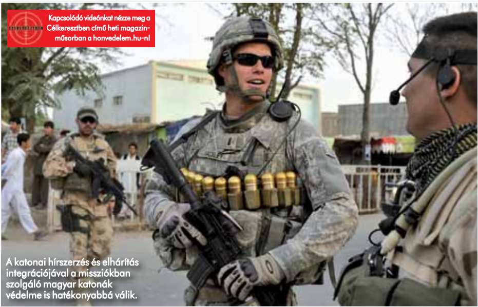
A katonai hírszerzés és elhárítás integrációjával a missziókban szolgáló magyar katonák védelme is hatékonyabbá válik.

Kapcsolódó videókat nézze meg a Célkeresztben című heti magazin-műsorban a honvedelem.hu-n!