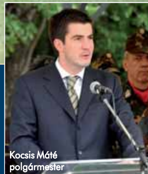
Kocsis Máté polgármester

a fesztivált még sok-sok éven keresztül megtartják majd ugyanitt, egyre több érdeklődő jelenlétében. Kocsis Máté, a rendezvénynek helyt adó VIII. kerület polgármestere, az Országgyűlés honvédelmi és rendészeti bizottságának elnöke pedig a száznapos ünnepség hagyományairól szólt, emlékeztetve a megjelenteket, hogy a tervek szerint az év végén megkezdődhet a Ludovika épületének felújítása, amely a Nemzeti Közszolgálati Egyetem egyik objektumaként működik a jövőben.