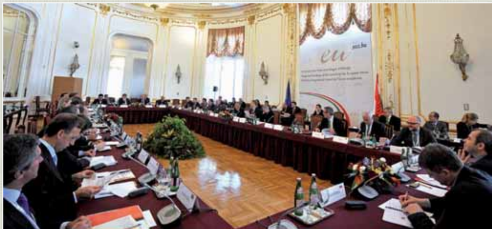
Az Európai Unió Tanácsa magyar elnökségi rendezvényeinek egyike a védelempolitikai igazgatók tanácskozása volt.

zeti katonai stratégia – kidolgozása, illetve a kidolgozó folyamat koordinálása. Munkája során a VPF a védelempolitikai különböző területeit érintő feljegyzéseket, háttéranyagokat, tárgyalási témavázlatokat, felszólalási javaslatokat és előadásokat készít a honvédelmi tárca vezetői részére. Feladatai szakszerű elvégzéséhez szükséges a világ védelempolitikai szempontból fontos térségeinek biztonsági helyzetével kapcsolatos események követése és a védelempolitikai szempontú elemző munka is.