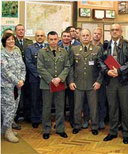
A HM Nemzetközi Együttműködési Főosztálya szervez csapatlátogatásokat a Budapesten akkreditált véderő-, katonai és légiügyi attasék számára. Felvételeink az MH Geoinformációs Szolgálatnál és Szentesen készültek.

A Budapesten akkreditált külföldi attasék folyamatos tájékoztatást kapnak a tárca átszervezéséről és a haderő-átalakítás során meghozott döntésekről. Az attasék az éves attasé-foglalkoztatási terv alapján szervezett programjaikon megismerkedhetnek hazánk gazdag történelmi és kulturális értékeivel, hagyományaival.