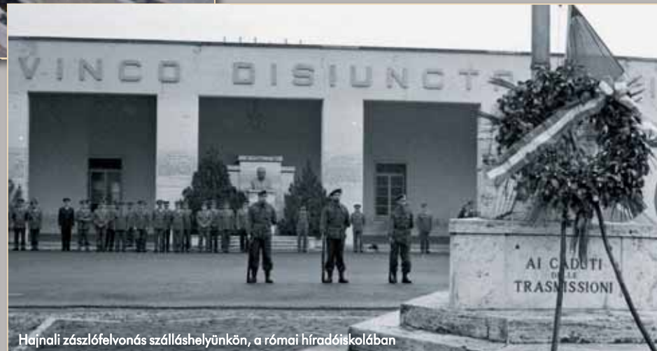
Hajnali zászlófelvonás szálláshelyünkön, a római híradóiskolában