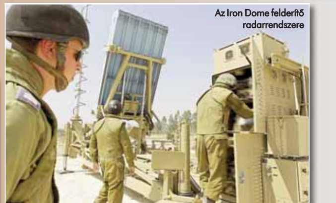
Az Iron Dome felderítő radarrendszere

kai vezérlésű, nagy manőverezőképességű rakétákat csak az olyan ellenséges eszközök ellen indítják el az egyébként utánfutóként kialakított indítókonténerből, amelyek lakott területet, fontos objektumot vagy védendő területet veszélyeztetnek. Felesleges és pazarló lenne ugyanis a beépítetlen területekre, szántóföldekre, sivatagba csapódó rakéták ellen drága, egyes becslések szerint 50 000 dollárt érő ellenrakétát indítani.