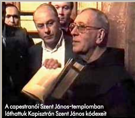
A capestranói Szent János-templomban láthatjuk Kapisztrán Szent János kódexeit