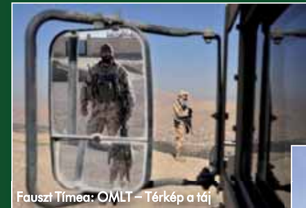
Fauszt Tímea: OMLT – Térkép a táj

Május 21-én, a Kossuth téren az Országgyűlés elnöke nyitotta meg azt a kiállítást, amelyet a Honvédelmi Minisztérium és az Indafotó közös fotópályázatának legjobb pályamunkáiból állítottak össze. A nyertesek dr. Kövér László házelnöktől, illetve dr. Simicskó Istvántól, a HM parlamenti államtitkártól vették át az okleveleket és az értékes díjakat.