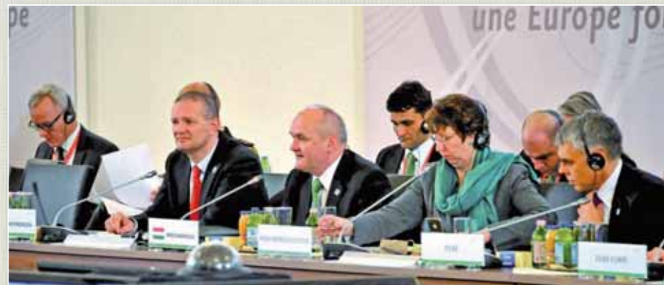
Az Európai Unió Tanácsa magyar elnökségi rendezvényeinek sorában tartották meg Gödöllőn a tagállamok védelmi minisztereinek informális találkozóját. A felvételt a sajtótájékoztatón készült.

A VTF elemzi és értékeli a hazai képességfejlesztési terveink, a haderő-hozzájárulási vállalásaink megvalósulásának helyzetét, az azokra vonatkozó szövetségi és európai uniós értékeléseket és javaslatokat, amelyekről tájékoztatást biztosít a tárca felső vezetése, szükség esetén a kormány számára.