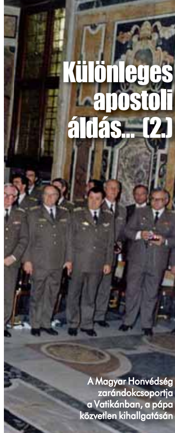
A Magyar Honvédség zarándokcsoportja a Vatikánban, a pápa közvetlen kihallgatásán

M. Tóth György ❖ Fotó: Vatikáni Képszolgálat és archív