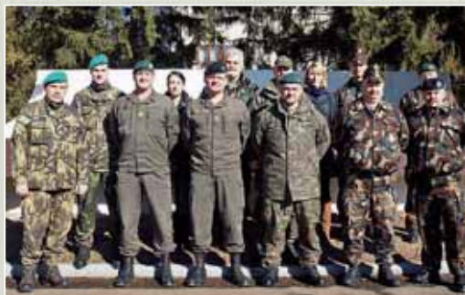
A HM Védelmi Tervezési Főosztálya az MH Altiszti Akadémián szervezett egyeztető megbeszélést a C-IED-kiképzők közép-európai szakértőinek.

A Védelmi Tervezési Főosztály (VTF) rendeltetése a tárca védelmi tervező rendszerének (TVTR) irányítása, a TVTR részét képező stratégiai iránymutatási alrendszer működtetése, a tervezési folyamatok összehangolása a NATO védelmi tervezési és az EU képességfejlesztési folyamataival. Kidolgozza a Magyar Honvédség képességeinek fejlesztésére vonatkozó politikai irányelveket, majd elfogadásukat követően felügyeli azok megvalósulását. A TVTR rendszerében kiemelt feladata a tárca 10 éves, hosszú távú, valamint rövid távú tervei kidolgozásának koordinálása, azok összeállítása. Ennek során a védelmi tervezésben részt vevő tervező szervek, szervezetek tervezési tevékenységét szakmailag koordinálja.