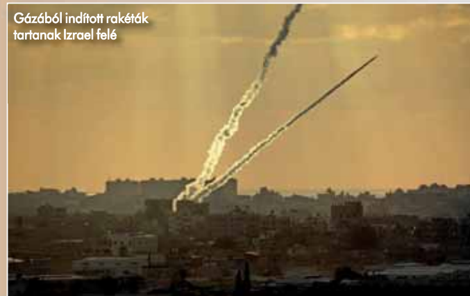
Gázából indított rakéták tartanak Izrael felé

három fő elemből áll. A felderítéshez és a célpontok beméréséhez az izraeli Elta Systems radarrendszerét alkalmazzák. Az ellenséges rakéták és tüzérségi lövedékek röppályájának elemzése, a várható becsapódási pont kiszámítása a Rafael, valamint a szoftvereket fejlesztő mPrest Systems által közösen kialakított vezetési és fegyverkezelő ponton történik. A számítógépek, monitorok és kezelők légkondicionált konténerben dolgozzák fel a beérkező adatokat. A Tamir elektroopti-