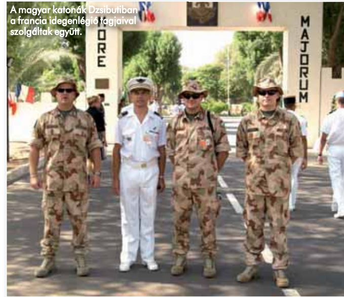
A magyar katonák Dzsibutiban a francia idegenlégió tagjaival szolgáltak együtt.

csolatainkat a Terrorelhárítási Központtal, a Nemzeti Adó- és Vámhivatallal, a Bevándorlási és Állampolgársági Hivatallal, valamint az Országos Rendőr-főkapitánysággal is.