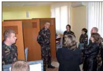
Az iroda munkatársai a családtagokat tájékoztatják

A dandár kötelékében szolgálatot teljesítők az alább felsorolt ügyekben fordulnak irodánkhoz: szolgálati viszonyral összefüggő igazolások; tájékoztatás adózási, banki ügyekben; lakhatási ügyek; felvilágosítás és ügyintézés segéllyel, illetményelőleggel, nyugdíj- és egészségpénztári ügyekkel kapcsolatban; segítségkérés magasabb iskolai végzettség, illetve civil életben is hasznosítható képzettség megszerzéséhez; életvezetési problémák megoldása; segítségnyújtás a civil életbe történő visszailleszkedéshez; tanácsadás, il-