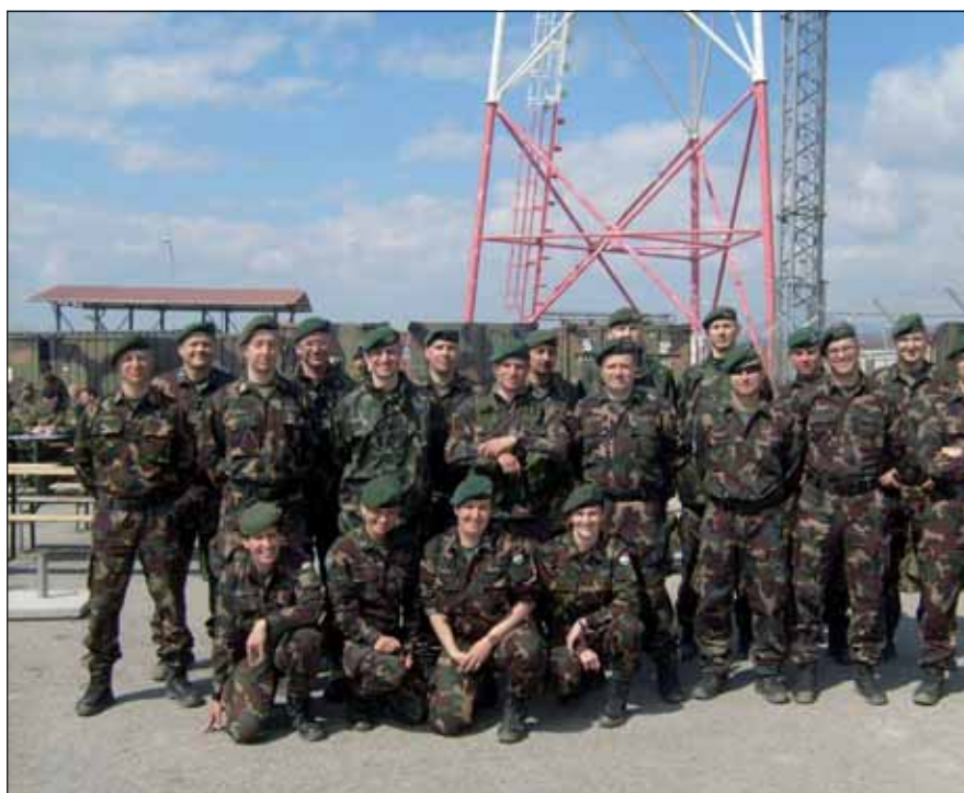
Csoportkép a magyar kontingens tagjairól

Huszonöt magyar katona vágott neki Koszovóban a dán kontingens után csak DANCON MARCH-nak nevezett teljesítménytúrának március 31-én. A mára negyvenéves múlttal rendelkező túrát először a Cipruson állomásozó Dán Királyi Hadsereg békefenntartó katonái rendezték meg 1972-ben. A menetet azóta minden olyan hadszíntéren megtartják, ahol dán katonák teljesítenek szolgálatot. Koszovóban ez a hagyomány 1999-ig nyúlik vissza.