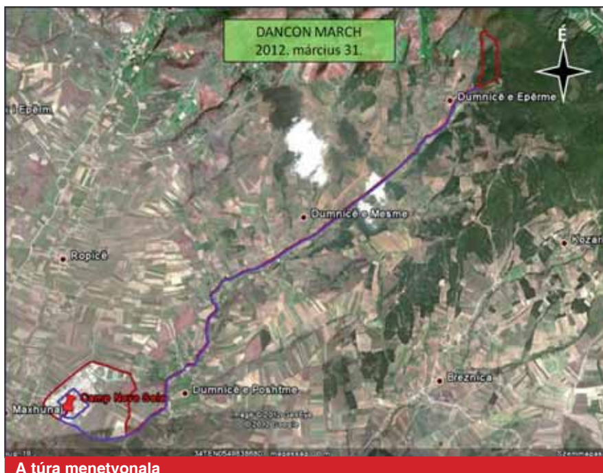
A túra menetvonala