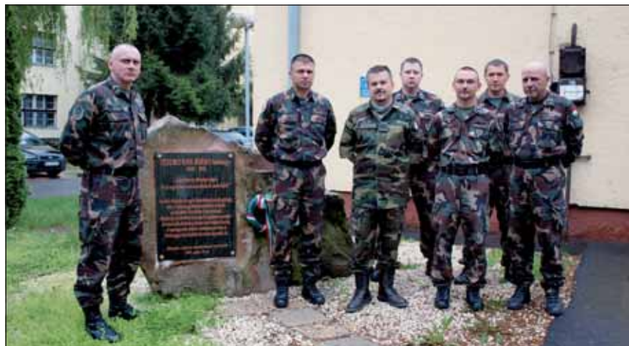
Tisztelgés az MH 86. Szolnok Helikopter Bázis névadójának emlékművénél