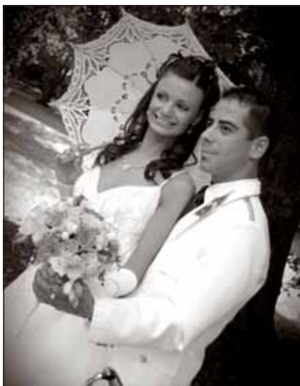
A boldogító igen kimondása után