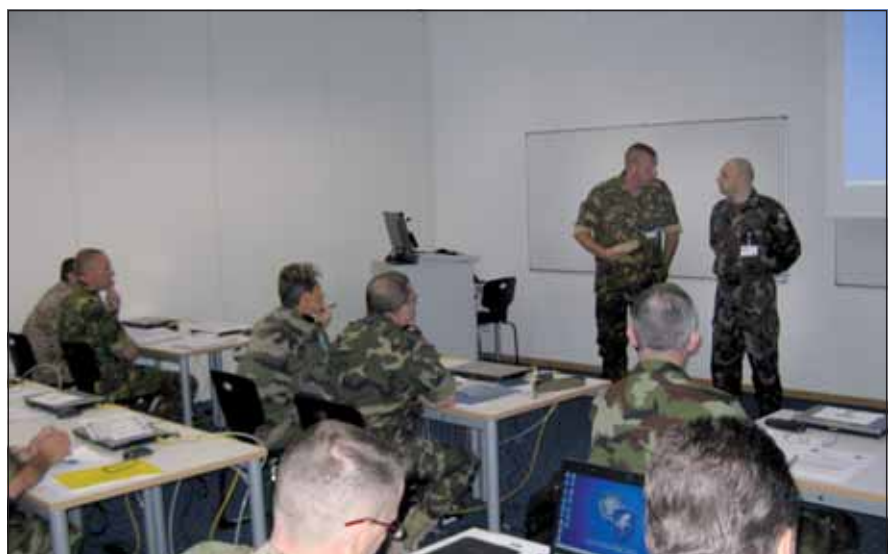
Foglalkozás a NATO-iskolán

Ami viszont új volt és komoly odafigyelést igényelt részemről, az a családom közelsége. Ez idáig szinte a teljes katonai pályafutásom alatt ingáztam szolgálati helyem és lakóhelyem között, tavaly június óta viszont velem vannak a szeretteim. Nagy változás, hogy mindennap otthon lehetek és valóban törődhetnek velük. Az „átállás” nem ment zökkenőmentesen, elvégre a gyerekeim életében az elmúlt tiztizenkét évben csak néha voltam jelen. Az eltelt esztendő bizonyította, hogy mára már újra egy család vagyunk. És mindent meg kell tenni azért, hogy ez így is maradjon. A család ügyeiben is szükség van