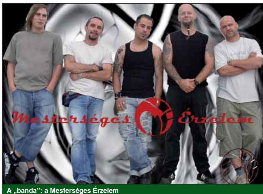
A „banda”: a Mesterséges Érzelem

– Anyaalakulatomnál, az MH 64. Boconádi Szabó József Logisztikai Ezrednél a híradószakaszban