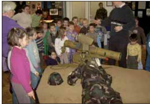
Óvodások a csapatmúzeumban

Folyamatos törekvésünk, hogy megszólítsuk, hívjuk, várjuk a családtagokat az általunk rendezett eseményekre, hiszen az a család veszi majd bizalommal igénybe a hozzátartozó külszolgálat idején is az iroda segítségét, amelyik már korábban is kapcsolatba került vele, amelynek tagjai megtapasztalták, hogy az itt dolgozó munkatársak kellő empátiával kezelik problémáikat. A családtagokkal történő zökkenőmentes kapcsolattartás érdekében alakította ki dandárunk parancsnoksága az iroda helyiségét is, ahová minden beléptetési ceremónia nélkül, közvetlenül az utcáról, akadálymentesen juthatnak be az érdeklődők. A helyiség kialakítása lehetővé teszi az egyéni (és családi) problémák diszkrét körülmények közötti megbeszélését, a csoportos foglalkozásokat, a külszolgálaton lévőkkel műholdas kapcsolat létesítését, az internetezést és nem utolsósorban a gyerekek foglalkoztatását. A családok külszolgálat előtti és közbeni tájékoztatását a családi napok rendszere segíti. Ezen az eseményeken együtt vesz