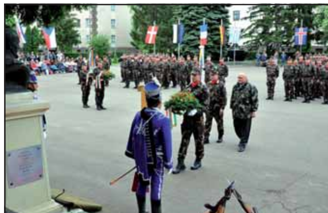
Ismét Görgey Artúr nevét viseli a szentendrei laktanya