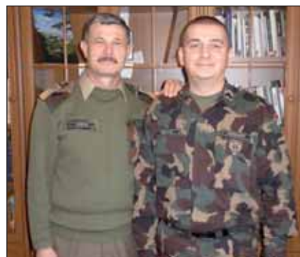
A tábori püspök és a szerző 2012-ben

– Nagyon örülök annak, hogy napjainkban egyre több iskolában van igény a honvédelmi oktatásra mint tananyagra. Az a cél, hogy az iskolákban ez a fajta hazafias nevelés és katonai szemlélet megjelenjen, és ez nagyon fontos. Már csak azért is, mert ha a szervezett oktatás netán megszűnne, előbb vagy utóbb igényként megjelenne a társadalomban, ha másképpen nem, úgynevezett vadhajtásként, hiszen