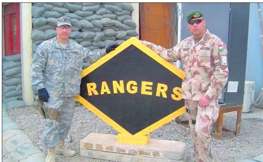
Egy amerikai tanfolyamárssal Irakban

A misszió végéig még egy nagy feladat vár ránk és családjainkra. Jövőre a parancsnokság nagy része Afganisztánban fog szol-