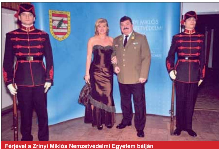
Férjével a Zrínyi Miklós Nemzetvédelmi Egyetem bálján