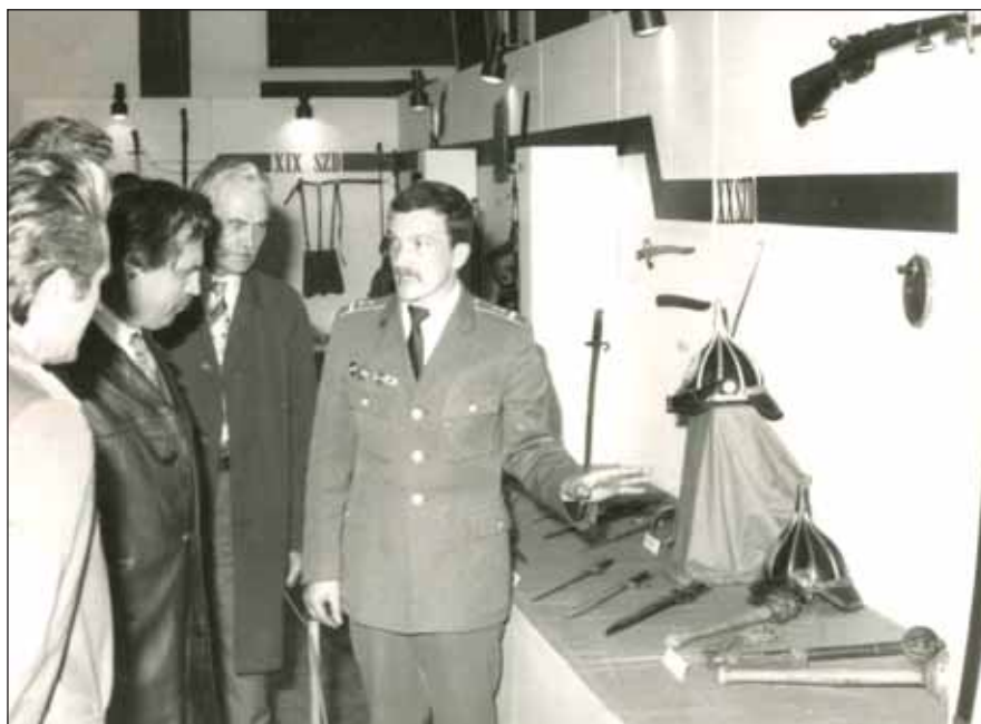
A '80-as évek kiállításainak egyikén

– Miután megtudták a sorkatonák, hogy mi a hobbim, egyre többen hoztak történelmi tárgyakat. Akkor még ezekről a dolgokról kevés ismeret volt a köztudatban. Az emberek igazából nemigen foglalkoztak velük. Verpeléti szolgálati éveim