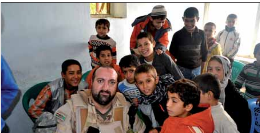
Rozsé atya gyerekek gyűrűjében