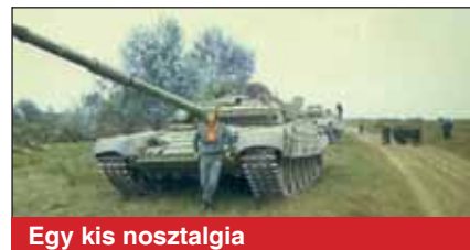
Egy kis nosztalgia

Sok betanulási idő nem állt rendelkezésére: a zászlóaljnál és a századnál lévő parancsnoki állomány már nagyon várta a fiatalok érkezését a meglévő szakaszparancsnoki létszámihiányok miatt, így a beosztással járó feladatokat nagyon rövid idő alatt el kellett sajátítania. Még ugyanebben az évben érkeztek meg a belorusz T-72-es harckocsik is az alegységhez, amelyeknek átvizsgálása és rendszerbe állítása