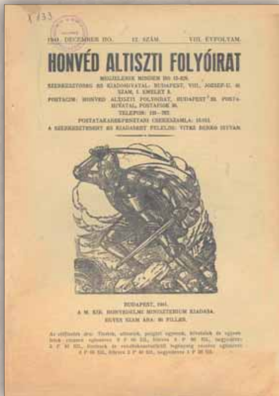
Az eltökélt szándékot a címlap is erősíti: Kinizsi Pál harcra készen