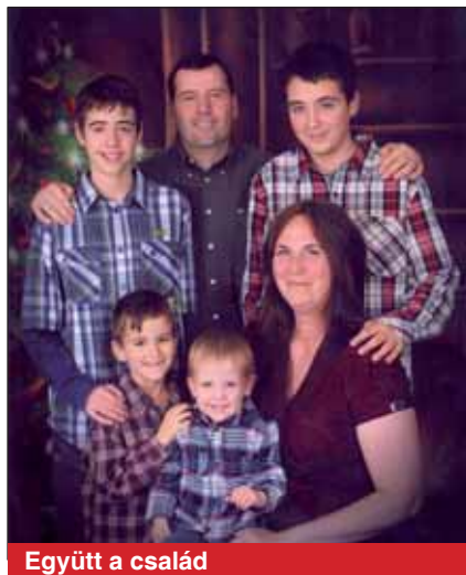
Együtt a család

Ennyi bevezető után nézzük meg, hogy mit is csinál egy hadműveleti beosztott a G5 részlegen. Én ezt a beosztást két külön részre bontanám, és teljesen elvonatkoztatnám a hivatalos munkaköri leírástól. Nem azért, mert a munkaköri leírásban foglaltak nem igazak, hanem mert az abban foglaltaknál sokkal többet kell teljesíteni. Ez a megállapítás főleg akkor igaz, amikor a mindennapi teendőket látom el, irodai környezetben. Alapvetően egy több irányba elágazó adminisztrációs beosztásnak kell megfelelni. A feladatok közé tartozik például a napi létszámjelentés, a részlegnél dolgozó tisztek munkájának mindenirányú segítése, utazásaik szervezése, NATO-dokumentumok kezelése, tárolása, kiadása stb. Ezt a munkát otthon személyügyi, ügyviteli és írnoki beosztásban szolgáló altisztek végzik. Ez tehát a hivatalos oldal. A realitás? Sokkal több. Amellett, hogy ezt a beosztást ellátom, más számos „mellékbeosztás” is az én felelősségem (TASO – Terminal Area Security Officer, BSO – Branch Security Officer, BDCO – Branch Document Control Officer, BIMO – Branch Information Management Officer).