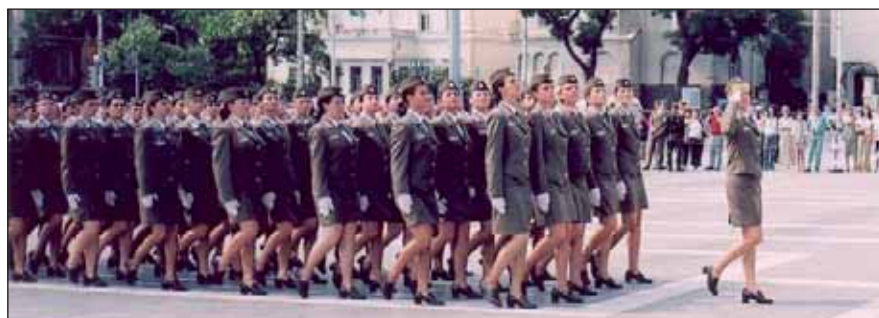
A Központi Tiszthelyettes Szakképző Iskola avatási ünnepsége záró díszmeneténél élén 2002. július 15-én