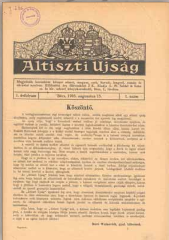
A kezdet: Altiszeti Ujság, 1916