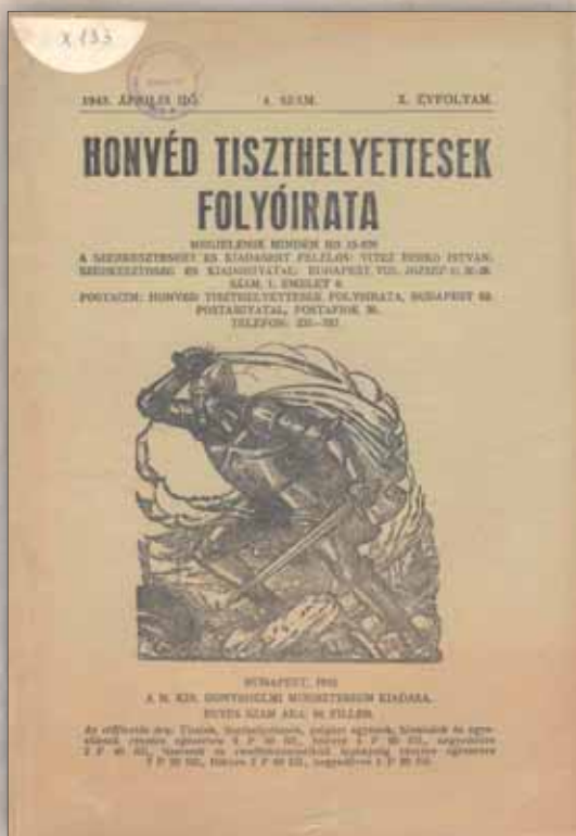
Névváltás után: Honvéd Tiszthelyettesek Folyóirata