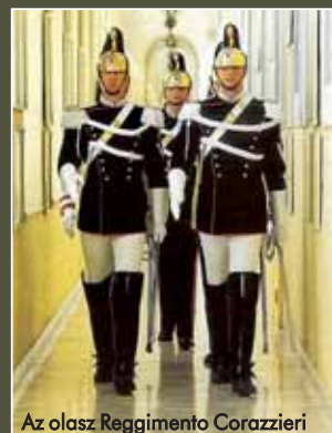
Az olasz Reggimento Corazzieri

Olaszország díszalakulatának (Reggimento Corazzieri) egyenruháját az elegancia, a kifogástalan szabás jellemzi. A „divatosság” mellett persze megmutatkozik a történelmi hagyományok megőrzése is. E válogatott díszegység – ami egyben a köztársasági elnök testőrsége – szervezetiileg a nagy múltú csendőrséghez (Arma dei Carabinieri) tartozik. Fő feladatuk a parlament épülete és a Purinal-palota őrzése, illetve ők adják a kiemelt állami ünnepeken a köztársasági elnök kíséretét. A széttagolt Itália számtalan uralkodói testőrsége után 1870-ben alakították meg a királyi palota őrszázadát, ehhez csatlakozott egy kü-