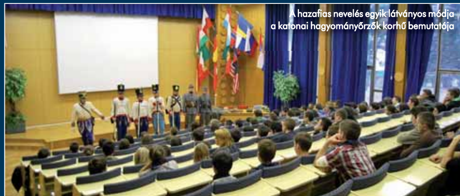
A hazafias nevelés egyik látványos módja a katonai hagyományörzők korhű bemutatója

lélőn a honvédelmi nevelés programja az oktatási folyamat egészét átszöve biztosítja majd a felnövekvő nemzedékek számára az ehhez szükséges ismereteket.