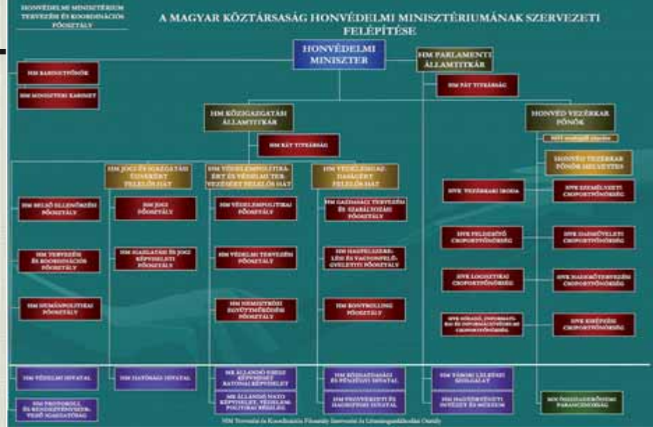
(A táblázatban az eltérített beosztások az eltérítésnek megfelelő rendfokozatnál jelennek meg.)

be tartozó főosztályi szervezetek – a katonai hagyományokhoz, az MH szervezeti sajátosságaihoz és a NATO-parancsnokságok struktúrájához is igazodva – csoportfőnökségekkel alakultak át, illetve új, az előző kormányzati ciklus minisztériu-