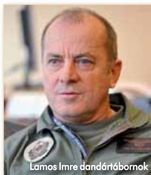
Lamos Imre dandártábornok

A Mi-17-es helikopterek személyzete a korszerű éjjellátó készülék, a Night Vision Googles (NVG) segítségével sötétben is képes végrehajtani feladatát; Lamos tábornok e berendezés haszná-