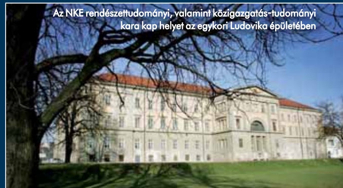
Az NKE rendészettudományi, valamint közzszolgalmi-tudományi kara kap helyet az egykori Ludovika épületében

– A tervek szerint rövid időn belül megnyitnák a kapuit az új egyetemi kampusz. A tisztképzés marad a Hungária körúton, a Ludovikára a közzszolgalmi tudományi kar és a rendészettudományi kar költözik a tervek szerint. Az volt a célunk, hogy a tisztképzés szocializáci-