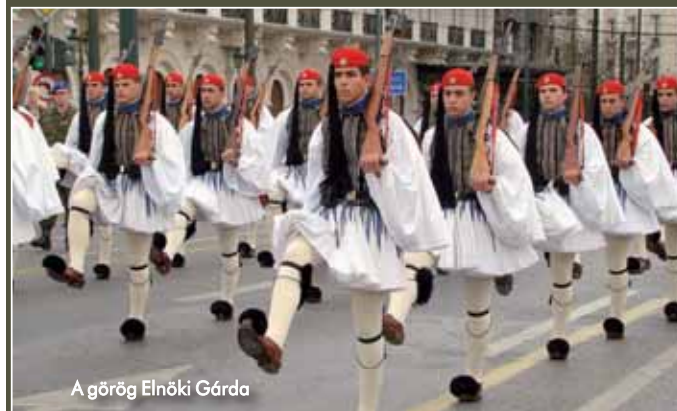
A görög Elnöki Gárda

tagolódik, ebből kettő (a díszszázad, illetve a tengerész díszszázad) lát el kifejezetten díszelgő feladatokat. A díszszázad viseletét a 17. századi horvát nemzeti viselet elemeit felhasználva alakították ki, pompázatos aranyzsinóros, skarlátvörös köntösből és mentéből áll. Ehhez ugyancsak aranydíszes skarlátvörös föveget és fekete nadrágot visel-