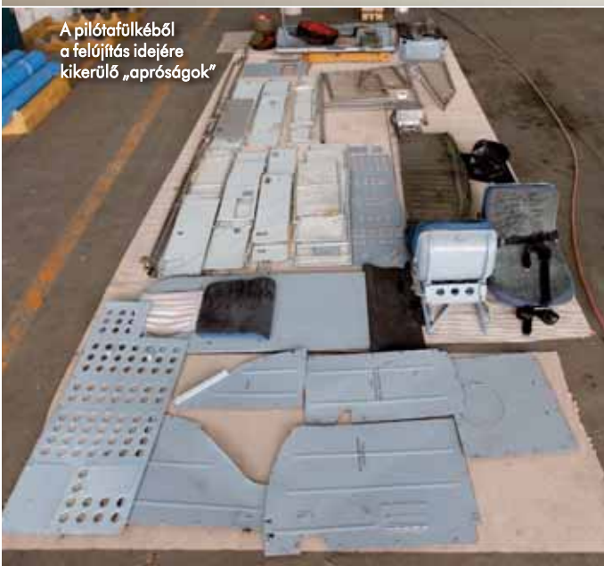
A pilótafülkéből a felújítás idejére kikerülő „apróságok”

mélyezte a katasztrófavédelem, a rendőrség, a tűzoltóság és a mentők által használt TETRA rendszerű EDR-en keresztül képes kapcsolatba lépni a polgári szervekkel árvizek, ipari és természeti katasztrófavédelemben, illetve személyek felkutatása esetén. Ez a kormányzati felügyelet alatt álló kommunikációs