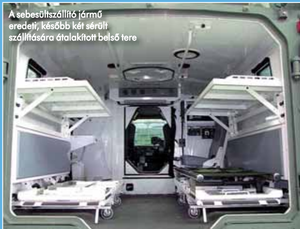
A sebesültszállító jármű eredeti, később két sérült szállítására átalakított belső tere

dokolták: szükség volt egy védett, mozgékony járórgépkocsra. Ezek voltak az első olyan védett járművek, melyeket a Rába a GBP-n belül szállított, a Mercedes G280-as gépjármű alapjaira építve. A járművek páncélozását egy németországi partnercég segítségével oldották meg, de például a géppuskatorony már magyar fejlesztés, a HM Currus Zrt.-vel együttműködésben alkották meg azokat.