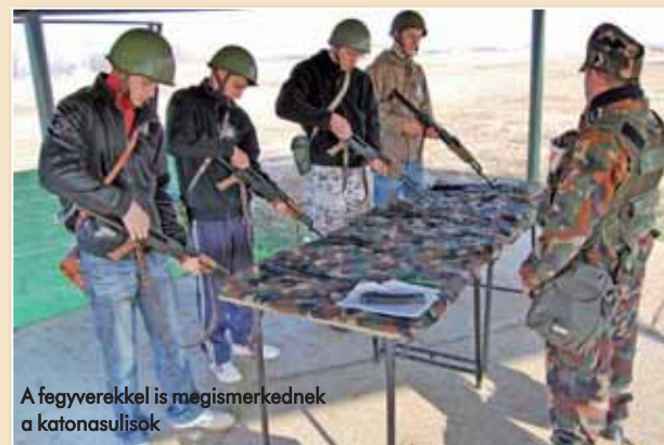
A fegyverekkel is megismerkednek a katonasulisok

– A részlegbe elsősorban olyan, pedagógus végzettségű kollégákat választottunk, akiknek vannak parancsnoki tapasztalataik, esetleg misszióban is voltak már, aktív sportolók, képesek megtalálni a hangot az adott korcsoporttal, fel tudják kelteni a gyerekek érdeklődését. Az általános iskolák 7. és 8. osztályos tanulóival szakőri keretek közt találkozunk. Tapasztalataink szerint ők főleg az olyan foglalkozásokat kedvelik, mint például a sátorverés, az egészségügyi ismeretek, a tájékozódás a terepen, a paintball-lövészet, a közelharc, a tűrzás alapszabályai és a túlélési alapismeretek. Amikor látjuk, hogy csökken az érdeklődésük, azonnal változtatunk a képzés tematikáján. A középiskolákban viszont nem térhetünk el a tantervtől,