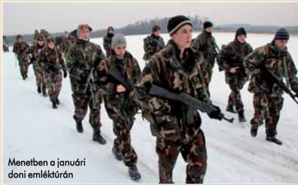
Menetben a januári doni emléktúrán

– Katonaként az iskola tantestületének is tagjai vagyunk, részt veszünk az értekezleteken, vezetjük az elektronikus naplót, és órarend szerint tanítunk. Előjáróink a laktanyában vannak, szakmai főnökeink pedig a Gábor Dénes szakközépiskolában – szölte a mentorok speciális helyzetéről a testnevelő tanári diplomával rendelkező fiatal tiszti, majd hozzátette: viszonylag gyorsan meg-