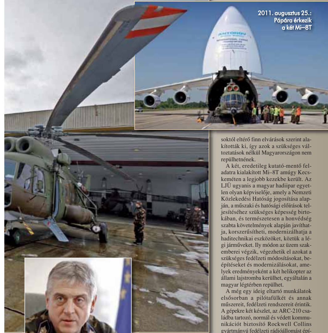
2011. augusztus 25.: Pápára érkezik a két Mi-8T