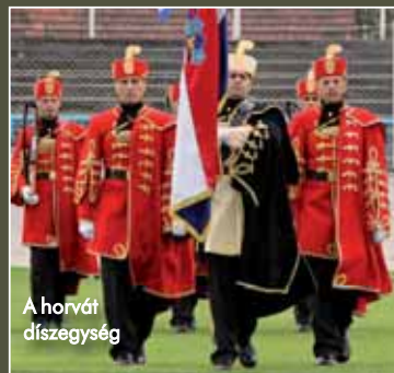
A horvát díszegység

Horvátország fegyveres erőinek díszelgő zászlóaljában 2000. szeptember elsejétől háromszáz hivatásos katona szolgál. Előljárójuk a köztársasági elnök, közvetlen parancsnokuk pedig a vezérkari főnök. A zászlóalj öt századra