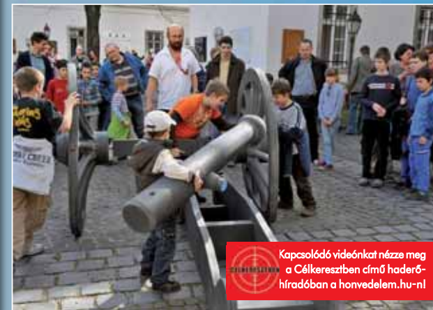
Kapcsolódó videókat nézze meg a Célkeresztben című haderőhíradóban a honvedelem.hu-n!

A történelmi korszakot idéző egyenruhában megtartott fegyver- és felszerelésbemutatók is népszerűek a látogatók körében, tehát ezek sem maradhatnak ki a programok sorából, akárcsak a népi játékok. A gyermekek fegyvermustrán, kisdobosképzésen, kézműves-foglalkozáson, korhű viseletben történő fotózáson vehetnek részt, a nap végén