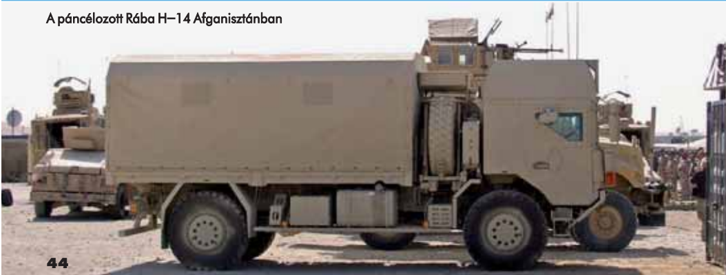
A páncélozott Rába H-14 Afganisztánban

volt szempont. Elméletben ugyanis hiába van meg mindennek a helye, ha a rendszer a gyakorlatban nem funkcionál, és emiatt alapos átgondolást igényel a jármű megtervezése és megalkotása.