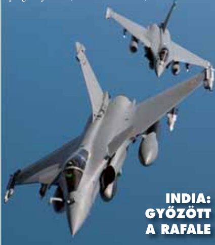
INDIA: GYŐZÖTT A RAFALE

A Dassault Aviation közleménye szerint a többfeladatu vadászbombázók beszerzésére kürt indiai tendert a francia Dassault Rafale F3 nyerte meg; ez a győzelem a típus első exportsikerét jelenti. Az ázsiai atomhatalom 11 milliárd dollárt fizet a 126 francia repülőgéperért, melyekből az első tízenyolc a dél-franciaországi Merignac-ban készül, a többi viszont már az indiai Hindustan Aeronautics állítja össze. Az üzlet része a technológiai transzfer is, azaz a Rafale gyártásánál és fejlesztésénél alkalmazott technológiák nagy részét India átveheti és használhatja saját repülőgép-fejlesztési programjaiban. (bharat-raksak.com)