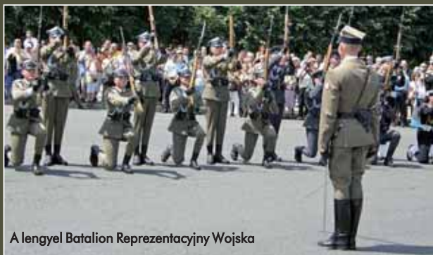
A lengyel Batalion Representacyjny Wojska

oni háborúk idején (a lengyel légió viseletekét) vált igazán ismertté. Az 1920-as évektől viselt tábori barna (keki) színű egyenruhájuk, a kiegészítő kelmék, jelvények mind-mind a nemzeti jelleget erősítik. A legjelentősebb nemzeti, katonai és vallási rendezvényeken a díszzászlóaljtag kiegészítik a légió és a haditengerészet díszalegységei.