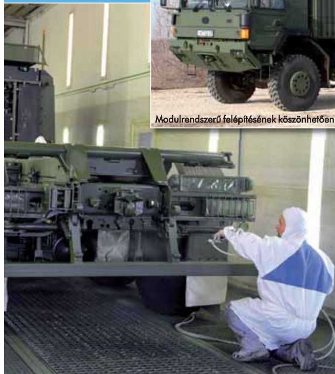
Modulrendszerű felépítésének köszönhetően ivóvíz szállítására is alkalmas a jármű

tok, visszajelzések alapján pontosan meghatározta, hogy milyen járműre is van szüksége Afganisztánban. Mindig tanulnak újat: ez esetben azért, mert a nukleáris, biológiai és vegyi (ABV) védeltséget kellett megoldani, amely az I. osztályba tartozó járórgépjárműveknél nem