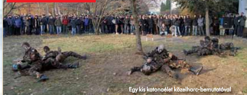
Egy kis katonaelet közelharc-bemutatóval

Kapcsolódó videónkat nézze meg a Célkereszten című haderő-híradóban a honvedelem.hu-n!