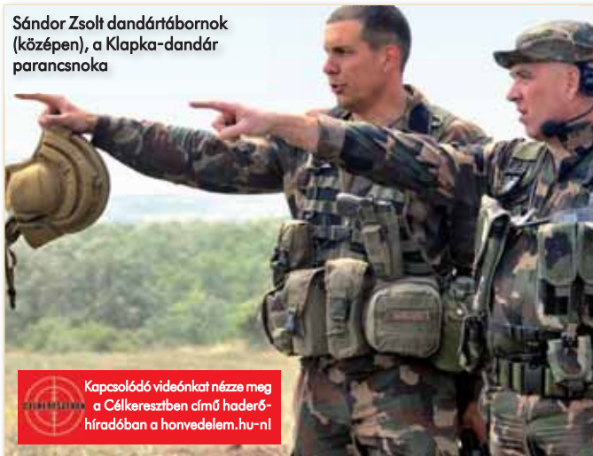
Sándor Zsolt dandártábornok (középen), a Klapka-dandár parancsnoka

Sándor Zsolt dandártábornok, a Klapka-dandár parancsnoka elmondta: mivel századszintű kötelékként a harcocsizóknak, a tüzereknek és a páncéltörő tüzereknek nem volt szükségük nagyszámú tisztre és tiszthelyettesre, a szak-