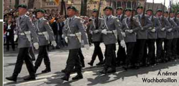
A német Wachbataillon

A török hadsereg díszelgő haderőmeneként tagolódnak és ünnepélyes alkalmakkor egyszerre jelennek meg.