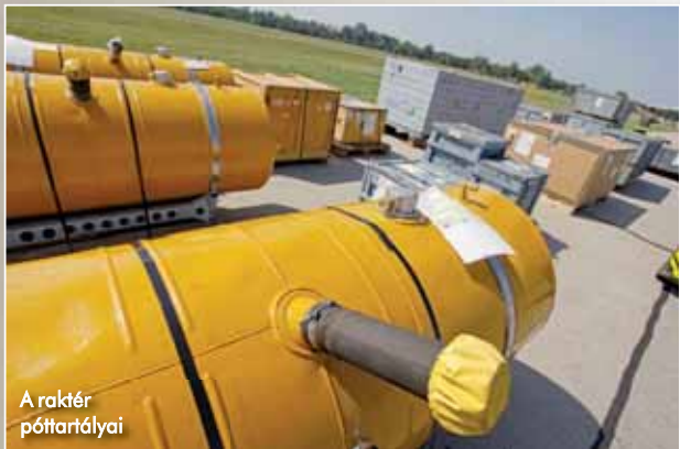
A raktár póttartályai

Ismeretes, hogy minden ország kormánya saját kommunikációs rendszert épít ki és alkalmaz, egyebek mellett a katasztrófavédelemben folytatott kommunikációhoz. Így az is természetes, hogy az immár „magyar” Mi-8T-k fedélzetére a hazai egységes digitális adóhoz (a TETRA EDR-hez) igazodó kommunikációs eszközt kell beépíteni. Ez azért is fontos, mert a helikopter sze-