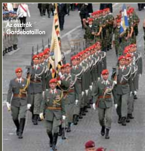
Az osztrák Gardebataillon

A bolgár fejedelmek és palotáik (dísz)őrségének „prototípusát” 1879-ben hozták létre. Az évek során a fejedelmet (majd cárt) kísérő csapat szápontjában lévő Heldenplatzon ünnepelnek. Ugyanakkor szervezetszerű könnyűzászlóaljként is bevethetők, tehát nem csak a parádékon állnak helyt. Ruházatuk alapja a Bundesheer társasági egyenruhája, erre kerülnek olyan díszítőelemek, mint a bal oldalon viselt