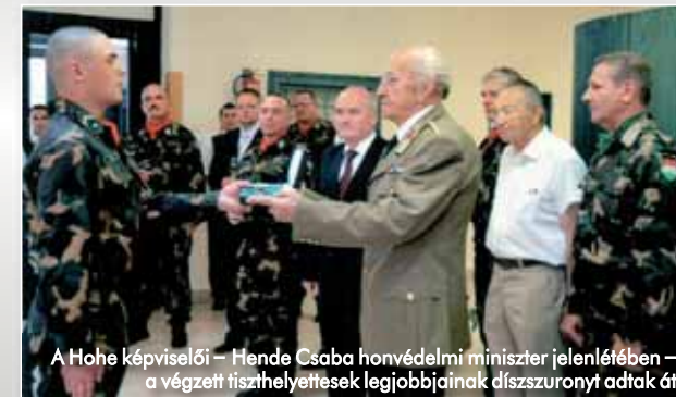
A Hohe képviselői – Hende Csaba honvédelmi miniszter jelenlétében – a végzett tiszthelyettesek legjobbjainak díszszuronyt adtak át

– Most, hogy ismét lesz a honvédelmi tárca által támogatott katonai szellemiségű iskola Debrecenben – jegyzi meg a Hohe elnöke –, reményeink szerint ott is folytatódhat hagyományörző munkánk. Fontos, hogy mint minden nemzet, mi is nagyon büszkéek legyünk történelmünkre, legszebb hagyományainkra. Hogy csak egy példával éljek, emlékeznünk és emlékeztetnünk kell arra, hogy miként álltak helyt a somogyi 44-es „rosseb” gyalogezred bakái az első világháborúban, és miként fiaik a második világháború csataterén. Nem feledkezhetünk meg az alapítók elhatározásáról sem: a Hohe mindent megtesz a rendfokozatuktól, hivatásuk gyakorlásától közigazgatási úton törvénytelenül, vagy koholt vádak és politikai alapon hozott népbírósi ítéletek alapján meg-