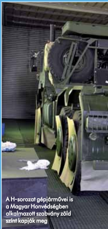
A H-sorozat gépjárművei is a Magyar Honvédségben alkalmazott szabvány zöld színt kapják meg

A következő feladat a II. osztályba (2–4 tonna rakománytömeg), egyben magasabb védelmi fokozatba tartozó sebesültszállító jármű megtervezése volt. A Mercedes Unimog önjáró alvázra épített felépítmény speciális vázszerkezetét is külföldi partner segítségével készítették el. Magyarországon kezdetben a HM ArmCom Zrt. segítette a jármű berendezésének kialakításában, hiszen ez a cég rendelkezett az ehhez szükséges speciális tudással. A négy helyett két sebesült, valamint az egészségügyi szakszemélyzet szállításához szükséges kialakítás akkor lehetett végleges, amikor a honvédség az összegyűlt gyakorlati tapasztala-