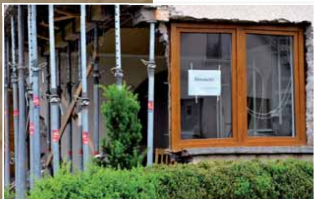
A víz nemcsak a gátat bontotta meg