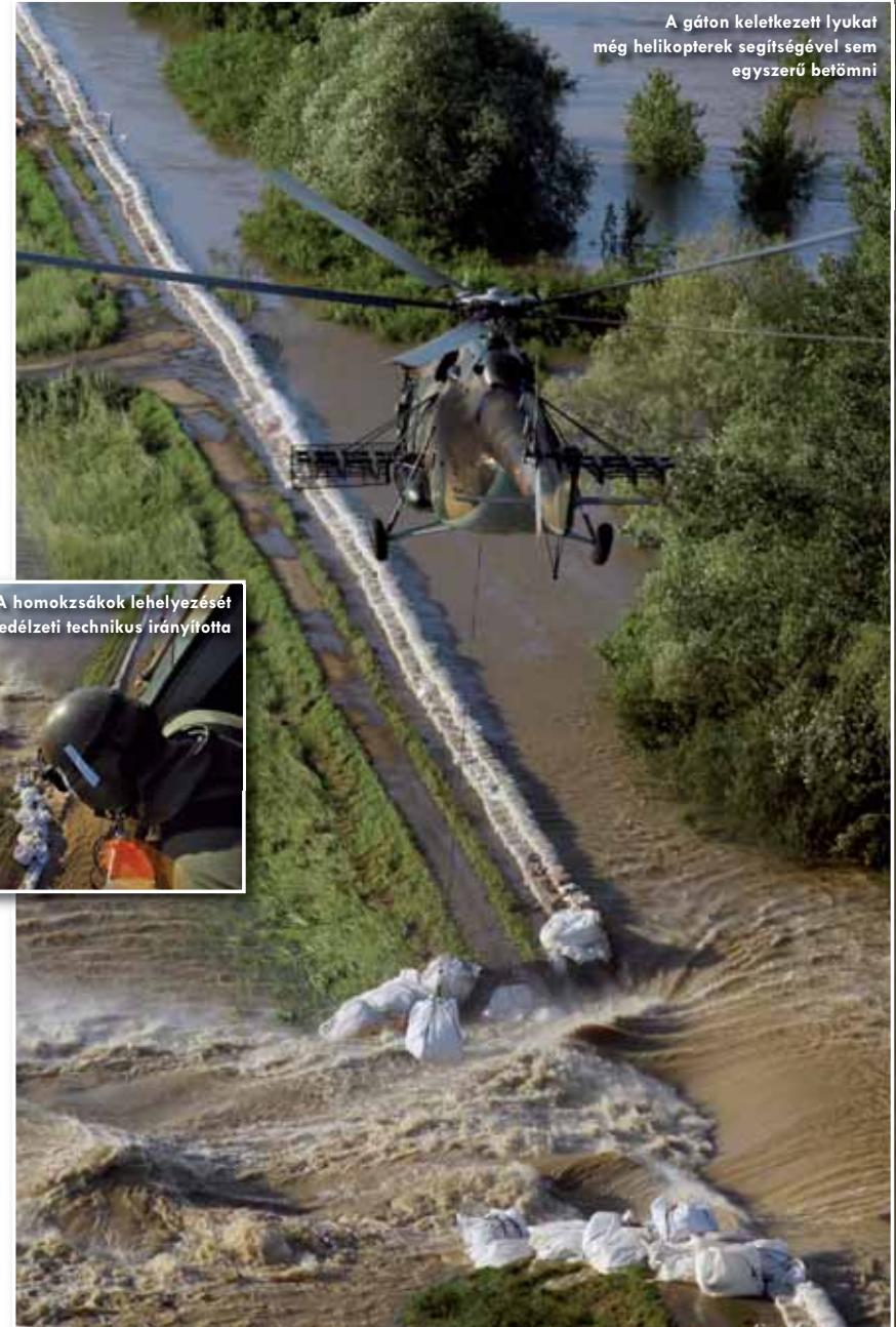
A homokzsákok lehelyezését a fedélzeti technikus irányította

A gáton keletkezett lyukat még helikopterek segítségével sem egyszerű betömni