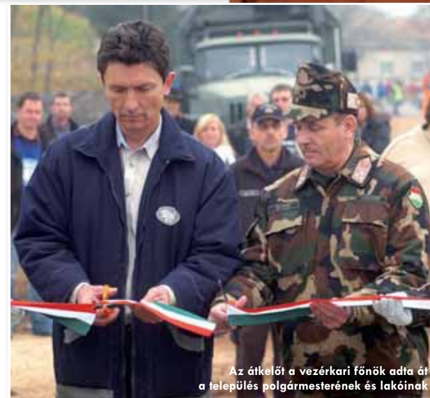
Az átkelőt a vezérkari főnök adta át a település polgármesterének és lakóinak

A hidat építette: MH 37. II. Rákóczi Ferenc Műszaki Ezred, Szentes