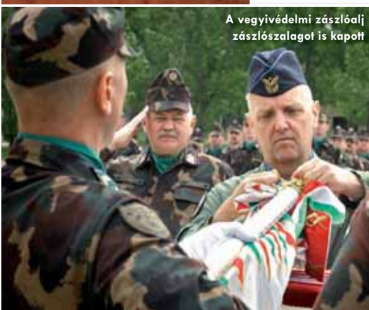
A vegyivédelmi zászlóalj zászlószalagot is kapott