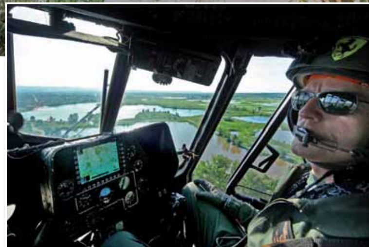
A honvédség helikopterei is „csatasorba” álltak

tosan áttértek a mentési munkálatokra. Ennek biztosítására a Magyar Honvédség különböző alakulataitól összesen tizennyolc kételtű, lánctalpas szállítójárművet rendeltek ki a helyszínre.