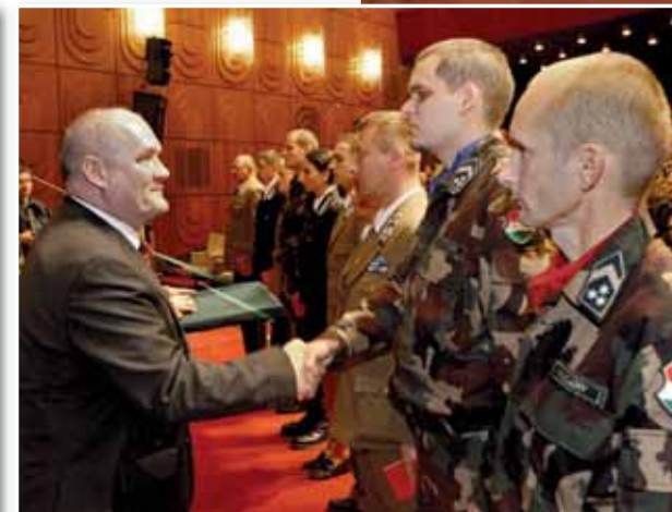
A budapesti ünnepség