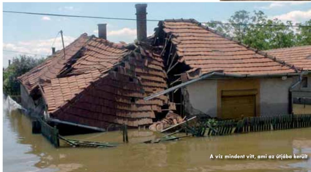
A víz mindent vitt, ami az útjába került

Sólyom László köszönetet mondott az ország polgárainak is, akik – mint mondta – a természeti csapás hírére megmozdultak; ezt mi sem bizonyítja jobban, mint az, hogy az adományok folyamatosan érkeznek a rászorulóknak. Hozzátette: két nap alatt megoldottá vált az ételmezés kérdése, és a vészhelyzet ellenére majdnem minden működik. A köztársasági elnök a sajtótájékoztató után ellátogatott a Miskolci Sportcsarnokban elszállásolt, kitelepített családokhoz.