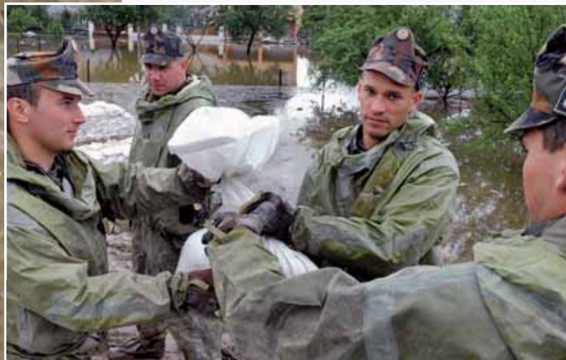
Katonák nélkül ma már elképzelhetetlen az árvíz elleni védekezés

AZ ÁRVÍZ ELLENI VÉDEKEZÉSBEN A HONVÉDSÉGRE MINDIG LEHET SZÁMÍTANI: 2006 TAVASZÁN – KÖZEL KÉT HÓNAPON KERESZTÜL – A DUNA, A TISZA, A KÖRÖSÖK, A HERNÁD ÉS A SAJÓ MELLETTI TELEPÜLÉSEK LAKOSSÁGÁT ÉS OTTHONAikat ÓVták JELENTŐS ERŐKKEL, 2010 JÚNIUSÁBAN PEDIG ISMÉT ELJÖTT AZ IDEJE A NAGYOBB SEGÍTSÉGNYÚJTÁSNAK. „CSATASORBA” ÁLLTAK TEHÁT A HADSEREG TECHNIKAI ESZKÖZEI ÉS KATONÁI.