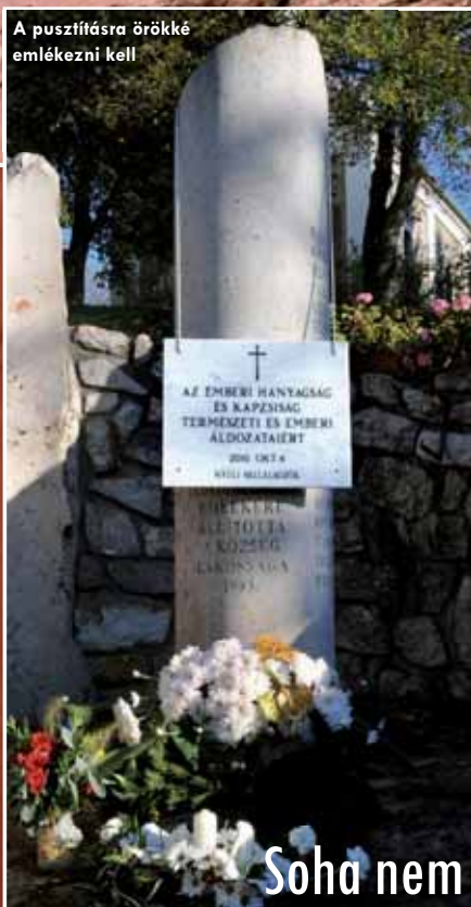
A pusztításra örökké emlékezni kell

2010. OKTÓBER 4-ÉN KÖVETKEZETT BE MAGYARORSZÁG TÖRTÉNETÉNEK LEGNAGYOBB IPARI ÉS ÖKOLÓGIAI KATASTRÓFÁJA: ÁTSZAKADT A MAGYAR ALUMÍNIUMTERMELŐ ÉS KERESKEDELMİ ZRT. (MAL ZRT.) AJKA MELLETTI EGYIK VÖRÖSISZAP-TÁROLÓJÁNAK GÁTJA, S A KIÖMLŐ KÖZEL HÉTSZÁZEZER KÖBMÉTER, ERŐSEN LÚGOS KÉMHA TÁSÚ MARÓ SÁRÖZÖN LETAROLTA A VESZPRÉM MEGYEI KOLONTÁR, DEVECSE R ÉS SOMLÓVÁSÁRHELY EGY RÉSZÉT. A KATASTRÓFÁBAN TÍZEN VESZTETTÉK ÉLETÜKET, KÉTSZÁZNYOLCVANHAT EMBER SZENVEDETT SÉRÜLÉSEKET, 358 INGATLAN PEDIG MEGRONGÁLÓDOTT. A VÖRÖSISZAPÖMLÉS KÖVETKEZMÉNYEINEK ELHÁRÍTÁSÁBAN HÓNAPOKON KERESZTÜL JELENTŐS ERŐVEL RÉSZT VETT A MAGYAR HONVÉDSÉG IS.