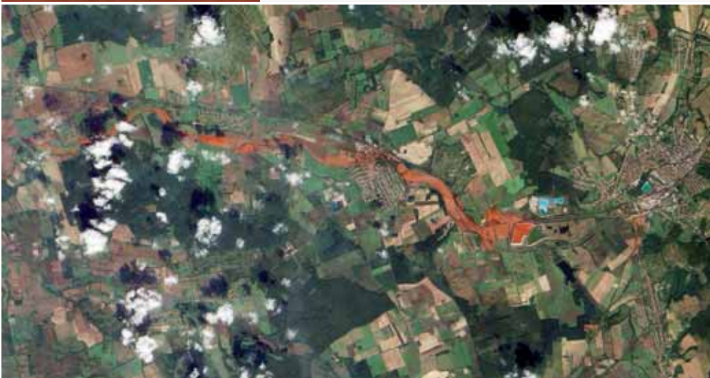
A műholdfelvételen is tökéletesen látszott a vörösiszap útja

A MAGYAR HONVÉDSÉG MEGFESZÍTETT MUNKÁT VÉGZETT A KATASZTRÓFA SÚJTOTTA TÉRSÉGBEN: A KATONÁK AZ ELSŐ PILLANATOKTÓL KEZDVE BEKAPCSOLÓDTAK A MENTÉSI ÉS KÁRELHÁRÍTÁSI MUNKÁLATOKBA, ÁLDOZATKÉSZSÉGÜK ÉS HŐSIESSÉGÜK PÉLDAÉRTÉKŰ VOLT.