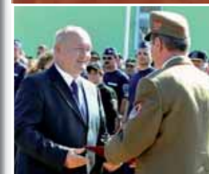
A miniszteri elismerő oklevelet a vezérkari főnök vette át