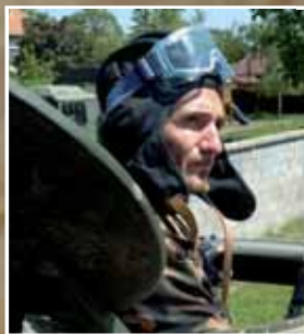
A katonák reményt adtak a helyieknek

Június 10-én aztán – miután a legnagyobb problémát okozó észak-magyarországi folyók vízszintje apadni kezdett – meg lehetett szüntetni a kormány által hirdetett vészhelyzetet. Megkezdődhetett tehát a védelmi munkálatokban közreműködő erők visszacsoportosítása, amelynek keretében a katonák döntő többsége is elhagyta Borsod-Abaúj-Zemplén megyét, s visszatért helyőrségeibe.