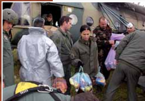
A devecseri óvoda gazdagodott a helikopterek adományával

A MENTÉSBEN RÉSZT VEVŐ EGYSÉGEKNEK, ILLETVE A KATASZTRÓFA ELSZENVEDŐINEK ÉRTÉKES SEGÍTSÉGET NYÚJTOTTAK A HONVÉDSÉG HELIKOPTEREI. EZT IGAZOLJA AZ ALÁBBI HÁROM TÖRTÉNET IS.