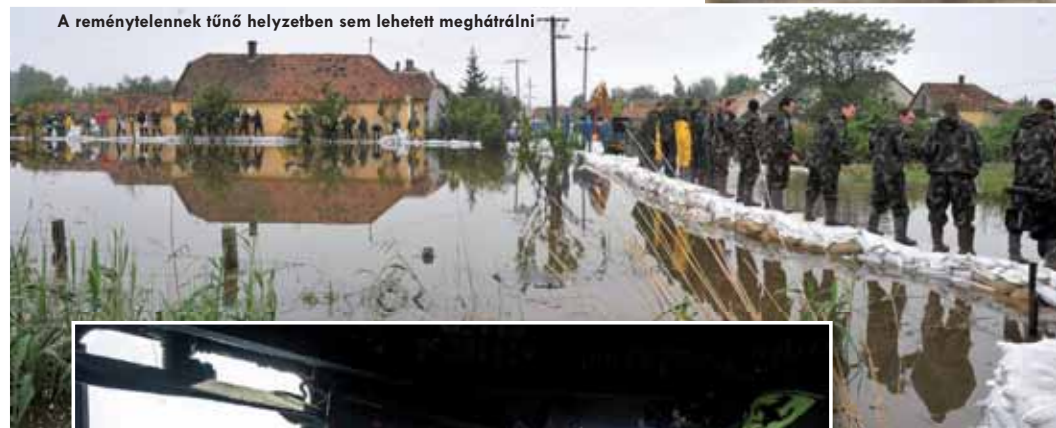
A reménytelennek tűnő helyzetben sem lehetett meghátrálni

Az igazi „meccs” aztán június legelején vette kezdetét: előbb a megáradt chuai Bakony-ér okozott hatalmas felfordulást a Győr-Moson-Sopron megyei Bónynél, majd Borsod-Abaúj Zemplén megyén söpört végig az utóbbi évtizedek egyik legnagyobb árhulláma. A lakosság, a katonák, a rendőrök, a tűzoltók, a vízügyi szakemberek, illetve az önkéntesek sokszere tömege napokon át vívta harcát a Hernád, a Bódva, a Vadász-patak, a Sajó, a Zagyva és a Tarna megáradt vizeivel – hol több, hol kevesebb sikerrel. A kirendelt erők a gát megerősítésének feladatairól fokoza-