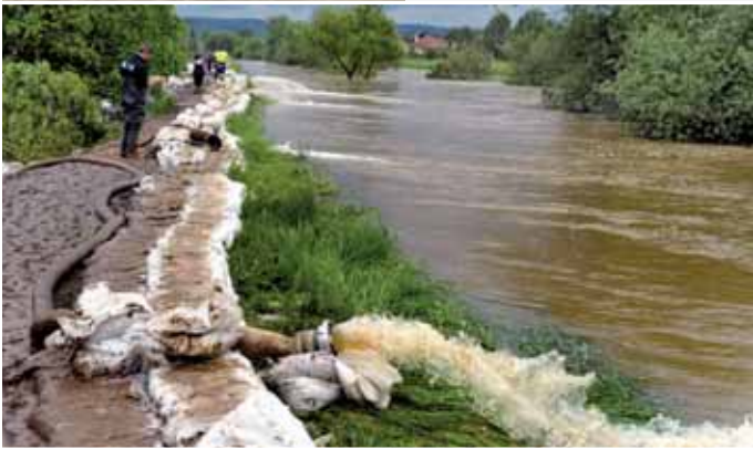
A víz komoly ellenfélnek bizonyult

BORSOD-ABAÚJ-ZEMPLÉN MEGYE TÖBB PONTJÁN ALAKULT KI KRITIKUS ÁRVÍZI HELYZET A MEGÁRADT HERNÁD ÉS SAJÓ FOLYÓK MIATT. A TÉRSÉGBE MÁR 2010. JÚNIUS 2-ÁN MEGÉRKEZTEK A MAGYAR HONVÉDSÉG ELSŐ ALAKULATAI. VOLT OLYAN NAP, AMIKOR EGYSZERRE KÖZEL HÁROMEZER KATONA DOLGOZOTT A GÁTAKON, ILLETVE SEGÍTETT A MENTÉSI MUNKÁLATOKBAN.