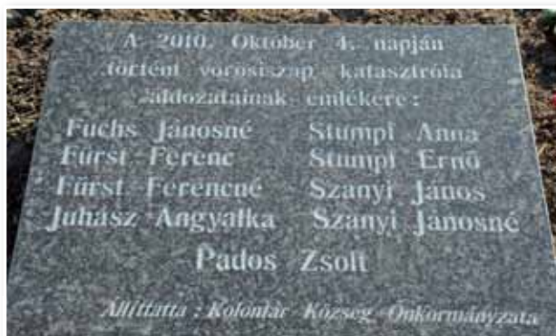
A kolontári áldozatoknak emléket állító tábla

A VÖRÖSISZAP-KATASZTRÓFA ELSŐ ÉVFORDULÓJÁN – 2011. OKTÓBER 4-ÉN – MEGEMLÉKEZÉSEKET TARTOTTAK, ILLETVE ELISMERÉSEKET ADTAK ÁT KOLONTÁRON ÉS DEVECSERBEN.