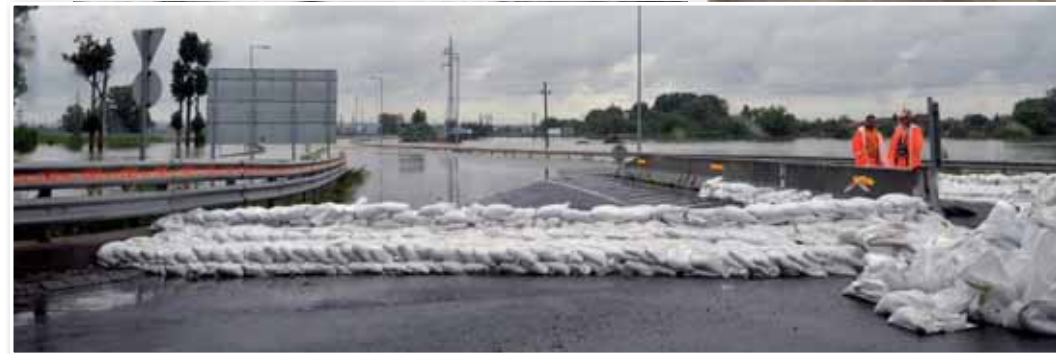
Az áradó folyók a közutakat is elöntötték