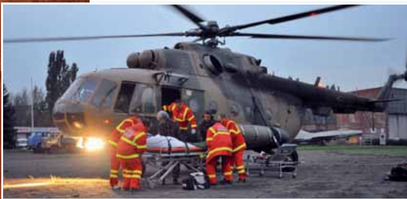
A sérültek szállításában a honvédség helikopterei főszerephez jutottak

A légi kutató-mentő készenléti szolgálatnak a honvédség pápai bázisrepülőtéren települt egysége 2010. október 4-én, 15.14-kor kapta a riasztást: az MH Művelési Központ (mai nevén MH Vezetési és Doktrinális Központ) tájékoztatása szerint Kolontár mellett gátszakadás történt, a személyzet tehát készüljön, mert szerephez juthatnak a mentésben.