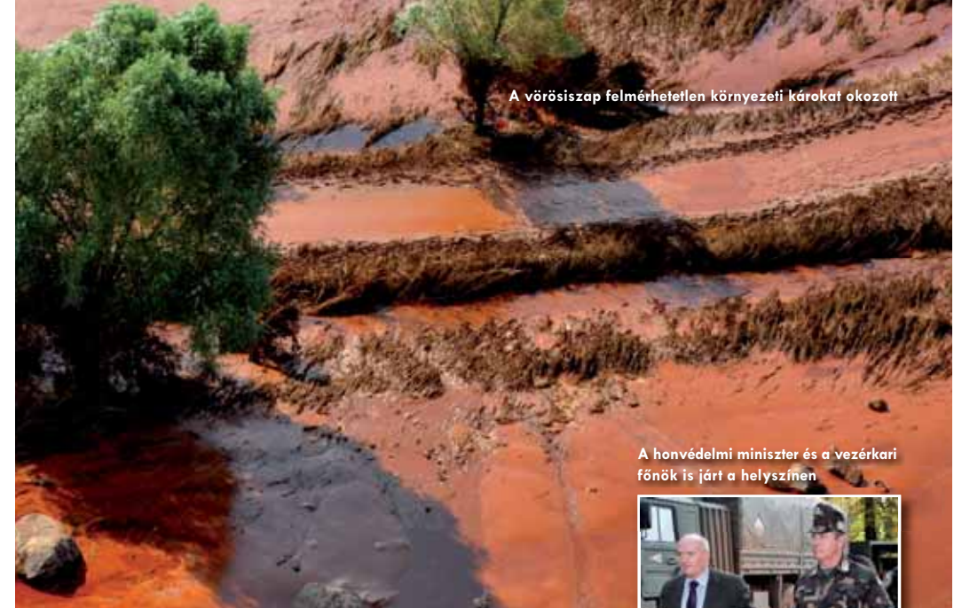
A vörösiszap felmérhetetlen környezeti károkat okozott