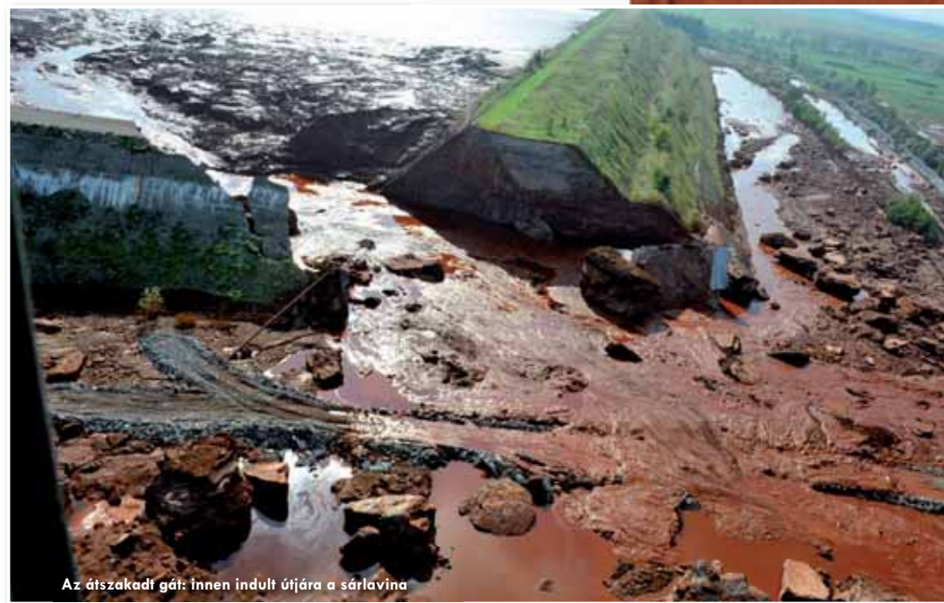
Az átszakadt gát: innen indult útjára a sárlavina