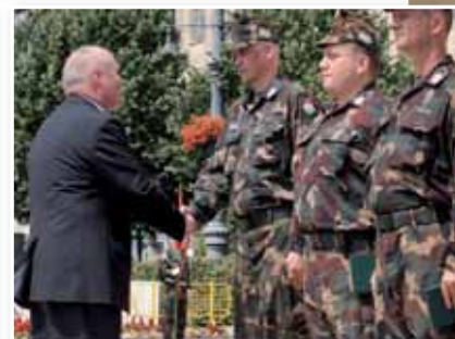
Az Árvízvédelemért Szolgálati Jelet Benkő Tibor vezérkari főnök (felső kép), Borkai Zsolt, Győr polgármestere (bal oldali kép), Hende Csaba (jobb oldali kép), Kósa Lajos, Debrecen polgármestere (bal alsó kép), illetve Sarka Gábor (jobb alsó kép) nyújtotta át a katonáknak.