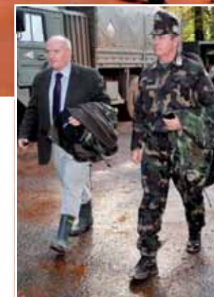
Meggyeserőpusztán, az egykori honvédségi lakótelepen hat darab kétszobás – 45, illetve 65 négyzetméteres – lakást alakítottak át a tragédia miatt otthon nélkül maradt családok részére.