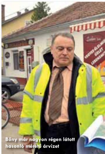
Böny már nagyon régen látott hasonló méretű árvizet