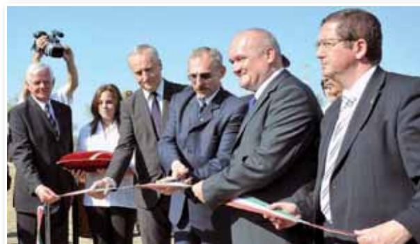
Az első évfordulón Devecserben nyolchektáros emlékparkot avattak. A park a megújulást, az újrakezdést szimbolizálja

Az elképesztő károk közepette a nemzet összefogott, Magyarország népe egyszerre mozdult, és példát mutatott segítőkészségből, önzetlenségből, emberi helytállásból.