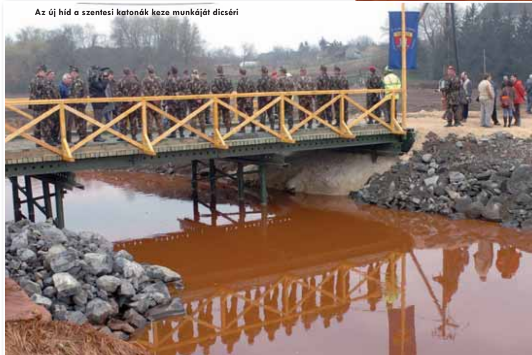
Az új híd a szentesi katonák keze munkáját dicséri

A műszakiak ezúttal is magas szakmai színvonalon látták el feladatukat