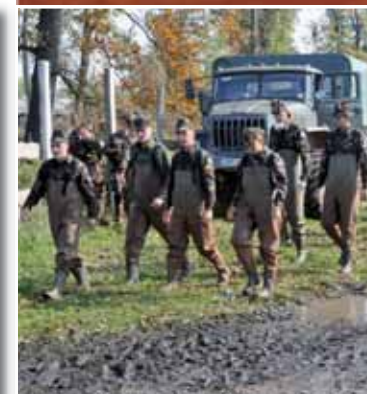
A katonák ezúttal is gyorsan a katasztrófa helyszínére érkeztek, hogy részt vegyenek a károk felszámolásában