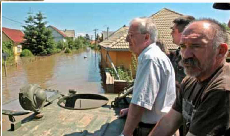
A köztársasági elnököt megdöbbenő látvány fogadta

SÓLYOM LÁSZLÓ KÖZTÁRSASÁGI ELNÖK, A MAGYAR HONVÉDSÉG FŐPARANCSNOKA 2010. JÚNIUS HETEDIKÉN JÁRT AZ ÁRVÍZ SÚJTOTTA TÉRSÉGBEN. LÁTOGATÁSA SORÁN FELKERESTE FELSŐZSOLCÁT IS.