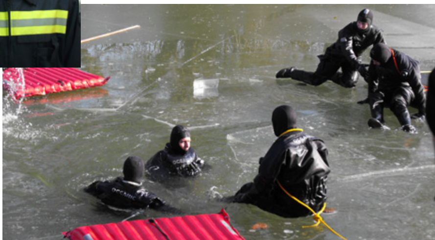
MENTÉSI GYAKORLAT A JEGES BALATONON

Surányi Barnabás zászlós