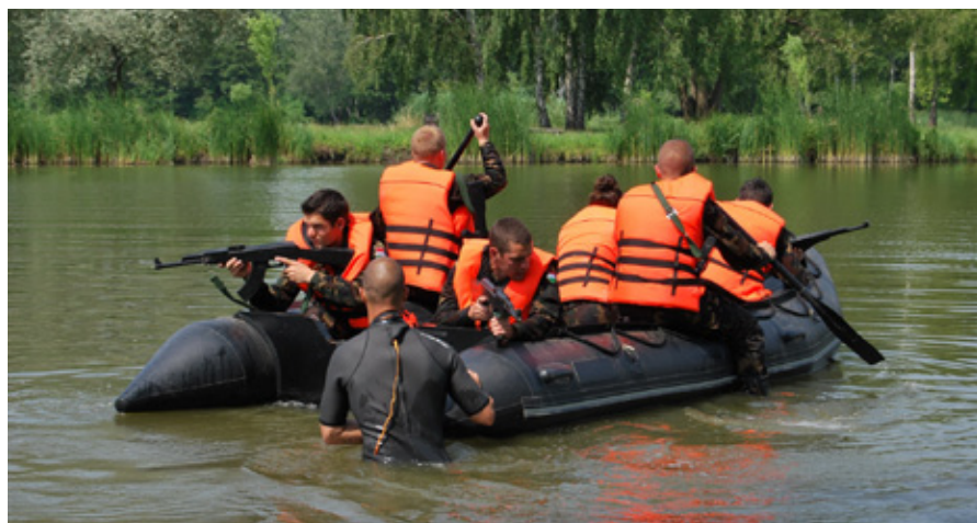
VÍZI ÁTKELÉS A VEKERI-TAVON

A túlélőtábor vezetői azért könnyítéseket is engedélyeztek: bakancs helyett sportcipőt viselhetek a gyerekek, hiszen napon-