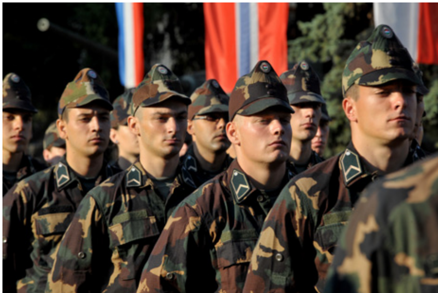
A NEMZET SZOLGÁLATÁRA KÉSZÜLNEK

Benkő Tibor vezérezredes beszédében hangsúlyozta: a megjelentek olyan szolgálatot, hivatást választottak, amelynek keretében egész életükre esküt tesznek Magyarország védelmére, a haza érdekeinek képviselőjére és szolgálatára. Emlékeztette az iskola növen