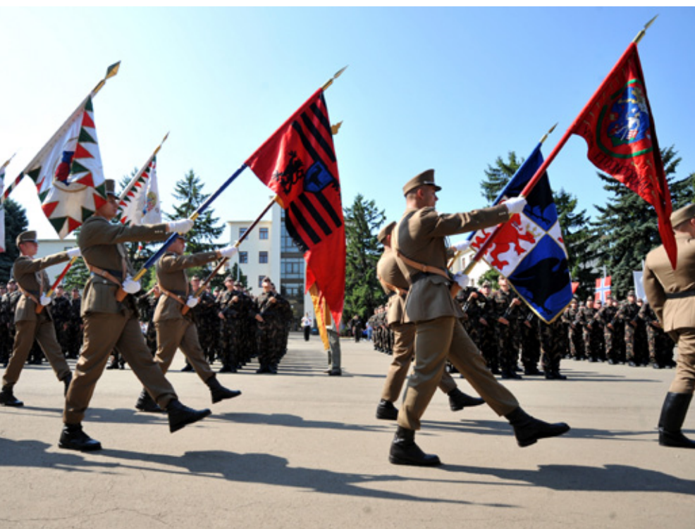
ALTISZTEK ESKÜTÉTELE SZENTENDRÉN