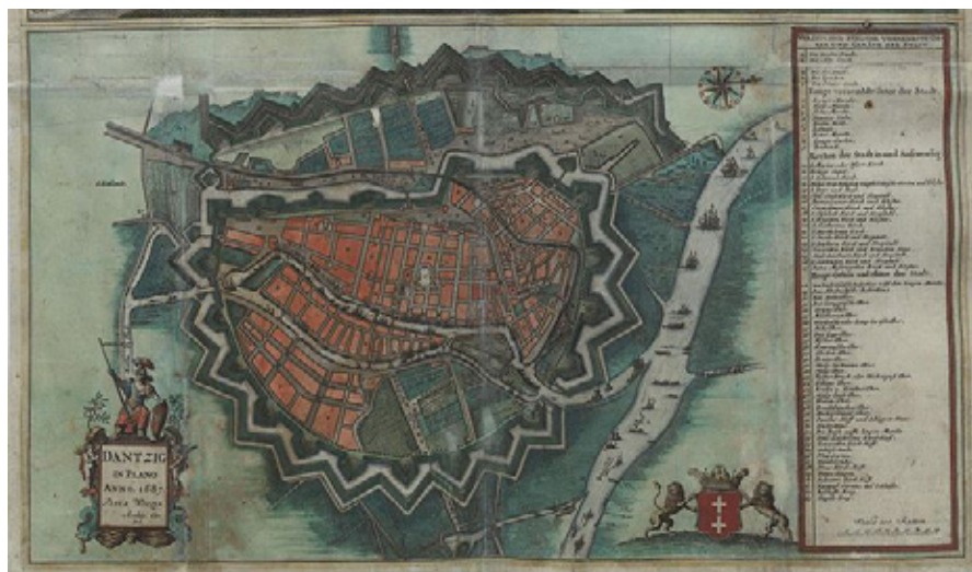
A KORABELI GDANSK ERŐDÍTÉNYRENDSZERE

1583-ban a családja beleegyezése nélkül elveszi fiatalon megözvegyült 24 éves unokahúgát, Dobó Krisztinát, az egri hős várkapitány, Dobó István leányát. Hiába történt meg az esküvő, hiába veszi birtokba hozományként a Dobó-család sárospataki várát, a birtokból kikergetik és több pert