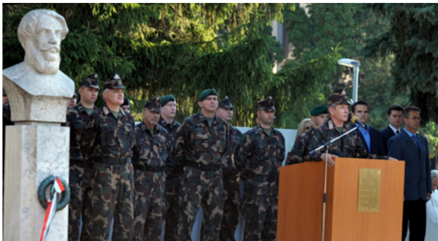
KOSSUTH LAJOS ÉS ELŐLÁRÓIK ELŐTT TETTEK ESKÜT A FIATALOK

dékeit: a katona akár élete feláldozásával is szolgálja a nemzetet, ha kell, hiszen esküjén túl gondolkodásmódja, érzelmvilága és a haza iránti feltétlen elkötelezettsége is ezt kívánja meg tőle.