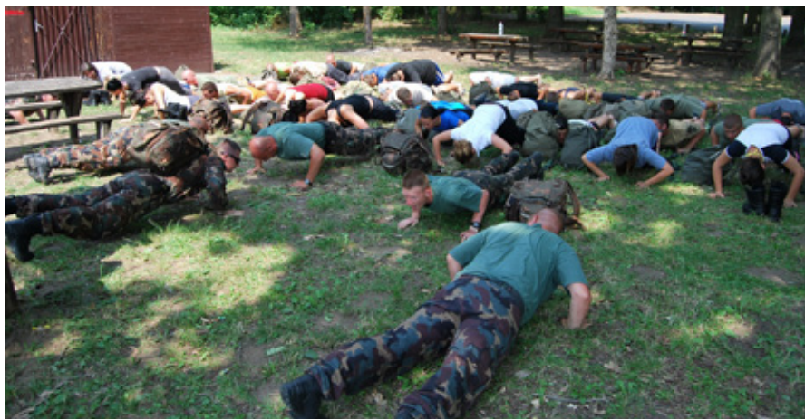
„LAZÍTÁSKÉNT” 24 FEKVŐTÁMASZ

ta több kilométeres távolságokat kellett biztosított menetben leküzdeniük ahhoz, hogy eljussanak a foglalkozási helyekre. A fiatalok emellett teljesítettek egy nyolc kilométeres menetgyakorlatot, elsajátították az álcázás, a menedékkészítés alapvető fogásait, a víznyerési és tűzrakási túlélési technikákat, megtanulták, miként kell rejtett figyelőt építeni, térkép és tájoló segítségével tájékozódni a terepen, hogyan kell alakzatban helyet, illetve helyzetet változtatni. Alapvető kézjelek használatával, csoportonként „farkasfogban” közlekedtek a gyakorlótér minden zugában. Belekószoltak a kispuskalövészetbe egy tíz kilométeres járőrverseny részeként: itt az egyes ellenőrzőpontokon katonai jellegű feladatokat kellett végrehajtaniuk. Megtanulták, hogyan kell a kézigránát elhajítani, a sebesülteket hordágyon szállítani, gyakorolták a gépkarabély szét- és összeszerelését, kipróbálhatták magukat íjászat és lapos kűszás közben, katonai felszerelési tárgyakat kellett megtalálniuk egy füsttel telített épületben, miközben gázálcot viseltek.