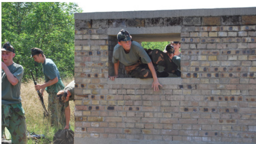
AZ AKADÁLYPÁLYA LEKÜZDÉSE KÖZBEN

Sorakozó, katonai tiszteletadás, testnevelési foglalkozás, menetgyakorlat, takarodó, körletszemle – a katonaelet minden szépségét és nehézségét megismerték azok a középiskolások, akik részt vettek a „KatonaSuli” program egyhetes túlélőtáborán, Debrecen térségében. Negyven diák bizonyította rátermettségét a Vekeri-tónál rendezett programon.