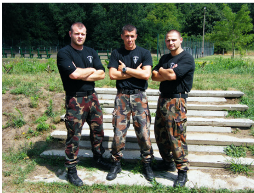
HÁRMAN A RÉSZTVEVŐK KÖZÜL

Az ébresztőt követően egyórás reggeli testedzés következett: a harcosok rótták a kilométereket, autót húztak, fekvőtámaszt nyomtak. Tisztálkodás után a reggeli elfogyasztása szakította meg a fizikai terhelést. A délelőtti edzéseken a technikai oktatás mellett nagy hangsúlyt kapott az erősítés