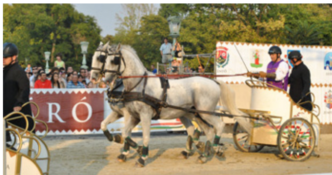
AZ IDÉN ÚJ VERSENYÁG INDULT, A FOGATVÁGTA