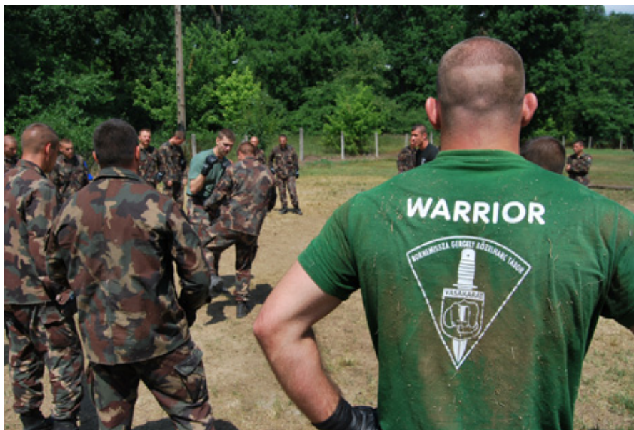
IMMÁR HARMADIK ALKALOMMAL RENDEZTÉK MEG A TÁBORT

és a mozgáskoordináció-fejlesztés, amelyeket az egyre szélesebb körben elterjedő cross-fit gyakorlatokkal kiegészítve hajtottak végre. Az ebédidő adott újabb alkalmat a pihenésre. Szükség is volt a