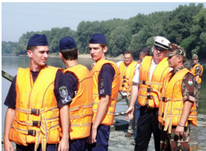
A VENDÉGEK „VÍZKÖZELBŐL” ISMERKEDTEK MEG A HIDÉPÍTŐ SZÁZAD KATONÁINAK MUNKÁJÁVAL

Nemzetközi kapcsolatok tekintetében is kiemelkedő feladataink vannak – nemcsak NATO katonai, hanem határ menti katasztrófavédelmi területen is. Közel két hónappal ezelőtt zajlott a „Tisza 2011” háromnemzeti katasztrófavédelmi gyakorlat Romániában, melyen magyar, szerb és román műszaki katonák hajtottak végre bonyolult törzsvezetési és katasztrófavédelmi tevékenységet, sikerrel. A katasztrófák azt bizonyítják, hogy fontos a jó kapcsolat a társ fegyveres testületekkel, és ahogy a katasztrófa nem ismer határokat, úgy a segítség sem fog. A gátakon már többször bebizonyosodott, hogy összetartással életek, értékek menthetők.