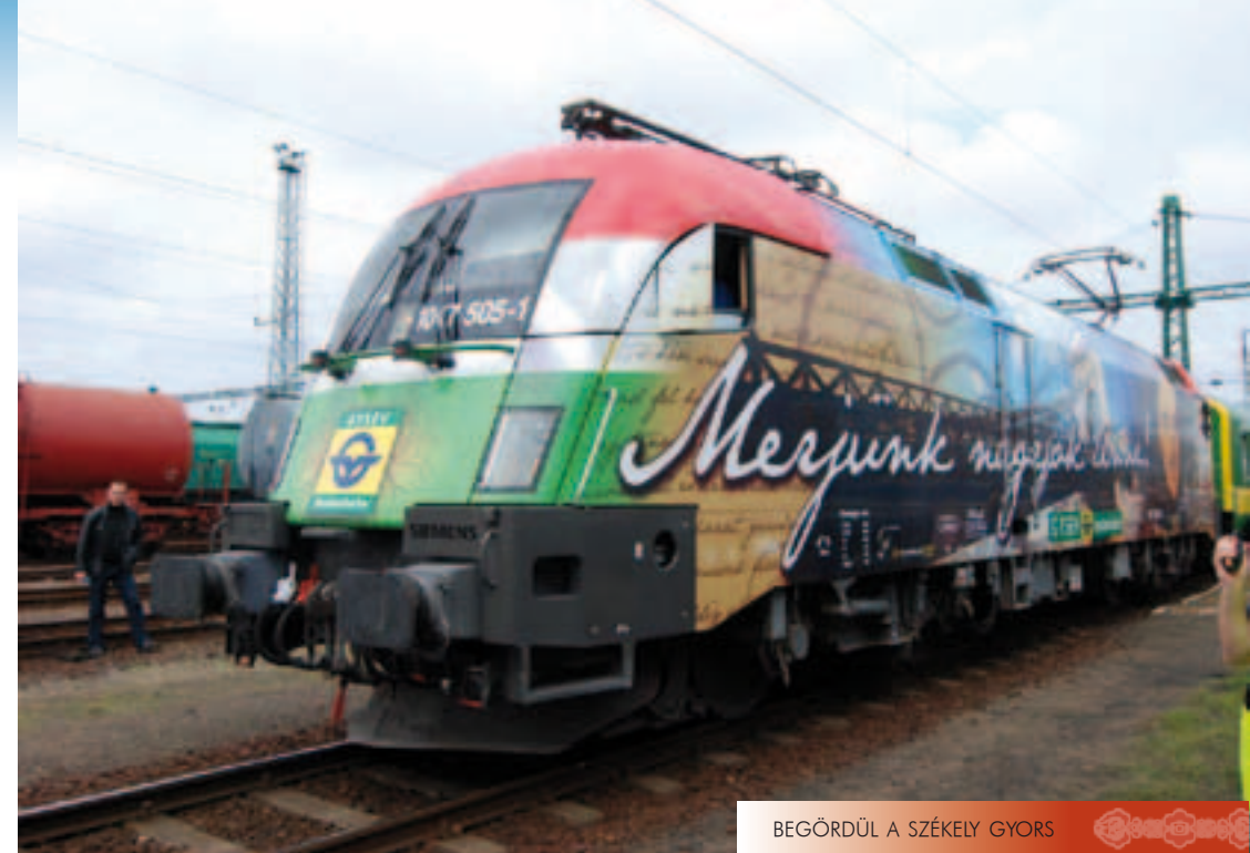
BEGÖRDÜL A SZÉKELY-GYORS

Az „eredmény”: a közösségek hiánya, a mindennemű emberi összetartozásban az a mélyülő deficit, ami a társadalom szövetét egyre nagyobb mértékben roncsolja. Ezekre a súlyos kihívásokra kereste a választ többek között a 2002–2003-ban indult polgári körök mozgalma, amelynek alapvető célja a helyi társadalom építése volt. Ez a mozgalom betöltötte hivatását – a polgári gondolatot többségi helyzetbe hozta. Ma viszont többre van szükség: az egész társadalmat kell magasabb szinten újjászervezni, alkalmassá téve az újjáépí-