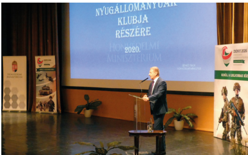
Dr. Benkő Tibor honvédelmi miniszter a Stefánia Palota – Honvéd Kulturális Központban kezdte országjáró tájékoztató előadássorozatát

Február 17-én, az előadás előtt a Stefánia Palota Zászlós termében a 29 tagozatelnök várta a minisztert, aki kézfogással üdvözölte őket. A színházterem