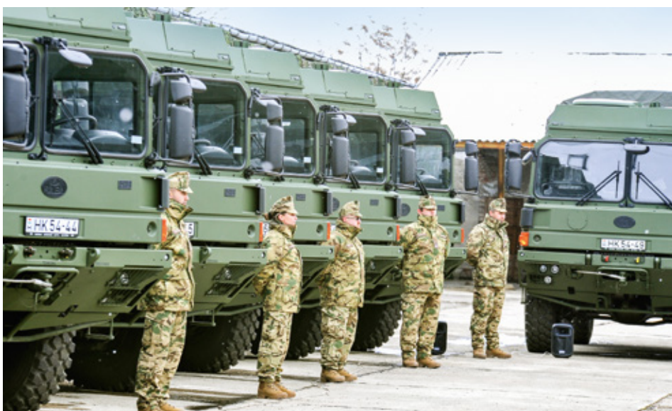
A haderő új tehergépjárműveit a Rába gyártotta