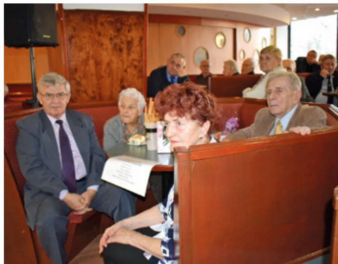
A résztvevők nagy érdeklődéssel hallgatták az előadót

akkor itt teremnek a NATO-csapatok és visszaverik (helyettünk) az agresszort. Erről XIV. Lajos francia király kijelentése jut eszembe mindig: „Bízzál Istenben, de tartsd szárazon a puskaport”. Nos, a mi esetünkben az Istent talán a NATO helyettesíthetné, de a Magyar Honvédségnek kell felelnie az ország szuverenitásának megőrzéséért. Azaz, jó volt hallani, hogy nem a külső segítségben kell bízunk, nem csak arra kell számítanunk, hanem rövid időn belül el kell érünk, hogy haderőnk a térség meghatározó fegyveres erejévé váljon. Más fontos üzenete is volt ennek az előadásnak! Beigazolta, hogy a katonai vezetés fontosnak tartja a folyamatos,