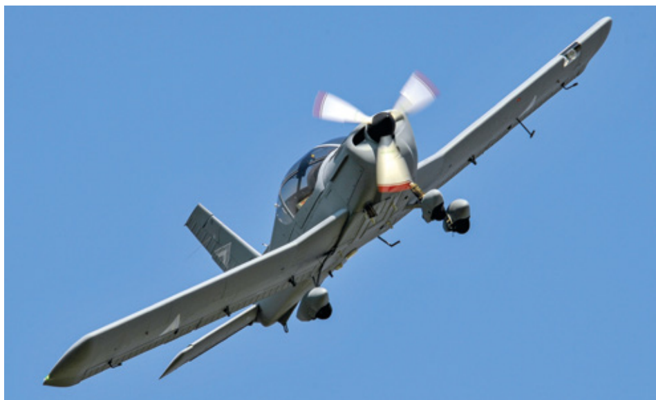
A leendő pilóták felkészítését szolgáló Zlin típusú kiképző repülőgép