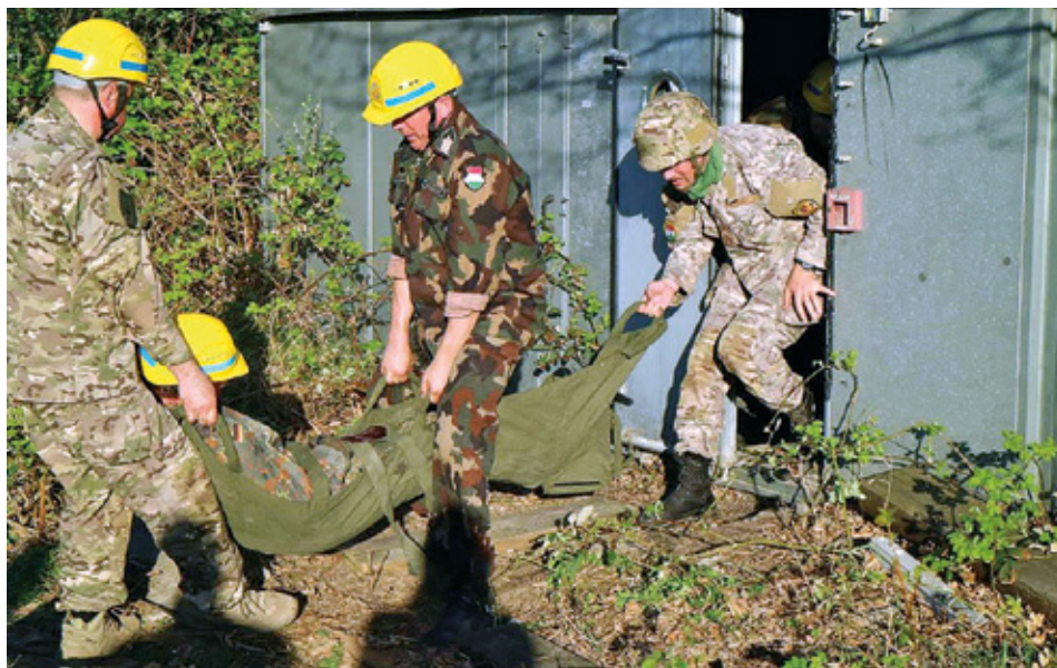
A Berlini Fal járőrszerenyen 2018-ban

ményi lebonyolításában; egyéb hazafias-honvédelmi nevelést szolgáló pályázatokon; a Doni Emléktúra szervezésében; lövészetvezetésben; túravezetésben, tereptanoktatásban; járőrszerenyek szervezésében; táboroztatásban; önvédelmi és sportfoglalkozásokban; hagyományőrzésben; hadisírgondozásban; honvédelmi jellegű szakkörök vezetésében; a Magyar Tartalékosok Szövetségével kapcsolatos ismeretek átadásában; foglalkozás-látogatások szervezésében; tanácsadásban, mentorálásban; instruktori, oktatói feladatokban.