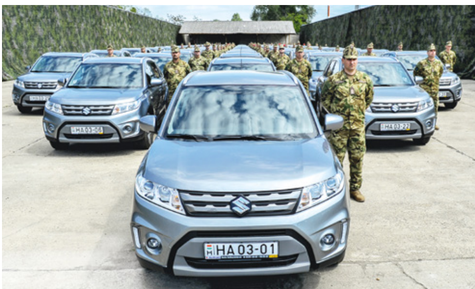
A Suzuki Vitarák váltották a honvédség előregedett személyautóit

A Magyar Honvédség alakulatai 2018 tavaszától több lépcsőben új Rába