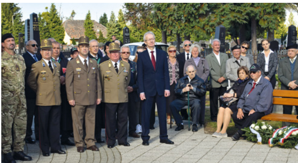
A találkozó résztvevői