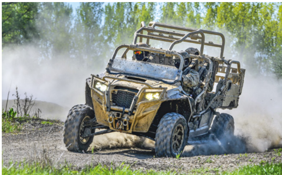
Polaris MRZR 4 típusú ultrakönnyű taktikai jármű

kap az egyéni felszerelés, a ruházat, a fegyverzet és a haditechnikai eszközök modernizációja, cseréje, beszerzése. Utóbbit illetően – már csak a terjedelmi határok miatt is – szinte lehetetlen minden egyes tételt felsorolni, a jelentősebbek zömét azonban igyekszünk bemutatni.