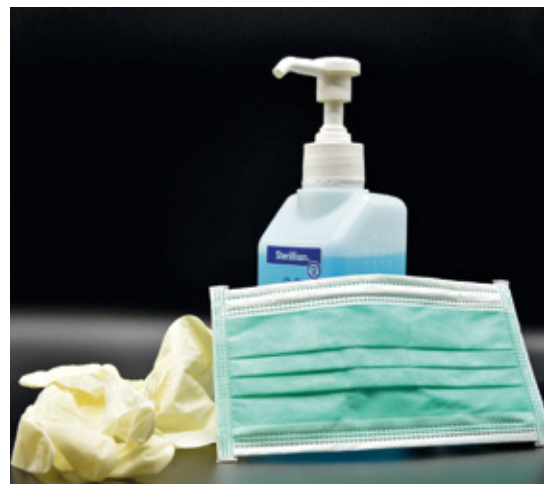
A védekezés alapvető eszközei: maszk, kesztyű, kézfertőtlenítő

A 2020-as COVID-19-járvány első regisztrált magyarországi esetét március 4-én jelentette be Orbán Viktor miniszterelnök, mint a Koronavírus-járvány Elleni Védekezésért Felelős Operatív Törzs irányítója.