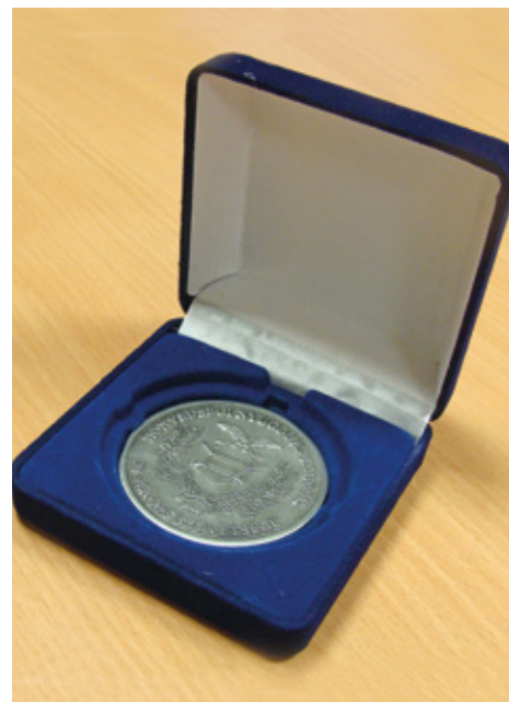
A jubileumi emlékérem

A szövetség mindenkor nagy figyelmet fordított és fordít a honvédelem ügye iránt elkötelezett civil szervezetekkel történő együttműködésre, így a Bajtársi Egyesületek Országos Szövetségével, a Honvédszakszervezettel, a Honvédség és Társadalom Ba-