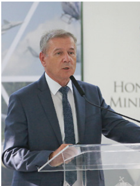
Honvédelmi miniszterünk Debrecenben

Az erős személyi állomány megteremtéséhez szükség van egy tudatosan és következetesen végrehajtott katonai életpályamodell megteremtésére és fenntartására, mely megfelelő anyagi és erkölcsi megbecsülést biztosít a hadseregben szolgáló minden katona számára. (Itt emlékeztetett az ideit – minden fegyveres szolgálatot teljesítő személyre érvényes – 500 ezer forintos pluszilletmény kifizetésére, melyet háromévenként meg akarnak ismételni,