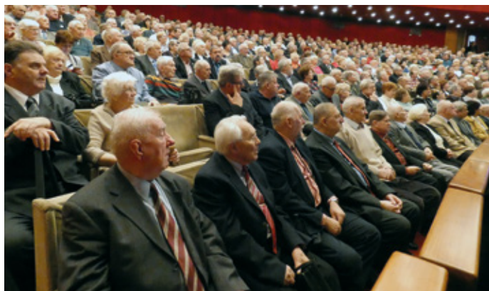
A széksorokat zsúfolásig megtöltötték az érdeklődők

Négy fő témát jelölt meg: a Magyar Honvédség elmúlt 30 éve; biztonsági