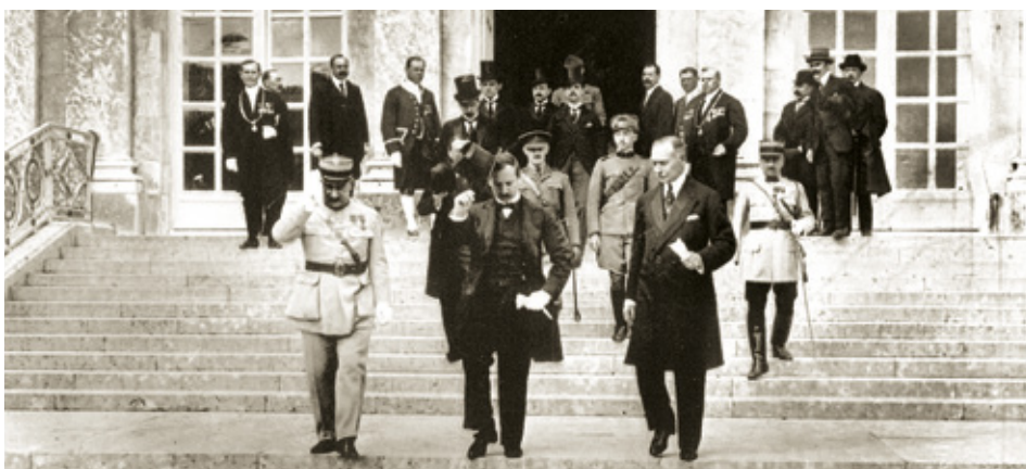
A szerződés aláírását követően a magyar küldöttség távozik a Nagy-Trianon palotából

A delegáció hazaérkezése után a magyar szakértők újabb jegyzékeket készítettek és küldtek a békekonferencia Legfelsőbb Tanácsának, amely azokat 1920. február 25-én vette először napirendjére. Lloyd George, illetve Francesco Nitti olasz miniszterelnök ekkor egyaránt a magyar észrevételek alapos megfontolását ajánlotta. A francia miniszterelnök, Alexandre Millerand azonban a kérdés bármilyen újratárgyalását fölöslegesnek tartotta: álláspontja az volt, hogy a magyar békeszerződéssel kapcsolatos minden addigi döntést változtatás nélkül érvényesnek kell tekinteni. A Legfelsőbb Tanács március 3-i ülésén Lloyd George ismét visszatért a magyar határok ügyére. Pontos statisztikai adatokat citálva mutatott rá, hogy a békeszerződés hárommillió magyart tervez idegen uralom alá helyezni, és ezt „nem lesz könnyű megvédeni”. Nem lesz béke Közép-Európában – jövendölte –, „ha utólag kiderül, hogy Magyarország igényei jogosak, és hogy egész magyar közösségeket úgy adtak át Csehszlovákiának és Erdélynek (sic!), mint egy-egy marhacsordát csak azért, mert a konferencia elutasította a magyar ügy megvitatását”.