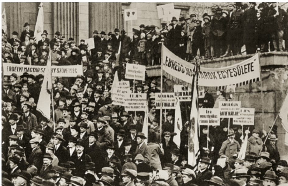
A békediktátum ellen országsszerte hatalmas tiltakozó megmozdulások szerveződtek

seleí előtt szóban is kifejtette a magyar álláspontot. A mintegy másfél órás ülés keretében a veterán politikus franciául és angolul szólt a jelenlévőkhez, majd röviden olaszul is összefoglalta mondanivalóját, melynek lényege ugyanaz volt, mint az „előzetes jegyzékeké”: a történelmi Magyarország egységének fenntartása.