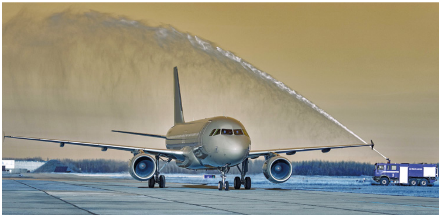
Az A319-esekkel megújult a légi szállítóképesség

A honvédelmi rendszer legfontosabb elemeként a fejlesztések középpontjában az ember, a katona áll. Lényeges cél, hogy a hazát hivatásszerűen szolgálók anyagilag és erkölcsileg egyaránt el legyenek ismerve, számukra biztos megélhetést és kiszámítható jövőképet nyújtsanak. Emellett természetesen kiemelt figyelmet