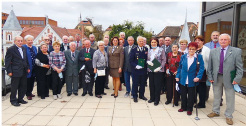
Az idők napi rendezvény résztvevői