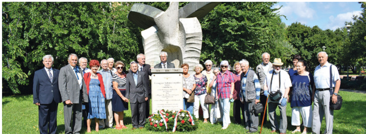
Emlékfotó a megemlékezés résztvevőiről