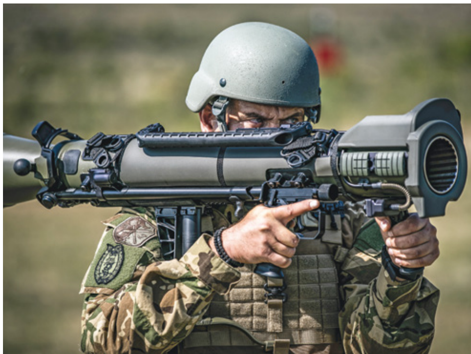
Carl Gustaf M4 típusú, vállról indítható rakétahajtású gránátvető

teherautókkal és korszerű Suzuki Vitara gépjárművekkel gazdagodtak; ezek a beszerzések a hazai ipart, illetve hadiipart is erősítették, ami szintén a modernizációs program egyik kiemelt célja. Ugyancsak ekkor vette használatba az MH 2. vitéz Bertalan Árpád Különleges Rendeltetésű Dandár is az amerikai gyártmányú, Polaris MRZR 4 típusú ultrakönnyű taktikai járműveket, amelyek – méretükből és egy tonna alatti tömegükből adódóan – mind belső, mind külső függesztett teherként szállíthatók légi úton, s akár ejtőernyővel is kijuttathatók a művelési területre.