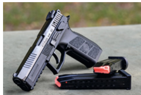
CZ P-09 pisztoly

zadi hadviselés követelményeinek megfelelő – az Afganisztánban szerzett tapasztalatok felhasználásával készült – új Leopard 2A7+ nehézharckocsival, huszonnégy PzH 2000 önjáró löveggel, valamint az ezekhez tartozó kiegészítő eszközökkel (WiSENT 2 típusú, műszaki mentőként is alkalmazható speciális, többcélú, lánctalpas, illetve LEGUAN hídvető) és szolgáltatásokkal gyarapodik a Magyar Honvédség. A Leopard 2A7+ első példányai 2023-ban érkeznek, addig az átmenetet a típus A4-es változata jelenti, melyből – kiképzési célokra – tizenkettőt lízingelünk.