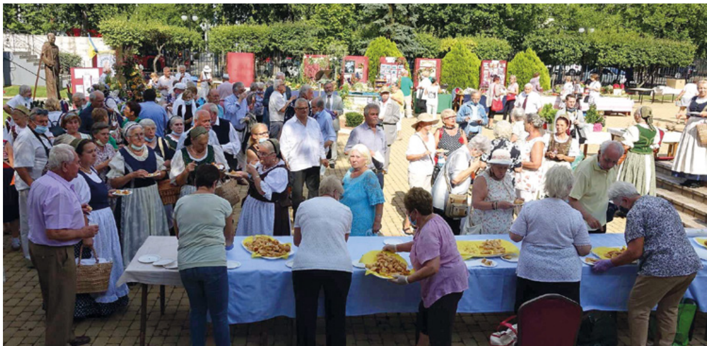
A résztvevők a Stefánia Palota udvarán

udvarra telepíteni. Dicsérte a vendégek asztalait, majd megjegyezte: jó lenne, ha a jövőben is megjelenének a kiállításainkon azok a vidéki és budapesti kertbarát körök, amelyek erre készíttést éreznek. Ezután Radványi Imréné, tagozatunk elnöke, a Budapesti Kertbarát Szövetség vezetőségi tagja emlékezett meg Bálint Györgyről egy személyes hangú búcsúlevéllel, úgy, hogy a háttérben vetített képek jelentek meg Gyuri bácsi életéről, tagozatunkban végzett munkájáról, 100. születésnapja ünnepléséről. A következő szónok Erős Miklós volt, aki 50 éve elnöke az Esztergomi Kertbarát Körnek. Ismertette a mozgalomnak még az 50 év előtti történetét is, az eredményeket, a nehézségeket, a pénzügyi gondokat, a beszűkült lehetőségeket, de mint mondotta, „az emlékek szépek, és van mire büszkének lenni”.