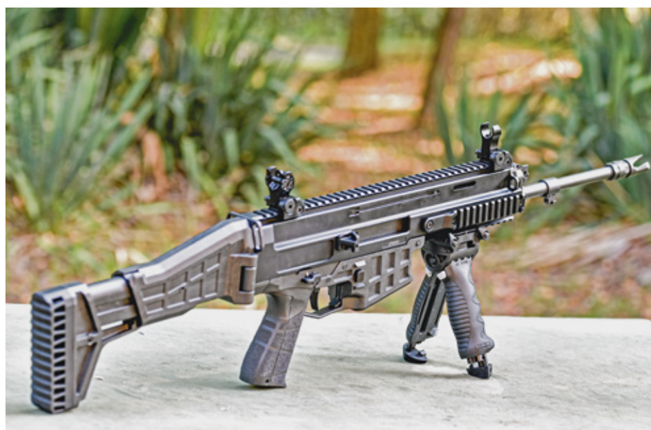
A cseh licenc alapján gyártott BREN 2 gépkarabély