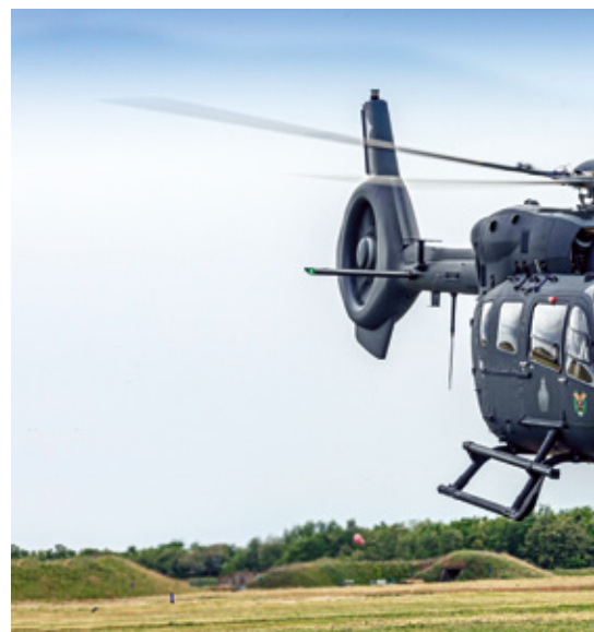
A H145M-ből összesen húszat vásárolt hazánk