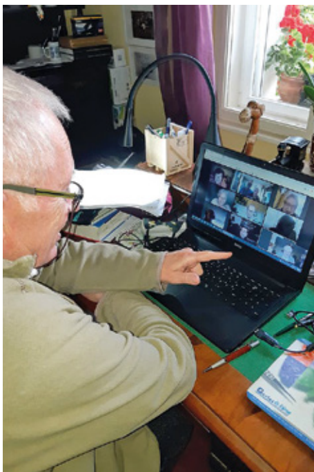
A BNYK Közlekedési Tagozata online konferenciát tart

A kutatásból levonható legfontosabb következtetés: a hatóságoknak következetesen meg kell követelniük a szabályos (orrot és szájat eltakaró) maszkviselést, annak ellenére, hogy a járvány kezdeti szakaszában általánosan hirdették: a maszk nem bennünket, hanem embertárainkat védi meg a fertőzéstől.