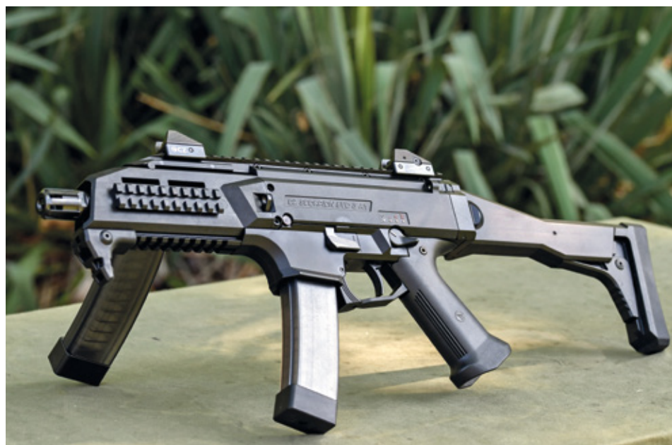
Elsőként a katonai rendészek kaptak a SCORPION géppisztolyból