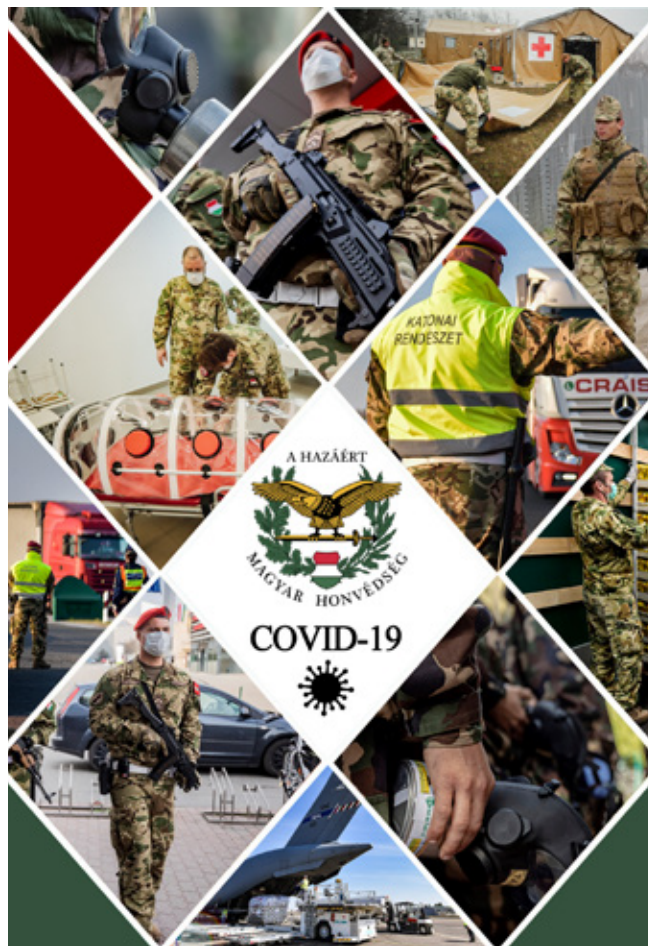
A járvány első szakaszában a katonák által végzett feladatokról az alábbi linken elérhető kiadványból tájékozódhatnak: https://honvedelem.hu/hirek/covid-19.html

Mára a maszkviseléssel kapcsolatos felfogás is megváltozott. Bebizonyosodott, hogy a maszk lecsökkenti a vírus bejutását a szervezetbe, és ezáltal csökkenti a fertőzés kialakulásának veszélyét.