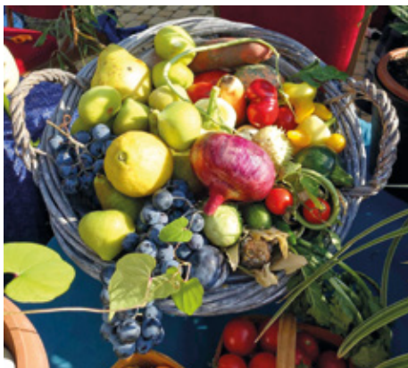
Egy kis ízelítő a kiállított terményekből