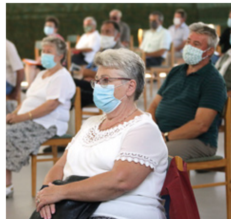
A koronavírus-járvány kialakulása után minden helyszínen szigorúan betartották a járványügyi előírásokat

A regionális miniszteri tájékoztatók Kaposvár, Székesfehérvár, Kecskemét, Debrecen, Szolnok, Győr és Budapest helyőrségekké folytatódtak volna, azonban az ez év tavaszán megjelenő koronavírus-járvány miatti veszélyhelyzet kihirdetése közbeszólt, s így csak a március 3-i