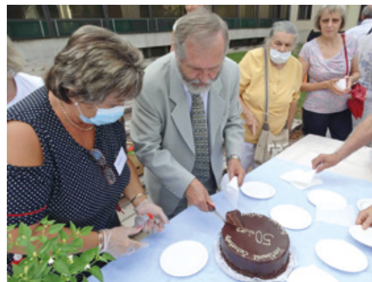
A születésnap tortája megszegése

A program szerint 11 órakor a Himnusz hangjaival kezdődtek a további események a színházteremben. Ide elsősorban csak azok jutottak be regisztráció után és színházjegy birtokában, akik valamilyen elismerésben fognak részesülni. A megjelenteket