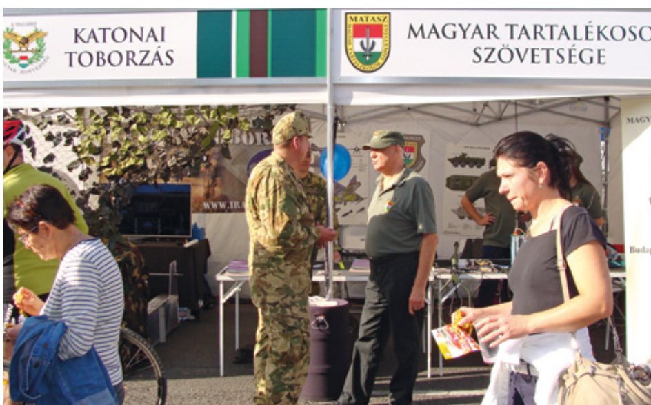
Tagtoborzás a 2019-es Nemzeti Vágtán

A MATASZ szerepvállalása: a tudás és a tapasztalatok átadásával segíteni az ifjúságot. Szervezetünk aktívan részt vesz: a fiatalság nevelésében (a toborzóirodákkal közösen keressük fel az intézményeket); projekthetek kidolgozásában, megszervezésében, lebonyolításában; az „Egy nap a honvédelemért!” intéz-