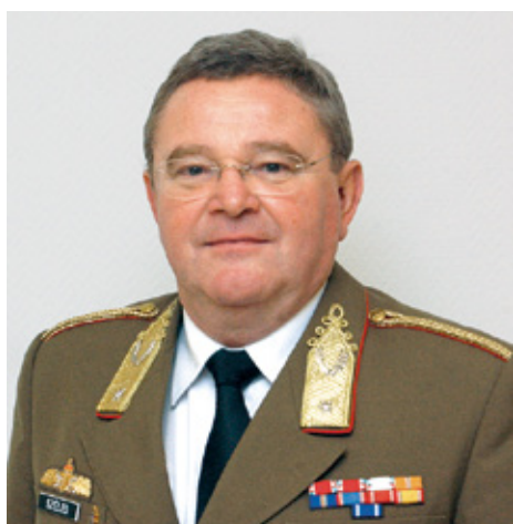
Széles Ernő ny. dandártábornok, a MATASZ elnöke

A honvédelem nemzeti ügy. Hazánk védelme mindannyiunk közös ügye, amelyért a társadalom egészének tennie kell. Fontos, hogy gyermekeink, a jövő nemzedék tagjai a haza szeretetét, a katonai hagyományok ápolását minél szélesebb körben megismerhessék, a haza biztonságát, a védelem eszmeiségét magukénak vallják.