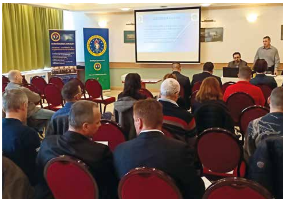
Alapítványi rendezvény, 2020. március 6-án