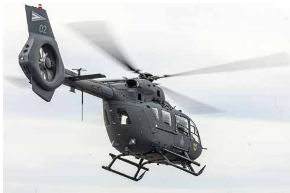
Összesen húsz Airbus H145M típusú helikopterrel bővül a honvédség forgószárnyas flottája a Honvédelmi és Haderőfejlesztési Program keretében