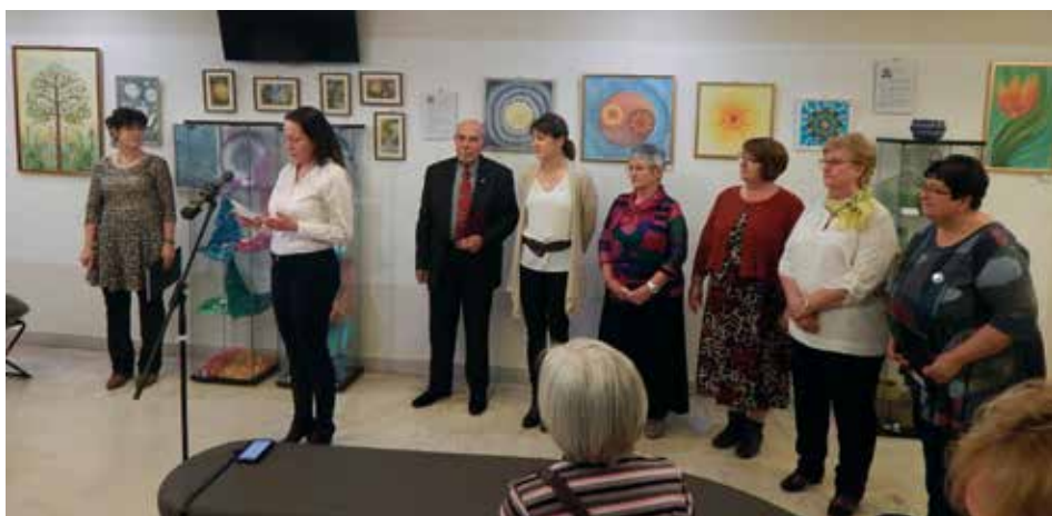
Képzőművészeti kiállítás megnyitója