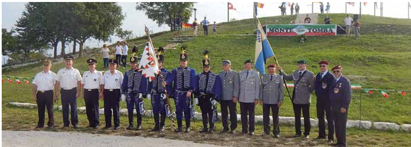
Olaszországban bajtársi találkozón

bejegyzett egyesületté váltak. Az egyesületi státusszal létrejött nonprofit civil szervezet célja – az országos szövetséghez kapcsolódva – a Magyar Honvédség tartalékos állományának segítése toborzással, képzésekkel és programokkal. Tevékenységével elősegíti a haza védelme társadalmi támogatottságának erősítését; az iskolákban és a különböző klubokban való aktív jelenlétével támogatja a fiatalok és a polgári lakosság körében a hazafias és honvédelmi nevelést, képzést.