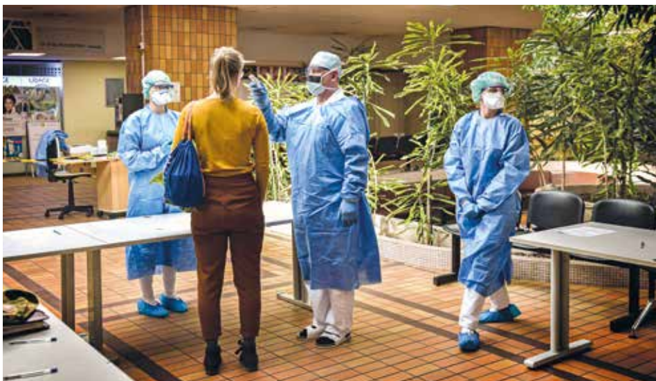
A testhőmérséklet-mérés a napi rutin része

Csak ugyanazt, ami már a vízcspából is folyik. Ha nem muszáj, ne menjenek sehová. Ám, ha ez mégis elengedhetetlen, akkor viseljenek maszkot, ügyeljenek arra, hogy tartsák a minimum másfél méteres távolságot más emberektől, és lehetőség szerint gyakran mossanak kezet vagy fertőtlenítsenek. Emellett azt is kérném mindannyiuktól – bár ez az előbb elmondottak alapján egy kicsit furcsának fog tűnni –, hogy az éves szűrővizsgálataikkal várjanak még pár hónapot. Jó esély van rá, hogy a késő tavaszi időszakra csökkenni fog a járvány intenzitása. Addig amúgy is csak hosszabb várakozási idővel lehet részt venni a szakorvosi vizsgálatokon.