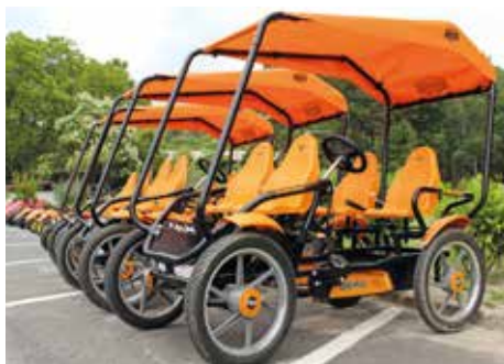
Vendégekre várnak az új limbó hintók

2019-ben és tavaly sem télenkedett az alakulat: tovább folytattuk a beszerzéseket, az előző években megkezdett felújításokat, karbantartásokat és korszerűsítéseket. A faház pihenő új kerítést kapott, területén biztosítottuk a teljes wifi-lefedettséget. A szállodai szobák komfortfoko-