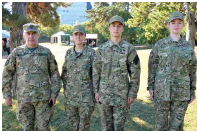
Iskolai apródképzésben részt vevők egy honvédelem napi rendezvényen

A szervezet életében jelentős dátum volt 2015, amikor a bíróság elfogadta az új alapszabályukat, így hivatalosan