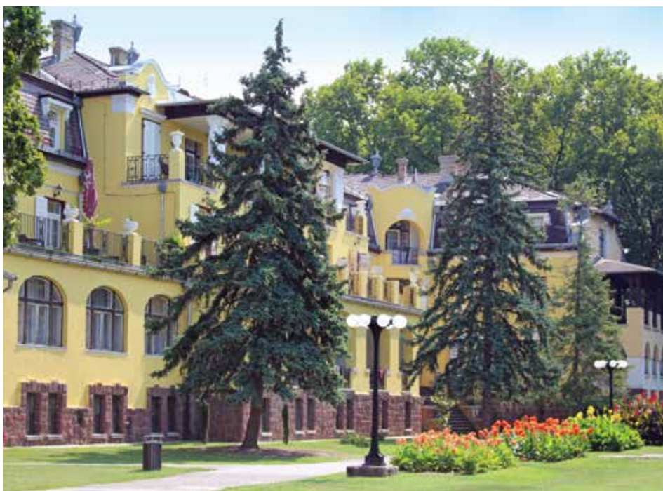
Folytatódott a szállóépületek külső-belső megújítása

A balatonakarattyai központ a megalapítását követő négy emberöltő alatt hol népszerű pihenőhelyként, hol katonai szervezatként működött, s szinte minden területen folyamatosan változott, korszerűsödött. 2015-ben minőségi változások kezdődtek a rekreációs komplexum életében. Új részlegek jöttek létre, melyek élére jól felkészült, az ügy iránt elkötelezett felelős beosztású vezetők kerültek, akiknek összefogása elengedhetetlen volt akkor – és ma is az – a fejlesztések menedzseléséhez. A szervezeten belül kialakított feladatközpontú struktúra megalapozta a rekreációs központ működtetésében napjainkban már tetten érhető felfelé ívelő tendenciát. A vendégek kényelmét szolgáló átgondolt infrastrukturális fejlesztések és modernizálási erőfeszítések már