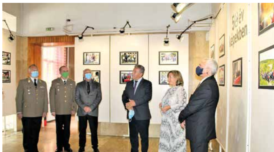
Életképek az elmúlt 50 évből

Ehhez kívánok most Önöknek egy jó alkalmat az egyesület fennállásának 50. évfordulóján. Kívánom, hogy beszélgessenek barátián, érezzék magukat nagyszerűen és valódi nyugalomban a mai ünnepnapon!”