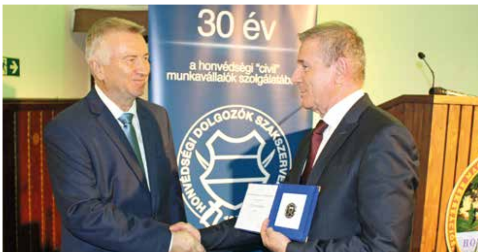
Dr. Benkő Tibor honvédelmi miniszter köszönti a 30 éves érdekvédelmi szervezetet

általunk csak felvilágosításként említett munkát végeztünk szakszervezeti tagságunk körében. Ebben a feladatban kiváló partnerre találtunk a Magyar Honvédség Szociálpolitikai Alapítványában, ma már Közalapítványában.