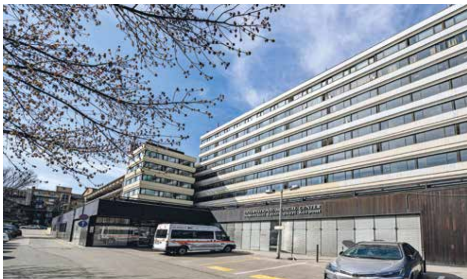
A kórházban folyó gyógyító tevékenység az egészségügy szinte teljes spektrumát lefedi

Nemcsak ők, hanem az aktív állományúak is igénybe vehetik azt a közvetlen telefonvonalat, amely a szakorvosi ellátások időpontjainak lefoglalását könnyíti meg számukra. A 06-1-885-3515-ös számot olyan kollégák veszik fel, akik segítenek abban, hogy a vizsgálatok döntő többségére két héten belül időpontot kapjanak a Magyar Honvédség aktív és nyugállományú katonái, valamint honvédelmi alkalmazottjai. Sajnos néhány képalkotó vizsgálatnál ezt az időpontot nem tudjuk tartani, de mindent megteszünk annak érdekében, hogy ezek a vizsgálatok is a lehető legrövidebb idő alatt megtörténjenek. Ha pedig már megvan az időpont és vizsgálatra érkezik a páciens, akkor a betegfelvételi irodában, a külön számukra megnyitott 13-as számú ablaknál várjuk őket, itt intézhetik el a vizsgálatok előtt szükséges adminisztrációt. Ezzel is azt szeretnénk, hogy mindenki, aki egykoron szolgált vagy jelenleg szolgál a honvédségben, érezze: a Honvédkórház az ő kórháza is.