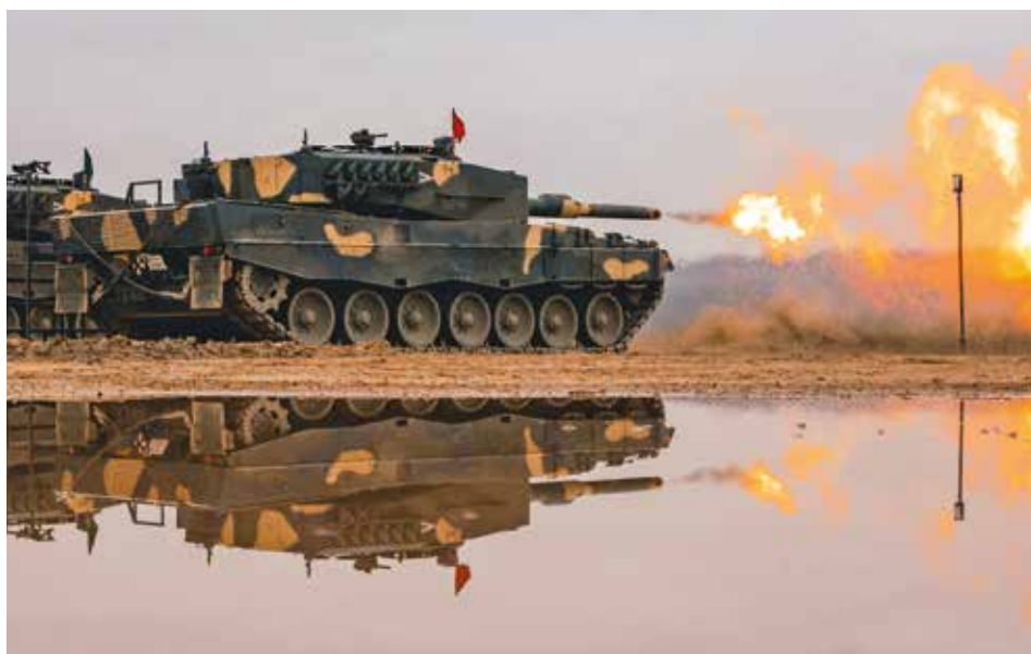
Leopard 2A4HU első éleslövészete

Megbontanám a kérdésre adandó választ. A társadalmi visszajelzések nagy többségében pozitívak: az emberek látják és jól veszik, hogy a katonákra lehet számítani, bevonhatók