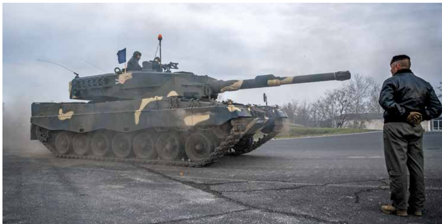
A fiatal generációban egészséges vonzalom él a hi-tech eszközök iránt. Leopard 2A4 harckocsi

Minden fiatal generációban él egy egészséges vonzalom a hi-tech eszközök iránt, amit nagyon súlyos hiba félre magyarázni, és szélsőségesnek, erőszakosnak bélyegezni. Nyugat-Európában, Skandináviában egyaránt nagyon sok