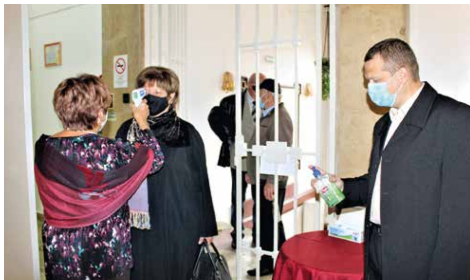
A biztonsági előírások betartása mellett érkeztek a vendégek a rendezvényre

Ezt követően Körtvélyessy Attila elnök felidézte az egyesület megalakulását, szólt a távolabbi és a közelmúltról, s megfogalmazta: az elmúlt