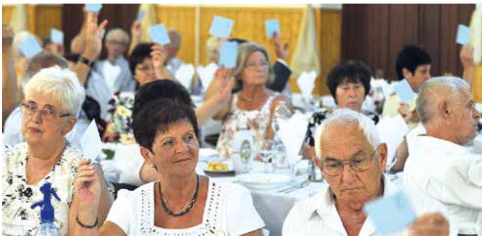
Szavaznak az egyesület tagjai