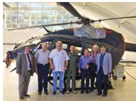
Emlékfotó a hangárban

Tapasztalt katonáknak is érdekesekkel szolgált dr. Bali Tamás ezredes. Szolgálhatott is, hiszen repüli és oktatja a Magyar Honvédségben frissen rendszeresített Airbus H145M típusú helikoptert, így igazi gyakorlati tapasztalatokról adhatott számot. A hallgatóság nem csak laikusokból állt; a megjelentek között sokan e bázisról vonultak nyugállományba, és így hasonlíthatták össze az új eszközt az általuk jól ismert, régebbi, szovjet gyártmányú típusokkal.