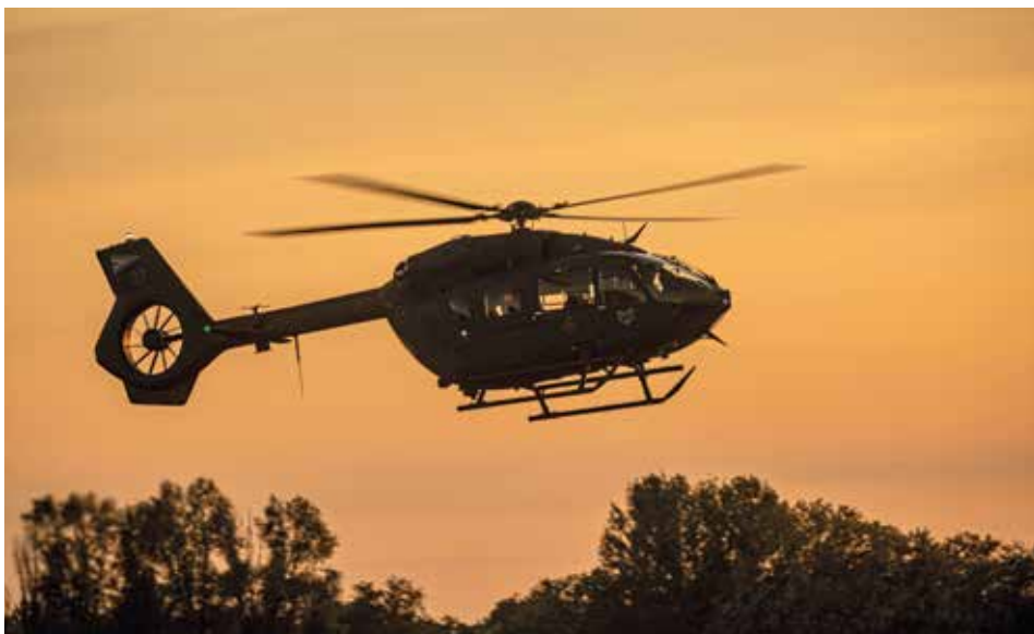
H145M helikopter naplementében

A honvédségnek erősítenie kell társadalmi kapcsolatait, és mind a fiatalok, mind az obsitosok a társadalom, az ország polgárai. Az obsitosok a rendezvényeken meg tudják mutatni, hogy még mindig hűek a maguk elé tűzött célokhoz, élethivatáshoz. Példát adnak a fiataloknak. Egyaránt segítheti a munkánkat, ha megjelennek a közösségi életben, illetve ha részt vesznek a gyakorlati és elméleti oktatásban. Ezzel most nem azt mondom, hogy az obsitos katonának azt kell tanítania, amit annak idején ő tanult, hiszen azóta sok minden változott. De elmondják, hogyan éltek meg különböző élethelyzeteket, hogyan oldották meg az adott helyzetekben jelentkező problémákat, amivel sokat tudnak segíteni, hiszen a problémamegoldó gondolkodáshoz elengedhetetlen a tapasztalatok, észrevételek, hagyományok, módszerek ismerete. Ezek alapján mindig tovább lehet lépni. Tehát a pályára irányító munkájukkal tudnak bennünket támogatni, ami egyébként az önkéntes katonai szolgálatnál is rendkívül fontos. Ezen a téren is nagyon szépen növekszik a szol-