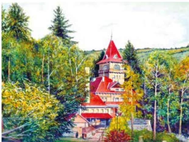
Mátraházi Honvéd Üdülő