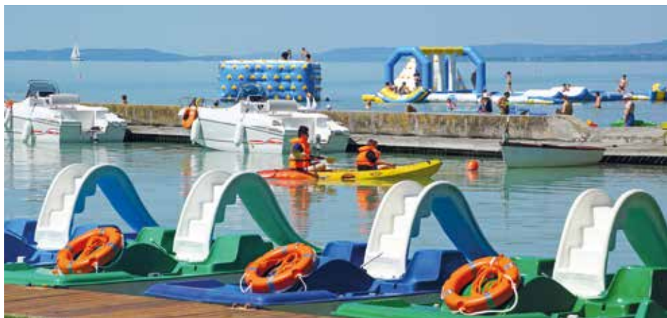
Az MH RKKK vezetése nagy hangsúlyt helyez a vízi eszközök fejlesztésére

A legfontosabb változást az egész éves nyitvatartás jelentette számunkra, mely megkövetelte a vendégek aktív pihenését garantáló szolgáltatások biztosítását minden időszakban. Az állomány sikeres erőfeszítéseit igazolta, hogy egy kérdőíves felmérés alapján a balatonakarattyai központ már ebben az évben a legnépszerűbb rekreációs helyszín lett az igényjogosultak körében.