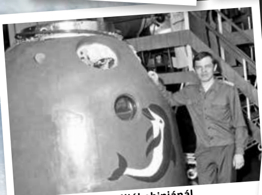
A Szojuz űrhajó leszállókabinjánál (1980, Csillagváros)