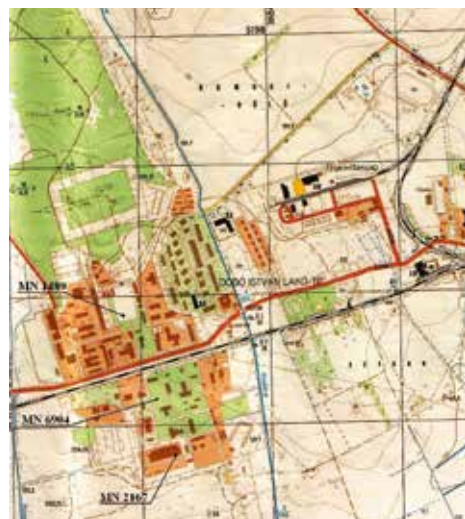
A tapolcai alakulatok elhelyezkedése

megörökítő fényképek áttekintésére, feldolgozására.