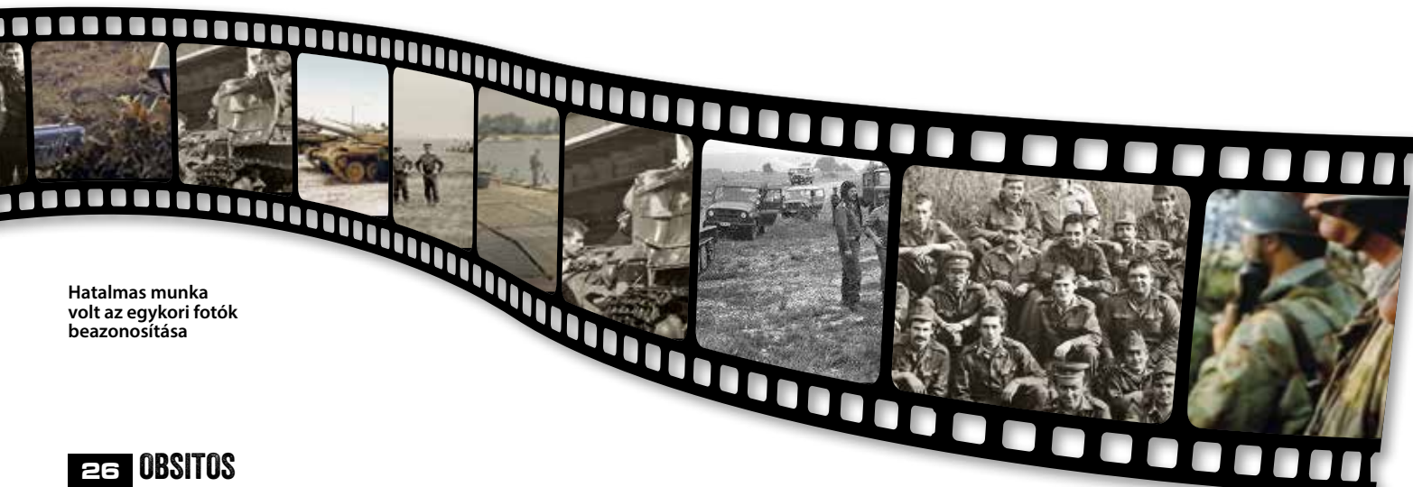
Hatalmas munka volt az egykori fotók beazonosítása