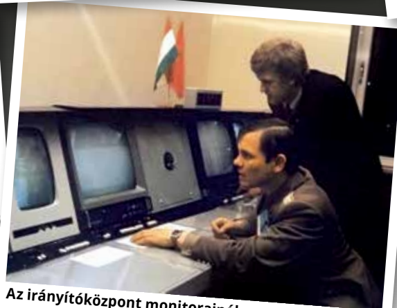
Az irányítóközpont monitorainál (1980, Csillagváros)