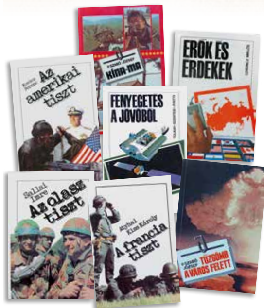
Néhány kötet a könyvszerkesztőségen töltött öt év alatt általam szerkesztettek közül

Volt, hogy mintegy 150 kötet és tucatnyi lap, folyóirat, megszámlálhatatlan egyéb kiadvány került ki a kiadó különböző műhelyeiből, szerkesztőségeiből, de akadt olyan néhány év is, amikor az alapképességek megőr-