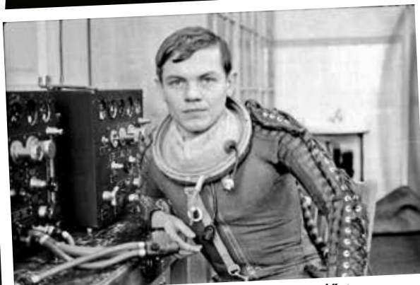
Orvos századosként magassági felszállás előtt, VKK-ruhában (1972, Leningrad)