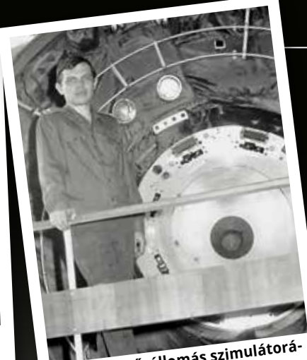
A Szaljut-6 űrállomás szimulátorának fedélzetén (1980, Csillagváros)