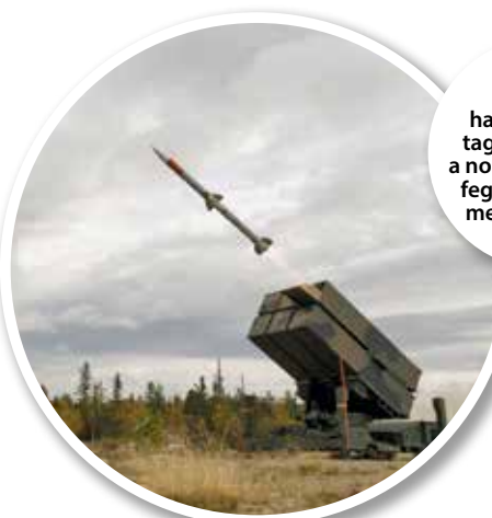
Hazánk a hatodik NATO-tagállam, amely a norvég-amerikai fegyverrendszer mellett döntött