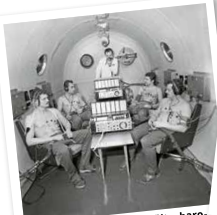
A négy legjobb űrhajósjelölt a barokkamrában