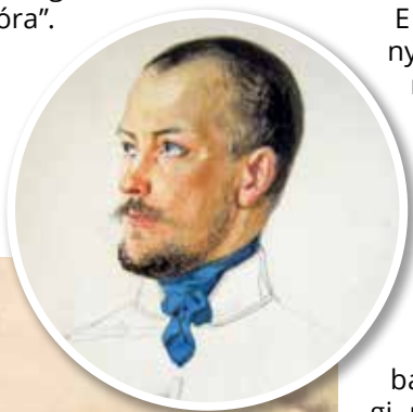
Görgei Artúr vezérőrnagy

A magyar hadvezetés a felderítési adatok alapján mintegy 40-45 ezer főnyi ellenséges hadsereggel számolt Bécs előtt, s további 12 ezer fővel Stájerországban. Egy 5-6000 főnyi hadosztály csatlakozását is várta. Kossuth szintén tisztában volt az ellenség fennmaradt erőfölényével. Ezért írta Görgeinek május 8-án, hogy Buda bevétel után csak akkor kell újabb támadást indítani, ha legalább 50 ezer főt fordíthatnak magára az „expedícióra”.