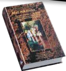
Béke poraikra... könyvsorozat a második világháborúban elesett magyar katonákról