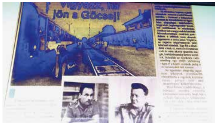
A Göcsej expresszrel kapcsolatos hírek az akkori újságokba is bekerültek