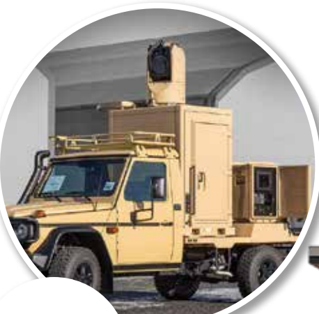
Felderítési és további képességeket biztosító elektrooptikai szenzor