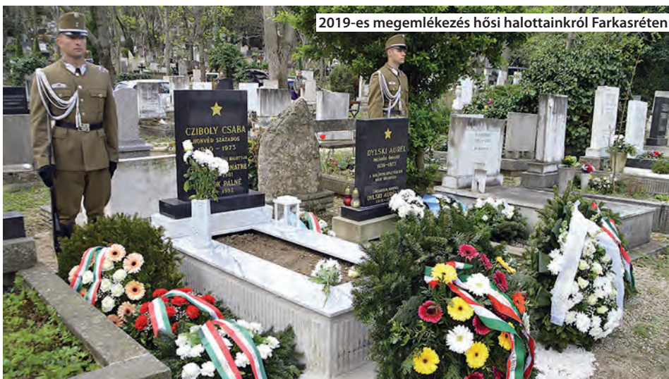
2019-es megemlékezés hősi halottainkról Farkasréten