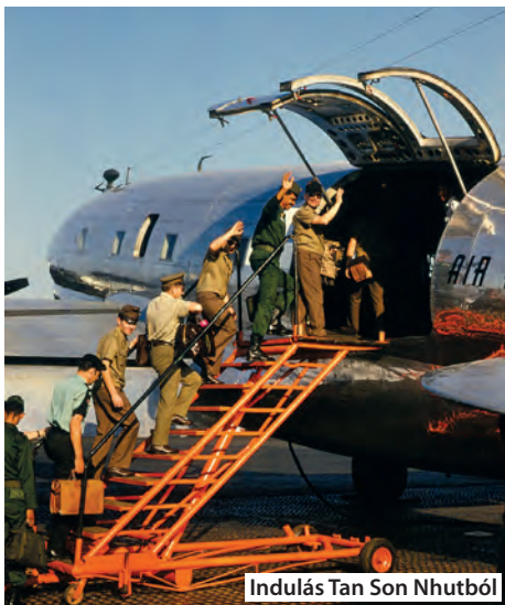
Indulás Tan Son Nhutból