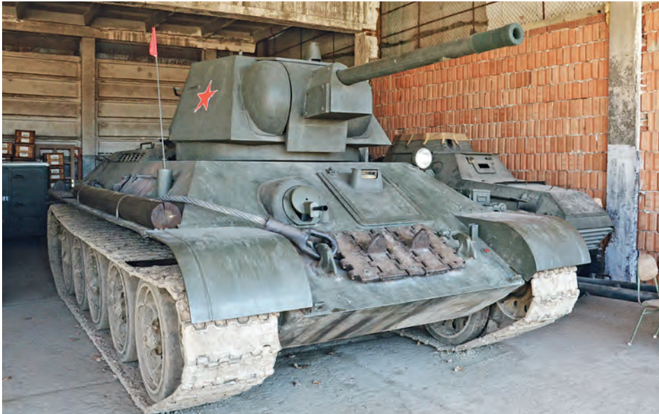
Szovjet T-34-es harckocsi