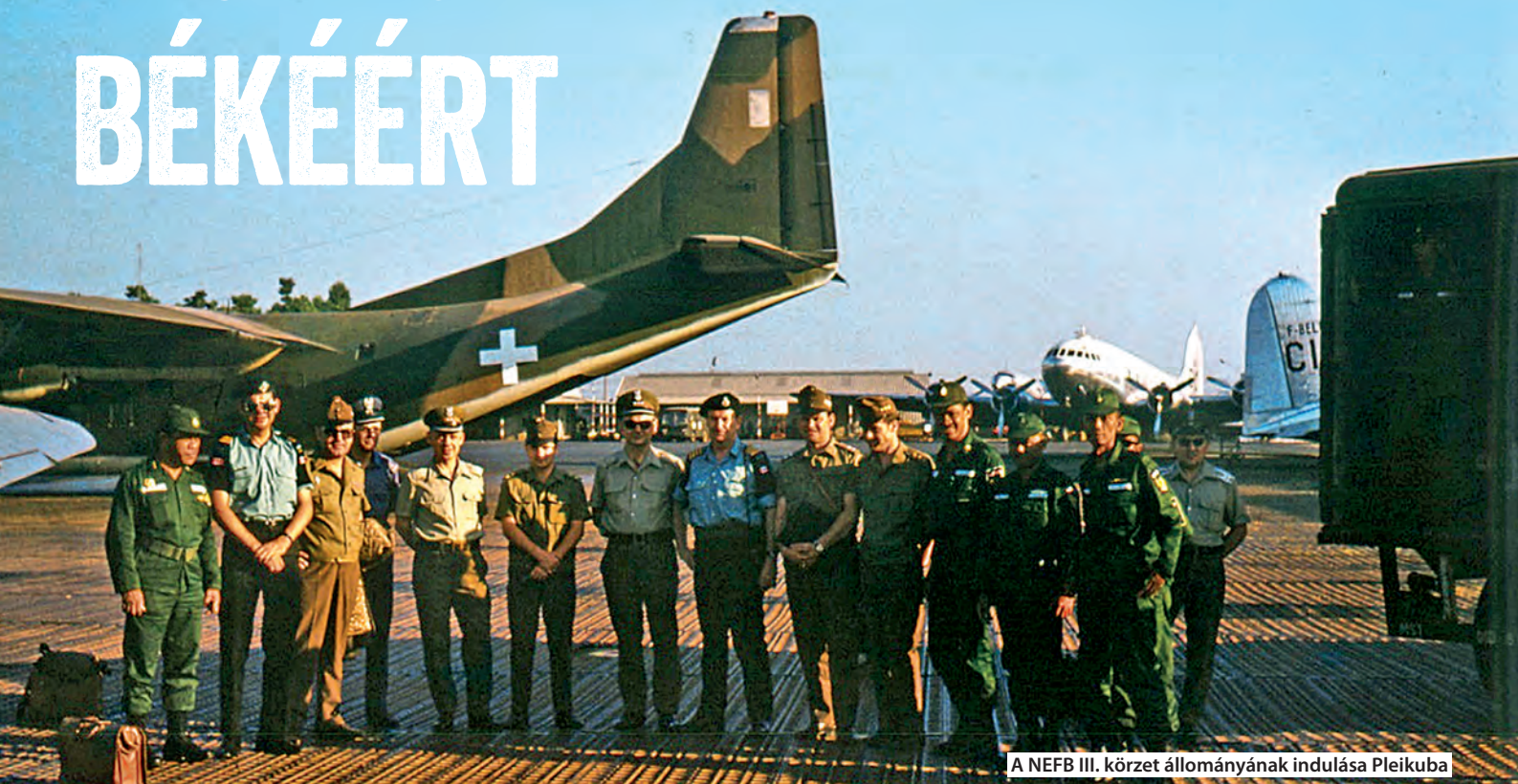
A NEFB III. körzet állományának indulása Pleikuba

Vietnám háborúktól terhes történelmének igen fontos részét képezi a 20. század. A függetlenségért harcoló hazafiak a francia gyarmati uralom, illetve a japán megszállás után 1945. szeptember 2-án Hanoiban kiáltották ki a Vietnámi Demokratikus Köztársaságot (VDK).