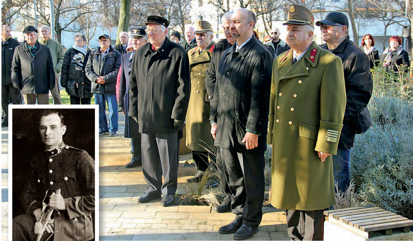
Vitéz Gidófalvy Lajos