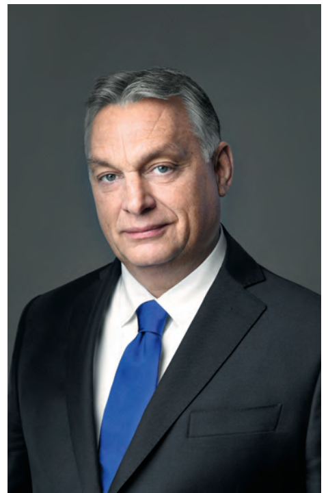
Orbán Viktor miniszterelnök

A legmodernebb haditechnikai eszközök beszerzése és a hadiüzemek létesítése azonban önmagában nem sokat ér. Nekünk, magyaroknak ma nemcsak világszínvonalú fegyverekre van szükségünk, hanem egyre több, hazáját szolgálni akaró, magasan képzett és motivált katonára is. Ennek érdekében nemrégiben elindítottunk egy toborzókampányt, melyben természetesen számítunk azokra a nyugdíjas honfitársainkra is, akik egy élet munkáját szentelték a haza védelmének, éppen ezért szakmai tapasztalatuk felbecsülhetetlen érték a magyar haderő számára. Meggyőződésem, hogy közös erővel ismét vonzó pályává tehetjük a magyar fiatalok számára a Magyar Honvédséget és a haza szolgálatát.