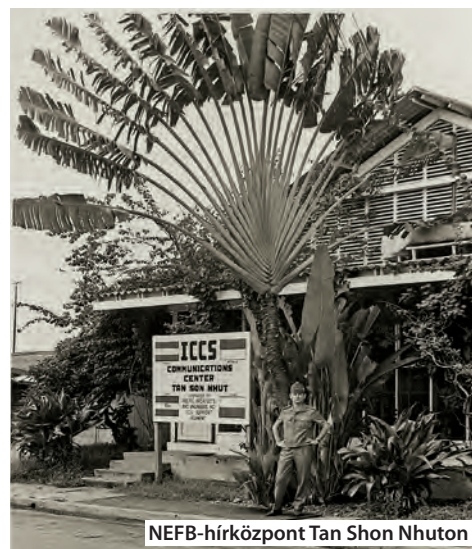
NEFB-hírközpont Tan Shon Nhuton