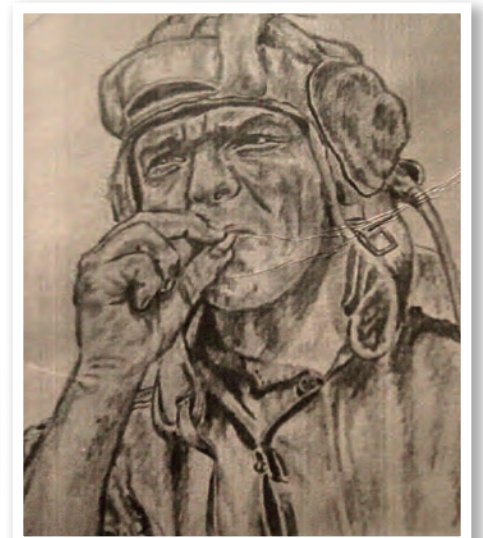
Az egykori 2. harckocsizászlóalj állományába tartozó egyik harckocsizó katona portréja