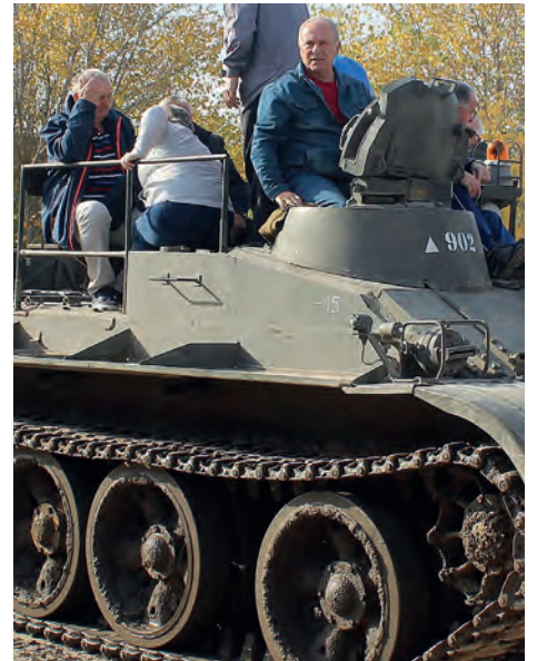
Emlékezés a régi időkre

kipróbálhatták a harckocsi vezetését, a megjelent hölgyek pedig utasként élvezhették a láncfegyverrel való kirándulást.