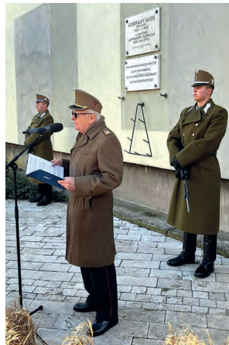
Emlékezés az embermentőre

2023. január 7-én a Budapesti Helyőrség-parancsnokság és a XIII. kerületi önkormányzat rendezvényére gyülekeztek az emlékezők a Gidófalvy utca 1-7. számú háztömb falán elhelyezett emléktábla előtt. Vitéz Gidófalvy Lajos ezredes születésének 122. és hősi halálának 78. évfordulóján emlékeztünk a hős parancsnokra, aki egész életével és hősi halálával is hazáját és az emberiség igaz ügyét szolgálta.