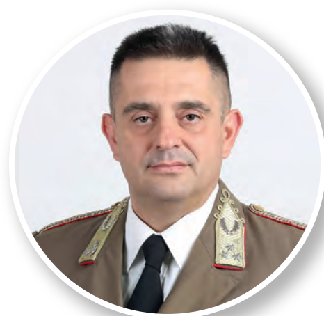
Dr. Böröndi Gábor altábornagy

zett, felszerelt tagja a NATO-nak. Hozzátette: a cél az, hogy a magyar katonai hagyományokon alapuló, erős, hadműveleti és stratégiai szinten befolyásolni képes haderőt hozzanak létre. A tábornok elmondta: katonai pályája során megértette, hogy a kiképzés, felkészítés nélkül a legjobb technika sem működik. Szólt arról is, hogy a Magyar Honvédséget vezetni megtisztelő, ugyanakkor óriási felelősség. „Ez egy csapatmunka, a katonák, beosztott parancsnokok támogatása, hitvallása, elkötelezettsége nélkül nem lehetséges” – fogalmazott.