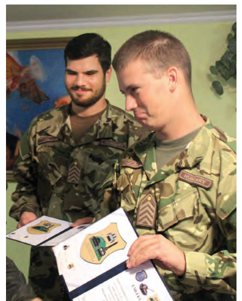
Ludovikás tisztjelöltek a találkozón