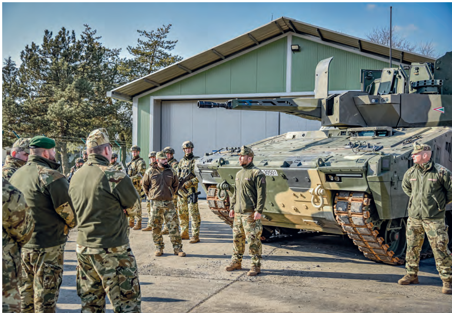
A hódmezővásárhelyi katonai szervezetnél állítják elsőként rendszerbe a Lynxet

borzóerővel bír. Mindenki szeretne vele dolgozni, ami nem is csoda. A Lynx egy rendkívül jól alakítható eszköz, erős alappáncélzattal, valamint olyan különleges moduláris védelemmel rendelkezik, amelyet csak a legújabb rendszerek tudnak. A fegyverzete annyira precíz és félelmetes, hogy a katonák csak 30 milliméteres mesterlővézpuskának becézik.”