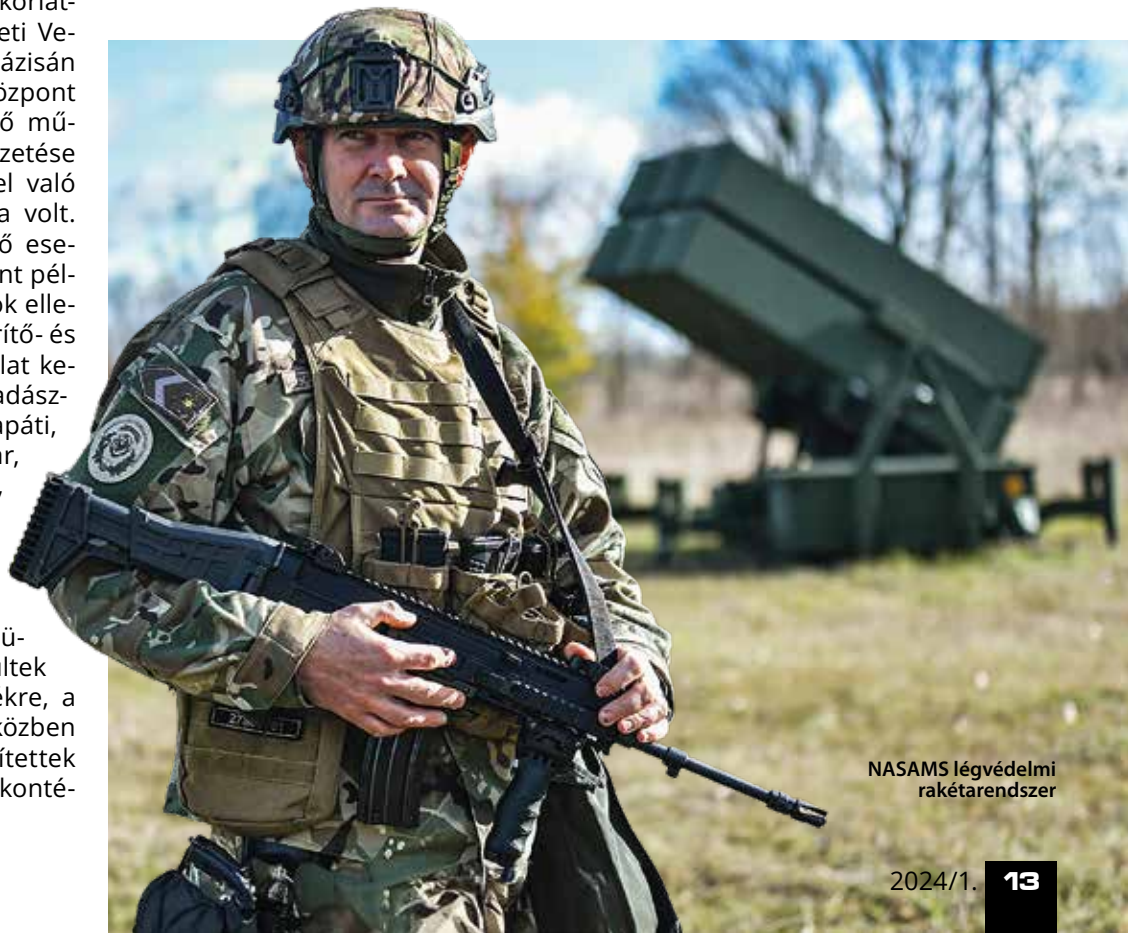
NASAMS légvédelmi rakétarendszer

Az „ELLENTŰZ” tüzér ellenőrző tüzérvezetési és éleslövészettel egybekötött rendszerbeállító gyakorlat során meg-