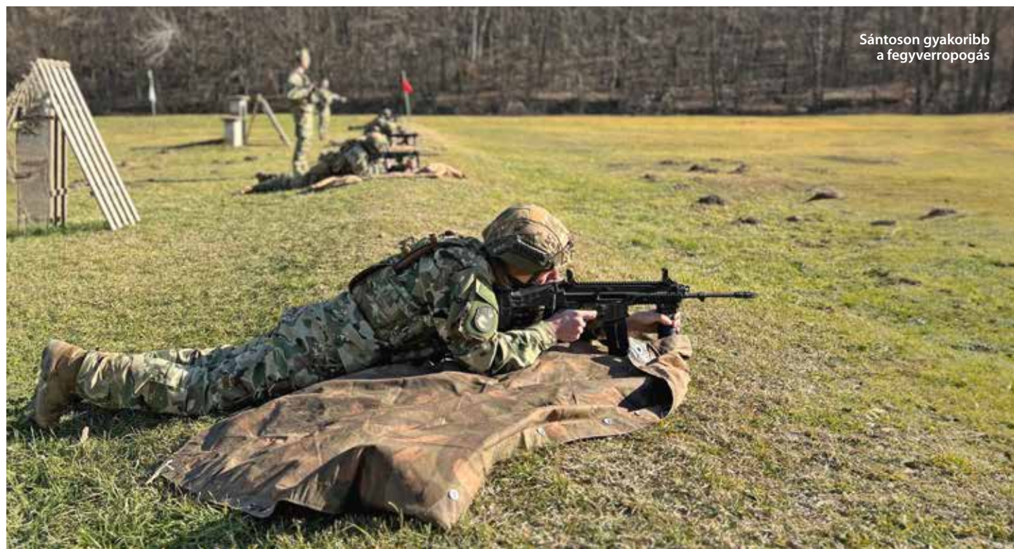
Sántoson gyakoribb a fegyverroppogás