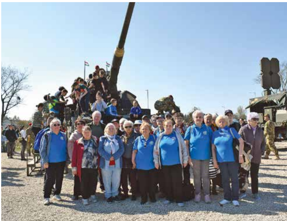
Látogatás a MH Klapka György 1. Páncélosdandárnál

A gondok között kettő kiemelt szerepet kapott. Az egyik: évek óta senki nem vállalta a szociális és kegyeleti ügyek intézését; a másik: az üdültetési lehetőségek rendkívüli beszűkülése a honvédségi üdülők számának csökkenésével függ össze.