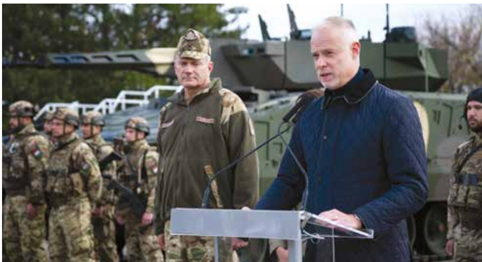
A honvédelmi miniszter Hódmezővásárhelyen

Forward Land Force Battlegroup: NATO FLF BG HUN) zászlóalj-harccsoportjának magyar, olasz és török állománya ejtőernyős ugrást hajtott végre a nyíregyházi repülőtéren. Olasz részről az ugrás végrehajtását követően Hajdúhadházon az MH Klapka György 1. Páncélosdandár katonáival együttesen szakharcászati foglalkozáson vettek részt, és éleslövészetet hajtottak végre.