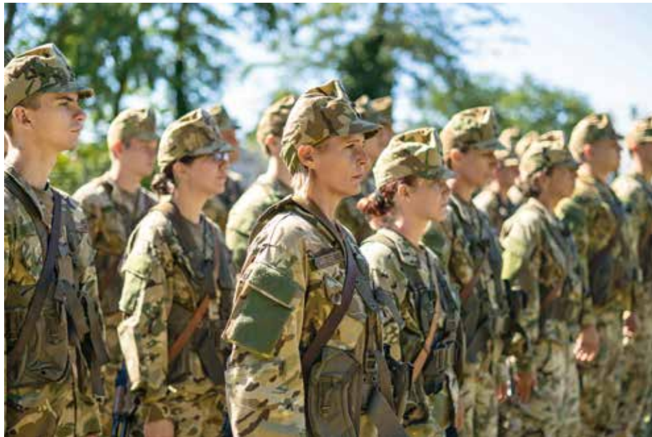
Egyre több fiatal vállalja a haza védelmét

Nekünk, ma szolgáló katonáknak is fontos, hogy önök, akik a Magyar Honvédség gondoskodási körébe tartoznak, az Obsitos olvasói is értesüljenek róla, milyen, talán soha nem látott fejlesztés indult el a közelmúltban, Somogy vármegyében!